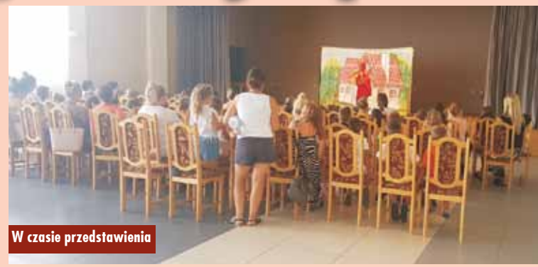
W czasie przedstawienia

W ramach wakacyjnych zajęć profilaktycznych grupa 45 dzieci z terenu gminy Perzów wzięła udział w jednodniowej wycieczce do Warszawy