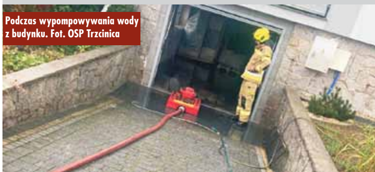
Podczas wypompowywania wody z budynku.

Pierwszą biografię zbrodniarki wojennej z obozu dla dzieci, która w PRL-u pracowała w żłobku zatytułowaną „Kat polskich dzieci opowieść o Eugenii Pol” napisał Błażej Torzański