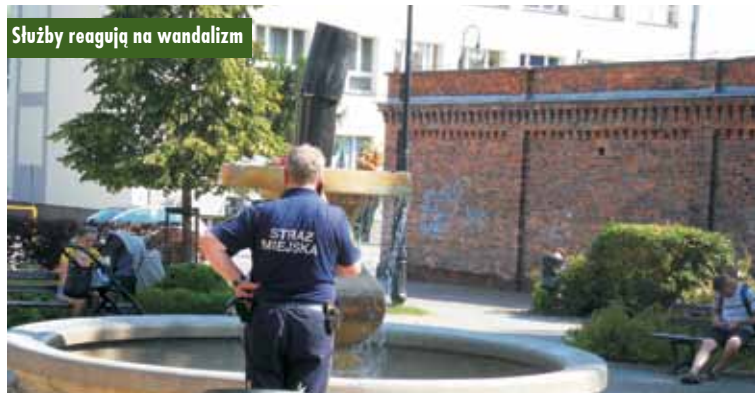
Służby reagują na wandalizm

Niestety, skwer nie jest monitorowany, stąd trudno będzie ustalić sprawców tego skandalicznego wybruku, chyba, że ktoś widział, co działo się nocą przy fontannie i poinformuje o tym policję. m