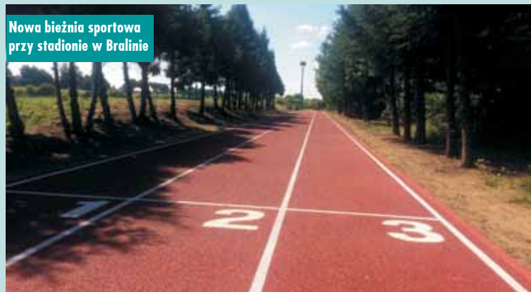
Nowa bieżnia sportowa przy stadionie w Bralinie

Zakończyła się modernizacja drogi gminnej w Taborze Wielkim