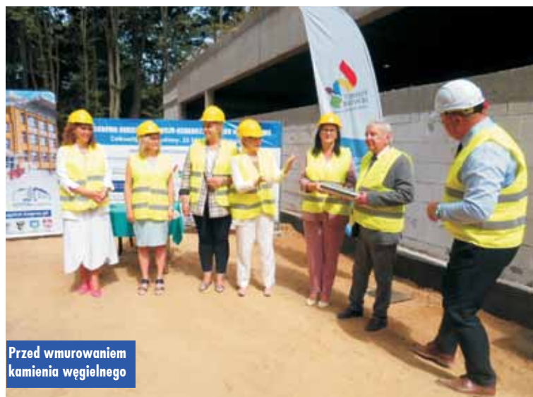
Przed wmurowaniem kamienia węgielnego

Nieopodal zabytkowego budynku Oddziału Lecznico-Rehabilita-