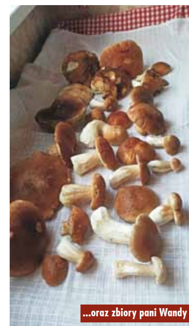
...oraz zbiory pani Wandy

W Polsce występuje kilkadziesiąt gatunków jadalnych grzybów.