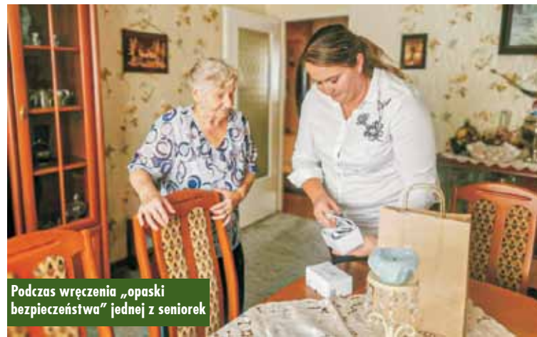
Podczas wręczenia „opasek bezpieczeństwa” jednej z seniorek