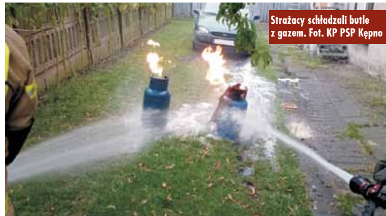
Strażacy schładzali butle z gazem.