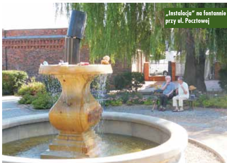
„Instalacja” na fontannie przy ul. Pocztowej

Tuż po obchodach święta Wojska Polskiego, 16 sierpnia br., idący do pracy mogli na Skwerze Pocztowym zobaczyć dziwną instalację na pulsującej wodą fontannie. Przy bliższej lustracji okazało się, że jakiś innowacyjny artyści umieścili na fontannie dwa wyrwane kosze na śmieci i obsypali całość odpadkami (plastycznymi butelkami, puszkami). Pierwszy strażnik