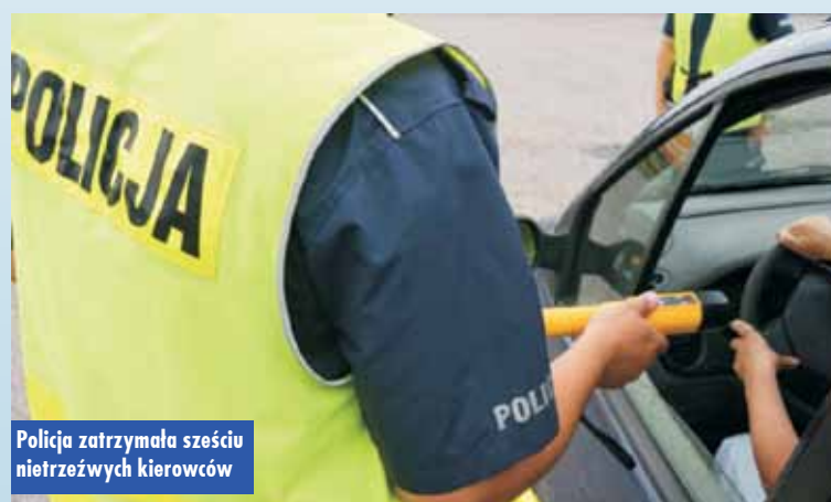
Policja zatrzymała sześciu nietrzeźwych kierowców

Również 14 sierpnia br., o godzinie 21.50, na ul. Radosnej w Kępnie policjanci Wydziału Ruchu Drogowego KPP Kępno zatrzymali 68-letniego mieszkańca Kępna, który kierował samochodem marki Peugeot, znajdując się w stanie nietrzeźwości. Badanie alkomatem wskazało promil alkoholu w wydychanym powietrzu.