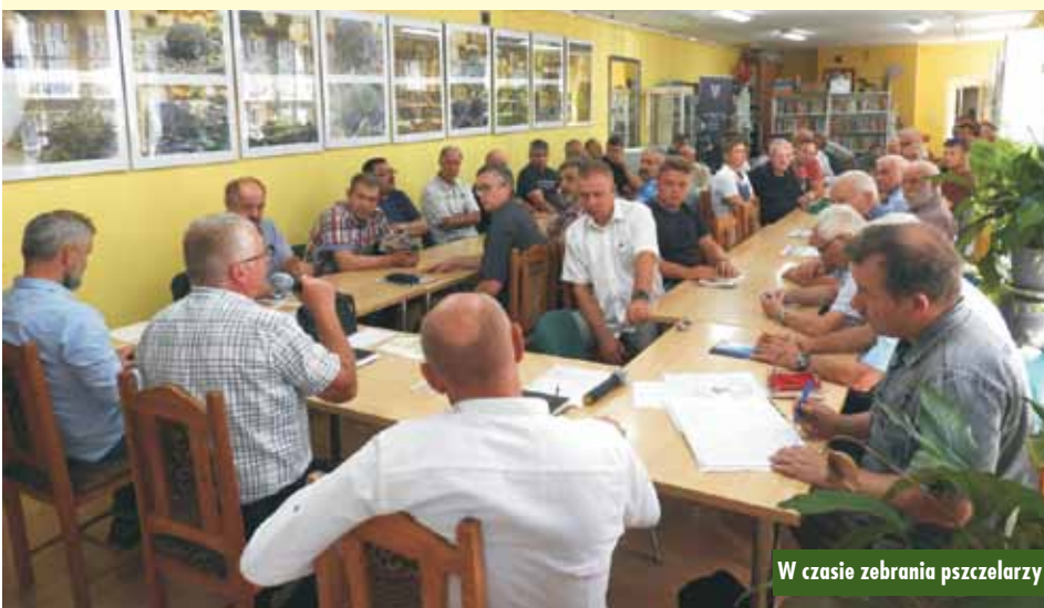
W czasie zebrania pszczelarzy