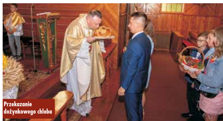
Przekazanie dożynekowego chleba

Program artystyczny zaprezentowali uczniowie Szkoły Podstawowej w Olszowie. Następnie na scenie zaprezentowały się kabarety „Sąsiadki” i „Malina”. Dla młodszego pokolenia