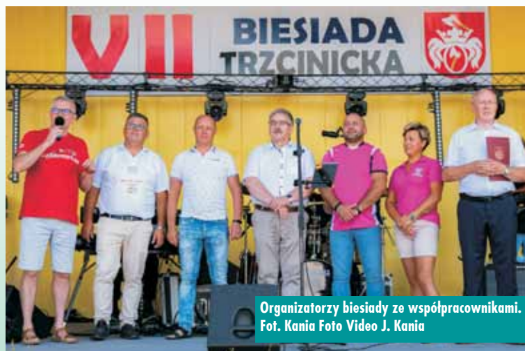
Organizatorzy biesiady ze współpracownikami.

dzieci i młodzież z Baranowskiego Studia Tańca przygotowanych przez Dariusza Baranowskiego . Wodzierem biesiady był, tryskający olbrzymią pozytywną energią, Piotr