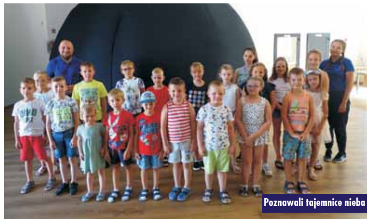
Poznawali tajemnice nieba