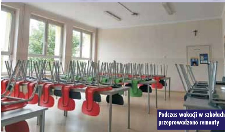
Podczas wakacji w szkołach przeprowadzono remonty

W Trębaczowie wymieniono wykładziny podłogowe w klasie I, IV oraz VII a także w stołówce szkolnej. Koszt wymiany wyniósł 33.210 zł. Odmalowano lamperię, ściany i sufit na korytarzu na górnym piętrze oraz ściany i sufit w kuchni szkolnej.