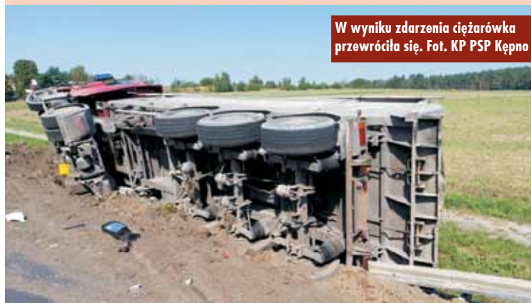
W wyniku zdarzenia ciężarówka przewróciła się.

- Działania strażaków polegały na zabezpieczeniu miejsca zdarzenia, następnie zabezpieczono wycieki płynów eksploatacyjnych. Jeden pojazd przewoził masę asfaltową, którą przeładowano na pojazd zastępczy. Po zakończeniu czynności dochodzeniowych policji udrożniono ruch na trasie – poinformował oficer prasowy KP PSP Kępno, kpt. Paweł Michalski . Oprac. KR