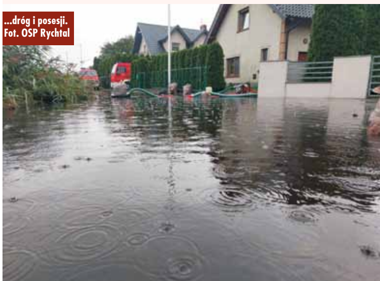
...dróg i posesji.

Władze starostwa gratulowały pracownikom Powiatowego Urzędu Pracy sukcesów w zatrudnieniu na lokalnym rynku pracy