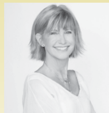
Olivia Newton-John.

Jako nastolatka występowała w kafejkach Melbourne. Po powrocie do Anglii w 1974 r. brała udział w konkursie Eurowizji. Następnie wyjechała do