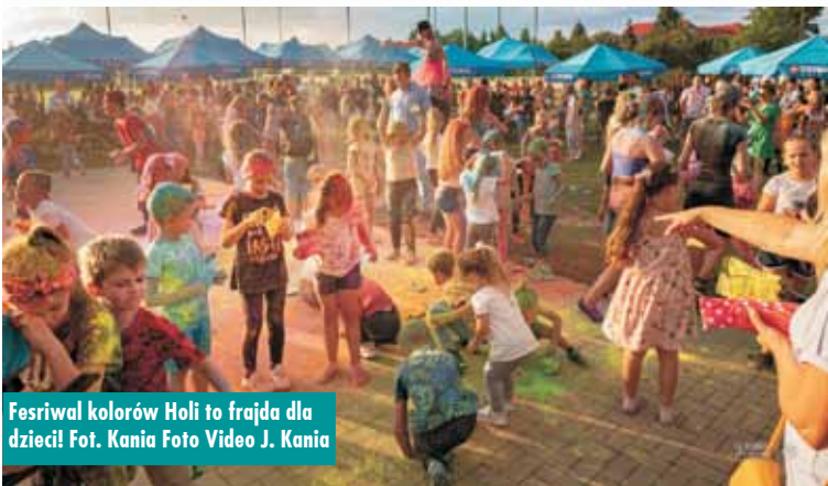
Festiwal kolorów Holi to frajda dla dzieci!