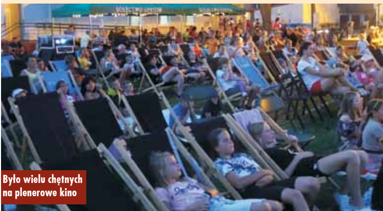
Było wielu chętnych na plenerowe kino