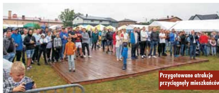
Przygotowane atrakcje przyciągnęły mieszkańców

busa z biskupem wrocławskim Tomaszem II. Skutkiem konfliktu było odebranie majątku biskupowi, w tym Bandlowice. Wkrótce nastąpiło pojednanie między biskupem Tomaszem II a księciem Henrykiem IV Probussem – mediatorem był biskup Jakub Świnika. Biskup Tomasz II odzyskał Bandlowice. W 1294 r. książęta wrocławscy, Henryk Głogowski i Henryk V Brzuchaty, potwierdzili w specjalnej metryce fakt, że Bandlowice i Rychtal są własnością biskupa Tomasza II. Metryka jest bardzo ważnym dokumentem, gdyż po raz pierwszy napa-