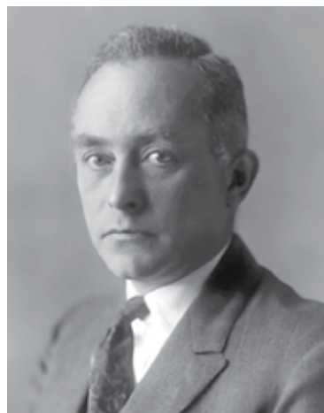
Max Born.