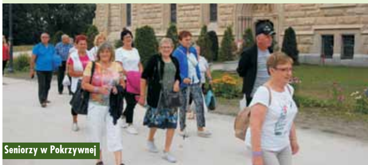
Seniorzy w Pokrzywnie

16 sierpnia 2022 r. Gminna Biblioteka Publiczna w Łęce Opatowskiej z siedzibą w Opatowie zaprosiła dzieci i młodzież do Mobilnego Planetarium