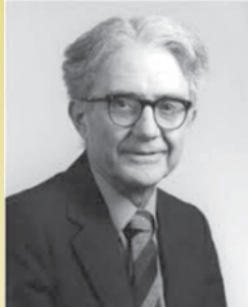
Gustaw Wiktor Rudolf Born.

Uczył się w Oberrealschule, Getyndze. Po przeprowadzce do Wielkiej Brytanii z ojcem, uczęszczał do