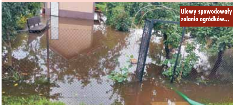
Ulewy spowodowały zalania ogródków...

Jednym ze zdarzeń, które wymagało użycia dużej ilości sił i środków, było przepełnienie oraz przełanie stawu zlokalizowanego przy drodze krajowej nr 39 w Rychtalu. - W wyniku intensywnych opadów deszczu doszło do przełania stawu, a w konsekwencji – zalewania pobliskich posesji oraz drogi krajowej nr 39. W szczytowym momencie na drodze zalegało około 0,4 m wody. Działania