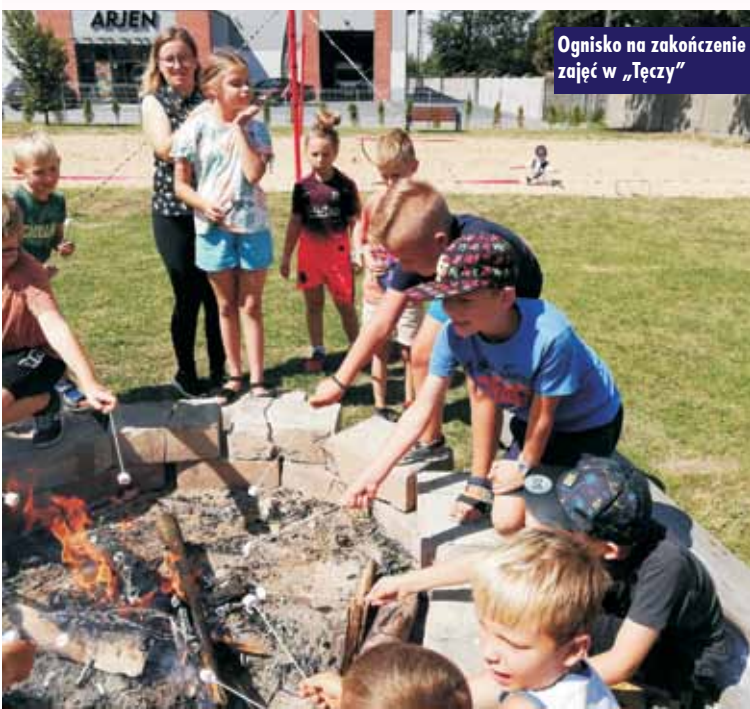
Ognisko na zakończenie zajęć w „Tęczy”

5 sierpnia 2022 r. na placu przy Bibliotece w Opatowie odbyła się plenerowa impreza integracyjna w ramach zadania „Nauka, kultura, rozrywka – to lubię w mojej bibliotece!” sfinansowanego ze środków Fundacji PZU