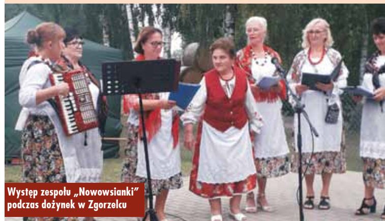
Występ zespołu „Nowowsiarki” podczas dożynek w Zgorzelcu

około 100 osób. Jest tam też kuchenny segment. To w tym miejscu odbywają się wszelkie imprezy, które przeważnie organizuje sołtys. Odbywają się też imprezy w skali gminnej czy nawet powiatowej. I tam właśnie mieszkańcy i goście zebrali się, aby wspólnie obchodzić święto plonów i rocznicę.