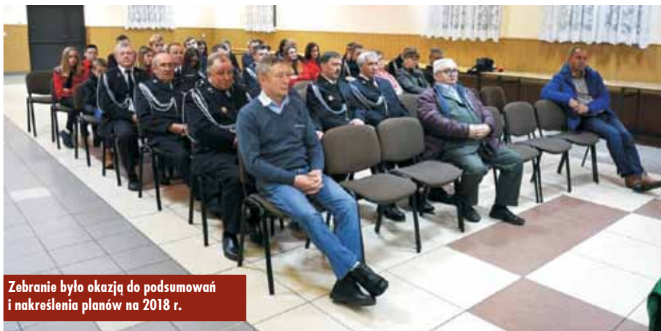
Zebranie było okazją do podsumowań i nakreślenia planów na 2018 r.