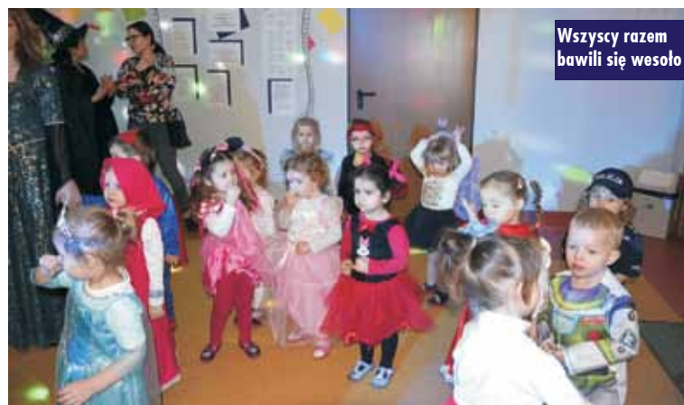
Wszyscy razem bawili się wesoło

W czwartek, 8 lutego br., w Przedszkolu Samorządowym nr 2 w Kępnie odbył się Karnawałowy Bal Przebierańców. Tego dnia wszystkie dzieci – chłopcy i dziewczynki, młodszy i starsi, przedszkolaki i dzieci ze Żłobka – wszyscy razem bawili się wesoło na przedszkolnym holu, który z tej okazji został specjalnie przystrojony. Dzięki dekoracjom, balonikom i kolorowym światełkom zamienił się on w magiczną salę balową. Zabawę poprowadził DJ-wodzirej, który zadbał o taneczną muzykę oraz poprowadził kilka zabaw ruchowych, w których wszyscy chętnie brali udział. Dzieci i panie były tego dnia nie do poznania, gdyż każdy postarał się o karnawałowe przebranie. Hol wypełnił się książniczkami, wiedźmami, wróżkami, piratami, policjantami, strażakami, superbohaterami, sportowcami, zwierzątkami, postaciami z bajek i mnóstwem innych, zabawnych, wyjątkowych postaci. Nie zabrakło także pysznego poczęstunku dla wszystkich, w tym oczywiście pączków, z okazji Tłustego Czwartku. Wesoło minął ten dzień! Aż żal było kończyć kolorową zabawę.