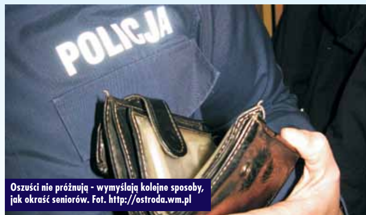
Oszuści nie próżnują - wymyślają kolejne sposoby, jak okraść seniorów.

Co zrobić, gdy ktoś obcy zapuka do drzwi? Nie wpuszczać obcych osób do domu, nie przekazywać pieniędzy obcym osobom, a w razie wątpliwości poinformować pilnie policję o każdej podejrzaną osobie. Pamiętajmy, że nie każdy, kto dzwoni lub puka do drzwi, ma uczciwe zamiary