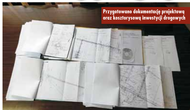
Przygotowano dokumentację projektową oraz kosztorysową inwestycji drogowych

W 2018 roku wybudowane mają zostać: droga Wodziezna - Kuźnica Trzcinińska - etap końcowy, Piotrówka w kierunku Kępna - etap końcowy (udało się uzyskać pozytywną opinię i uzgodnić zjazd na drogę krajową nr 39). Ponadto powstanie ulica Młyńska w Trzcinicy oraz Czeresińska w Laskach. Gmina aplikuje o dofinansowanie tych inwestycji środkami finansowanymi przyznawanymi przez Urząd Marszałkowski Województwa Wielkopolskiego.