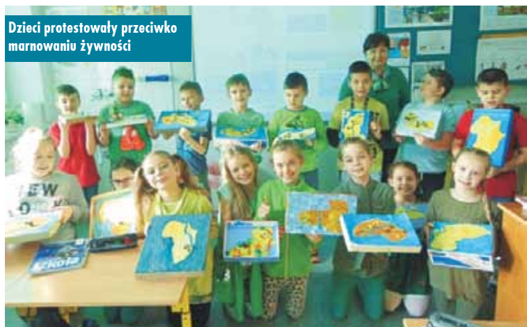
Dzieci protestowały przeciwko marnowaniu żywności

W ramach akcji od poniedziałku, 29 stycznia, do piątku, 2 lutego br., na lekcjach: przyrody, języka angielskiego, wychowawczych oraz w świetlicy środowiskowej prowadzone były zajęcia dotyczące szanowania żywności i segregowania śmieci.