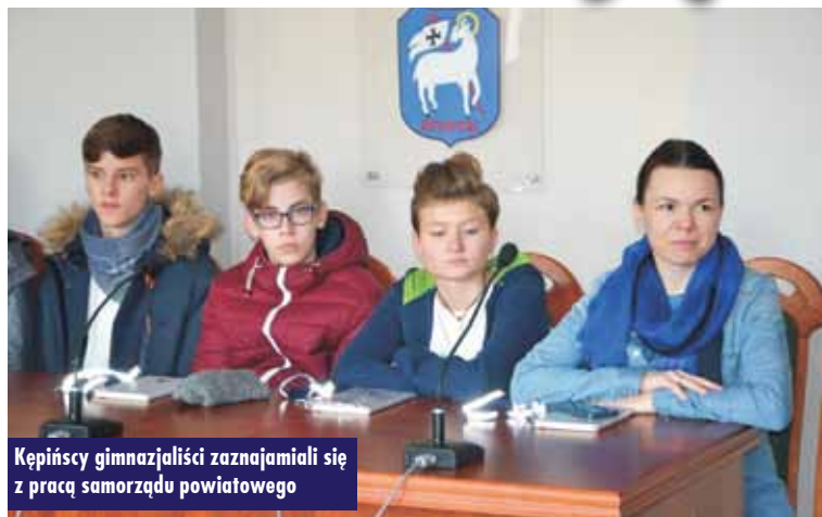
Kępińscy gimnazjaliści zaznajamiali się z pracą samorządu powiatowego