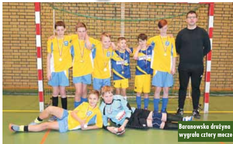
Baranowska drużyna wygrała cztery mecze