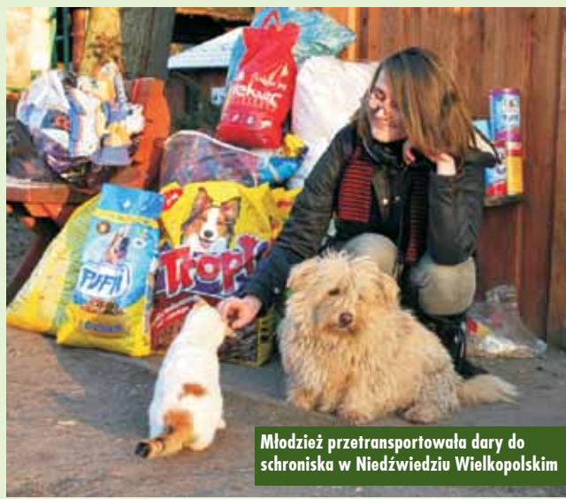
Młodzież przetransportowała dary do schroniska w Niedźwiedziu Wielkopolskim