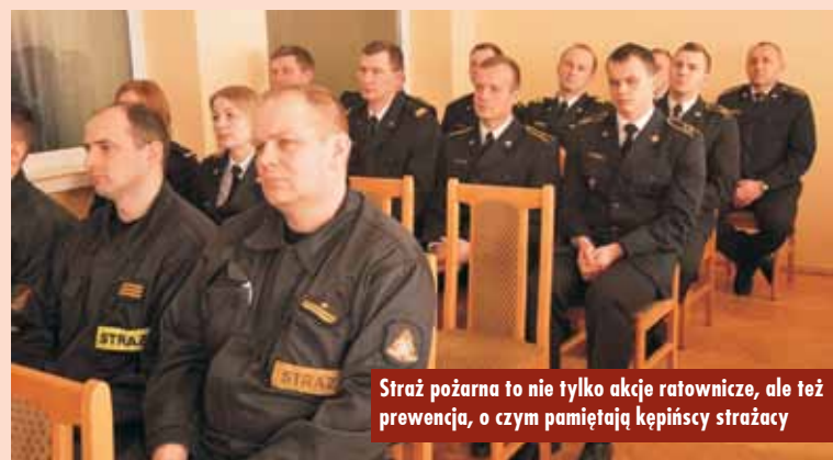
Straż pożarna to nie tylko akcje ratownicze, ale też prewencja, o czym pamiętają kępińscy strażacy

Spośród 12 jednostek Ochotniczych Straży Pożarnych z terenu