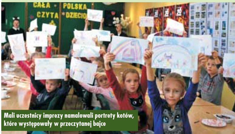
Mali uczestnicy imprezy namalowali portrety kotów, które występowały w przeczytanej bajce