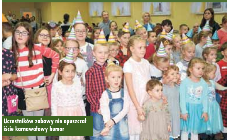
Uczestników zabawy nie opuszczał istic karnawałowy humor

4 lutego br. w Sali Wiejskiej w Trębaczowie odbyła się zabawa karnawałowa zorganizowana przez Zespół Szkół w Trębaczowie, Radę Rodziców oraz Towarzystwo Sympatyków Trębaczowa. W organizację imprezy już po raz drugi włączyła się Biblioteka Publiczna w Perzowie, za-