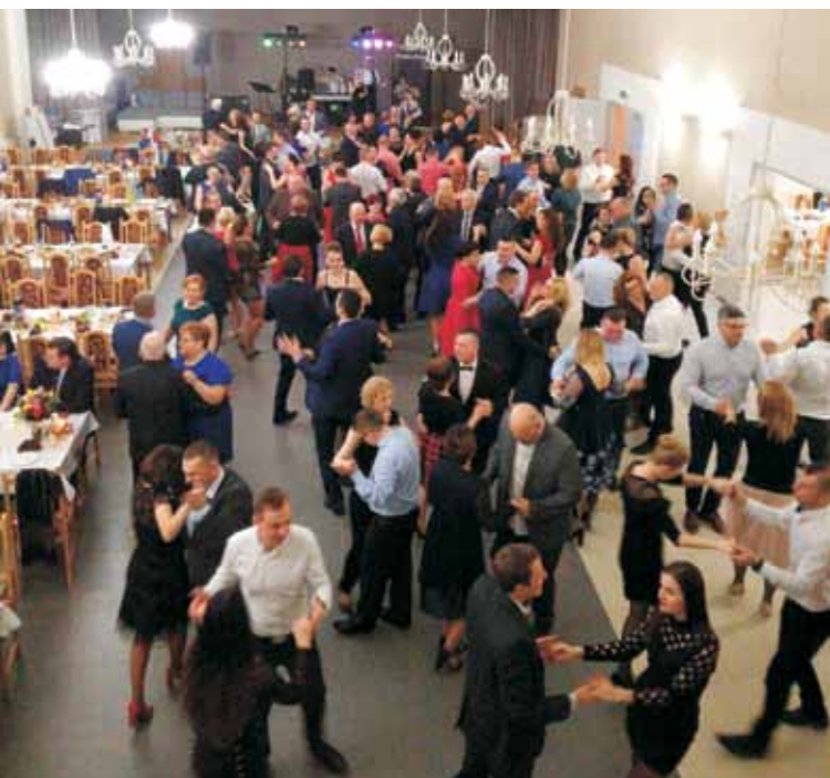
Dochód z balu przeznaczony jest na stypendia dla najzdolniejszych uczniów oraz na działania statutowe Towarzystwa Rozwoju Gminy Perzów