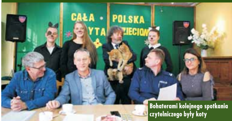
Bohaterami kolejnego spotkania czytelniczego były koty

7 lutego 2018 r. w Powiatowej Bibliotece Publicznej w Kępnie odbyła się kolejna impreza czytelnicza dla dzieci z kępińskich przedszkoli zorganizowana w ramach akcji „Cała Polska czyta dzieciom”. Tym razem jej bohaterem był kot - ten prawdziwy i ten literacki.