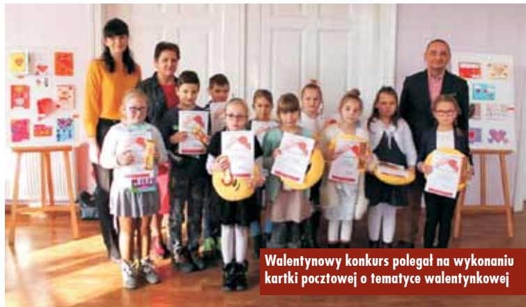
Walentynkowy konkurs polegał na wykonaniu kartki pocztowej o tematyce walentynkowej