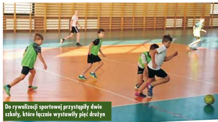
Do rywalizacji sportowej przystąpiły dwie szkoły, które łącznie wystawiły pięć drużyn