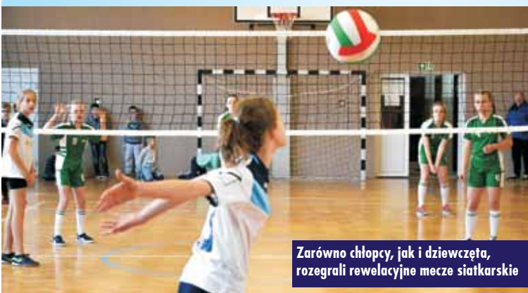
Zarówno chłopcy, jak i dziewczęta, rozegrali rewelacyjne mecze siatkarskie

Zawody miały niezwykle oprawę. Siatkarki i siatkarzy niósł do walki wspaniały kibicowski doping, a w trakcie dekoracji długo nie milkły brawa, którymi widzowie – uczniowie szkoły w Łęce – dziękowali zawodnikom za wspaniałe widowisko. Wierzymy, że nie inaczej będzie również za miesiąc. W półfinałach po raz pierwszy w historii wystąpią dwie drużyny reprezentujące gminę Baranów. es