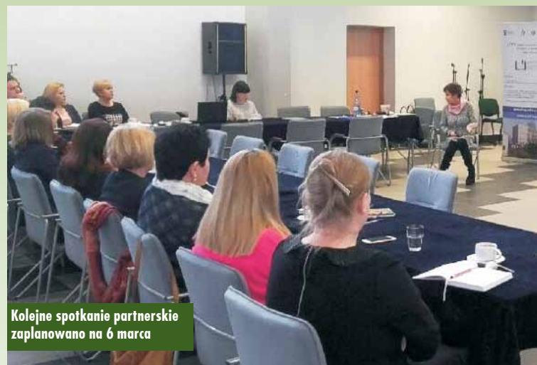
Kolejne spotkanie partnerskie zaplanowano na 6 marca

Już niebawem rozstrzygnie się, kogo Komendant Wojewódzkiej Policji w Poznaniu powoła do pełnienia obowiązków Komendanta Policji w Kępnie