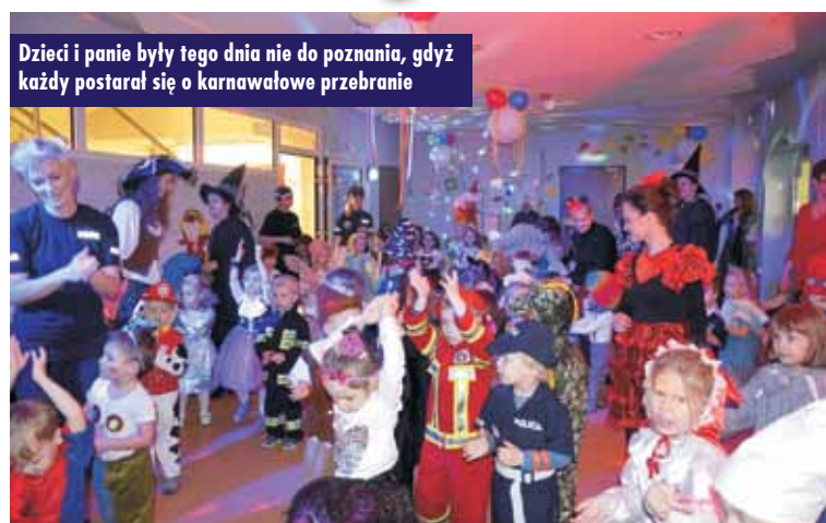
Dzieci i panie były tego dnia nie do poznania, gdyż każdy postarał się o karnawałowe przebranie