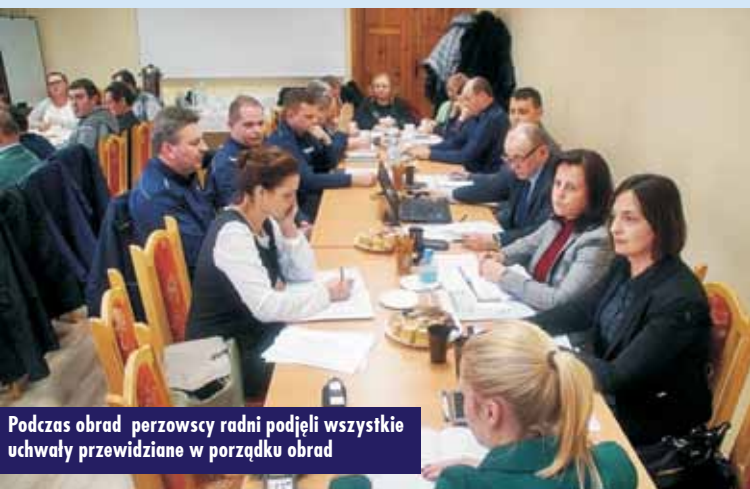
Podczas obrad perzowscy radni podjęli wszystkie uchwały przewidziane w porządku obrad

Podjęta została uchwała w sprawie przyjęcia planu dofinansowania form doskonalenia zawodowego nauczycieli zatrudnionych w placówkach oświatowych prowadzonych przez Gminę Perzów, określenia maksymalnej kwoty dofinansowania opłat pobieranych przez szkoły wyższe i zakłady kształcenia nauczycieli oraz specjalności i formy kształcenia,