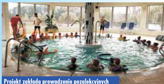
Projekt zakłada prowadzenie pozalekcyjnych zajęć nauki pływania od września 2018 r.

Operatorem zadania jest Wielkopolskie Zrzeszenie Ludowe Zespoły Sportowe z Poznania, a zajęcia dla uczniów z Zespołu Szkół w Laskach i Zespołu Szkół w