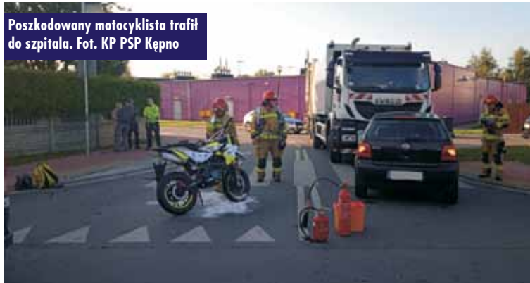
Poszkodowany motocyklista trafił do szpitala.

W akcji ratowniczej, trwającej 50 minut, udział wzięły dwa zastępy straży pożarnej. Oprac. KR