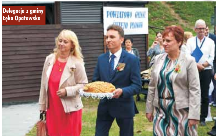
Delegacja z gminy Łęka Opatowska

Tradycyjnie, jak co roku, początek września jest czasem, w którym rolnicy z całego powiatu podsumowują coroczne zbiory. W niedzielę, 11 września br., na boisku sportowym w Perzowie odbyły się Dożynki Powiatowo-Gminne, których organizatorami byli: Starostwo Powiatowe w Kępnie oraz Gmina Perzów.