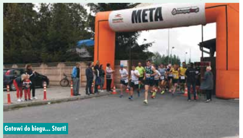
Gotowi do biegu... Start!

Dla zwycięzców w różnych kategoriach wiekowych przygotowano również pamiątkowe puchary. Zgodnie z regulaminem biegu statuetki