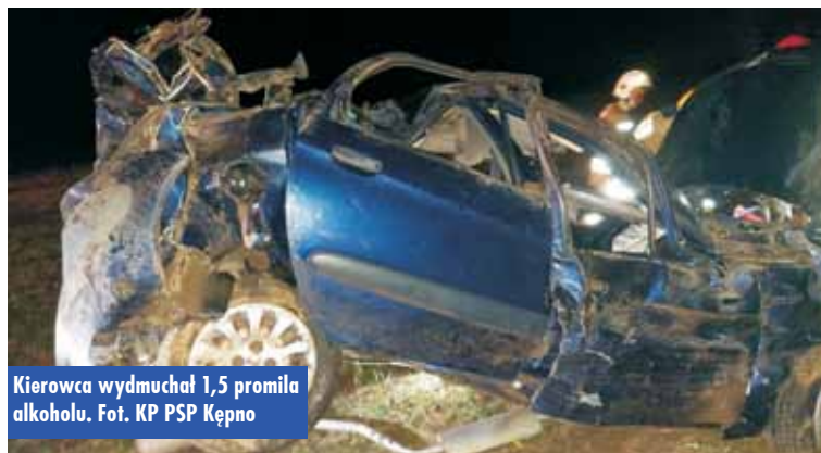
Kierowca wydmuchal 1,5 promila alkoholu.

Po dotarciu na miejsce stwierdzono, że doszło do dachowania samochodu osobowego, który uderzył w ogrodzenie posesji. Kierowca pojazdu opuścił miejsce zdarzenia przed przybyciem służb.