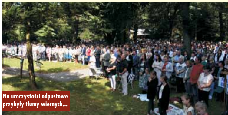
Na uroczystości odpustowe przybyły tłumy wiernych...