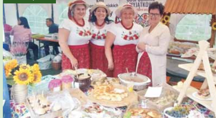
Przedstawicielki KGW ze swoimi wyrobami