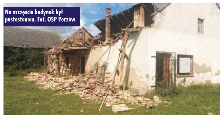
Na szczęście budynek był pustostanem.