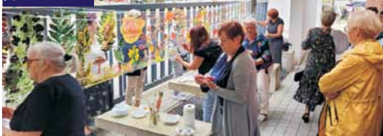
...i wspólnie tworzyli piękne dzieła

Modernizacja oświetlenia ulicznego w Bralinie