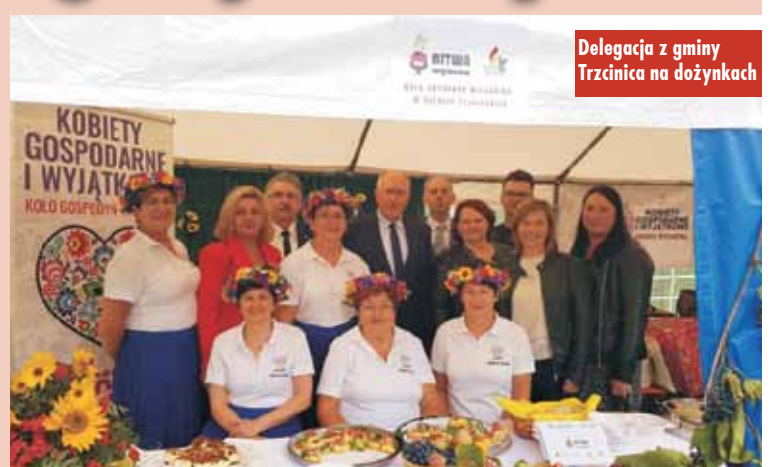
Delegacja z gminy Trzcinica na dożynkach