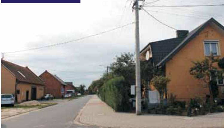
W 2022 r. wymienione zostaną 63 oprawy oświetleniowe

Drodzy Czytelnicy, „Tygodnik Kępiński” można znaleźć także w internecie. Serdecznie zapraszamy na stronę www.tygodnikkepinski.pl oraz na Facebook pod adres www.facebook.com/tygodnikkepinski