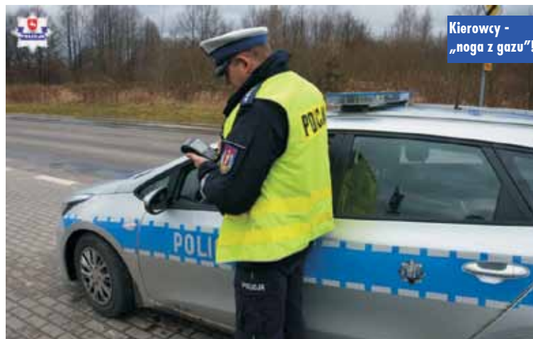
Kierowcy - „noga z gazu”!

W miniony weekend (sobota, niedziela), gdy obowiązywały już nowe taryfikatory mandatowe, w ruchu drogowym kępińscy policjanci w powiecie wystawili 39 mandatów. Najczęstszym wykroczeniem było