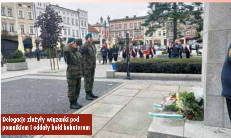
Delegacje złożyły wiązanki pod pomnikiem i oddały hołd bohaterom

Wsparcie z Gminy Kępno na „Zakup lekkiego samochodu operacyjnego dla Komendy Powiatowej Państwowej Straży Pożarnej w Kępnie”