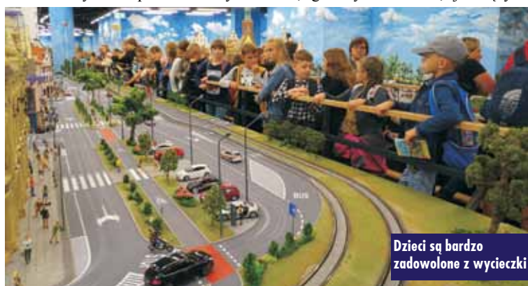
Dzieci są bardzo zadowolone z wycieczki

Po zwiedzeniu ekspozycji Kolejkowa, uczestnicy wycieczki udali się na warsztaty modelarskie, gdzie pod okiem instruktorki wykonali miniaturowe kamienice. Każdy uczestnik warsztatów otrzymał pamiątkowy Dyplom Młodego Modelarza. Oprac. m