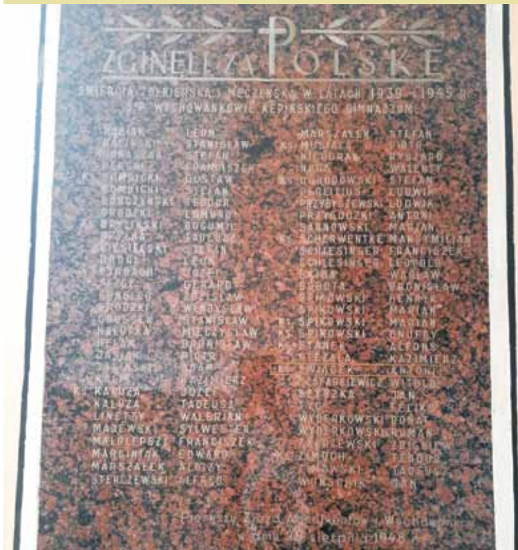
Zginęli za Polskę śmiercią żołnierską i męczeńską w latach 1939-1945 r.: śp. wychowankowie kępińskiego Gimnazjum: