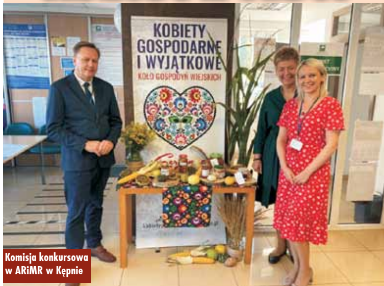
Komisja konkursowa w ARiMR w Kępnie