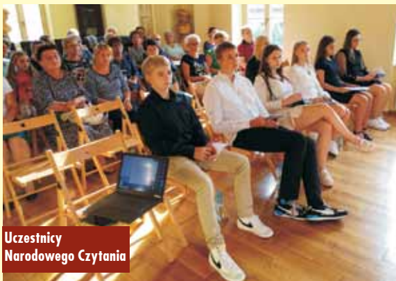
Uczestnicy Narodowego Czytania

radników, a wzory i pomysły czerpie z Internetu i gazet. Po raz pierwszy miała okazję zaprezentować swoje prace szerszej publiczności.