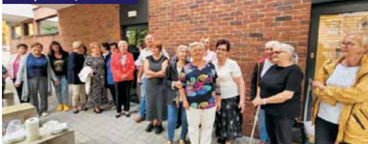
Seniorzy bawili się znakomicie...

14 września br. seniorzy z Klubu „Senior+” w Bralinie spotkali się z członkami Całodziennego Klubu Seniora „Pod Żurawiem” w Kępnie. Spotkanie, które odbyło się w siedzibie kępińskiego Klubu, było okazją do integracji i wspólnego biesiadowania.