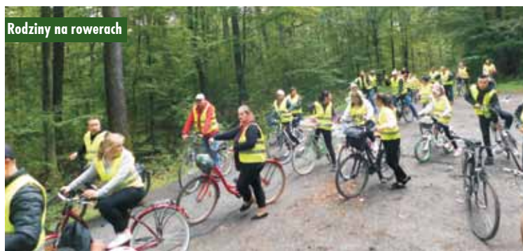
Rodziny na rowerach

11 września 2022 r. odbyły się dożynki powiatowe w Perzowie