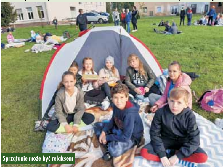
Sprzątanie może być relaksem

kawostki nt. zagospodarowania odpadów. Przedstawiciele ZZO przypominali zasady prawidłowej segregacji odpadów, informowali o funkcjonującej instalacji komunalnej w Olszowie. Dla najmłodszych uczestników wydarzenia zapewniono zabawy edukacyjne, takie jak: zmniejszanie objętości butelek z tworzyw sztucznych