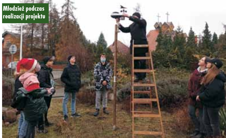
Młodzież podczas realizacji projektu