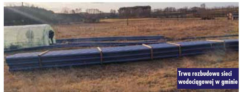
Trwa rozbudowa sieci wodociągowej w gminie

podniesienia poziomu życia mieszkańców. Oprac. KR