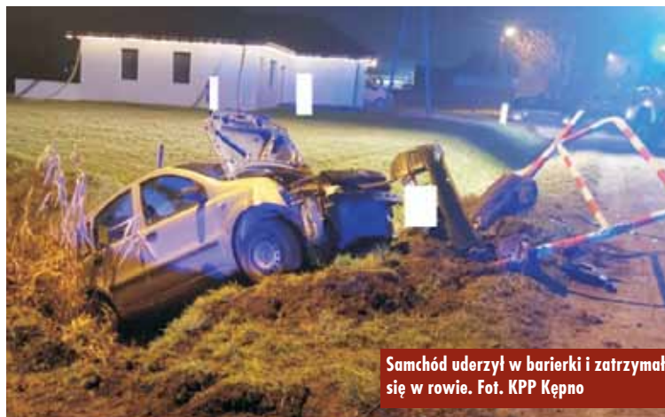
Samochód uderzył w barierki i zatrzymał się w rowie.

Policji w Kępnie otrzymał informacje o zdarzeniu drogowym, do którego