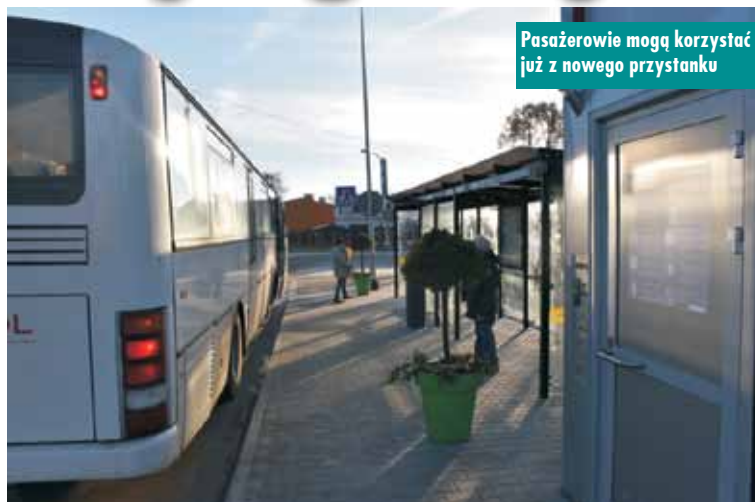
Pasażerowie mogą korzystać już z nowego przystanku

Gmina Kępno zakończyła budowę przystanku w rejonie Dworca Zachodniego w Kępnie.