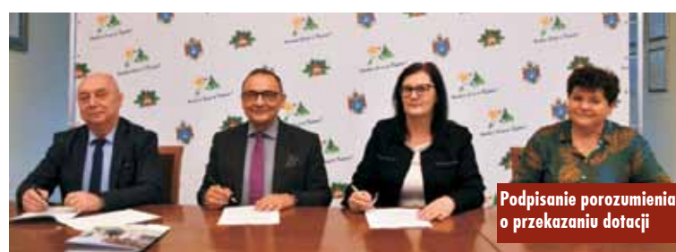
Podpisanie porozumienia o przekazaniu dotacji

Uczniowie Szkoły Podstawowej im. Janusza Kusocińskiego w Hanulinie zrealizowali nowatorski podprojekt edukacyjny „Cyfrowa mapa dorzecza Warty”