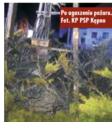
Po ugaszeniu pożaru.