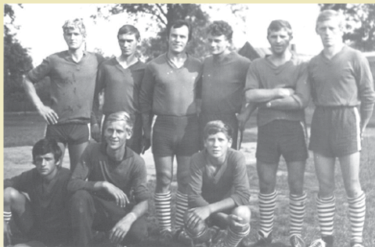
LZS Grębanin, lata 60. i 70.

Ale mimo tych wszystkich bolączek to właśnie z Grębanina lokalne, i nie tylko lokalne, piłkarskie kluby zasilane były przez chłopaków utalentowanych sportowo. Wspomnieć w tym miejscu należy kluby z niedalekiego Kępna, Jankowich, Wielunia czy też dalej położonych – Wałbrzycha i Gdyni. Z początkiem lat osiemdziesiątych doszło do fuzji z KKS Kępno, wówczas Grębanin występował pod firmą kępińskiego klubu jako druga drużyna.