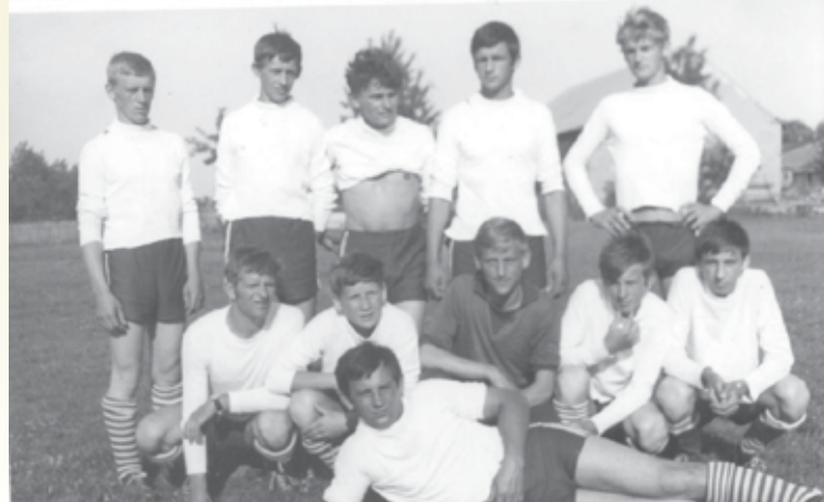
LZS Grębanin, lata 70.