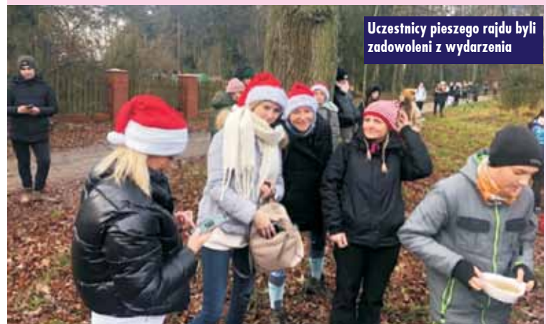
Uczestnicy pieszego rajdu byli zadowoleni z wydarzenia