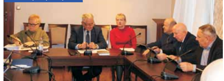
Podczas sesji Rady Gminy Bralin