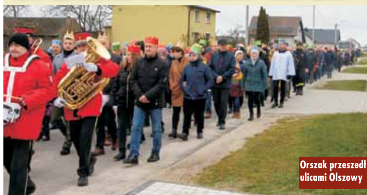
Orszak przeszedł ulicami Olszowy

Wierni nie tylko z Olszowy przy akompaniamencie Miejskiej Orkiestry Dętej z Ostrzeszowa w barwnym pochodzie przemaszewali spod kościoła parafialnego pw. Świętej Jadwigi Śląskiej ulicami: Granitową, Szmaragdową, Brylantową, Perłową, Diamentową, Kryształową. Każdy z uczestników otrzymał śpiewnik oraz koronę, by poczuć się, jak król. Wspólnie koładowano w radosnym nastroju wraz z Trzema Królami, by złożyć pokłon nowo narodzonemu dzieciątku.