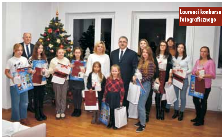
Laureaci konkursu fotograficznego

Zawarto porozumienie między Gminą Trzcinica a Powiatem Kępińskim