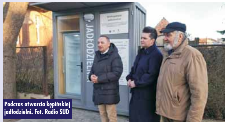
Podczas otwarcia kępińskiej jadalnielni.

- Jadalnielnie, jako jedna z form niesienia wzajemnej pomocy wśród mieszkańców, są alternatywą dla osób potrzebujących pomocy w trudnej sytuacji życiowej, nie korzystających z innych form wsparcia. Dzięki obecności jadalnielni zwiększona zostaje świadomość na