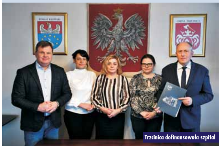
Trzcinica dofinansowała szpital