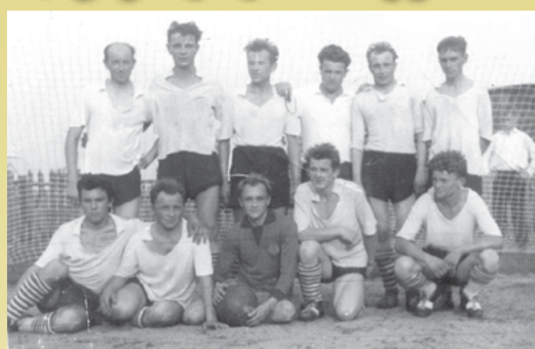
LZS Grębanin, przełom lat 40. i 50.