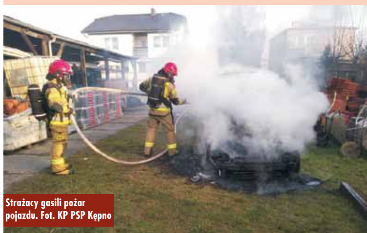
Strażacy gasili pożar pojazdu.

1 stycznia br., tuż przed godziną 9.00, do Stanowiska Kierowania Komendanta Powiatowego Państwowej Straży Pożarnej w Kępnie wpłynę-