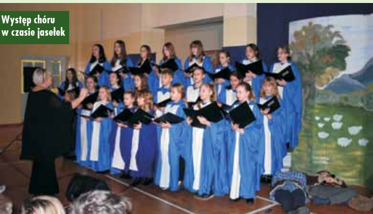
Występ chóru w czasie jasełek

riusz Buczek na zakończenie uroczystości pogratulowali uczniom pięknego występu oraz złożyli wszystkim noworoczne życzenia.