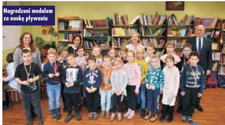
Nagrodzeni medalem za naukę pływania

Noworoczne spotkanie Stowarzyszenia Wsi Trzcinica „Przyszłość”