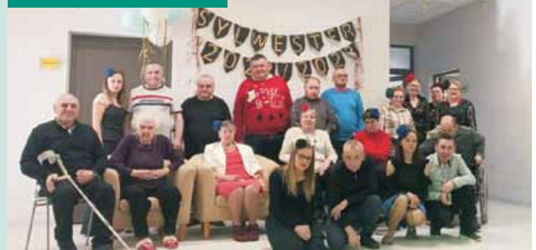
Uczestnicy zajęć w Centrum Opiekuńczo-Mieszkalnym w Opatowie