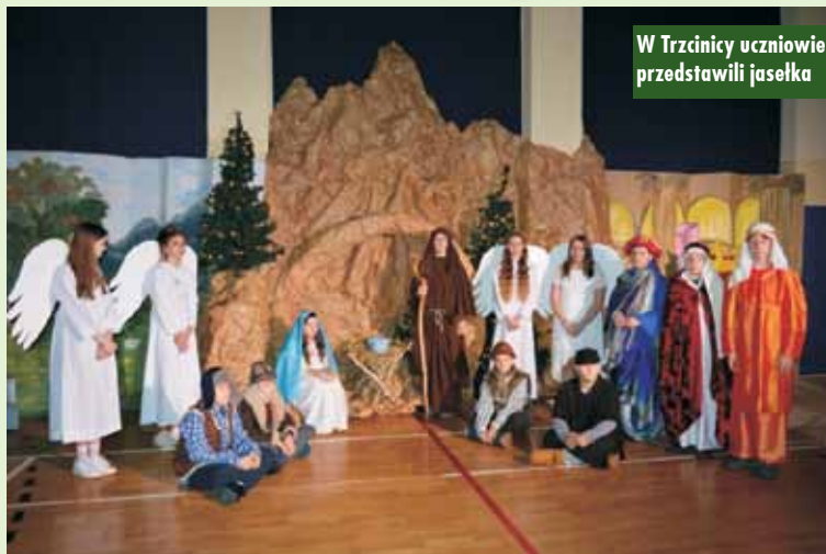
W Trzcinicy uczniowie przedstawili jasełka