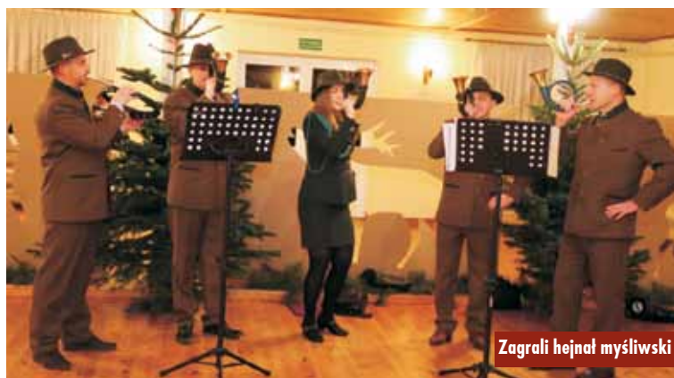
Zagrali hejnał myśliwski

Pożar przy hali produkcyjno-magazynowej w Ostrówc