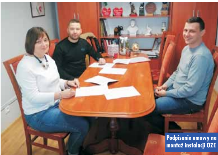
Podpisanie umowy na montaż instalacji OZE