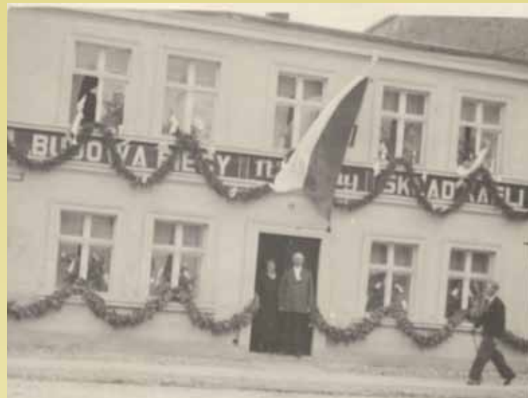
Kępno, ul. Wawrzyniaka 1 (lata 20. XX w.), gdzie mieściła się siedziba firmy W. Cichego

r. do armii pruskiej. Służy w oddziałach interwencyjnych i brał udział w bitwach na terenie Łotwy, w okolicach Rygi. Następnie przerzucono ich na front południowy do Włoch. Brał udział w bitwach pod Monte Tomba, Monte Stella, Monte Grapa, w takiej kolejności dziadek wymieniał te szczyty czy miejscowości. 13 marca 1918 r. został ciężko ranny w łydękę na terenie Francji. Przewieziono go do polowego lazaretu w miejscowości Cugny. Były to działania na froncie zachodnim. Aby przedłużyć pobyt w szpitalu, a tym samym opóźnić ponowny powrót na front, rekonwalescenci sypali sobie sól w rany, przy cichym przyzwoleniu pielęgniarek. Wojna chyliła się ku końcowi. Udało mi się zdobyć dokument, mówiący o tym, że dziadek, 12.12.1918 r., przebywał w rezerwowym lazarecie w Berlinie Charlottenburgu na zapalenie płuc. Po opuszczeniu szpitala został urlopowany i 14 lutego 1919 r. oddelegowany do komendantury okręgowej w Ostrowie Wielkopolskim. Po zakończeniu wojny pozostał u brata w Berlinie, któremu udało się uniknąć udziału w wojnie, gdyż regularnie