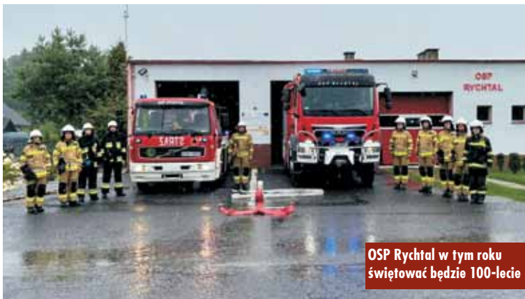
OSP Rychtal w tym roku świętować będzie 100-lecie

Drodzy Czytelnicy, „Tygodnik Kępiński” można znaleźć także w internecie. Serdecznie zapraszamy na stronę www.tygodnikkepinski.pl oraz na Facebook pod adres www.facebook.com/tygodnikkepinski