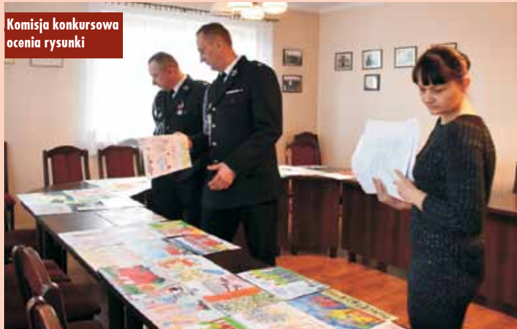
Komisja konkursowa ocenia rysunki

Prace zostały przekazane do KP PSP w Kępnie, gdzie odbędą się eliminacje powiatowe konkursu. Oprac. m