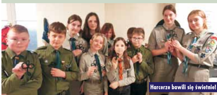
Harcerze bawili się świetnie!

XXV Ogólnopolski Ranking Liceów i Techników „Perspektywy 2023”