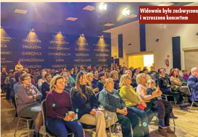
Widownia była zachwycona i wzruszona koncertem