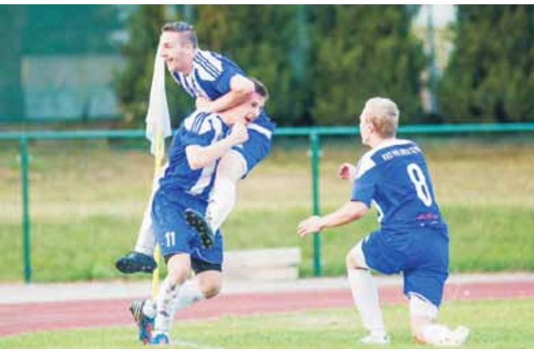
Po jedenastu latach Polonia Kępno wróciła do czwartej ligi w wielkim stylu, nie siedząc cicho, jak na beniaminka bez większego kapitału przystało, tylko rozpychając się lokciami.

Czerwona kartka: Szymon Szymański - 90+4' (LKS Ślesin). Sędziował: Paweł Kaczała (Pleszew).