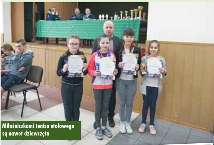
Miłośniczkami tenisa stołowego są nawet dziewczęta