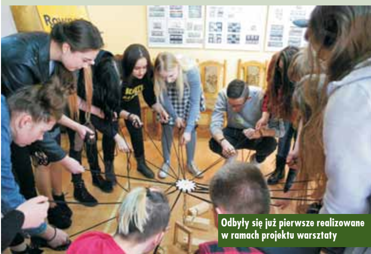
Odbyły się już pierwsze realizowane w ramach projektu warsztaty

Tym razem tematem przewodnim młodzieżowych działań będzie kultura fantasy. Uczestnicy na warsztatach szycia stworzą specjalne stroje w klimacie fantasy, które posłużą im do przeprowadzenia działań w przestrzeni miejskiej Kępna.