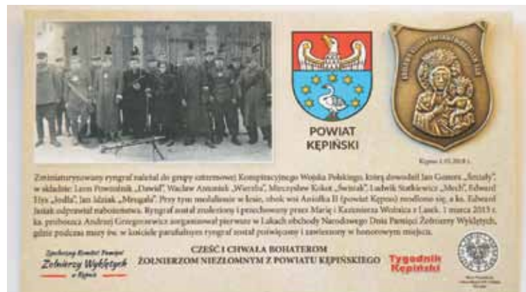
Miniaturowana kopia znajdującego ryngrafu wybita przez organizatorów tegorocznych obchodów Narodowego Dnia Pamięci Żołnierzy Wyklętych

M. Woźnica tłumaczy, że ryngraf przez lata leżał w szufladzie. - Partyzanci nie mieli wśród ludności miejscowej dobrej sławy w tym czasie, tak że myśmy się z tym specjalnie nie afiszowali – przyznaje, dodając, że jako osoba zainteresowana przeszłością regionu doskonale wie, jak trudny i