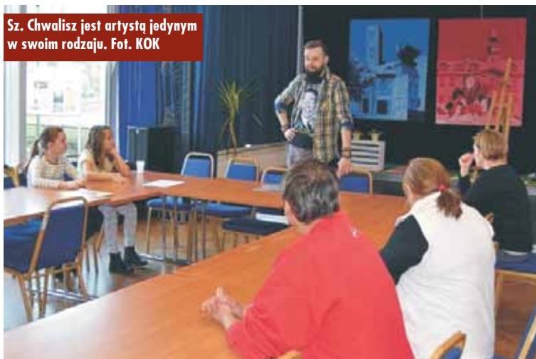
Sz. Chwalisz jest artystą jedynym w swoim rodzaju.