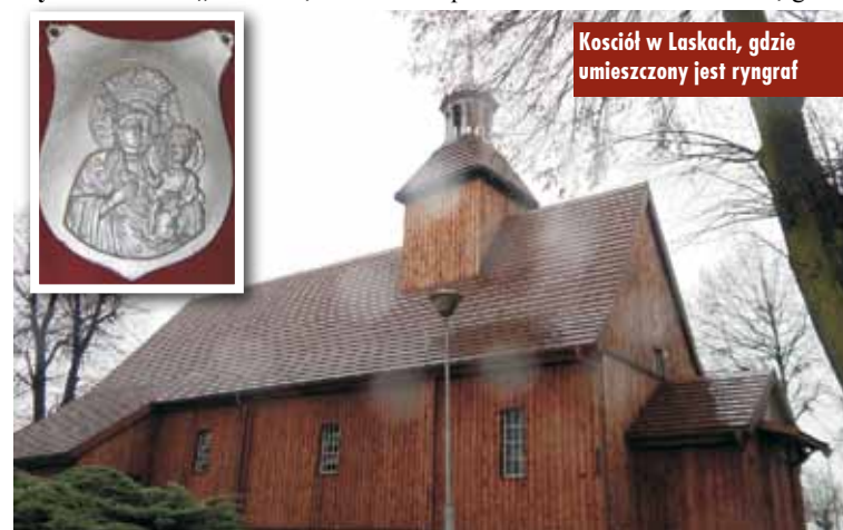
Kościół w Laskach, gdzie umieszczony jest ryngraf