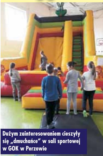
Dużym zainteresowaniem cieszyli się „dmuchańce” w sali sportowej w GOK w Perzowie