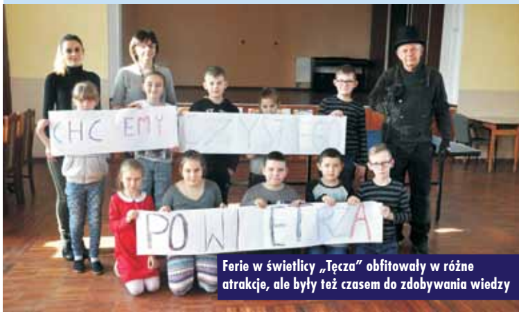
Ferie w świetlicy „Tęcza” obfitowały w różne atrakcje, ale były też czasem do zdobywania wiedzy

Spotkanie wójta z sołtysami dotyczyło spraw bieżących