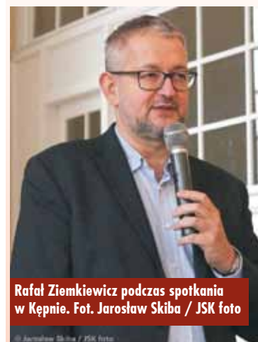
Rafał Ziemkiewicz podczas spotkania w Kępnie.

W sobotę, 24 lutego br., w Domu Katolickim w Kępnie, za pośrednictwem Stowarzyszenia „Kalisz”, działaczy „Endecji” oraz lokalnych działaczy Partii Wolność, odbyło się tournée spotkań z Rafałem Ziemkiewiczem – znanym polskim dziennikarzem, publicystą, komentatorem politycznym i ekonomicznym, pisarzem fantastycznonaukowym,