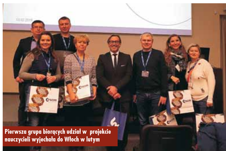
Pierwsza grupa biorących udział w projekcie nauczycieli wyjechała do Włoch w lutym

Muzeum Ziemi Kępińskiej im. T. P. Potworowskiego podczas tegorocznych ferii zimowych zaprosiło najmłodszych do udziału w warsztatach LEGO®