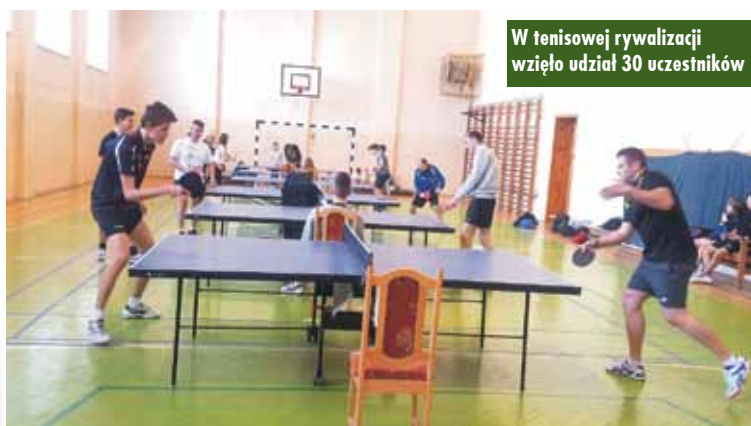
W tenisowej rywalizacji wzięło udział 30 uczestników

W szkołach podstawowych gminy Perzów ferie zimowe były okazją do przeprowadzenia porządków i drobnych napraw