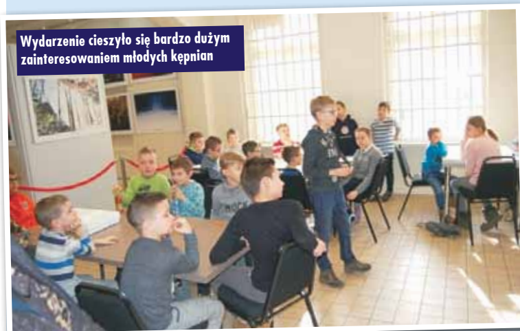
Wydarzenie cieszyło się bardzo dużym zainteresowaniem młodych kępińian

Spotkanie mieszkańców z Rafałem Ziemkiewiczem