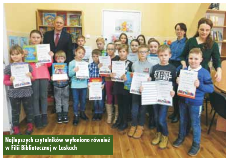
Najlepszych czytelników wyłoniono również w Filii Bibliotecznej w Laskach