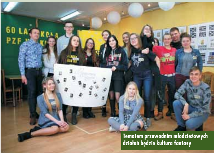
Tematem przewodnim młodzieżowych działań będzie kultura fantasy