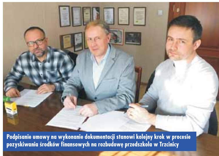
Podpisanie umowy na wykonanie dokumentacji stanowi kolejny krok w procesie pozyskiwania środków finansowych na rozbudowę przedszkola w Trzcinicy