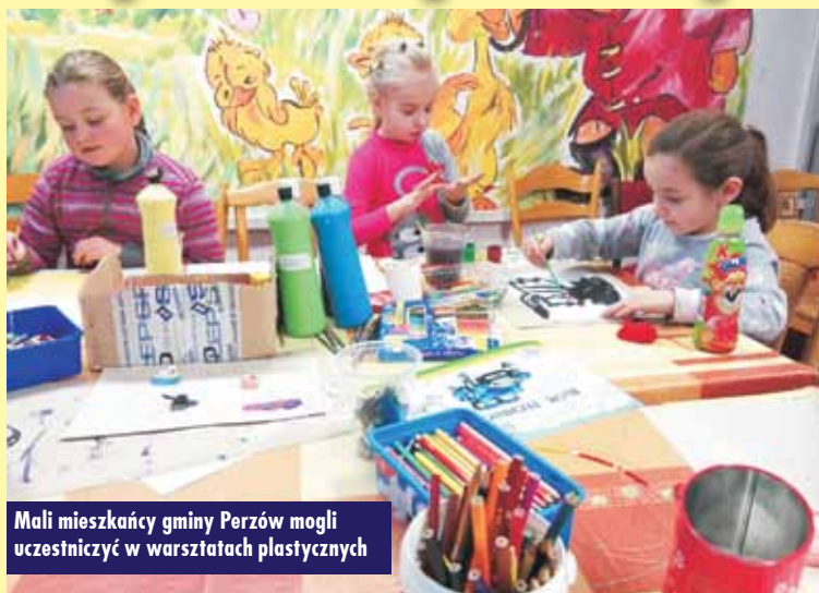
Mali mieszkańcy gminy Perzów mogli uczestniczyć w warsztatach plastycznych

Gminny Ośrodek Kultury wspólnie z Biblioteką Publiczną w Perzowie przygotował na czas ferii zimowych atrakcyjną ofertę zajęć dla najmłodszych mieszkańców gminy.