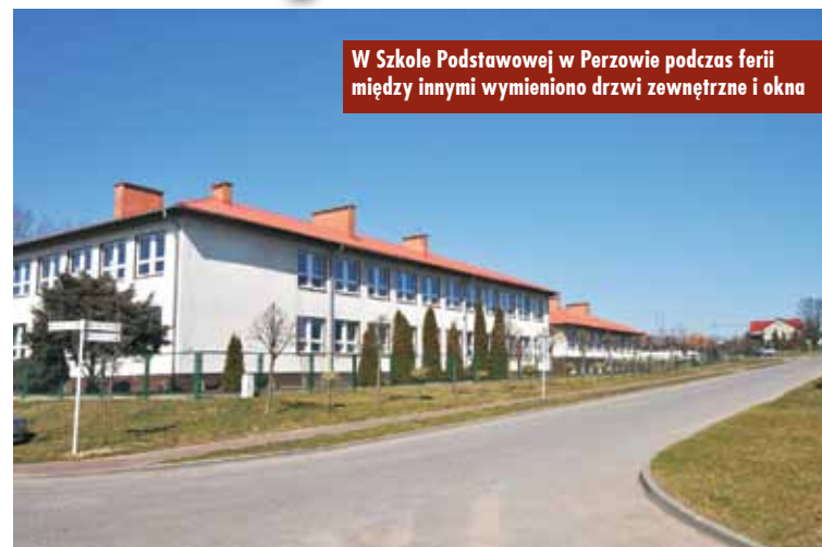
W Szkole Podstawowej w Perzowie podczas ferii między innymi wymieniono drzwi zewnętrzne i okna

W Perzowie wymieniono drzwi zewnętrzne oraz 12 starych, drewnianych okien na szczelne - trzyszybowe. Przeprowadzono również remont w pomieszczeniach biurowych.