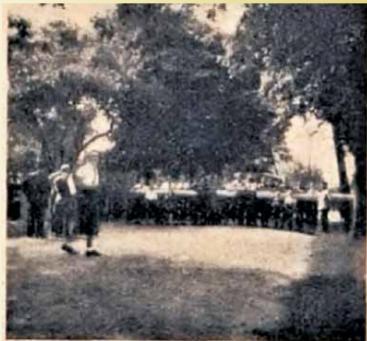
Przejście graniczne Siemianice-Kostau (Kostów). Fotografia wykonana od strony Siemianic w stronę Kostowa tuż po zajęciu we wrześniu 1939 roku terenu przez Niemców.