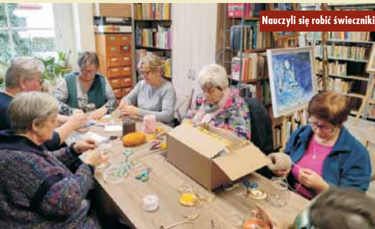
Nauczyli się robić świeczniki

23 stycznia 2023 r. w Filii Bibliotecznnej w Siemianicach odbyło się spotkanie czytelników połączone z warsztatami, na których każdy z uczestników mógł własnoręcznie wykonać ozdobny świecznik. Zajęcia zaczęły się od dyskusji na temat nowości wydawniczych i przeczytanych książek. Panie przedstawiły swoje propozycje tytułów oraz autorów książek, jakie według nich powinny stać na bibliotecznych półkach. Następnie każdy przy pomocy różnych materiałów i własnej kreatywności wykonał świecznik.