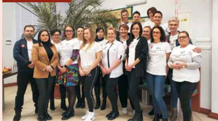
Zaloga z SBL, licząca „kasę”

skąć informacje oraz zarejestrować się jako dawca szpiku. Oprócz tego