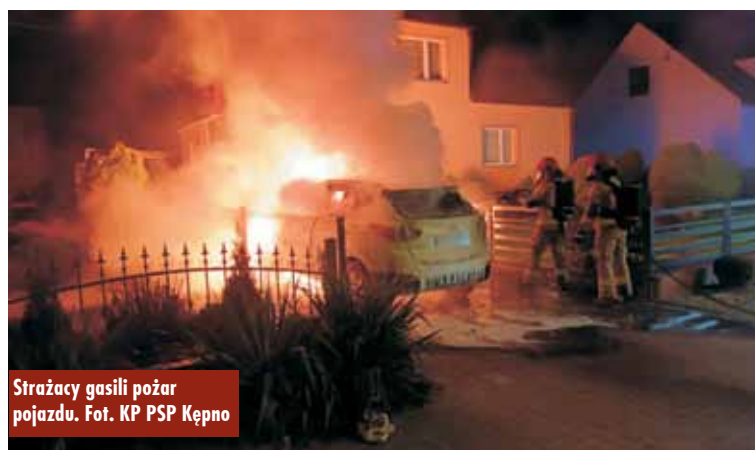
Strażacy gasili pożar pojazdu.

ciężkiej w natarciu na palący się pojazd, co doprowadziło do ugasze-