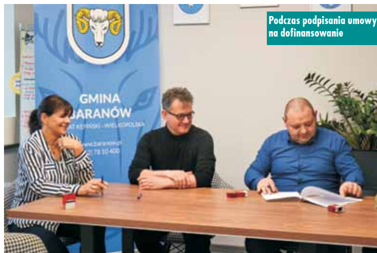
Podczas podpisywania umowy na dofinansowanie

cje pozarządowe otrzymały dofinansowanie: Stowarzyszenie „Słoneczny Mroczeń” – na zadania: koncert zespołu „Wężyk Band” pn. „Rock around the clock” – 3.200,00 zł, VIII Lokalny Festiwal Smaku – 5.550,00 zł,