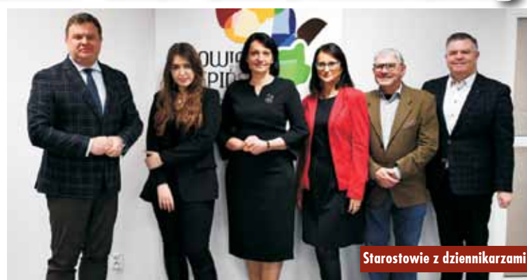
Starostowie z dziennikarzami