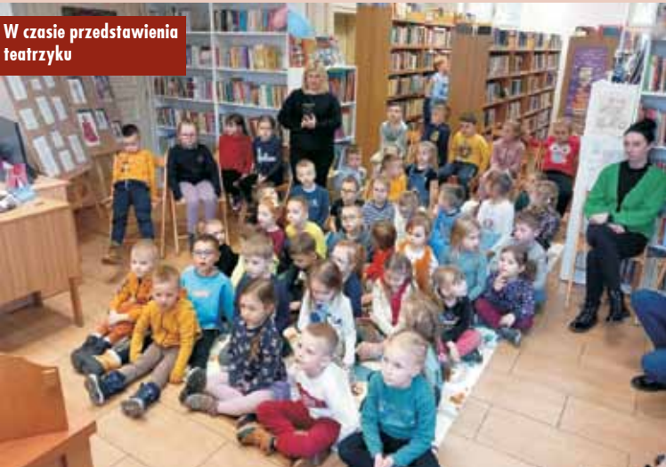
W czasie przedstawienia teatrzyku

(jap. Kami-papier, shibai-sztuka) to inaczej „papierowy teatr” nazywany również „teatrem obrazkowym” albo „teatrem narracji”. Jest to technika