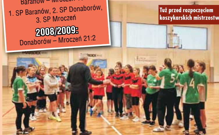
Tuż przed rozpoczęciem koszykarskich mistrzostw