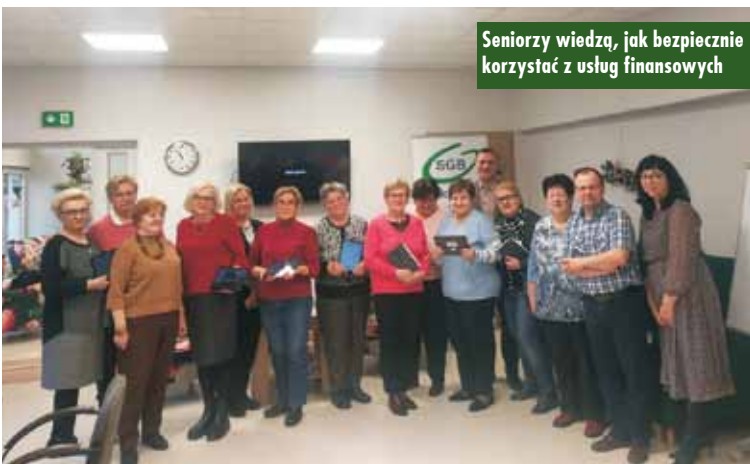
Seniorzy wiedzą, jak bezpiecznie korzystać z usług finansowych