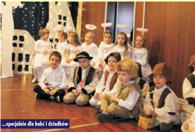
...specjalnie dla babć i dziadków

Spotkanie z pracownikami banku w Klubie „Senior+” w Bralinie