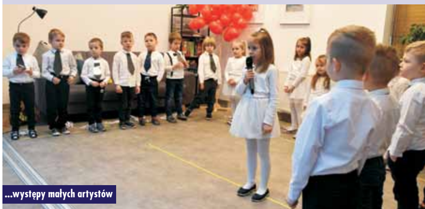
...występy małych artystów

Dla kilkudziesięciu seniorów wyjątkowy prezent przygotowały przedszkolaki, które wystąpiły ze specjalnym programem dla babci i dziadka. Dzieci z Przedszkola Samorządowego nr 2 w Kępnie sprawiły, że wśród uczestników zagościła miła atmosfera i uśmiech. Mali artyści zostali nagrodzeni gromkimi brawami.