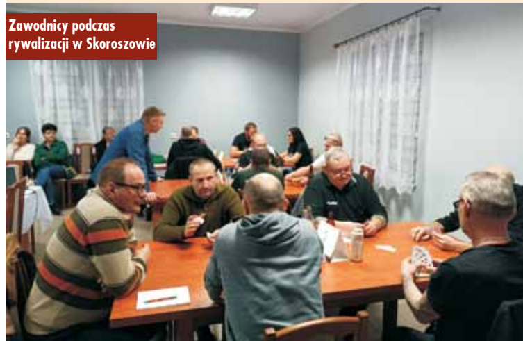
Zawodnicy podczas rywalizacji w Skoroszowie