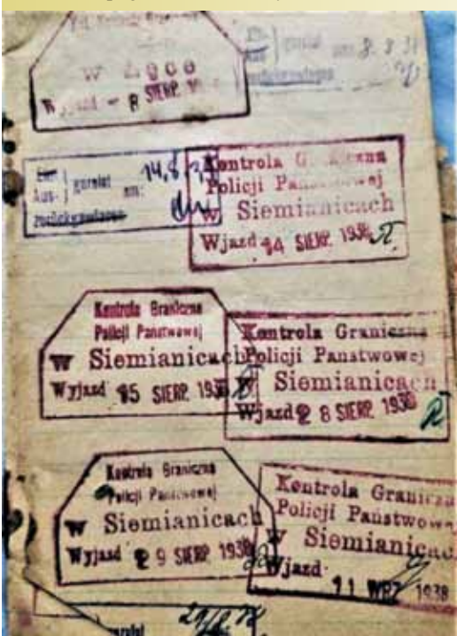
Skan przedstawia pieczęcie z przepustki z tzw. małego ruchu granicznego z przejścia granicznego Siemianice - Kostów i stacji kolejowej Łęka Opatowska.

[1] Woreczki nikotynowe – nowy rewelacyjny (jak się wydaje) produkt pomocny w redukcji szkód wywołanych paleniem tytoniu. - Profesor Andrzej Sobczak (asobczak.com.pl)