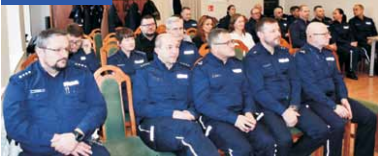
Kępińscy policjanci podczas podsumowania rocznego

nio 9 minut i 55 sekund (to o prawie 2 minuty lepiej niż minimum wyznaczone przez Komendę Wojewódzką Policji).