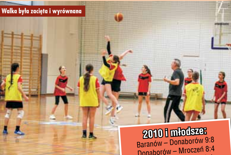
Walka była zacięta i wyrównana