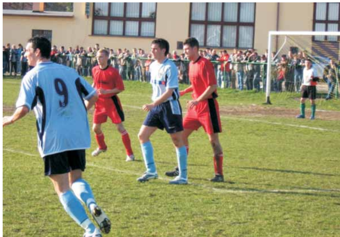
Od samego początku faworytem spotkania był zespół z Jarocina, który przed spotkaniem z Orłem zajmował czwarte miejsce w trzecioligowych rozgrywkach. Mroczenianie zapowiadali jednak, że tanio skóry jednak nie sprzedadzą i nie sprzedali