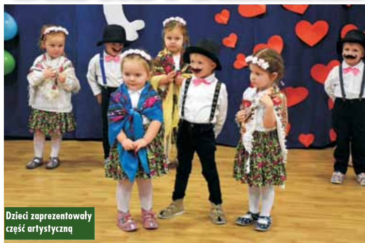
Dzieci zaprezentowały część artystyczną

26 stycznia br. burmistrz Piotr Psikus odwiedził Przedszkole Samorządowe nr 4 w Kępnie, gdzie świętowano Dzień Babci i Dziadka.