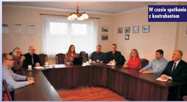
W czasie spotkania z kontrahentem