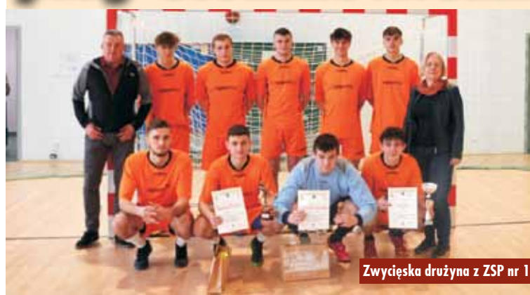
Zwycięska drużyna z ZSP nr 1

Zawody zorganizował Wydział Edukacji i Sportu Starostwa Powiatowego w Kępnie i Szkolny Związek Sportowy „Wielkopolska” w Poznaniu. Do turnieju przystąpiło pięć reprezentacji szkół średnich z rejonu kaliskiego.