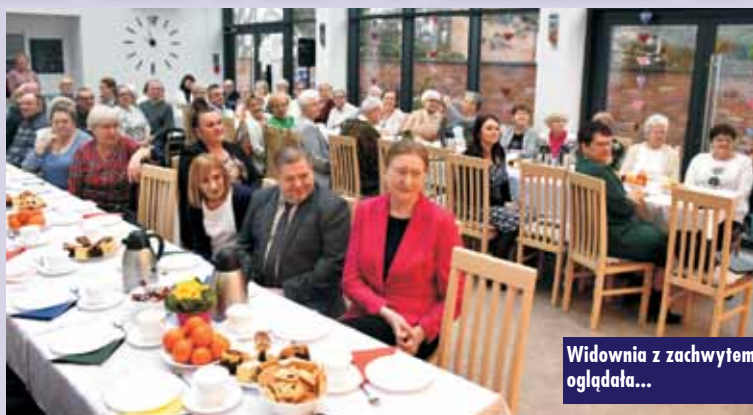
Widownia z zachwytem oglądała...

Burmistrz życzył seniorom zdrowia, a także pociechy z rodziny oraz wnuków. Przekazał również słodki upominek, przygotowany specjalnie na tę okazję.