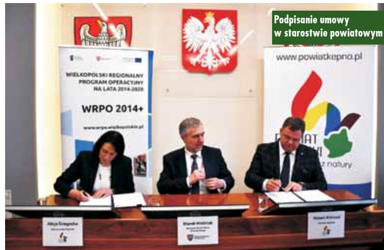
Podpisanie umowy w starostwie powiatowym

oszczędzanie energii i kosztów związanych z eksploatacją budynków. Równie ważna dla nas i mieszkańców jest poprawa estetyki obiektów, które dzięki termomodernizacjom są nowocześniejsze i ładniejsze.