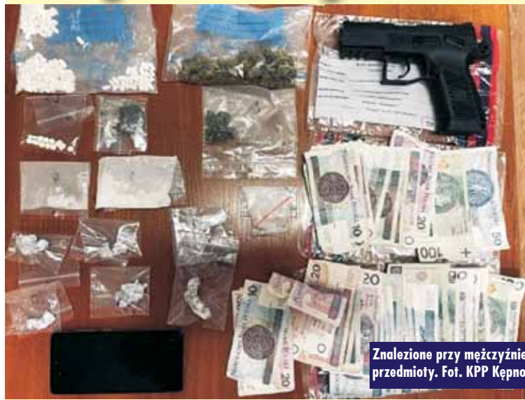
Znalezione przy mężczyźnie przedmioty.

Dalszy rozwój prowadzonych postępowań realizowanych przez policjantów Wydziału Kryminalnego, skierowany przeciwko dealerom narkotykowym, skutkował kolejnym zatrzymaniem mieszkańca Kępna.