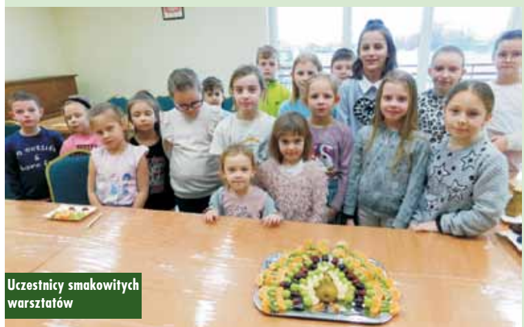
Uczestnicy smakowitych warsztatów

warsztatów kulinarnych zrealizowanych w ramach projektu „Kreatywne warsztaty kulturowe” dofinansowanych przez Fundację PZU.