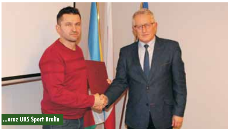
...oraz UKS Sport Bralin

Kolizja drogowa na 91. kilometrze trasy S8 na wysokości miejscowości Tabor Mały