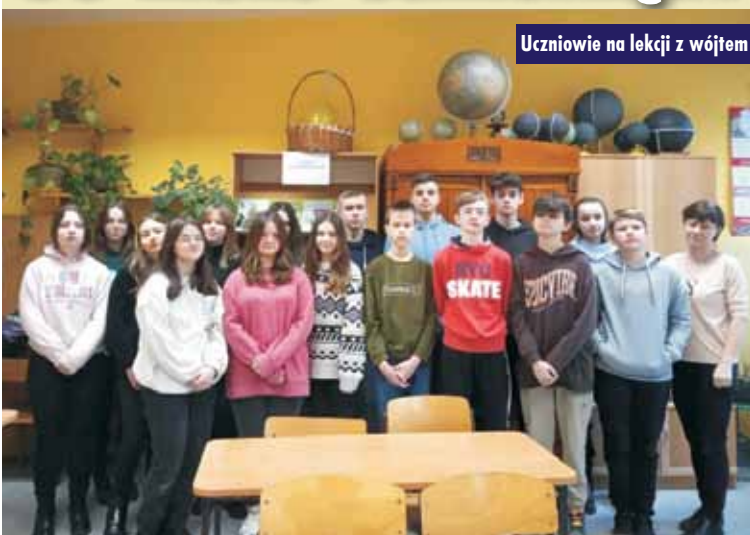
Uczniowie na lekcji z wójtem

9 stycznia 2023 r. w Zespole Szkół w Laskach w ramach realizacji problematyki wiedzy o społeczeństwie wójt gminy Trzcinica Grzegorz Hadzik spotkał się z uczniami klasy ósmej. W trakcie zajęć omówione zostały