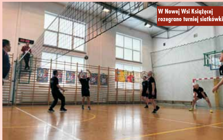
W Nowej Wsi Książęcej rozegrano turniej siatkówki

Finał Wielkiej Orkiestry Świątecznej Pomocy w gminie Bralin rozłożony został na dwa dni. W sobotę, w godzinach 17.00 – 20.00, odbyły się licytacje przedmiotów, które udało się pozyskać na aukcje członkom sztabu bralińskiego. Blisko 180 przedmiotów, które stały się częścią licytacji, cieszyło się niezwykłym zainteresowaniem. Wszystkie wystawione przedmioty zostały zlicytowane, a pieniądze, które udało się pozyskać w ten sposób, zasilili cel tegorocznej zbiórki. W tym roku Wielka Orkiestra zbierała i ciągle zbiera pieniądze na walkę z sepsą.