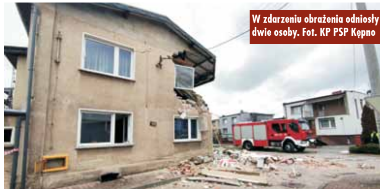
W zdarzeniu obrażenia odniosły dwie osoby.

Powiatowy Inspektorat Nadzoru Budowlanego w Kępnie powołał komisję mającą na celu ustalenie przyczyn i okoliczności katastrofy oraz zakresu czynności niezbędnych do likwidacji zagrożenia.