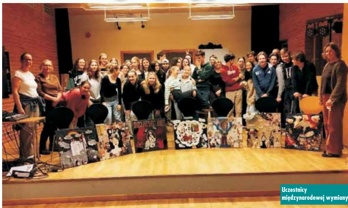
Uczestnicy międzynarodowej wymiany

6 stycznia br., po 26 godzinach jazdy do Norwegii, przybyliśmy do miasteczka Vollen. Zaraz po przyjeździe poszliśmy do szkoły, gdzie spotkaliśmy opiekunki projektu, które zapoznały nas z planem całego pobytu. Następnie udaliśmy się na zajęcia języka angielskiego. Na lekcji dyskutowaliśmy na temat istoty demokracji oraz negatywnych skutków pandemii, naszych nastrojów w postpandemicznej rzeczywistości oraz możliwości powrotu do tzw. „normalności” po globalnym covidowym paraliżu. Po zajęciach języka angielskiego udaliśmy się na salę gimnastyczną, gdzie ćwiczyliśmy wspólnie ze skandynawskimi kolegami. Zostaliśmy podzieleni na grupy i przygotowaliśmy układ taneczny. Po zajęciach wychowania fizycznego poszliśmy do biblioteki - tam wspólnie graliśmy w gry planszowe.