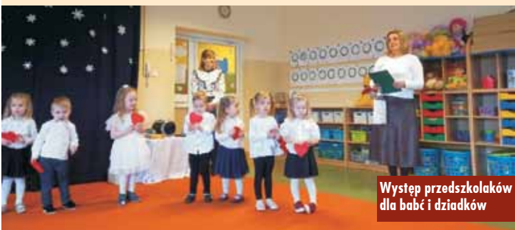
Występ przedszkolaków dla babć i dziadków

W Gminie Trzcinica realizowany jest program grantowy „Cyfrowa gmina” finansowany ze środków w ramach Programu Operacyjnego Polska Cyfrowa na lata 2014-2020 Osi Priorytetowej V Rozwój cyfrowy JST oraz wzmocnienie cyfrowej odporności na zagrożenia REACT-EU