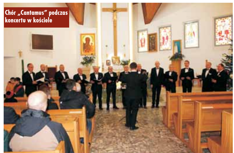
Chór „Cantamus” podczas koncertu w kościele

Gmina Kępno finalizuje pierwszy etap wprowadzania e-usług