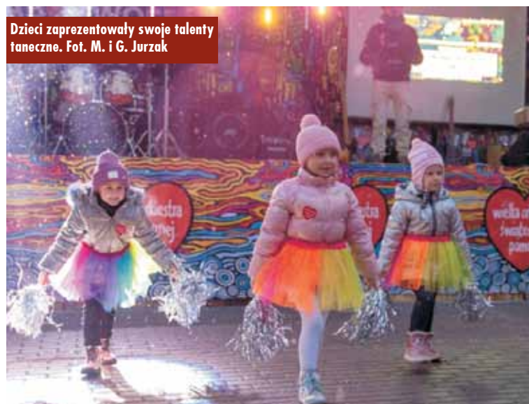
Dzieci zaprezentowały swoje talenty taneczne.

- Pomijając fakt pobicia kolejnego rekordu, bo nie o rekordy tu chodzi, a o każdą złotówkę przeznaczoną dla ratowania zdrowia i życia każdego z nas, to jednak przekro-