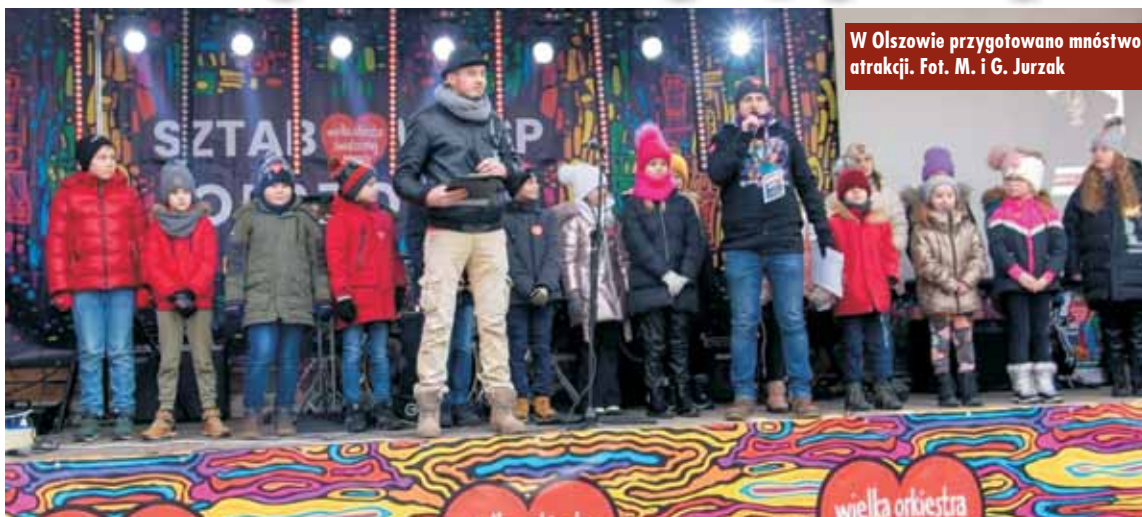
W Olszowie przygotowano mnóstwo atrakcji.

Po raz 7. w Olszowie zorganizowany został Finał Wielkiej Orkiestry