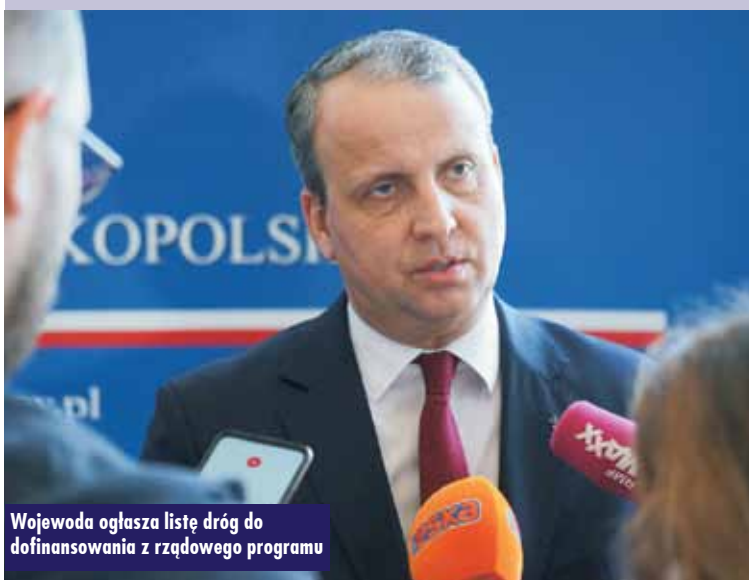
Wojewoda ogłasza listę dróg do dofinansowania z rządowego programu

Dofinansowanie otrzymały także drogi gminne w Kępińskim: przebudowa ulicy Kościelnej w Bralinie (rozpoczęcie inwestycji – 04.2023, zakończenie – 10.2023, koszt – 511 786,98 zł, dofinansowanie – 255 893,49 zł, czyli 50%), przebudowa ulicy Towarowej w Kępnie (rozpoczęcie prac – 01.2023, zakończenie – 06.2023, koszt całkowity – 1 275 847,98 zł, dofinansowanie – 637 923,99 zł, czyli 50%); budowa ulicy Rubinowej i Topazowej w Olszowie (gmina Kępno; rozpoczęcie inwestycji – 01.2023, zakończenie – 06.2023 r., koszt całkowity – 951 482,51 zł, dofinansowanie