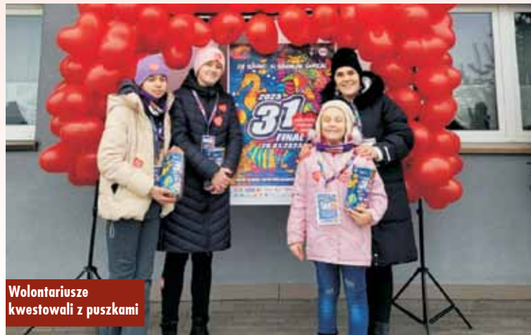
Wolontariusze kwestowali z puszkami

Dodatkowo przez cały dzień, pomimo nie najlepszej aury, po drogach sołectw przemieszczał się BUS WOŚP, docierając do wszystkich zakątków gminy. Cieszymy się, że ta inicjatywa w ramach finału orkiestry, cieszy się zainteresowaniem i co naj-