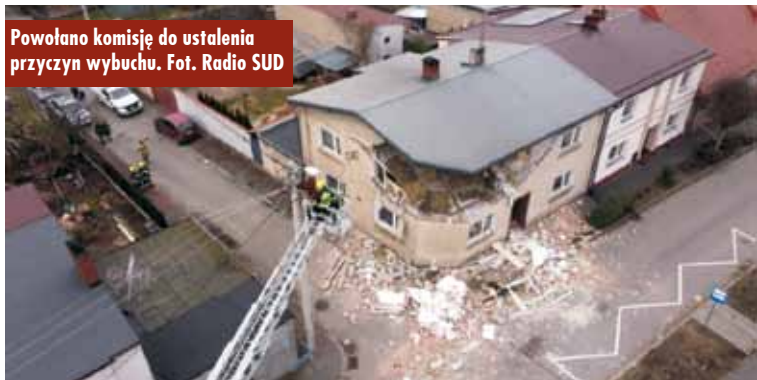
Powołano komisję do ustalenia przyczyn wybuchu.