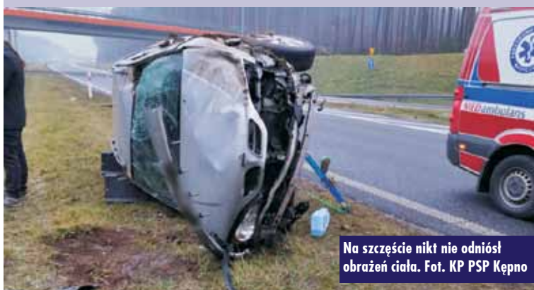
Na szczęście nikt nie odniósł obrażeń ciała.