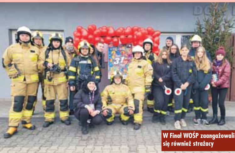
W Finał WOŚP zaangażowali się również strażacy

31. Finał WOŚP w Bralinie zakończył się o godzinie 20.00 światłem do nieba, które można było oglądać w internecie, a także bezpośrednio na żywo za Świątlicą „Tęcza” w Bralinie, gdzie mieścił się sztab.