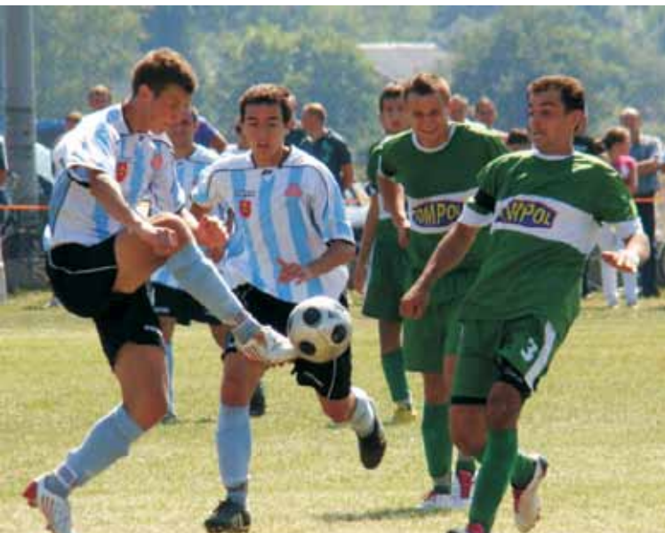
Po dwóch zwycięstwach na otwarcie sezonu przyszła pora na porażkę. W pierwszym meczu w roli gospodarza opatowianie nie dali rady Ostrovii 1909 Ostrów Wielkopolski, ulegając późniejszemu mistrzowi rozgrywek 1:3