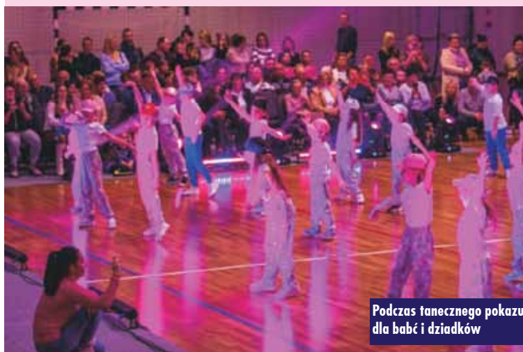
Podczas tanecznego pokazu dla babć i dziadków