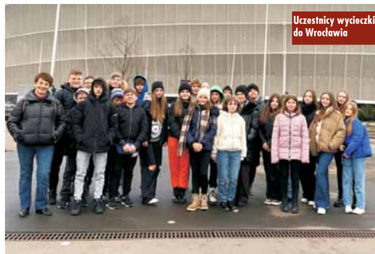
Uczestnicy wycieczki do Wrocławia

na lodowisku. Następnie udali się do kina na film pt. „Kot w butach”, który wprowił wszystkich w dobry humor. Mieli również czas na wspólny posiłek i bawili się doskonale. Oprac. m