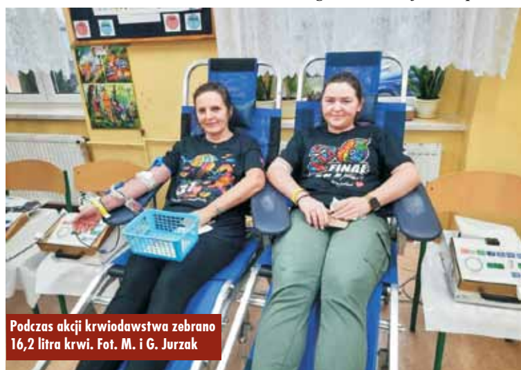
Podczas akcji krwiodawstwa zebrano 16,2 litra krwi.

W niedzielę na orkiestrowej scenie zaprezentowali się: m.in. dzieci z miejscowej szkoły podstawowej, zespół Elementis (studio piosenki Renaty Nowickiej ), Studio Tańca Explorja, zespół Sound Error oraz CarmeLovi i Pablo. Była też zumba, możliwość przejażdżki wozem strażackim, kurs pierwszej pomocy, zabawy dla dzieci czy loteria fantowa z nagrodami. Wolontariusze zbierali datki do puszek, zorganizowano też