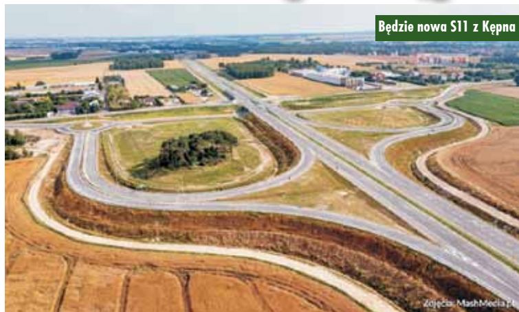
Będzie nowa S11 z Kępna