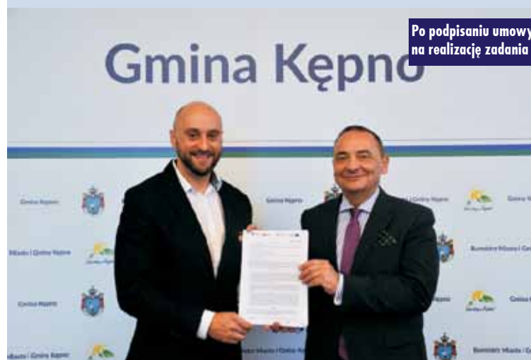
Po podpisaniu umowy na realizację zadania

Drodzy Czytelnicy! Jeżeli w Waszej rodzinie obchodzony jest dostoyny jubileusz wspólnego pożycia małżeńskiego bądź też huczne urodziny, a chcielibyście upamiętnić to wydarzenie w wyjątkowy sposób na łamach naszego tygodnika - zapraszamy do kontaktu z dziennikarzami. Z radością przygotujemy reportaż z tego szczególnego wydarzenia, który opublikujemy w „Tygodniku Kępińskim”.