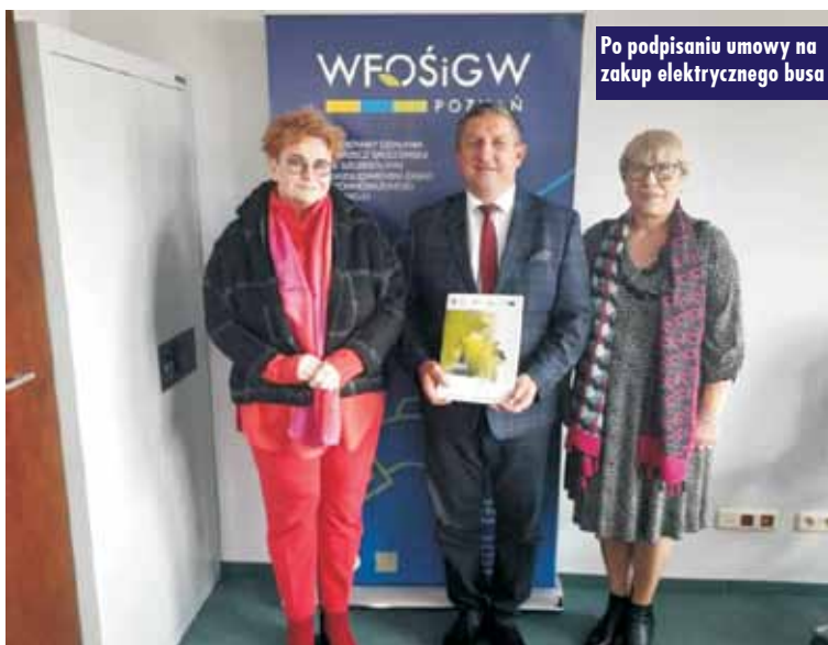
Po podpisaniu umowy na zakup elektrycznego busa

- Pojazd przeznaczony będzie głównie do przewożenia osób niepełnosprawnych dowożonych na dzienne zajęcia do Centrum Opiekuńczo-Mieszkalnego w Opatowie. Samochód będzie w pełni elektryczny, a więc nie będzie emitował żadnych substancji szkodliwych podczas jazdy. Emisja hałasu, również zostanie ograniczona do minimum – informuje A. Kopis. Auto będzie wyposażone w 3-fazową ładowarkę szybkiego ładowania typu Wallbox. Oprac. m