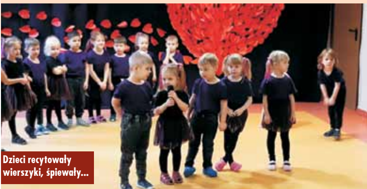
Dzieci recytowały wierszyki, śpiewały...

„Dziś dla babci słońce mamy i całuski dla dziadziusia. Dziś życzenia wnuczek składa i piosenki śpiewa wnusia”. Od 17 do 23 stycznia br. dzieci z Przedszkola Samorządowego nr 2 w Kępnie gościły swoje babcie oraz dziadków na uroczystościach z okazji ich święta. Przedszkolaki z niecierpliwością wyczekiwały zaproszonych gości, a podczas spotkania pięknie prezentowały wierszyki, piosenki i tańce oraz życzenia. Babcie i dziadkowie ze wzruszeniem przyglądali się najukochańszemu wnuczątkom. A później... przedszkolaki obdarowały swoich gości własnoręcznie wykonanymi upominkami. Na zakończenie nie zabrakło słodkiego poczęstunku. Oprac. KR