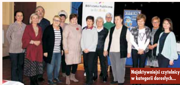
Najaktywniejsi czytelnicy w kategorii dorosłych...