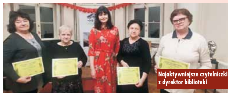
Najaktywniejsze czytelniczki z dyrektor biblioteki