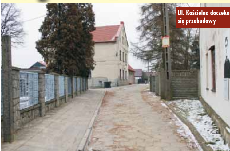
Ul. Kościelna doczeka się przebudowy

6 lutego br. ogłoszono wyniki kolejnego naboru w ramach Rządowego Funduszu Rozwoju Dróg. W Wielkopolsce wsparcie rządowe uzyska 150 zadań, w tym 42 powiatowych i 108 gminnych. Łączna wartość środków funduszu przeznaczonych na dofinansowanie realizacji inwestycji w 2023 r. w Wielkopolsce to 233,3 mi-