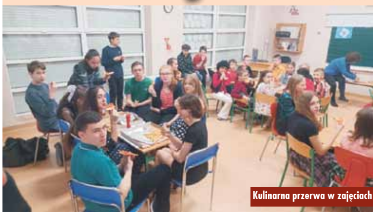
Kulinarna przerwa w zajęciach

Niezapomnianych wrażeń dostarczyły atrakcje i zabawy w stylu lat 80. Chętni uczniowie wystąpili w stylizacjach z tamtych lat, a ich stroje uzupełniały efektowne fryzury i peruki. Królowały disco, pop i rock.