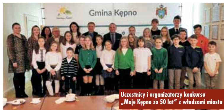
Uczestnicy i organizatorzy konkursu „Moje Kępno za 50 lat” z władzami miasta

Prace konkursowe dzieci zostały zeskanowane lub sfotografowane i w formie wystawy będą przedstawione przed ratuszem. - Wasze prace będą zdobiły ratusz i będą największą