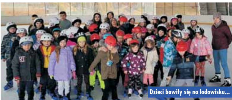
Dzieci bawiły się na lodowisku...

Natomiast uczniowie z Zespołu Szkół im. Ks. Michała Przywary i