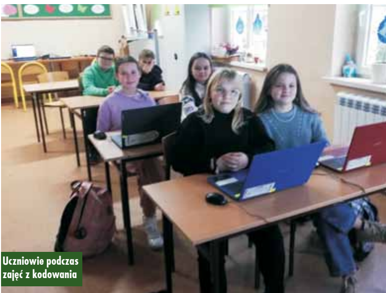
Uczniowie podczas zajęć z kodowania

Projekt pt. „Nasza szkoła programuje” w Zespole Szkół im. Ks. Michała Przywary i Rodziny Salomonów