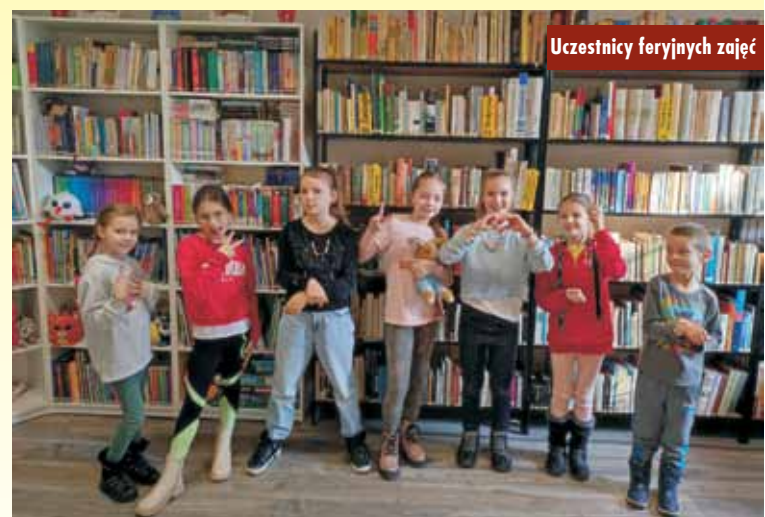
Uczestnicy feryjnych zajęć

ne prace plastyczne, pt.: „Zimowy pejzaż nocą”. Do dyspozycji dzieci były również klocki lego, którymi bardzo chętnie wszyscy się bawili. Podsumowaniem spotkania było wspólne oglądanie bajek na rzutniku ANIA. Dzieci były mile zaskoczone