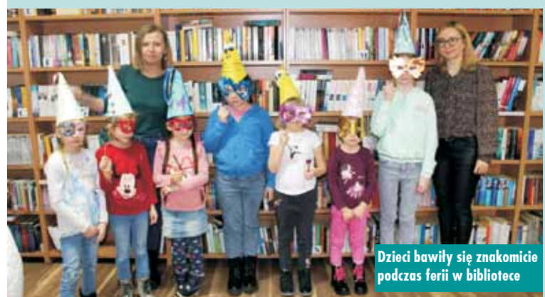
Dzieci bawiły się znakomicie podczas ferii w bibliotece