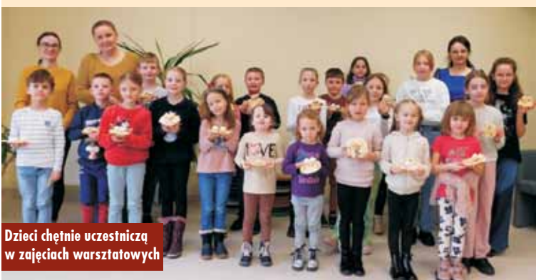
Dzieci chętnie uczestniczą w zajęciach warsztatowych