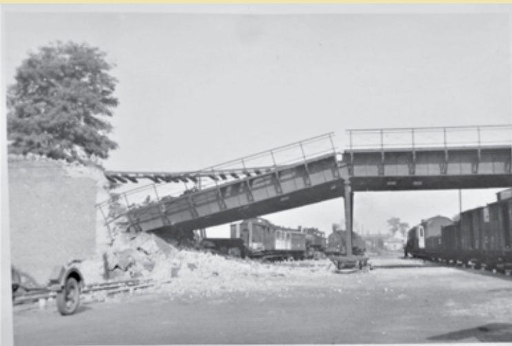
Widok wysadzonego wiaduktu kolejowego z dworca dolnego

sprawę o możliwym zbrojnym wystąpieniu Hitlera przeciwko Polsce, dlatego wojsko rozpoczęło ciche i skryte przygotowania do odparcia ewentualnej agresji. Dotyczyło to również powiatu kępińskiego.