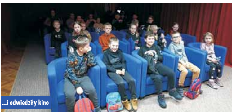
...i odwiedziły kino

Gmina Bralin na zadanie pn. „Przebudowa ulicy Kościelnej w Bralinie” otrzyma 255.893,49 zł