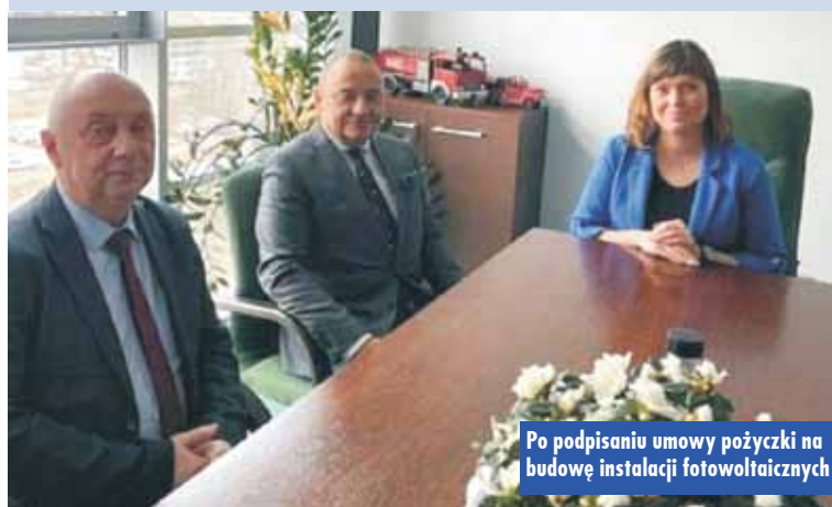
Po podpisaniu umowy pożyczki na budowę instalacji fotowoltaicznych

instalacji fotowoltaicznych dla budynków Przedszkola Samorządowego nr 2 i nr 5 w Kępnie oraz Przedszkola Samorządowego i Szkoły