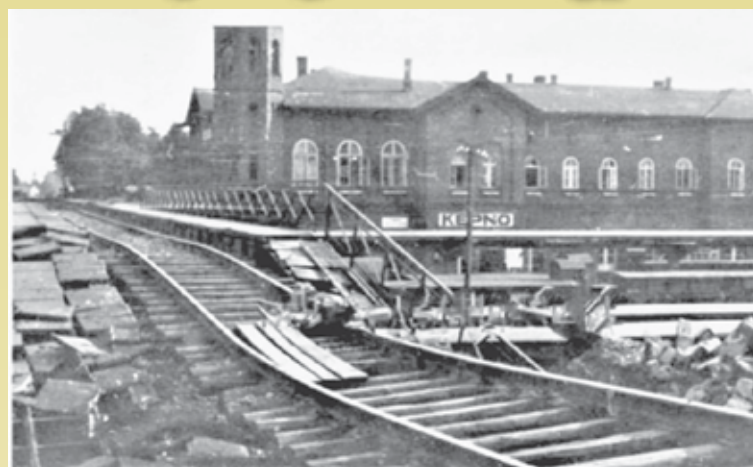
Widok wysadzonego wiaduktu kolejowego z dworca górnego

Wraz z odrzuceniem żądań Hitlera przez rząd Polski, w maju 1939 r., stosunki polsko-niemieckie uległy gwałtownemu pogorszeniu, a na granicy dochodziło do licznych prowokacji. Władze polskie zdawały sobie