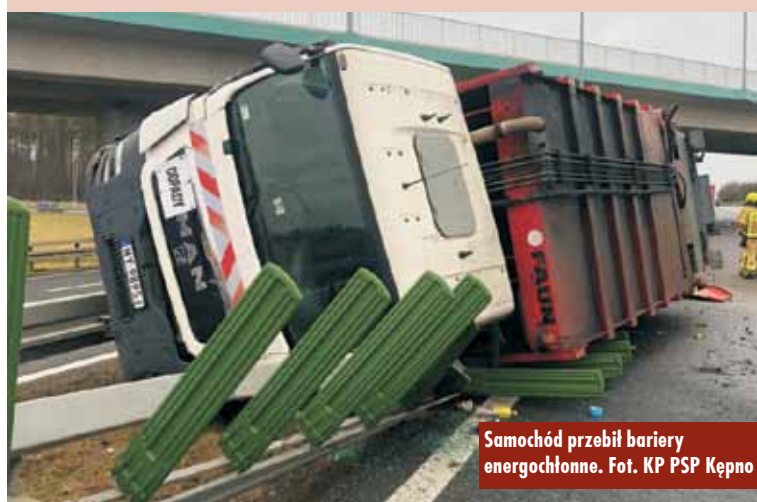
Samochód przebił bariery energochłonne.

24 lutego br. odbył się w Szkole Podstawowej nr 2 w Kępnie „Gminny Konkurs Piosenki Ukraińskiej – 2023”