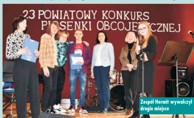
Zespół Hermit wywalczył drugie miejsce