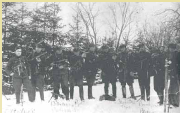
Oddział Franciszka Olszówki „Otta”.

Skazani wyrokiem Wojskowego Sądu Rejonowego w Poznaniu, dnia 7.02.1947 r.: