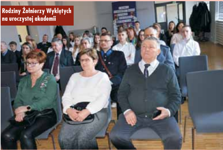
Rodziny Żołnierzy Wyklętych na uroczystej akademii

stwa polskiego wobec narzuconej władzy. Żołnierze Wyklęci dzięki swojej działalności przyczynili się do opóźnienia kolejnych etapów utrwalania systemu komunistycznego, pozostając dla wielu środowisk wzorem postawy obywatelskiej. Oddajmy im cześć – stwierdziła dyrektor szkoły.