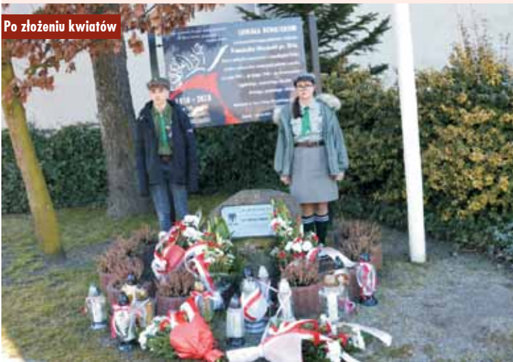
Po złożeniu kwiatów

tynuowali ją w podziemiu, nie zgadzając się na ustalony przez zachodnie mocarstwa i Związek Sowiecki ład. Komunistyczne, marionetkowe władze polskie, w pełni uzależnione od decydentów z Moskwy, nie tylko dyskredytowały zasługi wojenne naszych bohaterów, ale najczęściej robiono z nich zdrajców, okupacyjnych kolaborantów i wrogów ojczyzny. Życie kończyli w ubeckich katowniach i bezimiennych mogiłach. Dopiero po latach przywrócono pamięć o nich i należyte miejsce w historii. Fenomen powojennej konspiracji niepodległościowej polega m.in. na tym, że była ona – aż do powstania Solidarności – najliczniejszą formą zorganizowanego oporu społeczeń-