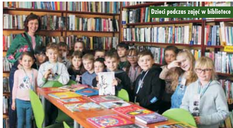
Dzieci podczas zajęć w bibliotece