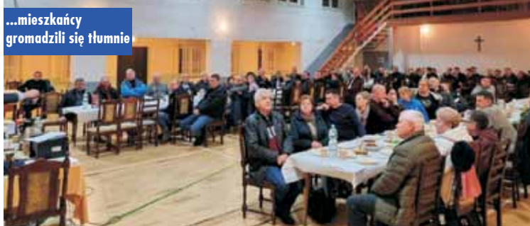
...mieszkańcy gromadzili się tłumnie