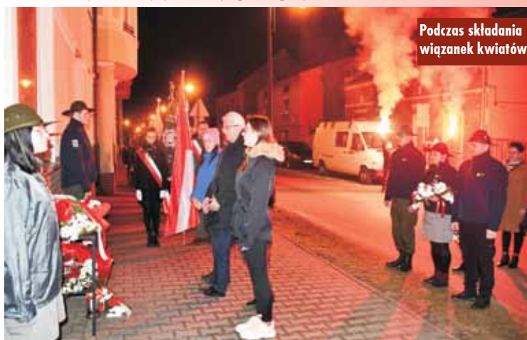
Podczas składania wiązanek kwiatów...

Data obchodów Narodowego Dnia Pamięci Żołnierzy Wyklętych nie jest przypadkowa - 1 marca 1951 r. w więzieniu na warszawskim Mokotowie, po pokazowym procesie z polecenia władz komunistycznych, strzałem w tył głowy zamordowano przywódców IV Zarządu Zrzesze-