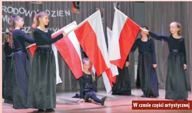
W czasie części artystycznej