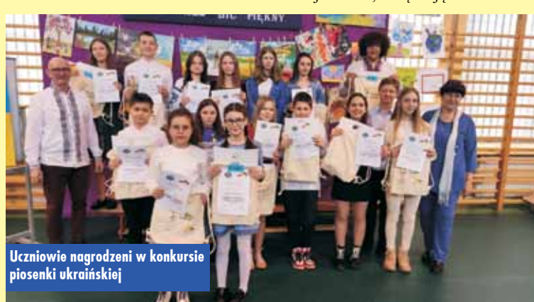
Uczniowie nagrodzeni w konkursie piosenki ukraińskiej