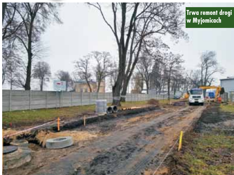
Trwa remont drogi w Myjomicach

Zadanie obejmuje wykonanie drogi o nawierzchni asfaltowej w Myjomicach o długości 288 m i szerokości 5,5 m wraz z odwodnieniem i pobocznymi tłuczniami.