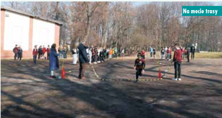
Na mecie trasy

Większość Żołnierzy Niezłomnych, a szczególnie ich dowódcy, za walkę o wolną Polskę zapłacili życiem lub zdrowiem. W latach 1944-1956, według ciągle jeszcze niepełnych danych, z rąk komunistów zginęło około 9 tysięcy żołnierzy podziemia niepodległościowego. W tym czasie wykonano ponad 4 tysiące wyroków śmierci na tych, którzy po II wojnie światowej nie złożyli broni.