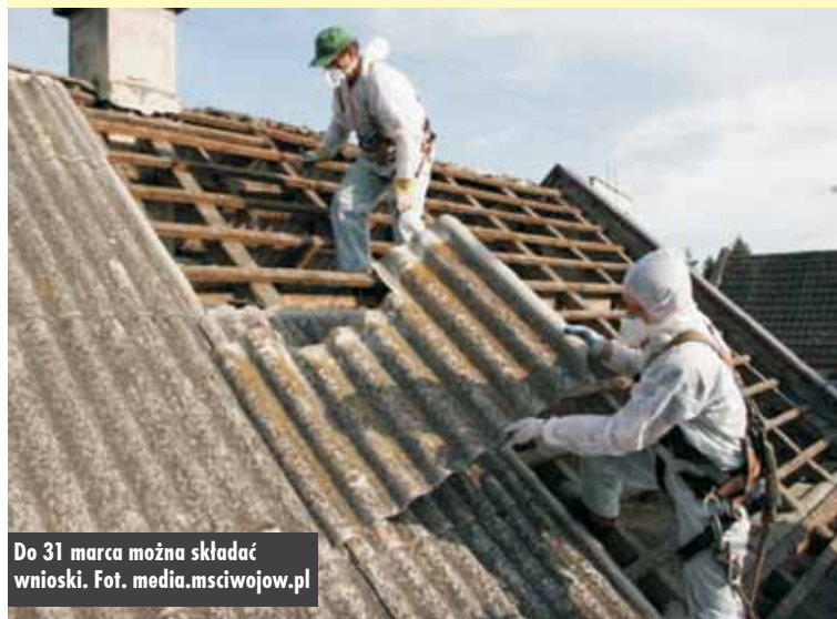
Do 31 marca można składać wnioski.

Mieszkańcy wybierali sołtysów i Rady Sołeckie na kadencję 2023-2027