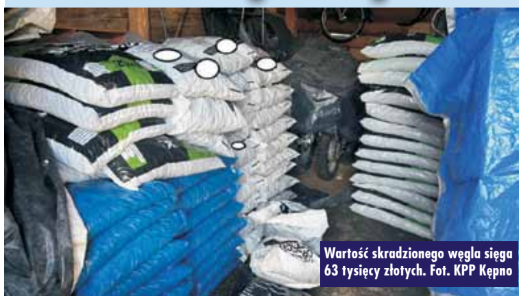
Wartość skradzionego węgla sięga 63 tysięcy złotych.

1 marca br. policjanci Posterunku Policji w Trzcinicy z siedzibą w Laszkach, w wyniku realizacji sprawy