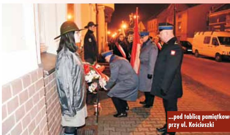
...pod tablicą pamiątkową przy ul. Kościuszki