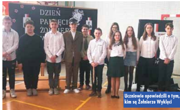
Uczniowie opowiedzieli o tym, kim są Żołnierze Wyklęci

Rozstrzygnięcie otwartego konkursu ofert na realizację w formie powierzenia lub wspierania zadań publicznych Województwa Wielkopolskiego w dziedzinie kultury w 2023 r.