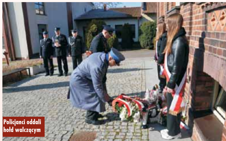
Policjanci oddali hołd walczącym

tynuowali ją w podziemiu, nie zgadzając się na ustalony przez zachodnie mocarstwa i Związek Sowiecki ład. Komunistyczne, marionetkowe władze polskie, w pełni uzależnione od decydentów z Moskwy, nie tylko dyskredytowały zasługi wojenne naszych bohaterów, ale najczęściej robiono z nich zdrajców, okupacyjnych kolaborantów i wrogów ojczyzny. Życie kończyli w ubeckich katowniach i bezimiennych mogiłach. Dopiero po latach przywrócono pamięć o nich i należyte miejsce w historii. Fenomen powojennej konspiracji niepodległościowej polega m.in. na tym, że była ona – aż do powstania Solidarności – najliczniejszą formą zorganizowanego oporu społeczeń-