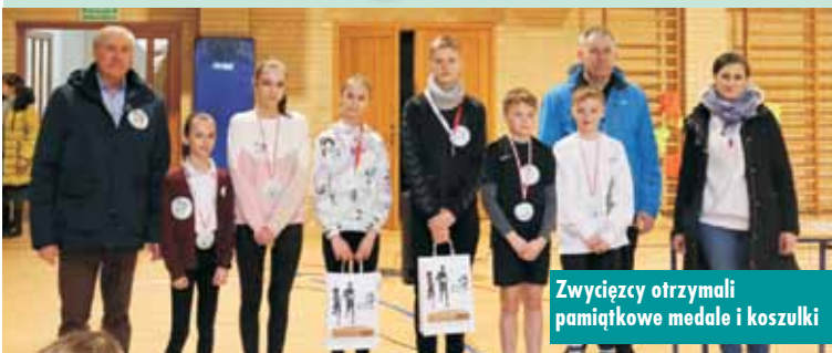
Zwycięzcy otrzymali pamiątkowe medale i koszulki

2 marca br. uczniowie Zespołu Szkół w Mroczeniu wzięli udział w XI edycji Biegu „Tropem Wilczym”. Jest to bieg, który ma na celu upamiętnienie Żołnierzy Wyklętych, czyli członków zbrojnego podziemia niepodległościowego, działającego na ziemiach polskich w latach 1944-1963. Bieg ten organizowany jest na dystansie 1963 metrów, co ma znaczenie symboliczne, ponieważ w tym właśnie roku zginął ostatni, poległy w walce Żołnierz Wyklęty – Józef Franczak (ps. Lalek).