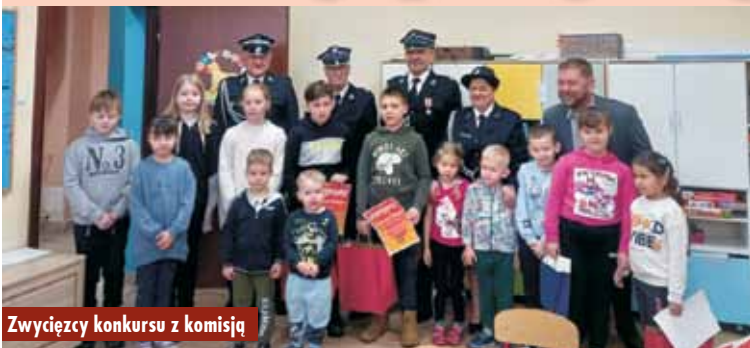
Zwycięzcy konkursu z komisją

Na początku marca br. wręczono nagrody laureatom gminnego etapu Strażackiego Konkursu Plastycznego Związku OSP RP. W eliminacjach wzięło udział 27 osób.