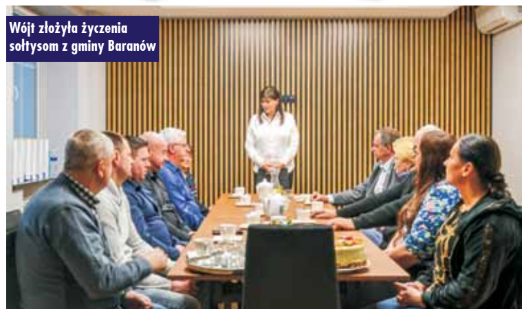
Wójt złożyła życzenia sołtysom z gminy Baranów

Sołtys – jak ważną jest funkcją, możemy przeczytać na stronie Krajowego Stowarzyszenia Sołtysów: Sołtysi są jedyną z najstarszych, jeśli nie ogólnie nie najstarszą instytucją państwa polskiego . Dlatego w poniedziałek, 13 marca br., w odnowionej sali narad Urzędu Gminy Baranów, odbyło się spotkanie z sołtyskami i sołtysami z gminy Baranów, by uczcić ich święto. Życzenia złożyli: wójt gminy