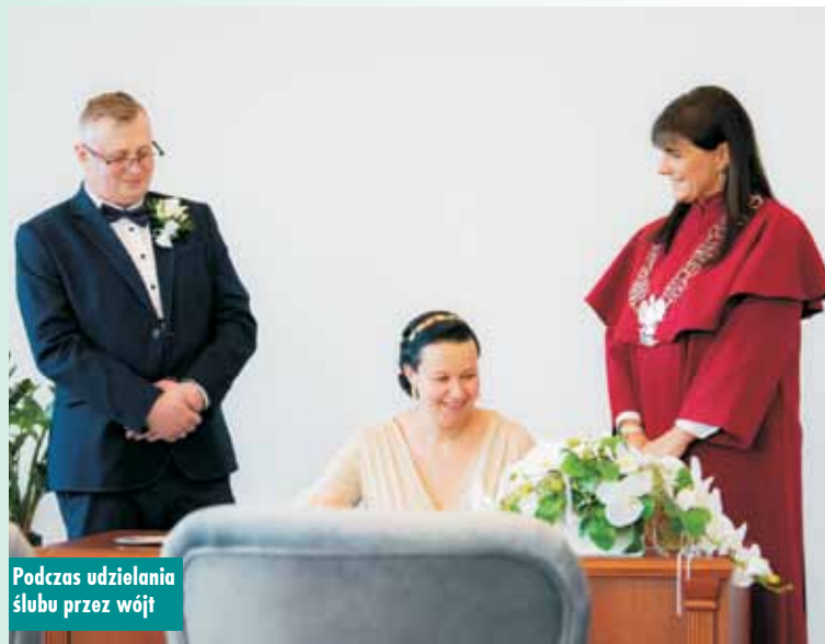
Podczas udzielania ślubu przez wójt