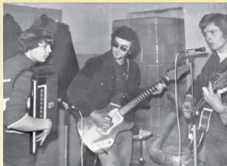
Próba zespołu muzycznego w Domu Kultury

teatralnym i plastycznym. Przy Domu Kultury działał również zespół muzyczny. Odbываły się tam targi książki i fachowej literatury. Organizowano zabawy, wieczorki i sylwestra. W budynku było pianino, organy, stół pingpongowy, stół bilardowy i różnego rodzaju gry planszowe i zręcznościowe. Szczególnym zaintereso-