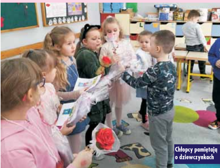
Chłopcy pamiętają o dziewczynkach

25 lutego br. Gminna Biblioteka Publiczna w Trzcinicy oraz Filia Biblioteczna w Laskach we współpracy z Planetą Robotów zorganizowała bezpłatne warsztaty z robotyki z wykorzystaniem programowalnych kostek LEGO