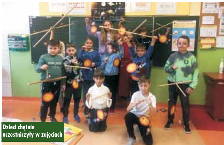
Dzieci chętnie uczestniczyły w zajęciach

Zebrania Ochotniczych Straży Pożarnych z gminy Bralin zakończone