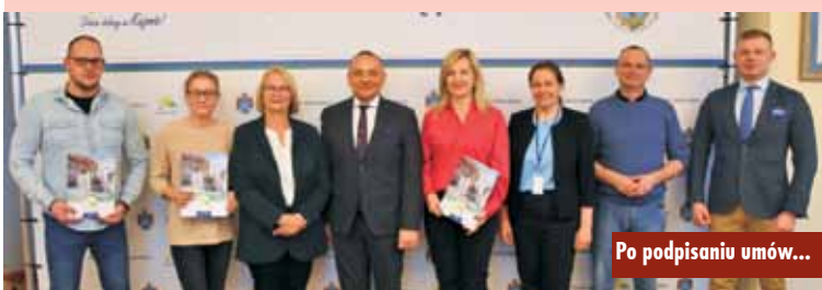
Po podpisaniu umów...

Akademia Sportu „Chikara Kępno” – zadanie: cykliczne szkolenie sportowe dzieci i młodzieży w karate olimpijskim WKF oraz uczestnictwo