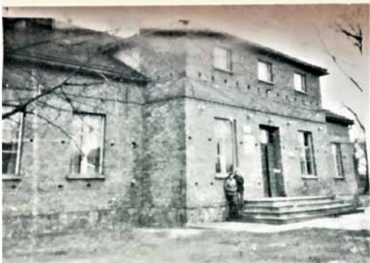
Budynek Domu Kultury - widok z zewnątrz

waniem cieszyły się szachy. Muzykę odtwarzano z radia i magnetofonu szpulowego. W klubokawiarni można było zjeść coś słodkiego, wypić oranżadę, kawę czy herbatę przy zupełnie umiarkowanych cenach. I co na tamte czasy było dużą atrakcją – obejrzeć telewizję, gdyż pierwsze telewizory zaczęły dopiero pojawiać się w domach. Na zewnątrz budynku własnymi siłami zrobiono ogródek rekreacyjny, w którym z pni drzew wykonano siedzenia i stoliki. Oprócz mieszkańców, wolny czas spędzali tam pracownicy wykonujący prace elektryfikacyjne linii kolejowej Kluczbork-Ostrów Wielkopolski, pracownicy, poprawiający stan dróg gminnych itp.