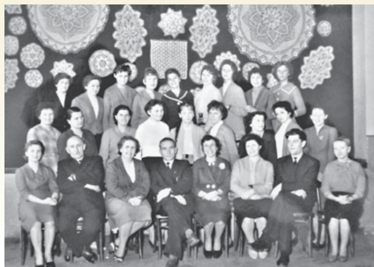
Uczestnicy jednego z kursów w Domu Kultury

Na początku lat siedemdziesiątych podjęto decyzję o rozbudowie budynku Domu Kultury. Miały po-