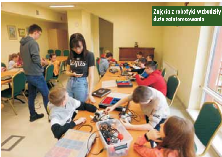
Zajęcia z robotyki wzbudziły duże zainteresowanie