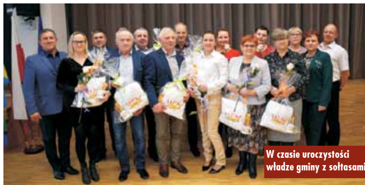
W czasie uroczystości władze gminy z sołtasami

Uczestnicy spotkania przy kawie i słodkościach rozmawiali o sprawach istotnych dla życia mieszkańców wsi. Dyskutowano o bieżących problemach, planach inwestycyjnych gminy oraz o blaskach i cieniach pracy społecznej. - Jeszcze raz życzymy wszystkim sołtysom pomyślności, wytrwałości w rozwiązywaniu problemów lokalnej społeczności oraz samych radosnych dni i powodzenia w życiu osobistym – podsumował wójt.