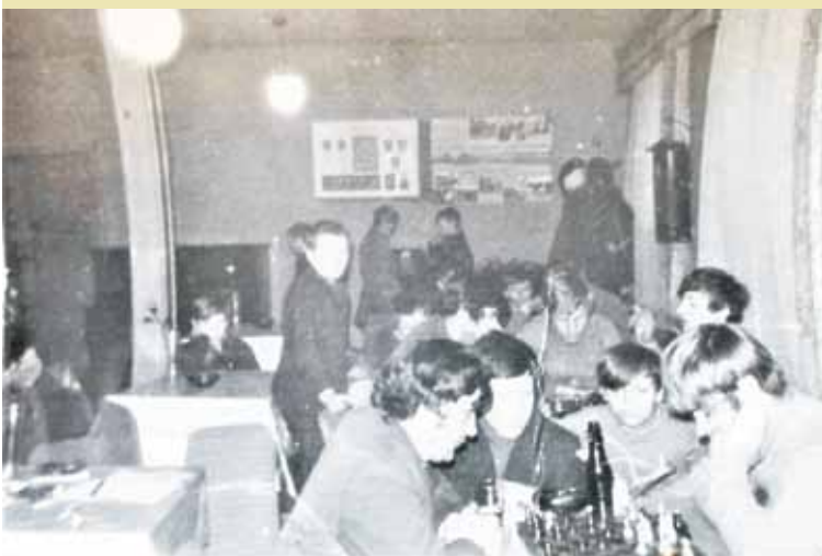
Młodzież w klubokawiarni

W budynku mieściła się biblioteka, sala widowiskowa, klubokawiarnia, pomieszczenie „praktycznej pani”, pomieszczenia socjalne. Regularnie dwa razy w miesiącu przyjeżdżało kino objazdowe, które cieszyło się ogromną popularnością. Dom Kultury działał 7 dni w tygodniu. W dni pracujące w godzinach 15.00 – 22.00, a w dni wolne od pracy od godziny 14.00.