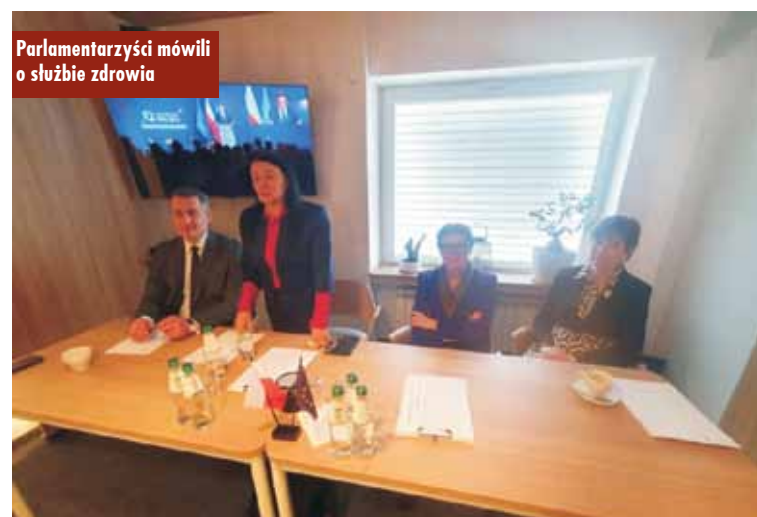
Parlamentarzyści mówili o służbie zdrowia