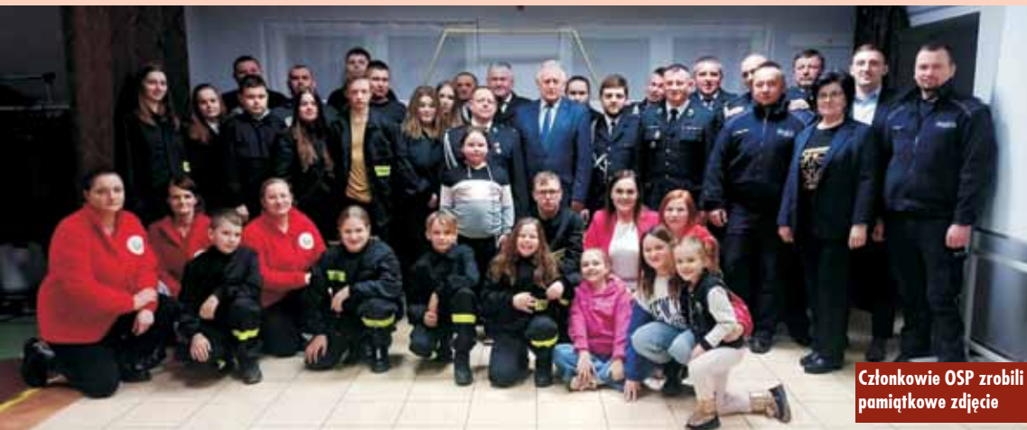
Członkowie OSP zrobili pamiątkowe zdjęcie