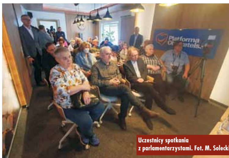
Uczestnicy spotkania z parlamentarzystami.