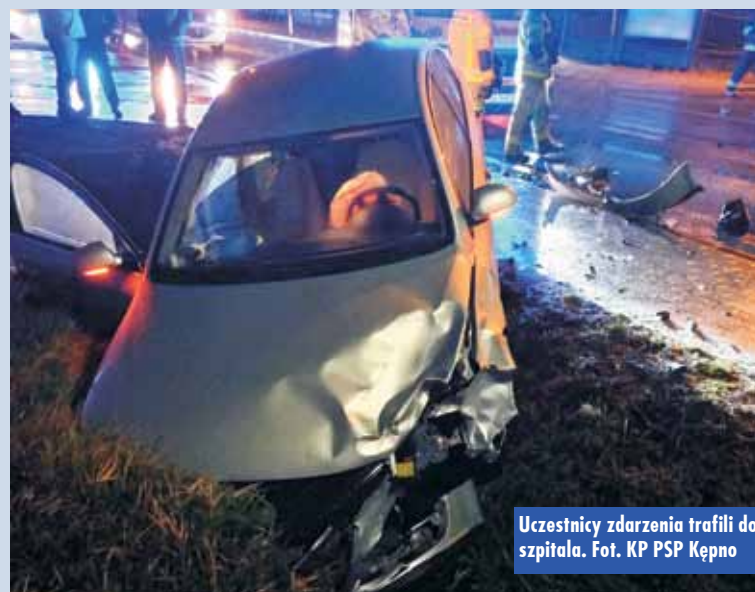
Uczestnicy zdarzenia trafili do szpitala.