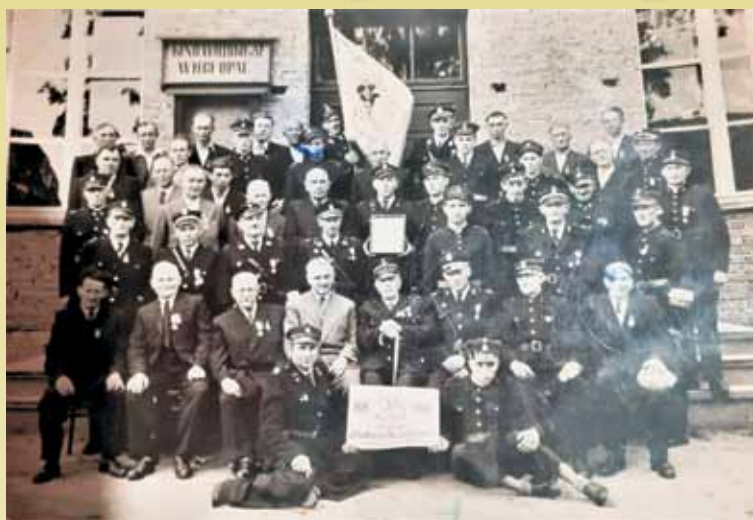
Pamiątkowe zdjęcie OSP Łęka Opatowska przed Domem Kultury

Fundamenty pod budowę Domu Kultury w Łęce Opatowskiej zaczęto kopać w 1955 r., a budowę zakończono w 1957 r. Przy budowie aktywny udział brali mieszkańcy wsi, a w szczególności członkowie Ochotniczej Straży Pożarnej, Koła Gospodyń Wiejskich i innych lokalnych stowarzyszeń. Budynek podpiwniczony zbudowano z czerwonej cegły, kryty był dachówką. Pomieszczenia znajdowały się na parterze i piętrze.