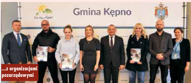
...z organizacjami pozarządowymi

Uczniowski Klub Sportowy „Akademia Piłkarska Reissa” Kępno – zadanie: treningi piłkarskie, udział w rozgrywkach WZPN oraz Wielkopolsko-Lubuskich Lig Piłkarskich dla dzieci i młodzieży z gminy Kępno – kwota dotacji: 45.000,00 zł oraz