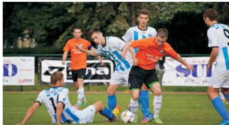
Sokół Kleczew w miażdżący sposób wygrał finał Pucharu Polski w Wielkopolsce. Kępnianie mimo porażki 0:5 i tak mogli schodzić z boiska z podniesionymi głowami. W czerwcu 2014 roku okazało się, że to, co przed startem pucharowego sezonu 2013/2014 wydawało się tylko marzeniem, okazało się faktem.

Mieliśmy bardzo dużo problemów na samym początku. Mam sporo uwag do swoich zawodników o pierwszy kwadrans, bowiem nie potrafiliśmy odpowiednio wejść w ten mecz. Na pewno w pewnym stopniu było to spowodowane zmęczeniem sezonem, który był dla nas bardzo długi i wyczerpujący. W drugiej połowie dzisiejszego spotkania grało nam się już nieco łatwiej bowiem piłkarze Polonii opadli z sił. Cieszę się z tej wygranej bowiem triumf w finale Pucharu Polski jest dla naszej drużyny i klubu udanym zwieńczeniem sezonu.