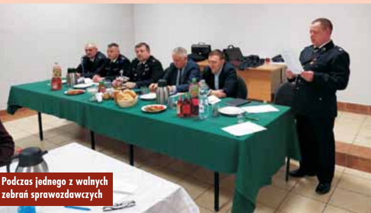
Podczas jednego z walnych zebrań sprawozdawczych