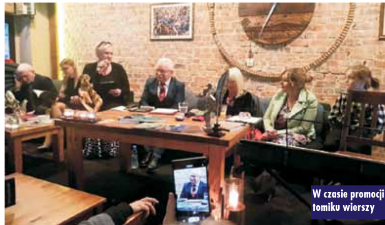
W czasie promocji tomiku wierszy