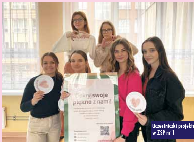
Uczestniczki projektu w ZSP nr 1

jaki sposób dbają o samoakceptację; rozdawałyśmy karteczki z motywującymi hasłami, które angażowały do zastanowienia się nad podejściem do siebie i własnego ciała, a następnie