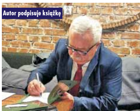
Autor podpisuje książkę

nie poprowadziła Renata Adamska-Garbowska. Oprac. m, R.A-G