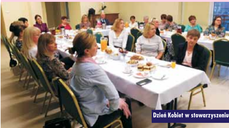
Dzień Kobiet w stowarzyszeniu

Gmina otrzymała dotacje do wyjazdu w ramach programu „Spotkanie z kulturą”