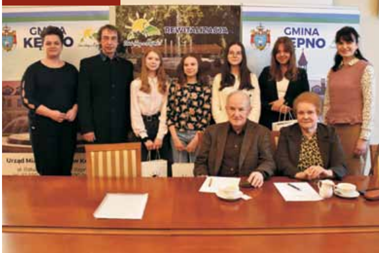
Nagrodzeni uczniowie wraz z komisją konkursową