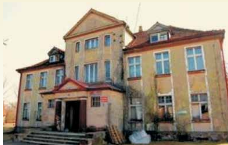
Dwór w Hanulinie w stylu neoklasycystycznym.

Cechy stylu neoklasycystycznego posiada dworek w Hanulinie.