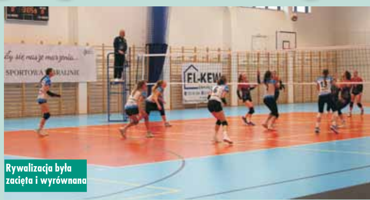
Rywalizacja była zacięta i wyrównana

Zajęcia z udzielania pierwszej pomocy przedmedycznej w Przedszkolu „Kwiaty Polskie” w Bralinie