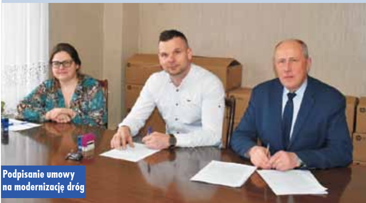
Podpisanie umowy na modernizację dróg