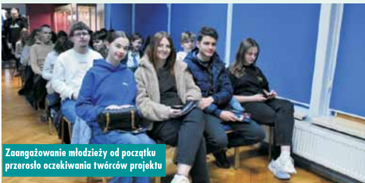
Zaangażowanie młodzieży od początku przerosło oczekiwania twórców projektu