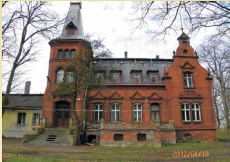
Dwór w Domaninie w stylu eklektycznym.

Dwór w Domaninie to przykład stylu eklektycznego. Wybudowany prawdopodobnie w 1900 r. W