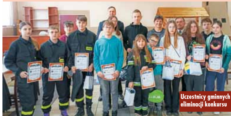
Uczestnicy gminnych eliminacji konkursu