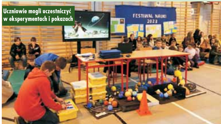
Uczniowie mogli uczestniczyć w eksperymentach i pokazach

IV Targi Edukacyjne w Zespole Szkół im. Ks. Michała Przywary i Rodziny Salomonów w Nowej Wsi Książęcej