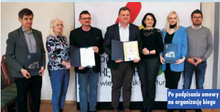
Po podpisaniu umowy na organizację biegu

W piątek, 17 marca br., w sali sesyjnej Starostwa Powiatowego w Kępnie odbyło się podpisanie porozumienia w sprawie Lenart VIII Biegu Ulicznego o Puchar Starosty Powiatu Kępińskiego.