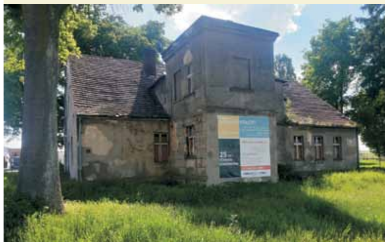
Dworek w Chojęcín - stan obecny.