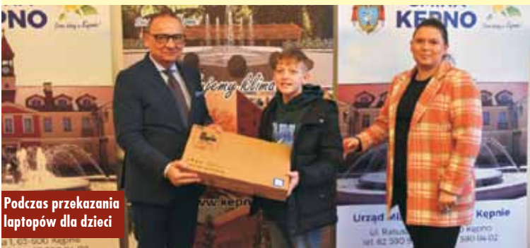
Podczas przekazania laptopów dla dzieci

Walne zebranie sprawozdawcze Kępińskiego Kurkowego Bractwa Strzeleckiego