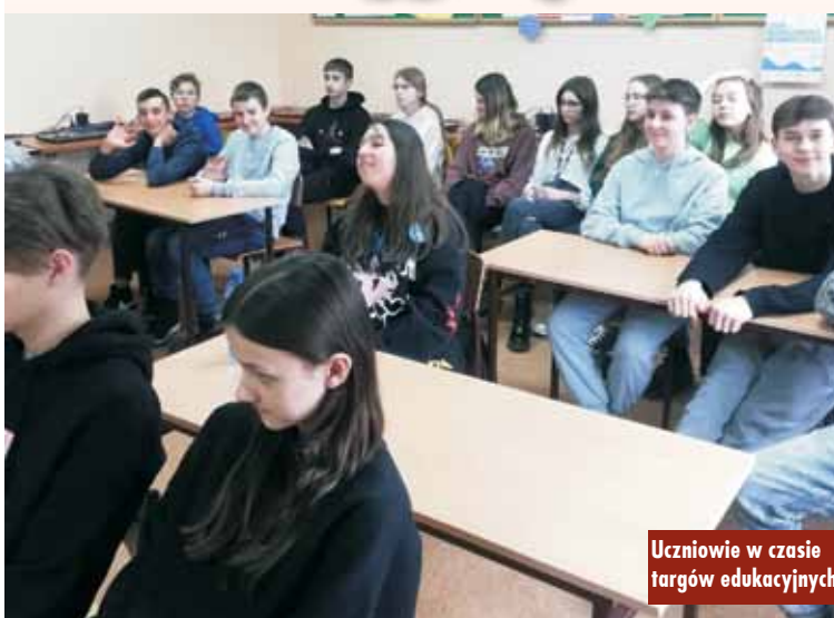
Uczniowie w czasie targów edukacyjnych

14 marca br. w Zespole Szkół im. Ks. Michała Przywary i Rodziny Salomonów w Nowej Wsi Książęcej miały miejsce IV Targi Edukacyjne dla młodzieży. W wydarzeniu udział wzięli przedstawiciele z: Powiatowego Urzędu Pracy w Kępnie, Poradni Psychologiczno-Pedagogicznej w Kępnie, Kuratorium Oświaty w Poznaniu – Delegatura w Kaliszu, Zespołu Szkół Ponadpodstawowych nr 2 w Kępnie oraz Zespołu Szkół Centrum Kształcenia Rolniczego im. Ks.