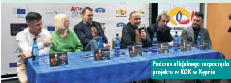
Podczas oficjalnego rozpoczęcia projektu w KOK w Kępnie

Przed nimi ambitne wyzwanie stworzenia autorskiego dzieła w postaci filmu krótkometrażowego. Gospodarzem całej tegorocznej edycji projek-