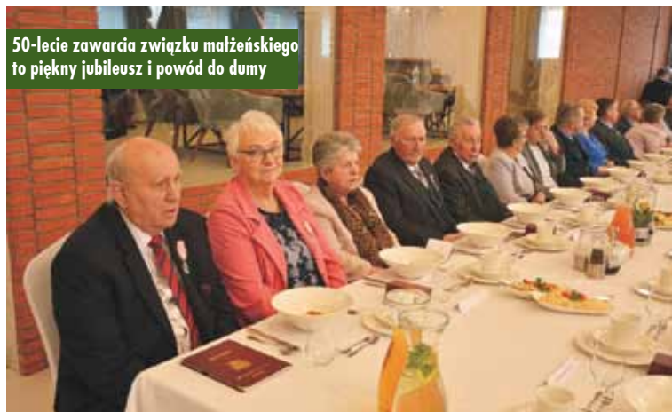
50-lecie zawarcia związku małżeńskiego to piękny jubileusz i powód do dumy

- Jubileusz 50-lecia zawarcia związku małżeńskiego to wielki powód do dumy, satysfakcji oraz łez wzruszenia i szczęścia, które na pewno zakręcają się w państwa oku. Wiem, jakie to ogromne przeżycie dla was i waszych bliskich. Życzę wszystkim państwu zdrowia, bo tego nigdy nie za dużo, pomyślności oraz oby czas, w którym przyjdzie państwu jeszcze żyć, był jak najdłuższy i jak najlepszy oraz by każdy dzień był dla was powodem do dumy i satysfakcji – mówił. Nie zabrakło również tradycyjnej lampki szampana, wspólnych zdjęć, poczęstunku i długich, przyjemnych rozmów.