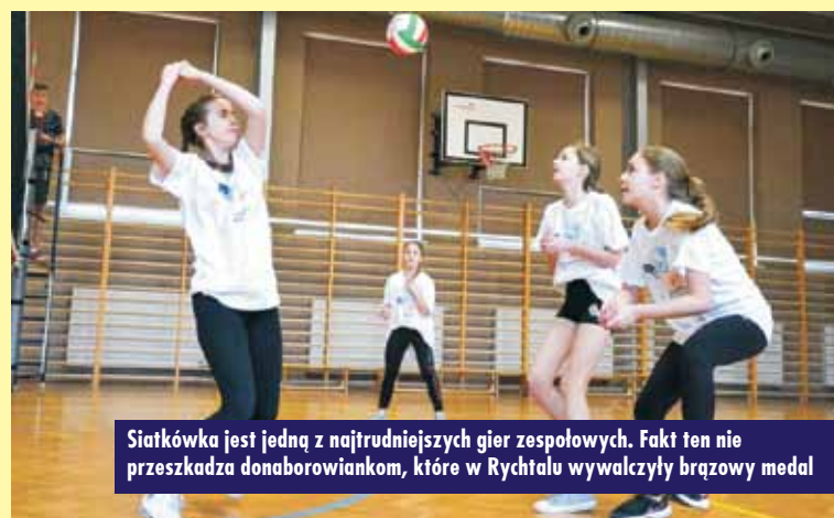
Siatkówka jest jedną z najtrudniejszych gier zespołowych. Fakt ten nie przeszkadza donaborowiankom, które w Rychtalu wywalczyły brązowy medal