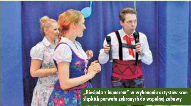
„Biesiada z humorem” w wykonaniu artystów scen śląskich porwała zebranych do wspólnej zabawy