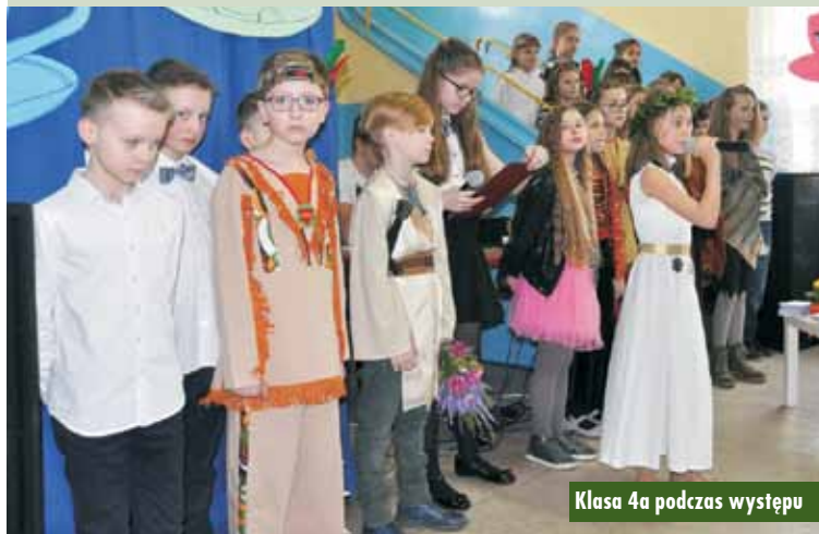
Klasa 4a podczas występu

„Wędrujemy, czyli nasze stopy” – kolejny krok organizacyjny