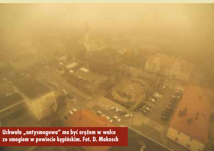
Uchwała „antysmogowa” ma być orężem w walce ze smogiem w powiecie kępińskim.

nych z ich wykorzystaniem, a także paliw, w których udział masowy węgla kamiennego o uziarnieniu poniżej 3 mm wynosi więcej niż 15%.