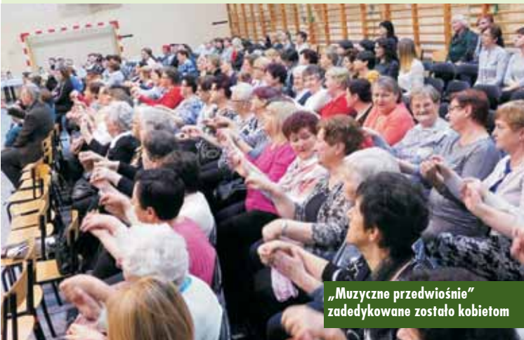
„Muzyczne przedwiośnie” zadekorygowane zostało kobietom

Artyści w czasie koncertu nie tylko śpiewali, ale także czarowali miłymi słowami, od razu zyskując sympatię mieszkanki gminy Trzci-