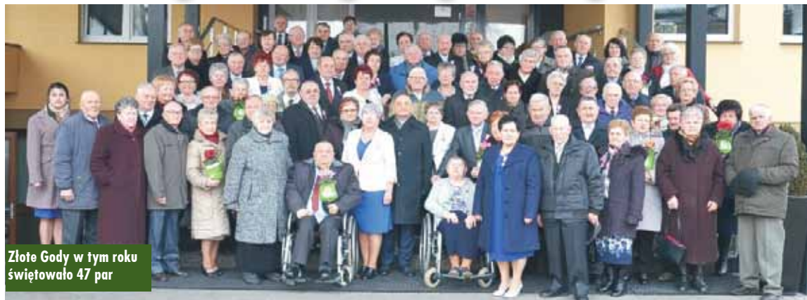
Złote Gody w tym roku świętowało 47 par