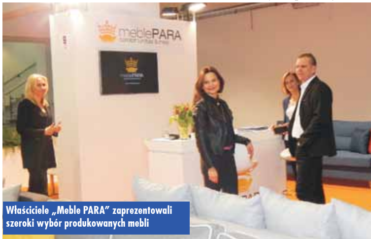
Właściciele „Meble PARA” zaprezentowali szeroki wybór produkowanych mebli

firmy Dig-Net Lenart z Mroczenia - Targi dla wszystkich producentów z naszego regionu są bardzo udane. Firmy już teraz mają dużo pracy, a po targach będą miały jeszcze więcej. Sprzyja to rozwojowi gospodarczemu rodzimych przedsiębiorstw