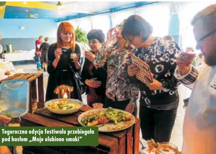
Tegoroczna edycja festiwalu przebiegała pod hasłem „Moje ulubione smaki”

Gimnazjum w Mroczeniu podpisało z miejscowym Kołem Gospodyń Wiejskich.