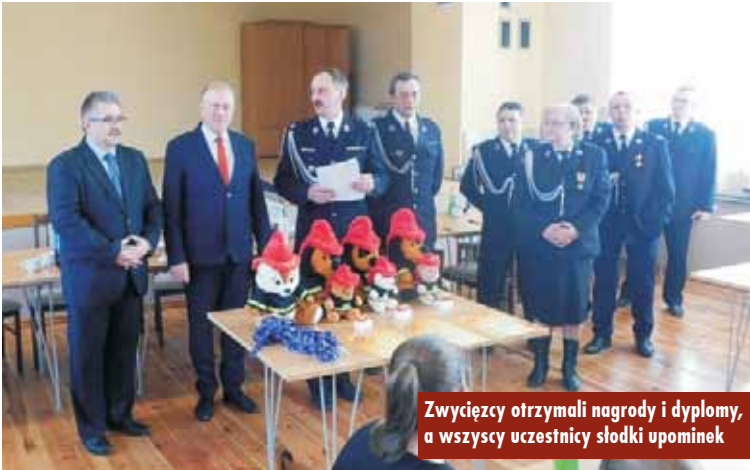
Zwycięzcy otrzymali nagrody i dyplomy, a wszyscy uczestnicy słodki upominek