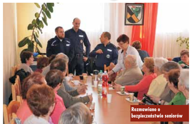
Rozmawiano o bezpieczeństwie seniorów

W Perzowie odbyło się spotkanie członków Polskiego Związku Emerytów, Rencistów i Inwalidów - Koło w Perzowie. W spotkaniu udział wzięli mundurowi z Posterunku Policji w Bralinie, a także profilaktyk Komendy Powiatowej Policji w Kępnie. Z seniorami rozmawiano o szeroko pojętym bezpieczeństwie osób złotej