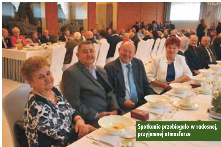
Spotkanie przebiegało w radosnej, przyjemnej atmosferze

5 marca br. 47 par z terenu miasta i gminy Kępno uroczystie świętowało Złote Gody, czyli jubileusz 50-lecia zawarcia związku małżeńskiego. Pięćdziesiąt wspólnie przeżytych lat – obfitujących z pewnością nie tylko w szczęście i pogodę, radosne dni, ale także w trudy i ciężary życia, którym jednak małżonkowie wspólnie stawiają czoła – to piękny jubileusz, a zarazem jedna z najbardziej podniosłych chwil dla małżonków.