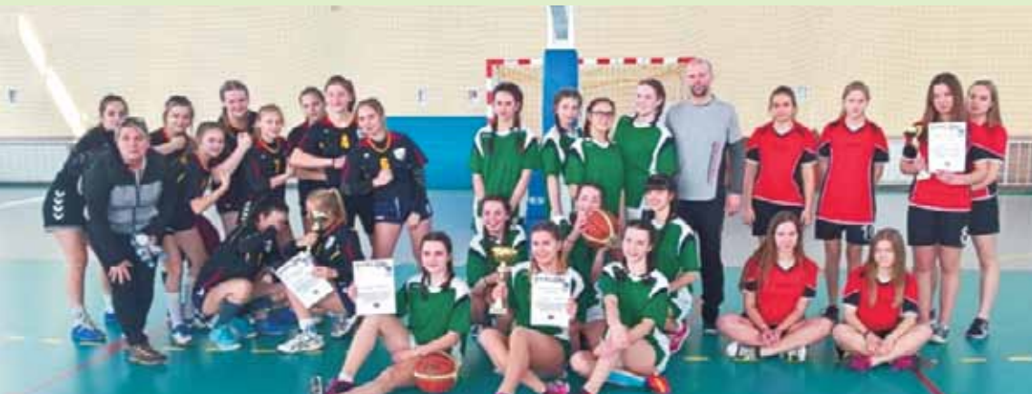
Najlepsze były rychtalanki, drugie miejsce wywalczyły dziewczyny z Trzcinicy, trzecie - z Kępna, a tuż za podium uplasowała się drużyna z Mikorzyna

27 lutego br. w Rychtalu odbył się finał powiatu kępińskiego w koszykówce dziewcząt. Rychtalanki ponownie wygrały wszystkie spotkania i zostały mistrzyniami powiatu. W turnieju, oprócz gospodyń, wzięły udział zawodniczki z Kępna, Trzcinicy i Mroczenia. Mecze rozgrywane były systemem „każdy z każdym”.