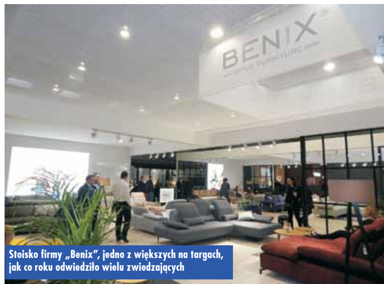
Stoisko firmy „Benix”, jedno z większych na targach, jak co roku odwiedziło wielu zwiedzających

Pierwszego dnia targów „Meble Polska” członkowie Sądu Konkursowego Złotego Medalu Międzynarodowych Targów Poznańskich ogłosili werdykt laureatów zgłoszonych do