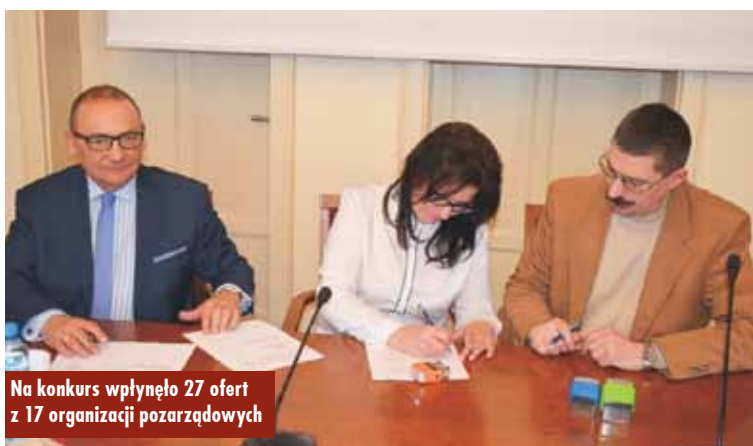
Na konkurs wpłynęło 27 ofert z 17 organizacji pozarządowych