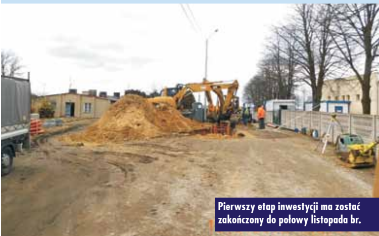
Pierwszy etap inwestycji ma zostać zakończony do połowy listopada br.

8 marca 2018 r. w sali Zespołu Szkół w Trzcinicy już po raz drugi odbyło się spotkanie pod hasłem „Muzyczne przedwiośnie”