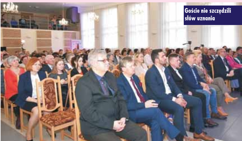
Goście nie szczędzili słów uznania

cja całkowicie zmieniła oblicze sali GOK, która została wyremontowana wraz z zapleczem. Na scenie pojawiła się kurtyna z napędem elektrycznym i nowa dębowa podłoga. Zmodernizowano garderobę, sanitariaty i korytarze. Odnowione zostały ściany, sufity, podłogi, wymienione drzwi. Zamontowano nową wentylację, instalację elektryczną, oświetlenie oraz panele akustyczne. Aby zobrazować skalę inwestycji przygotowana została wystawa zdjęć prezentująca imponującą