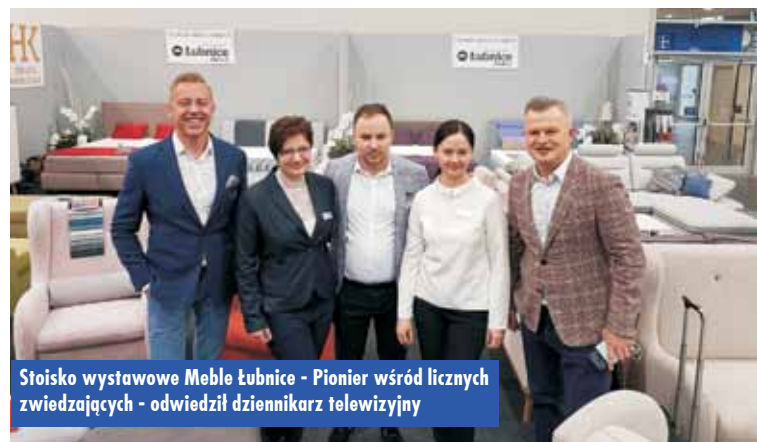
Stoisko wystawowe Meble łubnice - Pionier wśród licznych zwiedzających - odwiedził dziennikarz telewizyjny

grona najważniejszych imprez targowych branży meblowej w Europie. Dla wystawców swoich produktów targi są bardzo dobrą okazją do prezentacji najnowszych propozycji rynkowych wśród kupców meblowych z całego świata. Tegoroczną edycję targową, jak szacują organizatorzy, odwiedziło ponad 20 tysięcy dystrybutorów mebli, z 50 krajów. Edycja 2018, która odbyła się od 6 do 9 marca br., potwierdziła wyjątkową rolę tego wydarzenia, jako jednego z najskuteczniejszych narzędzi promocji eksportu polskiej produkcji meblowej. Jednocześnie dzięki wystawcom poznańskie targi mebli zaliczane są do elitarnego grona najważniejszych imprez targowych branży meblowej w Europie.