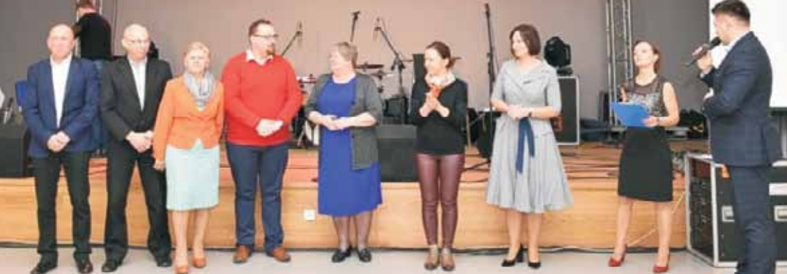
Specjalne życzenia otrzymali w dniu swojego święta sołtysi z terenu gminy Perzów