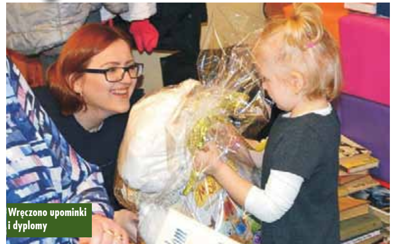
Wręczono upominki i dyplomy

W Bibliotece Publicznej w Perzowie wyłoniono laureatów konkursu czytelniczego „Czytelnik Roku 2017”.