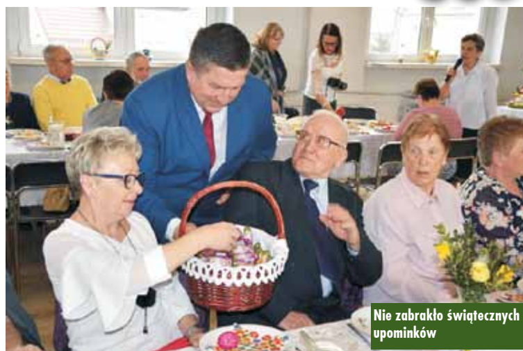
Nie zabrakło świątecznych upominków

sta. Goście z wielką przyjemnością delektowali się tymi tradycyjnymi smakołykami.