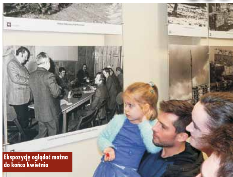
Ekspozycję oglądać można do końca kwietnia