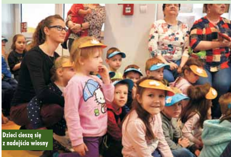
Dzieci cieszą się z nadejścia wiosny

cie na scenie pojawił się spóźniony gość – Wiosna. Dzieci powitały ją z ogromną radością.