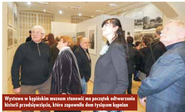
Wystawa w kępińskim muzeum stanowiąca początek odtwarzania historii przedsięwzięcia, które zapewniło dom tysiącom kępnian

nego Spółdzielni Mieszkaniowej w Kępnie. Początkowo zdjęcia miałem po prostu umieścić na poświęconym historii naszego miasta portalu www.kepnosocjum.pl . Będąc jednak pod wrażeniem tego, co na zdjęciach zobaczyłem: dzieciństwa, dorastania, budowania nie tylko bloków, ale i rodzinnych i sąsiedzkich więzi,