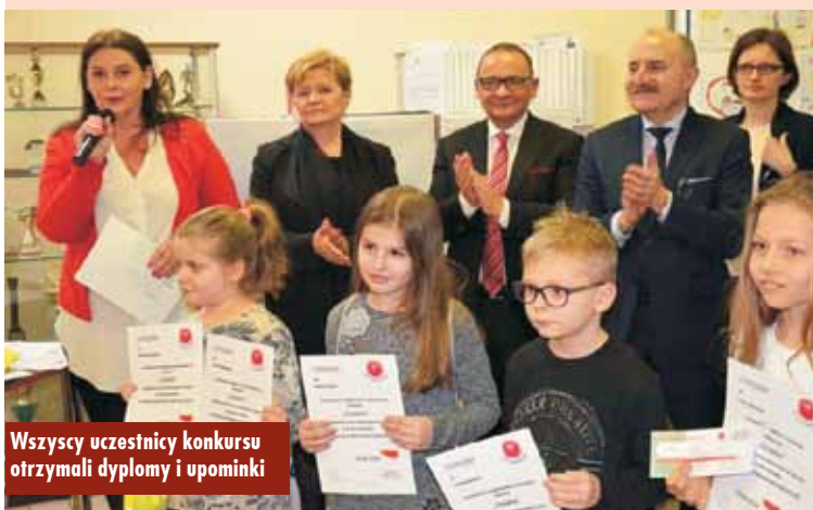
Wszyscy uczestnicy konkursu otrzymali dyplomy i upominki