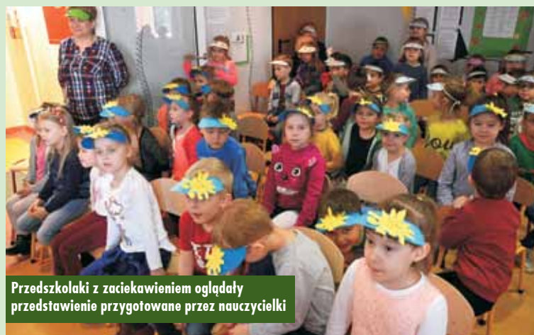
Przedszkolaki z zacięciem oglądały przedstawienie przygotowane przez nauczycielki

21 marca br. w Przedszkolu Samorządowym nr 2 w Kępnie jakoś weselej, więcej słońca i kolorów... To wiosna zawitała! Dzieci przystroiły głowy kolorowymi daszkami, przygotowały piosenkę i wybrały się pięknym korowodem na spacer w poszukiwaniu wiosny. Ale wcześniej – niespodzianka: na przedszkolnej scenie odbyło się wiosenne przedstawienie. Dwoje reporterów postanowiło przeprowadzić akcję poszukiwania wiosny. Kolejno rozmawiali ze słoneczkiem, bocianem, żabkami, kwiatami... i nie domyślili się, że to właśnie były oznaki wiosny. Wresz-