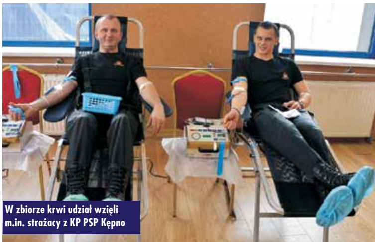
W zbiorze krwi udział wzięli m.in. strażacy z KP PSP Kępno

Administracji oraz – od bieżącego roku – Ministerstwa Obrony Narodowej. W tym roku więc, poza służbami podległymi MSWiA, udział w akcji wzięli również żołnierze. Do honorowego oddawania krwi zaproszono także osoby cywilne.