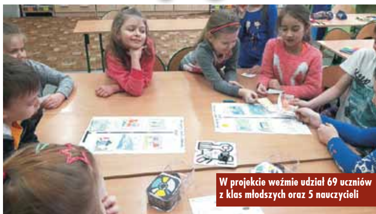
W projekcie weźmie udział 69 uczniów z klas młodszych oraz 5 nauczycieli

W projekcie weźmie udział 69 uczniów z klas młodszych oraz 5 na-