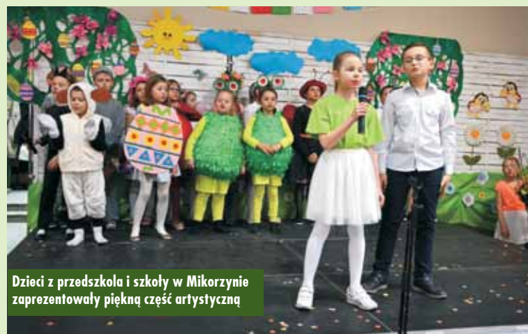
Dzieci z przedszkola i szkoły w Mikorzynie zaprezentowały piękną część artystyczną

utowane przez panie z KGW, a także pobłogosławił zebranych i złożył im życzenia. - Śniadanie wielkanocne ma wymiar religijny, bo gdyby Chrystus nie zmartwychwstał, nie byłoby tego śniadania. W tym roku przeżywamy i świętujemy to wielkie wy-