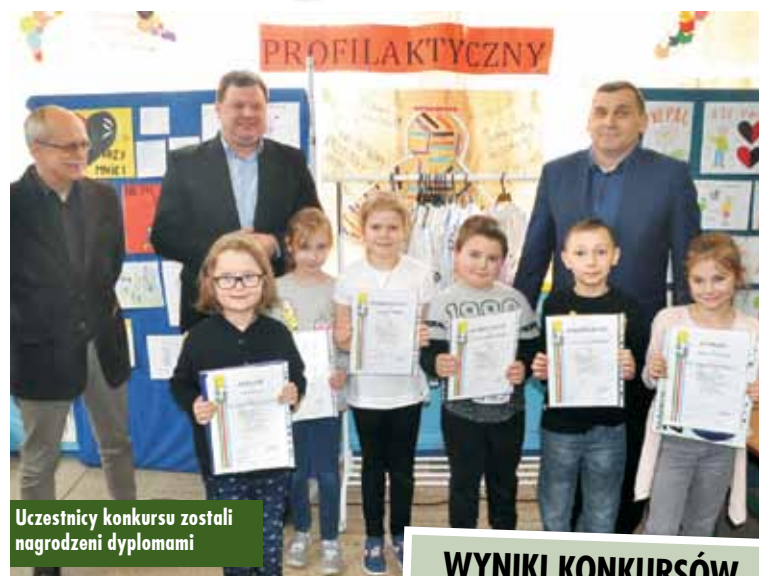
Uczestnicy konkursu zostali nagrodzeni dyplomami