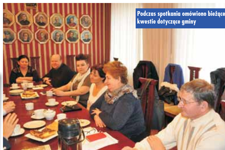
Podczas spotkania omówiono bieżące kwestie dotyczące gminy

MECHANIKA - BLACHARSTWO SAMOCHODOWE EXPORT - IMPORT WIESŁAW WALOSZCZYK