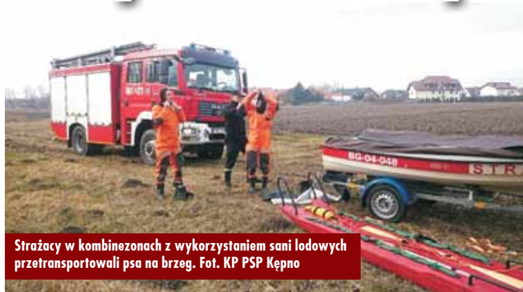
Strażacy w kombinezonach z wykorzystaniem sani lodowych przetransportowali psa na brzeg.

11 marca br., o godz. 8.54, do Stanowiska Kierowania Komendanta Powiatowej Państwowej Straży Pożarnej w Kępnie wpłynęło nietypowe zgłoszenie, dotyczące psa, który znalazł się na krze częściowo zamrożonego akwenu wodnego przy ul. Andersa w Kępnie. - Po dotarciu na miejsce zdarzenia strażacy zastali psa, który znajdował się około 15 m od brzegu i nie potrafił sam zejść na brzeg, pode-