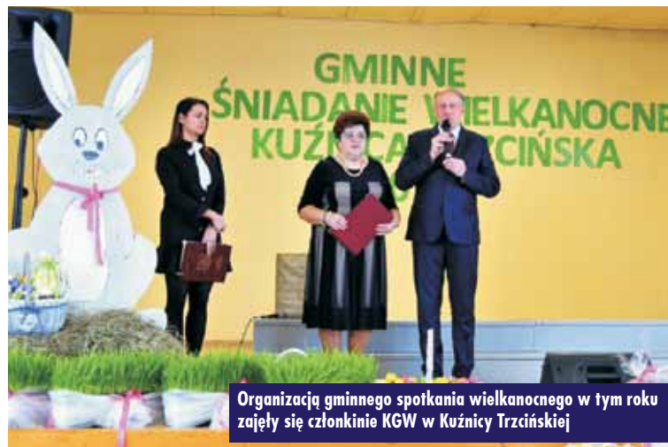
Organizacją gminnego spotkania wielkanocnego w tym roku zajęły się członkinie KGW w Kuźnicy Trzcinińskiej