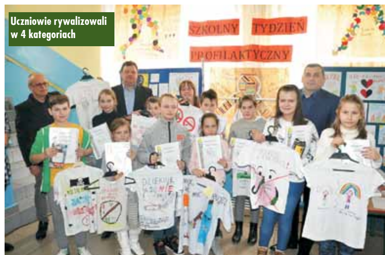
Uczniowie rywalizowali w 4 kategoriach