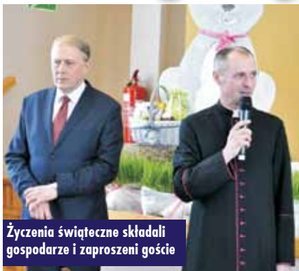
Życzenia świąteczne składali gospodarze i zaproszeni goście