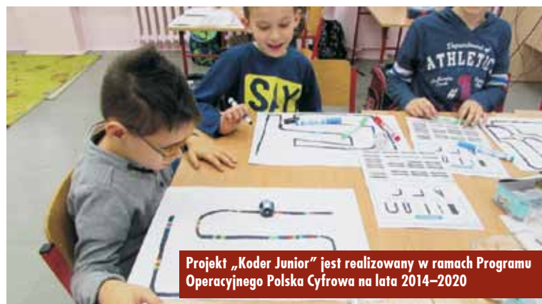
Projekt „Koder Junior” jest realizowany w ramach Programu Operacyjnego Polska Cyfrowa na lata 2014-2020

Projekt „Koder Junior” jest realizowany w ramach Programu Operacyjnego Polska Cyfrowa na lata 2014-2020, Działanie 3.2 Innowacyjne rozwiązania na rzecz aktywizacji cyfrowej. Działanie to zostało zaplanowane przez Ministerstwo Cyfryzacji oraz Ministerstwo Edukacji Narodowej. Liderem projektu jest Uniwersytet im. Adama Mickiewicza w Poznaniu, a partnerami projektu Poznańskie Centrum Superkomputerowo-Sieciowe oraz Fundacja Pro Cultura. Oprac. bem