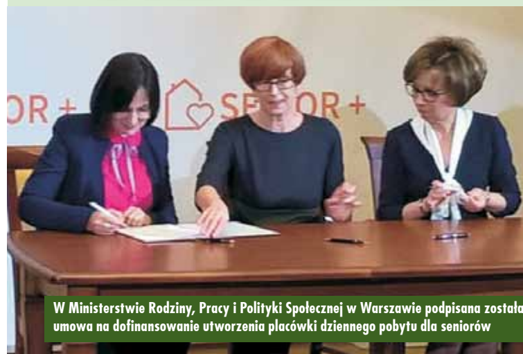
W Ministerstwie Rodziny, Pracy i Polityki Społecznej w Warszawie podpisana została umowa na dofinansowanie utworzenia placówki dziennego pobytu dla seniorów