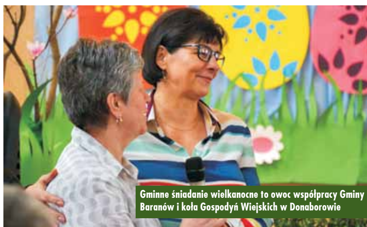
Gminne śniadanie wielkanocne to owoc współpracy Gminy Baranów i koła Gospodyń Wiejskich w Donaborowie

22 marca br. w sali Domu Ludowego w Donaborowie odbyło się gminne śniadanie wielkanocne. Wydarzenie stało się okazją do spotkania się przedstawicieli różnych grup tworzących naszą małą ojczyznę (m.in. samorząd, radni, szkoły, sołtysi, organizacje społeczne, przedstawiciele klubów sportowych, druhowie z Ochotniczych Straży Pożarnych, przedstawiciele organizacji pozarządowych, Koła Gospodyń Wiejskich, księża) i złożenia życzeń. Śniadanie pełni również funkcję podtrzymania tradycji regionalnych. Zaproszenie