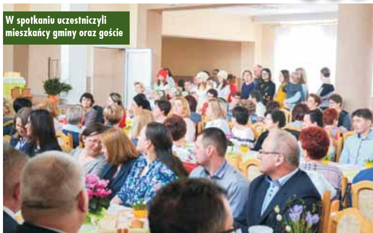
W spotkaniu uczestniczyli mieszkańcy gminy oraz goście

do wspólnego świętowania przyjęli znamienici goście.