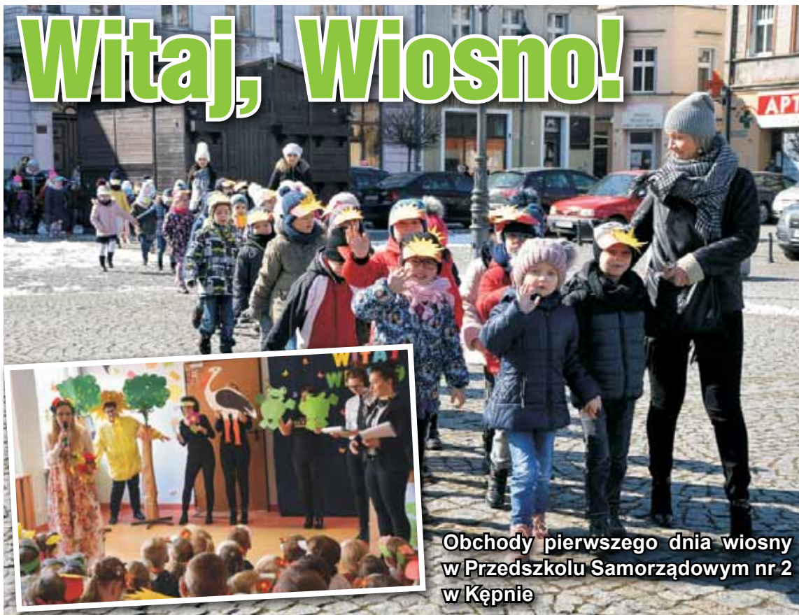
Obchody pierwszego dnia wiosny w Przedszkolu Samorządowym nr 2 w Kępnie

21 marca br. w Przedszkolu Samorządowym nr 2 w Kępnie jakoś weselej, więcej słońca i kolorów... To wiosna zawitała! Dzieci przystroiły głowy kolorowymi daszkami, przygotowały piosenkę i wybrały się pięknym korowodem na spacer w poszukiwaniu wiosny. Ale wcześniej – niespodzianka: na przedszkolnej scenie odbyło się wiosenne przedstawienie. Dwoje reporterów postanowiło przeprowadzić akcję poszukiwania wiosny. Kolejno rozmawiali ze słoneczkiem, bocianem, żabkami, kwiatami... i nie domyślili się, że to właśnie były oznaki wiosny. Wresz-