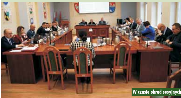
W czasie obrad sesyjnych

(budynek PCPR w Kępnie i budynek główny ZSP nr 2 w Kępnie) – 2.616.324 zł; zakup wyposażenia i sprzętu medycznego dla Oddziału Lecznico-Rehabilitacyjnego w Grębaninie oraz remont i modernizacja Domu Pomocy Społecznej w Rzetni – 5.300.000 zł; modernizacja zabytkowych budynków: LO nr I im. mjr. H. Sucharskiego w Kępnie i Oddziału Lecznico-Rehabilitacyjnego w Grębaninie 4.000.000 zł; budowa windy osobowo-towarowej w zabytkowym budynku Oddziału Lecznico-Rehabilitacyjnego w Grębaninie – 500.000 zł; wykup nieruchomości pod budowę dróg, ścieżek rowerowych lub chodników – 733.653 zł. Administracja publiczna – 230.000 zł; moderni-