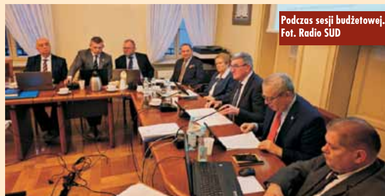
Podczas sesji budżetowej.

Projekt budżetu został pozytywnie zaopiniowany przez Regionalną Izbę Obrachunkową oraz wszystkie komisje stałe Rady Miejskiej, a radni zaaprobowali go jednogłośnie.