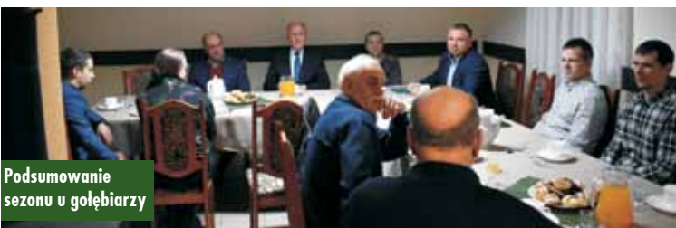
Podsumowanie sezonu u gołębiarzy