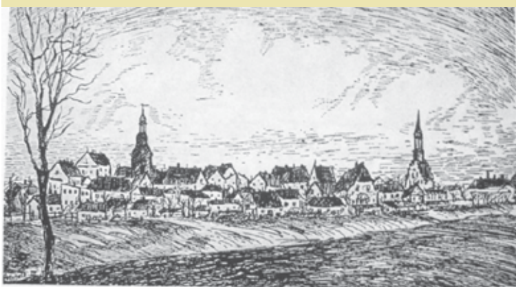
Abb. 118a: Das verlorene Reichthal.