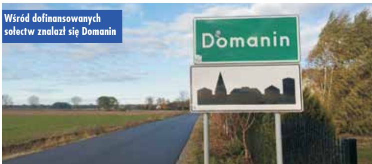
Wśród dofinansowanych sołectw znalazł się Domanin