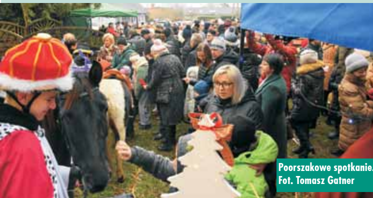
Poorszakowe spotkanie.

Orszak był przepięknym, jednozącym ludzi wydarzeniem. Zapom-