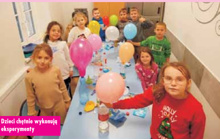
Dzieci chętnie wykonują eksperymenty

nie zdobywa nowe doświadczenia oraz rozwija ważne umiejętności, takie jak: obserwacja, analiza czy wnioskowanie.