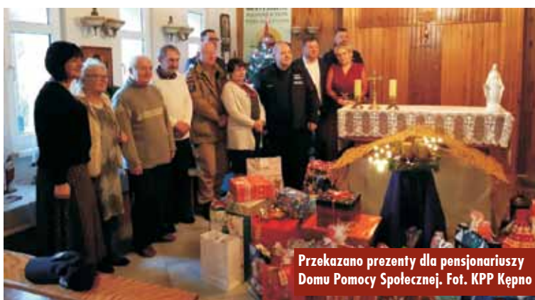
Przekazano prezenty dla pensjonariuszy Domu Pomocy Społecznej.

Zakończyła się renowacja stolarki drzwiowej w budynku Szkoły Podstawowej nr 1 w Kępnie