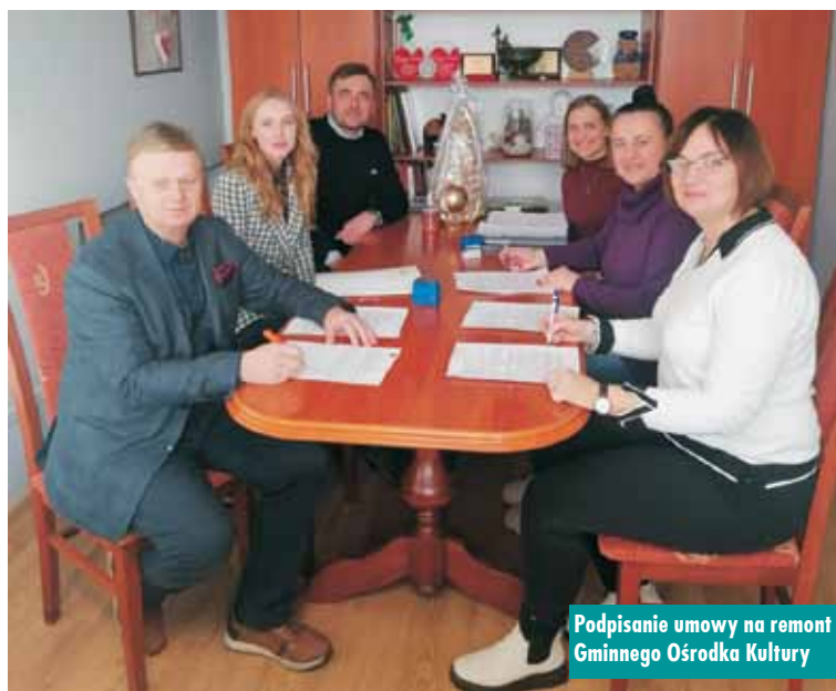
Podpisanie umowy na remont Gminnego Ośrodka Kultury