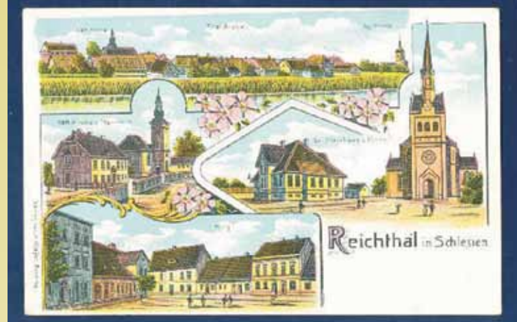
Rychtal przed I wojną światową

Od 1905 r. przygotowywano się do budowy połączenia kolejowego łączącego Namysłów, Rychtal i Kępno. 1 października 1911 r. zakończono budowę pierwszego odcinka linii kolejowej Kępno–Rychtal o długości 27,5 km, od tego momentu było już