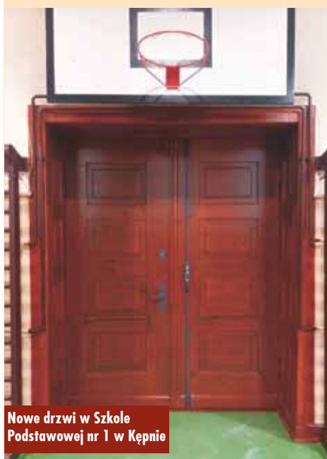
Nowe drzwi w Szkole Podstawowej nr 1 w Kępnie

Edukacja, ochrona środowiska i wzmacnianie roli kobiet w życiu społecznym – to trzy główne obszary, którym chce poświęcić swoją działalność nowa wojewoda Wielkopolski