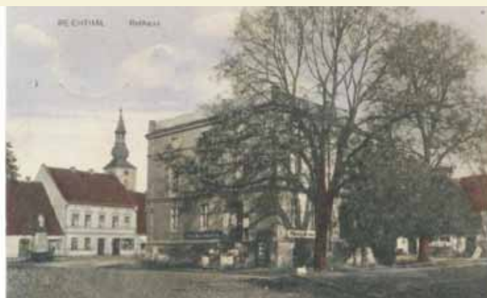
Rynek w Rychtalu

We wtorek, 13 sierpnia 1782 r., podczas królewskiego strzelania w