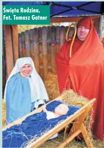
Święta Rodzina.