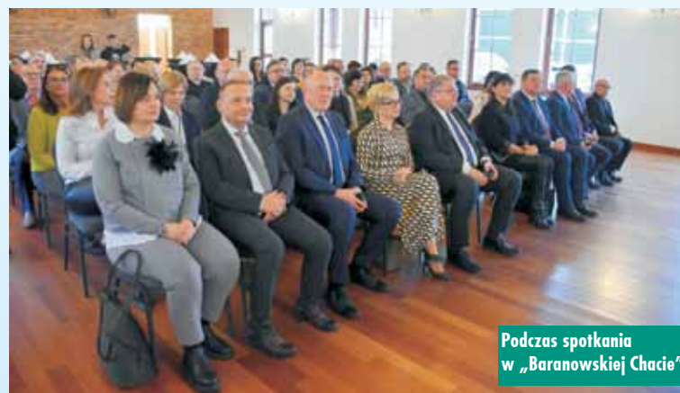
Podczas spotkania w „Baranowskiej Chacie”

łącznie 212 gmin. - To społeczności lokalne decydowały o kształcie strategii, potrzebach do zaspokojenia przy wsparciu środków unijnych. W nowej perspektywie finansowej do dyspozycji są środki europejskie, pochodzące z trzech źródeł: funduszu rolnego, funduszu rozwoju regionalnego i funduszu społecznego. Dzięki temu na dalszy zrównoważony rozwój wielkopolskiej wsi przekazyjemy 128,5 mln euro – podkreślał wicemarszałek. 105.205.000 euro to pula środków, które zostaną przeznaczone na dofinansowanie projektów składanych przez wnioskodawców z