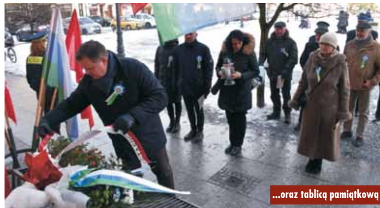
...oraz tablicą pamiątkową

Rocznice uświetniły poczty sztandarowe, a także przejazd jeźdźców w strojach z tamtego okresu oraz uczniowie ze Szkoły Podstawowej nr 3 w Kępnie, którzy w żołnierskich mundurach rozdawali wydaną specjalnie na ten dzień jednodniówkę.