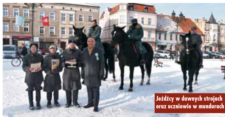
Jeźdźcy w dawnych strojach oraz uczniowie w mundurach