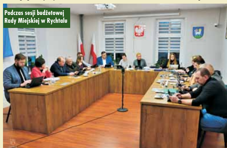
Podczas sesji budżetowej Rady Miejskiej w Rychtalu