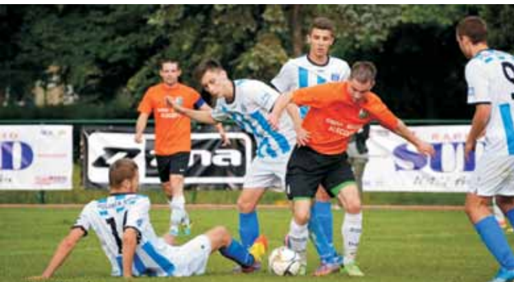
Sokół Kleczew w miażdżący sposób wygrał finał Pucharu Polski w Wielkopolsce. Kępnianie mimo porażki 0:5 i tak mogli schodzić z boiska z podniesionymi głowami. W czerwcu 2014 roku okazało się, że to, co przed startem pucharowego sezonu 2013/2014 wydawało się tylko marzeniem, okazało się faktem.

Mieliśmy bardzo dużo problemów na samym początku. Mam sporo uwag do swoich zawodników o pierwszy kwadrans, bowiem nie potrafiliśmy odpowiednio wejść w ten mecz. Na pewno w pewnym stopniu było to spowodowane zmęczeniem sezonem, który był dla nas bardzo długi i wyczerpujący. W drugiej połowie dzisiejszego spotkania grało nam się już nieco łatwiej, bowiem piłkarze Polonii opadli z sił. Cieszę się z tej wygranej, bowiem triumf w finale Pucharu Polski jest dla naszej drużyny i klubu udanym zwieńczeniem sezonu.