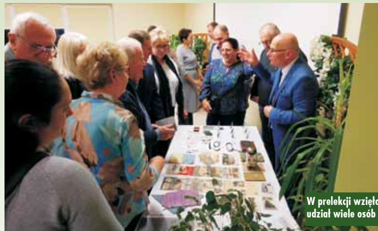
W prelekcji wzięło udział wiele osób