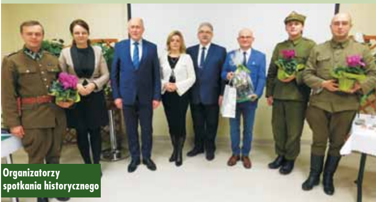
Organizatorzy spotkania historycznego