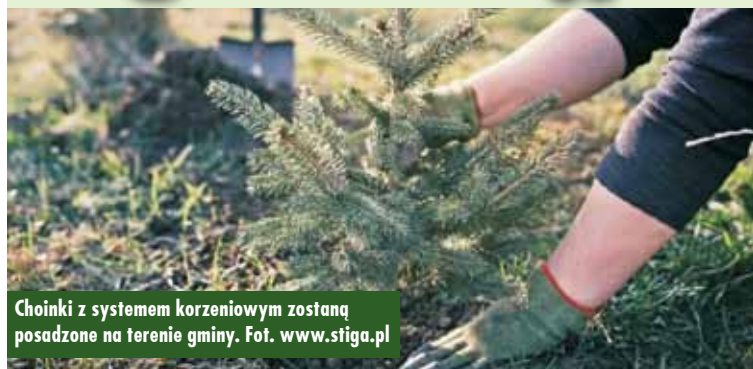
Choinki z systemem korzeniowym zostaną posadzone na terenie gminy.

Akcja „Zakorzeń się w gminie Kępno” polega na poświęconej zbiórce żywych choinek, które przeznaczone zostaną do nasadzeń na terenie gminy Kępno.