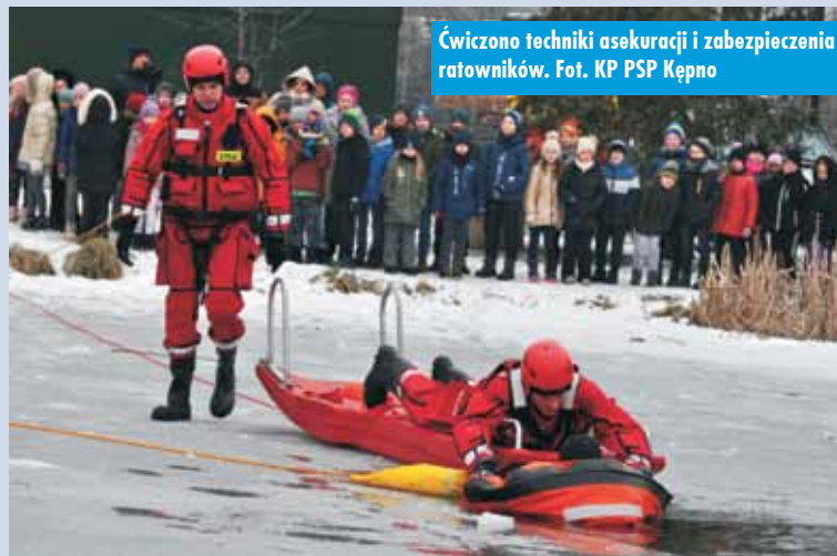
Ćwiczą techniki asekuracji i zabezpieczenia ratowników.

- W kierunku brzegu zawsze poruszaj się w pozycji leżącej, nie wstawaj.