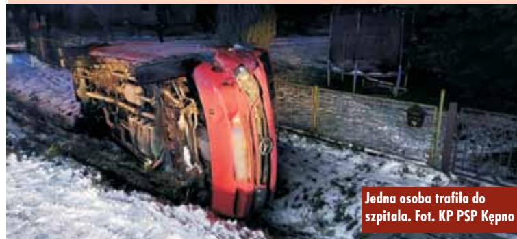
Jedna osoba trafiła do szpitala.