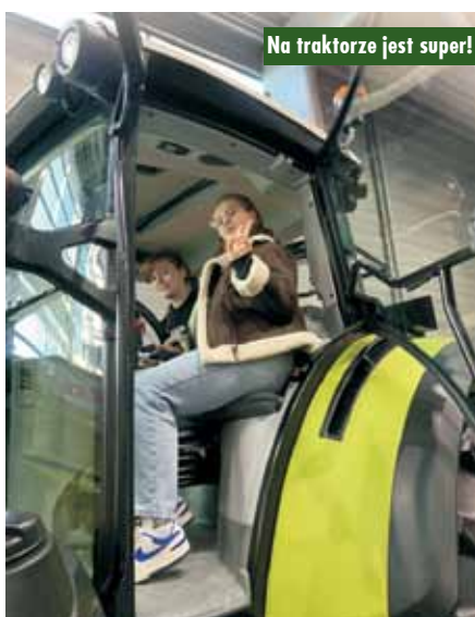
Na traktorze jest super!

Następnie wzięliśmy udział w zapoznaniu się z ofertą wystawców podczas Targów. Nasze