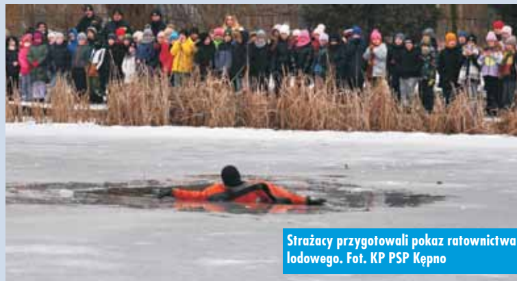
Strażacy przygotowali pokaz ratownictwa lodowego.

- Udzielając pomocy, nie biegnij w kierunku osoby poszkodowanej, ponieważ zwiększasz w ten sposób punktowy nacisk na lód, który może załamać się również pod Tobą. Do tonącego najlepiej zbliżyć się, czołgając po lodzie.