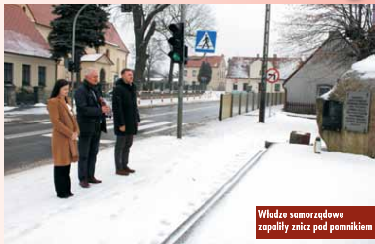
Władze samorządowe zapaliły znicz pod pomnikiem