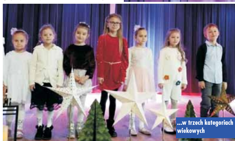
...w trzech kategoriach wiekowych