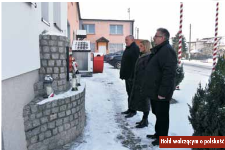
Hold walczącym o polskość

17 stycznia 1920 r. żołnierze 11. Pułku Strzelców Wielkopolskich pod dowództwem pułkownika Stanisława Thiela wmaszerowały do Kępna. Następnego dnia drogą od strony Kępna wkroczyły na teren dzisiejszej gminy Trzcinica oddziały Wojska Polskiego. Na trasie przemarszu wiódł przez Laski, Kuźnicę Trzciń-