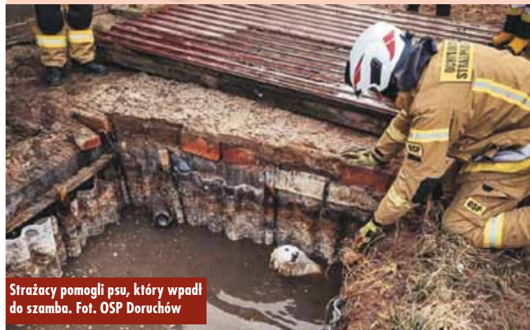
Strażacy pomogli psu, który wpadł do szamba.

26 lutego br. z niecodzienną sytuacją zetknęli się druhowie z Ochotniczej Straży Pożarnej w Doruchowie. Musieli bowiem pospieszyć z pomocą psu, który na jednej z posesji w miejscowości Mieszówka wpadł do szamba i nie potrafił się z niego wydostać. - Strażacy przy pomocy