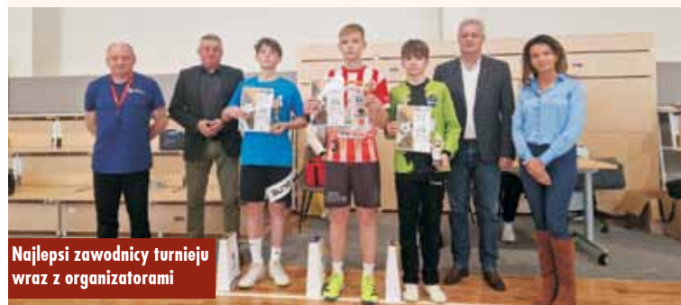
Najlepsi zawodnicy turnieju wraz z organizatorami

XII edycja Biegu Tropem Wilczym w Zespole Szkół w Mroczeniu