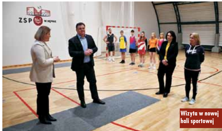
Wizyta w nowej hali sportowej

Niecodzienna akcja druhow z sąsiedniego powiatu – z Ochotniczej Straży Pożarnej w Doruchowie