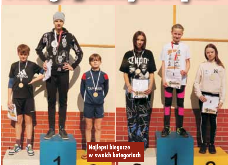
Najlepsi biegacze w swoich kategoriach