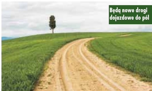
Będą nowe drogi dojazdowe do pól

Samorząd Województwa Wielkopolskiego przeznaczył ponad 22 mln zł na wsparcie dla lokalnych samorządów na prace związane z ochroną, rekultywacją i poprawą jakości gruntów rolnych. Środki umożliwią realizację szeregu zadań związanych z budową lub przebudową dróg dojazdowych do pól, zakupu sadzonek drzew miododajnych, budowy zbiorników małej retencji, zakupu sprzętu i oprogramowania do ewidencji gruntów.