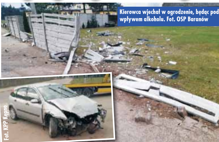
Kierowca wjechał w ogrodzenie, będąc pod wpływem alkoholu.

Do bardzo niebezpiecznego wypadku doszło 10 marca br., w godzinach porannych, w Donaborowie. Samochód osobowy wjechał tam w płotowanie jednej z posesji. Uderzenie było tak silne, że z samochodu wyleciał silnik pojazdu. Na miejsce zostali wysłani funkcjonariusze Posterunku Policji w Łęce Opatowskiej oraz Trzcinicy. Jak się okazało, kierującym samochodem osobowym marki Ford był 27-letni