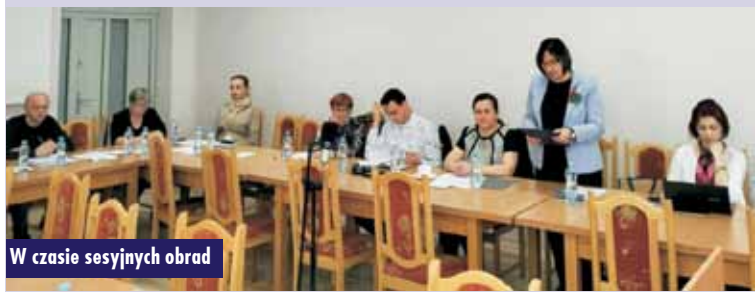
W czasie sesyjnych obrad

Perzów z organizacjami pozarządowymi w 2023 r. oraz sprawozdanie z działalności Gminnego Ośrodka Pomocy Społecznej w Perzowie za