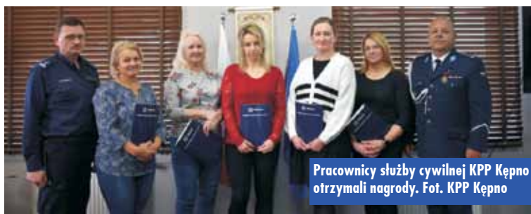
Pracownicy służby cywilnej KPP Kępno otrzymali nagrody.

stych poglądów na różne kwestie życia społecznego. Łączy ich publiczny charakter usług, które świadczą obywatelom. Dzień Służby Cywilnej służy budowie etosu służby oraz