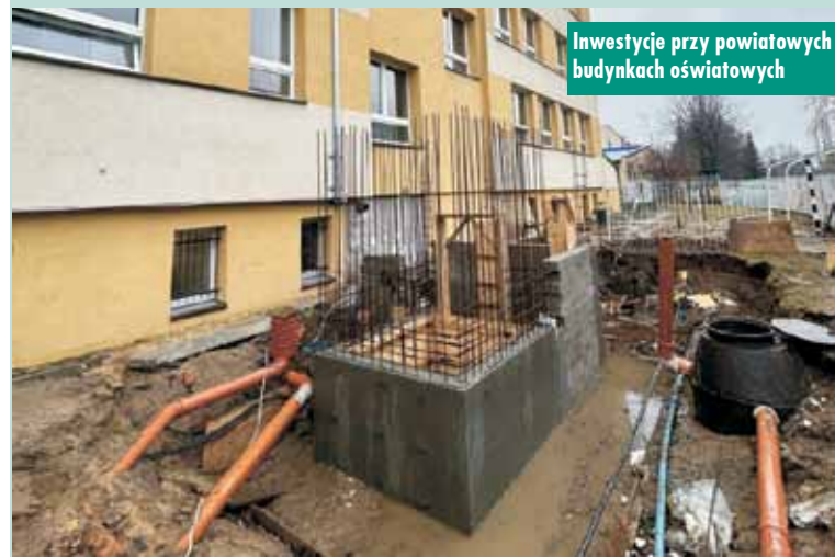
Inwestycje przy powiatowych budynkach oświatowych

Ukradł samochód, a następnie skradzionym samochodem kradł paliwo na stacjach benzynowych. Złodziej zatrzymany przez kępińskich kryminalnych