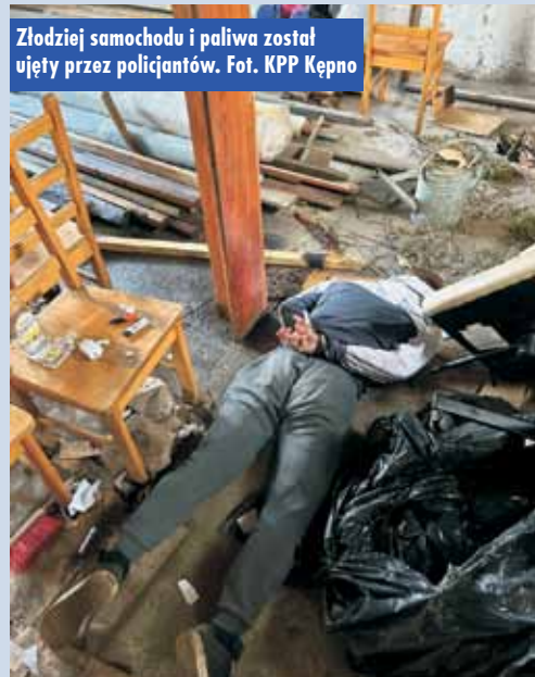
Złodziej samochodu i paliwa został ujęty przez policjantów.

many i osadzony w policyjnym areszcie. Teraz usłyszysz odpowiedni zarzut za kradzież samochodu i odpowie za kilka kradzieży paliwa na pobliskich