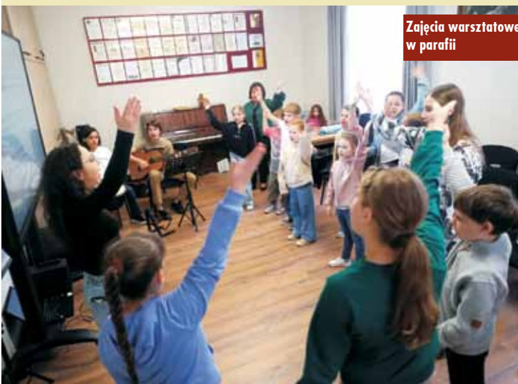
Zajęcia warsztatowe w parafii