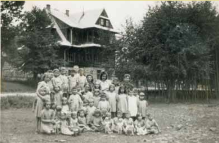
Dzieci z wychowawczyniami przed Willą Orłów, Poronin, druga połowa 1944 r. lub pierwsza połowa 1945 r.