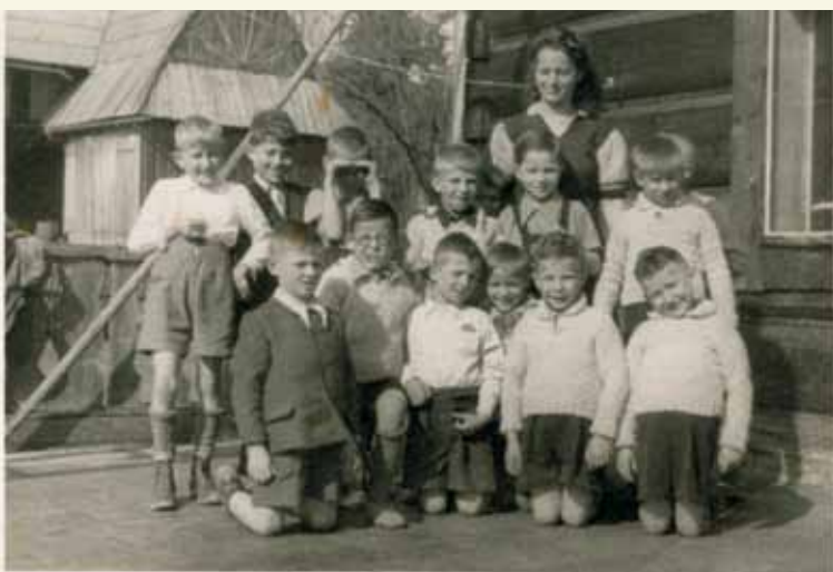
Grupa chłopców z wychowawczyniami przed Willą Orłów, Poronin, pierwsza połowa 1945 r.