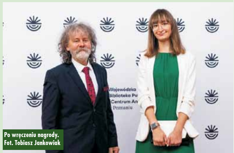
Po wręczeniu nagrody.

które zgłosiły książki do konkursu Literackiej Nagrody Wielkopolskich Czytelników 2024. 10 bibliotek otrzymało nagrody w wysokości