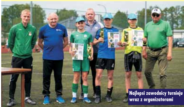
Najlepsi zawodnicy turnieju wraz z organizatorami