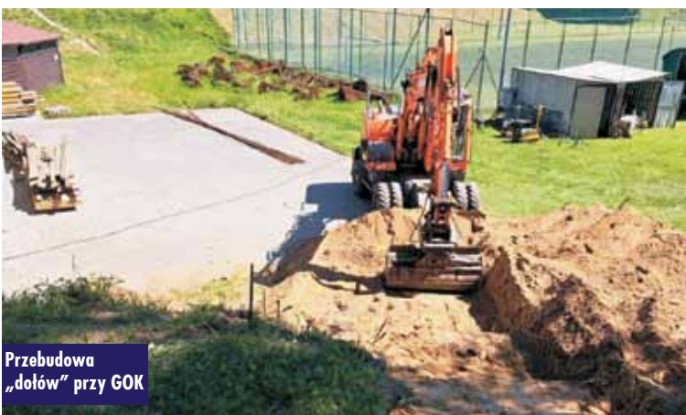
Przebudowa „dołów” przy GOK

Podpisanie umowy na realizację projektu Cyberbezpieczny Samorząd w gminie Perzów