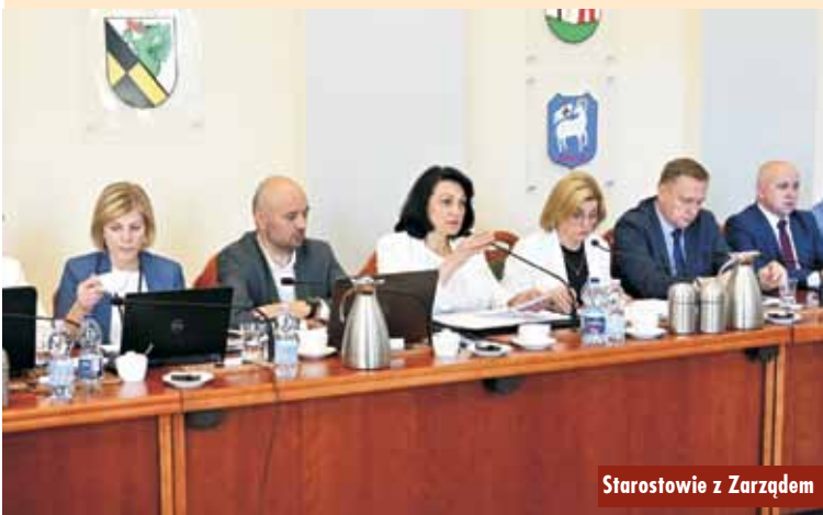
Starostowie z Zarządem