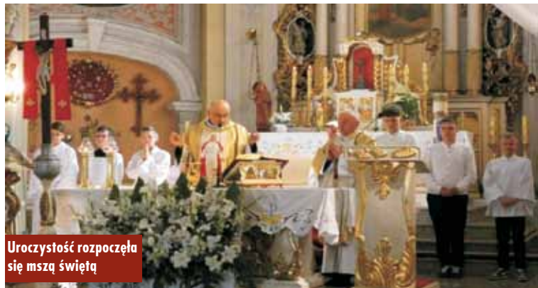
Uroczystość rozpoczęła się mszą świętą

dla całej społeczności szkolnej dzień był poświęcony w całości osobie Jana Pawła II, który od 20 lat jest patronem szkoły.