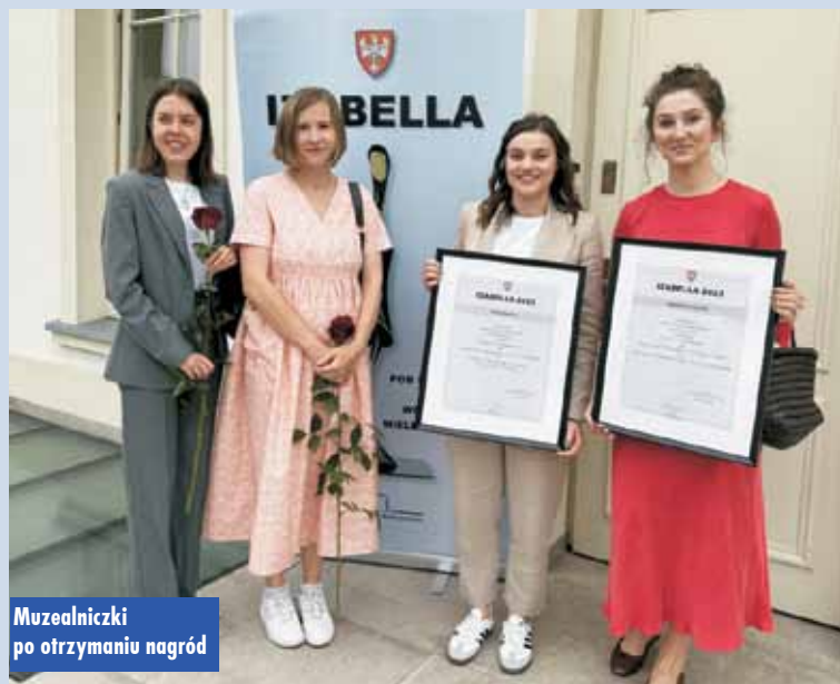
Muzealnicy po otrzymaniu nagród

dla nas przedsięwzięcia, które chcieliśmy bardzo zrealizować. Dodatkowo pozyskałyśmy na te wydarzenia dofinansowania z Fundacji PZU