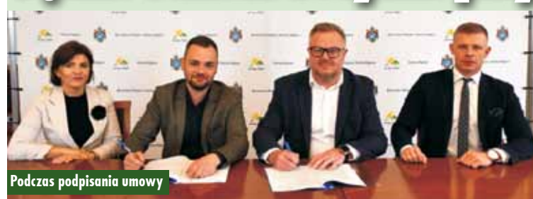
Podczas podpisania umowy

Podpisanie umowy na remont budynku przy ul. Ogrodowej 7 w Kępnie