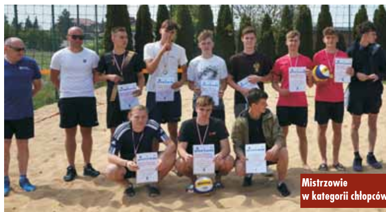
Mistrzowie w kategorii chłopców