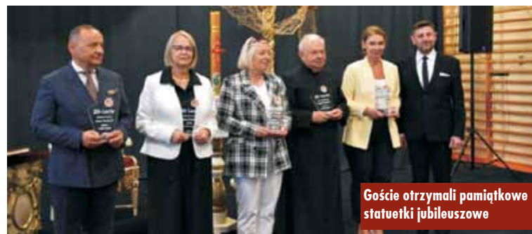
Goście otrzymali pamiątkowe statuetki jubileuszowe

Uroczystość rozpoczęła się od mszy świętej w kościele parafialnym w Mikorzynie, w której wzięli udział uczniowie szkoły, nauczyciele i za-