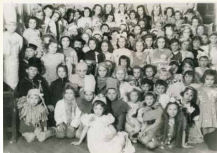
Bal karnawałowy, Willa Baltica, 1946/1947 r. Sopot