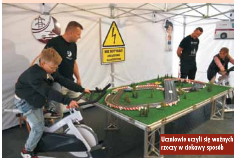
Uczniowie uczyli się ważnych rzeczy w ciekawy sposób

przewodzą zajęcia edukacyjne dla dzieci z klas 1-3 szkół podstawowych, podczas których rozmawiają z dziećmi na temat bezpiecznego zachowania w pobliżu infrastruktury energetycznej i prawidłowego użytkowania urządzeń na prąd. We współpracy z samorządami organizują duże spotkania w mobilnych miasteczkach edukacyjnych. Jedno z nich powstało w kępińskiej szkole. Oprac. KR