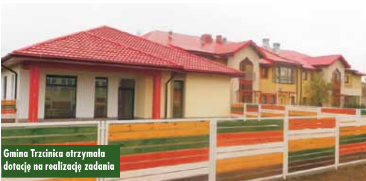
Gmina Trzcينica otrzymała dotację na realizację zadania