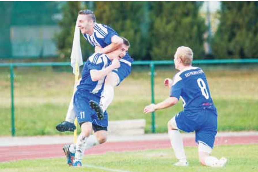
Po jedenastu latach Polonia Kępno wróciła do czwartej ligi w wielkim stylu, nie siedząc cicho, jak na beniaminka bez większego kapitału przystało, tylko rozpychając się lokciami.

Piotrówka, znanego z zatrudniania piłkarzy z Afryki oraz Ameryki Południowej. Problem powstał, kiedy od sezonu 2015/2016 wprowadzono nowe przepisy i na boisku przebywać mógł tylko jeden zawodnik spoza Unii Europejskiej. Polska była bowiem jedynym krajem, gdzie zasady gry piłkarzy spoza Unii Europejskiej nie były do lata 2015 r. uregulowane. Decyzja Polskiego Związku Piłki Nożnej podyktowana była troską o rozwój naszych piłkarzy. A LZS Piotrówka od kilku sezonów stanowił w naszym kraju pewne-