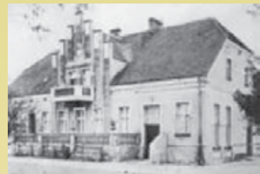
Przy ulicy Kuźniczej mieściła się plebania

plebania, zbudowana jeszcze w czasie zaboru pruskiego w 1911 r. wraz z kaplicą Najświętszego Serca Jezusowego. Do wybuchu II wojny służyła parafianom jako miejsce spotkań różnych organizacji, bractw i stowarzyszeń.