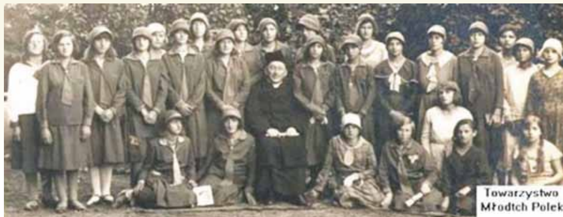
Towarzystwo Młodych Polek

Zespół stacji PKP powstał w latach 1871-1872, gdy Niemcy postanowili wybudować połączenie