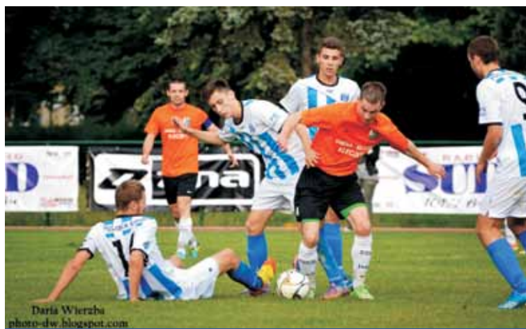
Sokół Kleczew w miazdzący sposób wygrał finał Pucharu Polski w Wielkopolsce. Kępnianie mimo porażki 0:5 i tak mogli schodzić z boiska z podniesionymi głowami. W czerwcu 2014 r. okazało się, że to, co przed startem pucharowego sezonu 2013/2014 wydawało się tylko marzeniem, okazało się faktem.

Mieliśmy bardzo dużo problemów na samym początku. Mam sporo uwag do swoich zawodników o pierwszy kwadrans, bowiem nie potrafiliśmy odpowiednio wejść w ten mecz. Na pewno w pewnym stopniu było to spowodowane zmęczeniem sezonem, który był dla nas bardzo długi i wyczerpujący. W drugiej połowie dzisiejszego spotkania grało nam się już nieco łatwiej bowiem piłkarze Polonii opadli z sił. Cieszę się z tej wygranej bowiem triumf w finale Pucharu Polski jest dla naszej drużyny i klubu udanym zwieńczeniem sezonu.