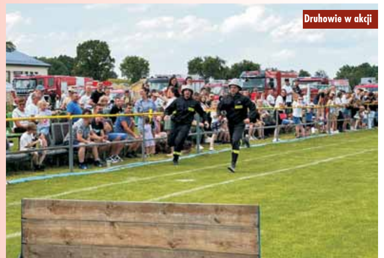
Druhowie w akcji