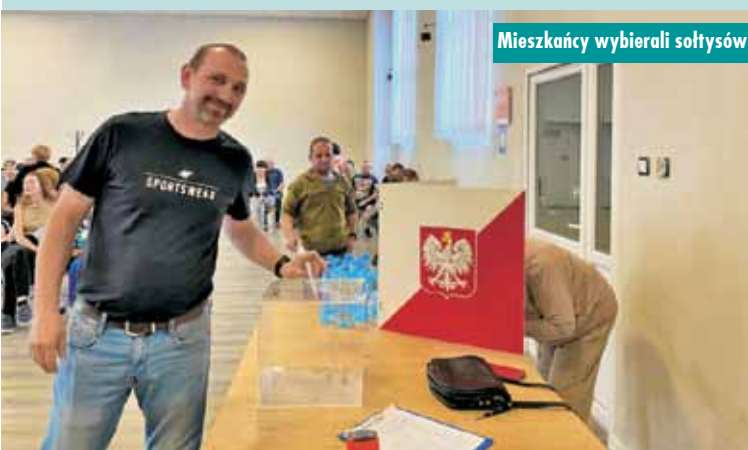
Mieszkańcy wybierali sołtysów

niejszych informacji związanych z pełnieniem funkcji sołtysa. Nowo wybrani sołtysi oraz ci, którzy ponownie objęli swoje stanowiska, mają przed sobą wiele wyzwań i ambitnych planów. Nowe twarze w gminie Rychtal przynoszą ze sobą energię i innowacyjne pomysły, podczas gdy doświadczeni liderzy zapewniają stabilność i kontynuację dotychczasowych inicjatyw. Nadchodząca kadencja 2024-2029 zapowiada się jako okres dynamicznego rozwoju i wzmożonej aktywności na rzecz lokalnych społeczności.