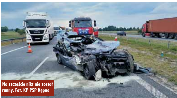
Na szczęście nikt nie został ranny.

Publikujemy cykl fotografii, na których w minionych latach uwiecznieni zostali mieszkańcy naszego regionu. Liczymy na to, że rozpoznają się oni na archiwalnych zdjęciach i napiszą do nas (tel. 62 782 92 84 lub e-mail: tygodnik@kepno.net), za co otrzymają nagrody książkowe.