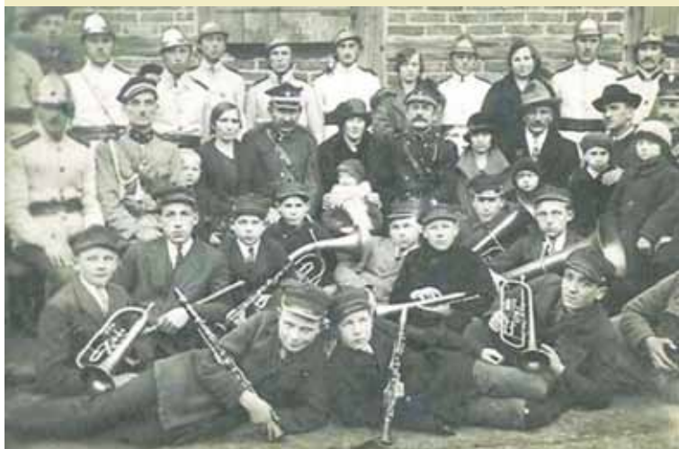
Orkiestra dęta OSP w Podzamczu, lata 30.