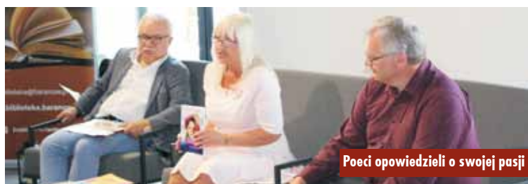
Poeci opowiedzieli o swojej pasji