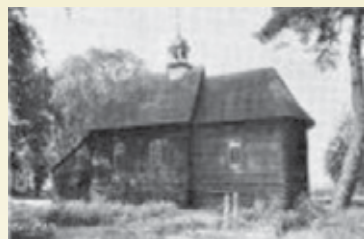
Kościółek św. Rocha

jedynie funkcję kościoła filialnego pełnił kościółek św. Rocha z 1746 r.