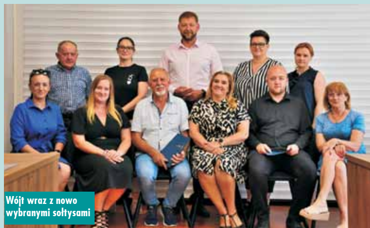
Wójt wraz z nowo wybranymi sołtysami

11 czerwca br. w Urzędzie Miejskim w Rychtalu odbyło się spotkanie z nowo wybranymi sołtysami. Celem spotkania było omówienie najważ-