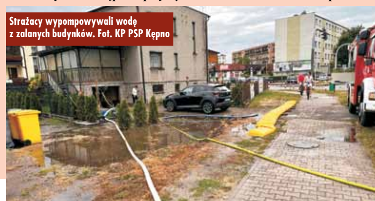
Strażacy wypompowywali wodę z zalanych budynków.