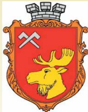
Herb miejscowości Rafałówka (Ukraina)