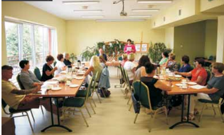
W czasie konferencji