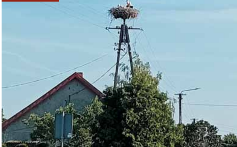
Bociany w Smardzach

Spotkanie organizacyjne w ramach projektu „Brata ratować trzeba – o ludzkich wyborach w obliczu zagłady” Gminnej Biblioteki Publicznej w Trzcinicy