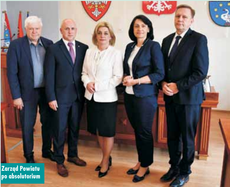
Zarząd Powiatu po absolutorium