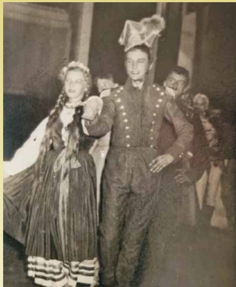
Na balu w szkole średniej

swoją ojczyznę, a nas – za swoich „ciemnizyeli i wrogów”. Także pozostałych mieszkańców żyjących na tych terenach od wieków (Żydów, osadników czeskich i niemieckich) traktowali jak obcy element. Wzmoczenie nastrojów skrajnie nacjonalistycznych nastąpiło w rezultacie, najpierw ukrytej, a z czasem jawnej, propagandy rozwijanej przez OUN (Organizacja Ukraińskich Nacjonalistów). Powstała w 1929 r. w wyniku zjednoczenia radykalnych grup nacjonalistycznych, z czasem – mimo działalności w konspiracji – urosła w siłę, znajdując poparcie w szerokich kręgach społeczeństwa ukraińskiego. Już od 1930 r. przeprowadzała akcje sabotażowo-dywersyjne, skierowane przeciwko władzom polskim, a także społeczeństwu. Siłą rzeczy niepokój wśród Polaków zamieszkujących tereny wschodnie był uzasadniony, a jego nasilenie w okresie wojny – wobec faktów jawnej współpracy nacio-