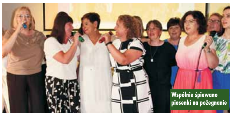
Wspólnie śpiewano piosenki na pożegnanie