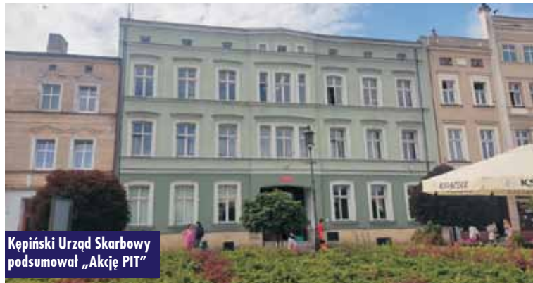
Kępiński Urząd Skarbowy podsumował „Akcję PIT”

Kępińscy milionerzy Dochód wyższy niż 1 milion złotych zadeklarowało 140 podatników z terenu powiatu kępińskiego. Większość „milionerów” (99%) rozlicza dochody w ramach PIT-36L, czyli podatku liniowego. - Statystyki te zbliżone są z ilością złożonych deklaracji o wysokości daniny solidarnościowej DSF-1. Do zapłaty daniny solidarnościowej zobowiązane są osoby fizyczne w przypadku, gdy suma ich dochodów z różnych źródeł przekracza kwotę 1 miliona zł. Do naszego urzędu wpłynęły 142 deklaracje DSF-1. Dla porównania w ubiegłorocznej akcji PIT wśród osób składających zeznania odnotowaliśmy 136 „milionerów” – dodaje R. Stanisławski.