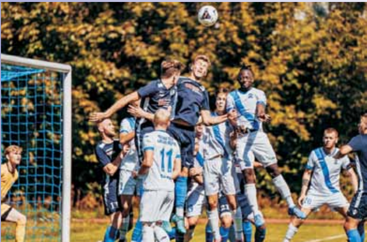
Piłkarze Polonii 1908 Marcinki Kępno po dziesięciu sezonach żegnają się z czwartą ligą. Los ekipy z Alei Marcinkowskiego przesądził wynik sobotniego finału baraży. W następnym sezonie kępniaków czekają derbowe pojedynki z rywalami z Mroczenia, Jankowych czy Łęki Opatowskiej.

we. W każdej z nich wystąpi 16 drużyn. Przypomnijmy, że przed trzema laty Wydział Gier Wielkopolskiego Związku Piłki Nożnej, ze względu na dużą rotację klubów na tym szczeblu rozgrywkowym, dokonał niezwykle istotnych zmian w podziale geograficznym. Wówczas najmniej zmian zaszło w grupie pierwszej, w której zawsze występowały zespoły z północy regionu. W poprzednich sezonach stawkę uzupełniły jeszcze trzy zespoły z Poznania oraz dwóch beniaminków z gminy Swarzędz. Skład grupy drugiej tworzyły po-