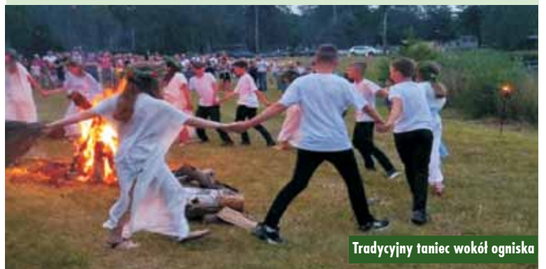
Tradycyjny taniec wokół ogniska

się ono dzięki współpracy szkoły z licznymi organizacjami, do których należą: Stowarzyszenie Absolwentów i Przyjaciół Szkoły „Otwarte Drzwi”, Rada Sołecka, Ochotnicza Straż Pożarna w Mikorzynie, LZS Mikorzyn, Stowarzyszenie „Mikora” oraz Koła Gospodyń Wiejskich z: Mikorzyna, Domanina i Mechnic. Całość projektu sfinansowana została przez Urząd Miasta i Gminy w Kępnie.