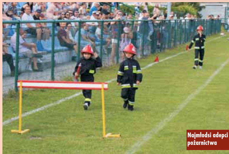
Najmłodsi adepci pożarnictwa