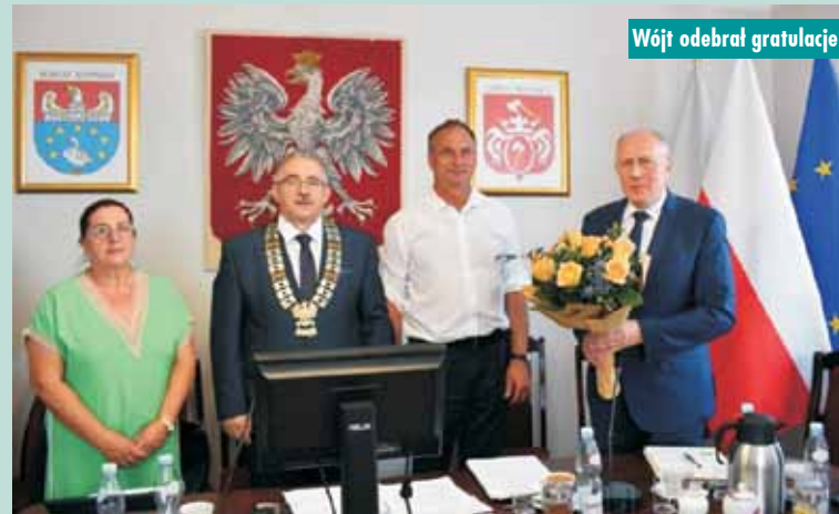
Wójt odebrał gratulacje

Radni podjęli także uchwały w sprawie zmian w budżecie i Wieloletniej Prognozie Finansowej Gminy Trzcinica na lata 2024-2033, które omó-