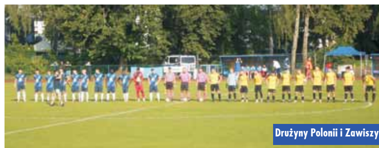
Drużyny Polonii i Zawiszy