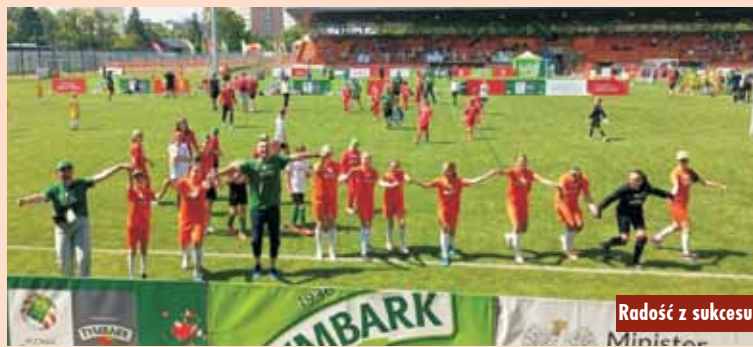
Radość z sukcesu

W rozgrywkach wielkopolskiej czwartej ligi Polonia 1908 Marcinki Kępno przegrała z Polonią 1912 Leszno 0:3, później wygrała z Zawiszą i przegrała z Polonią Golina