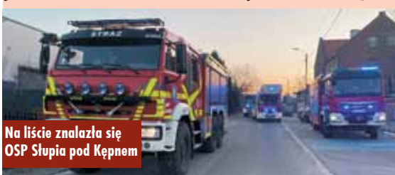
Na liście znalazła się OSP Słupia pod Kępem

podczas pożarów i wypadków. Nowoczesny sprzęt pozwoli na szybszą i bardziej skuteczną pracę druhów z OSP – podkreśliła Komenda