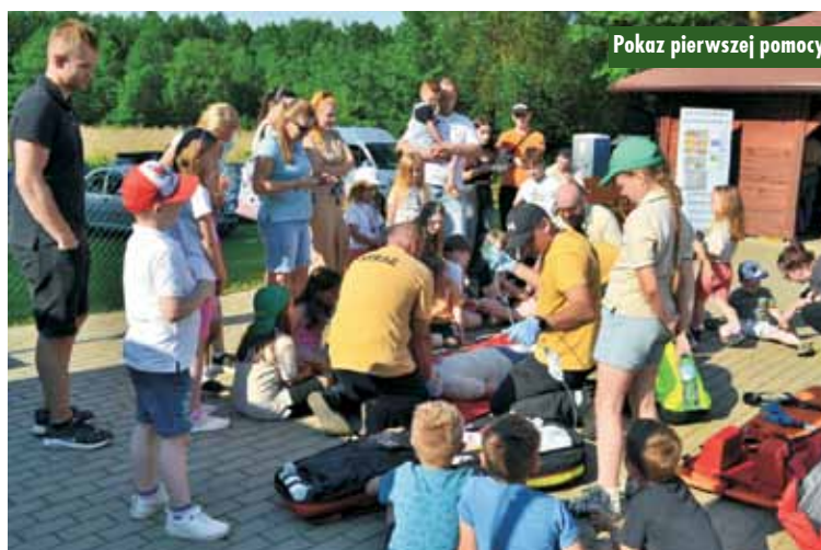
Pokaz pierwszej pomocy

łatwo przygotować z resztek, takich jak pasty kanapkowe czy zapiekanki.