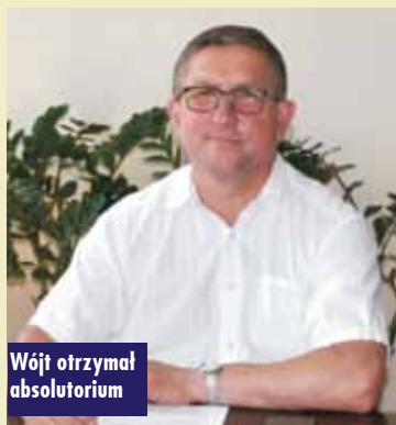
Wójt otrzymał absolutorium