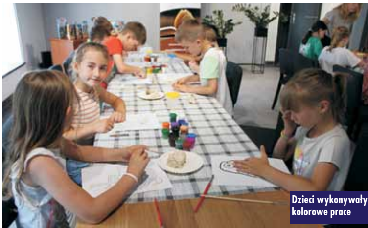
Dzieci wykonywały kolorowe prace