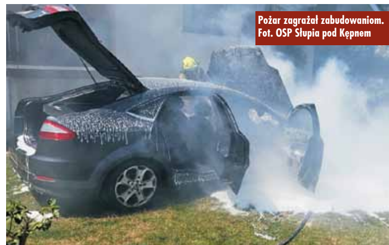
Pożar zagrażał zabudowaniom.