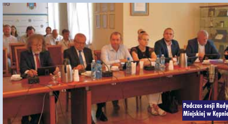
Podczas sesji Rady Miejskiej w Kępnie

Wielkopolsce będzie to pierwsze rondo o takiej nazwie. Będzie to również wizytówka i promocja naszej gminy – podkreślił G. Berski.