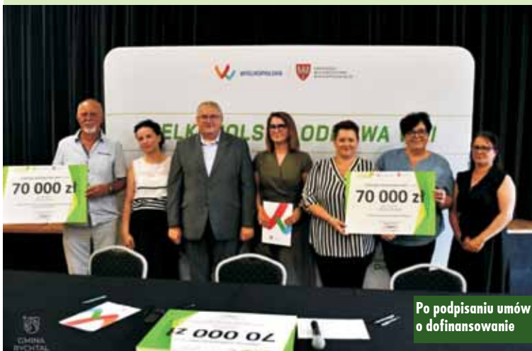
Po podpisaniu umów o dofinansowanie

no na „Remont Domu Ludowego w Kierznie” oraz 42 tysiące złotych dla sołectwa Szklarka Mielecka na projekt „Budowa wiaty grillowej na Szklarce Mieleckiej”. Gminie Perzów przyznano również dofinansowanie na dwa projekty: 48 tysięcy złotych dla sołectwa Trębaczów na projekt „Modernizacja gminnego placu zabaw Wioska Smerfów” oraz 12,4 tysiąca złotych dla sołectwa Zbuczyna na „Remont elewacji świetlicy wiejskiej w Zbuczynie”. Gmina Bralin i sołectwo Gola otrzymały 70 tysięcy złotych na projekt „Modernizacja budynku gminnego w Goli – kiedyś dla sportowców, dzisiaj dla każde-