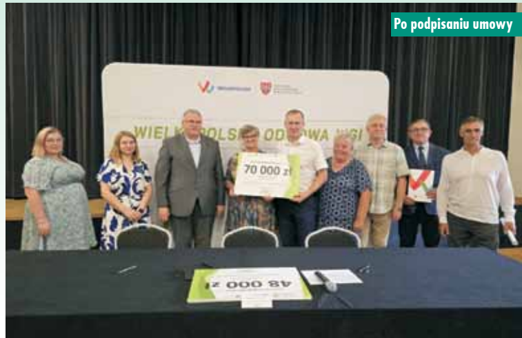
Po podpisaniu umowy