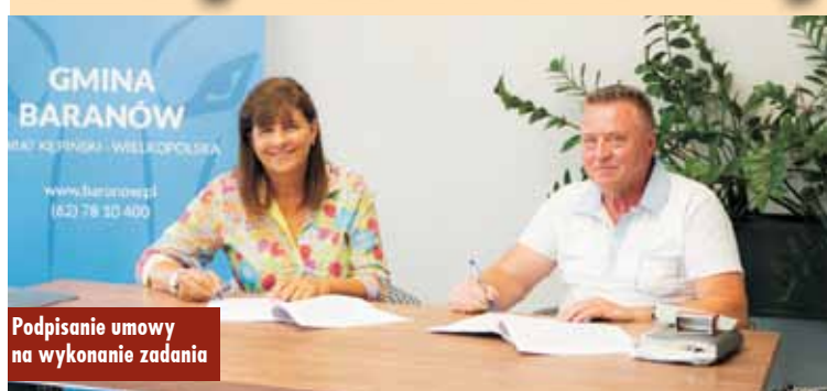
Podpisanie umowy na wykonanie zadania