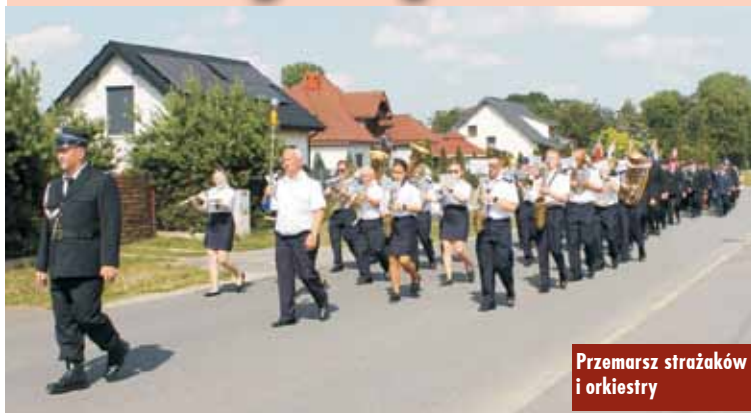
Przemarsz strażaków i orkiestry

29 czerwca br. jednostka Ochotniczej Straży Pożarnej w Kierznie świętowała 95-lecie istnienia. To ważne wydarzenie dla lokalnej społeczności, która od prawie wieku może liczyć na