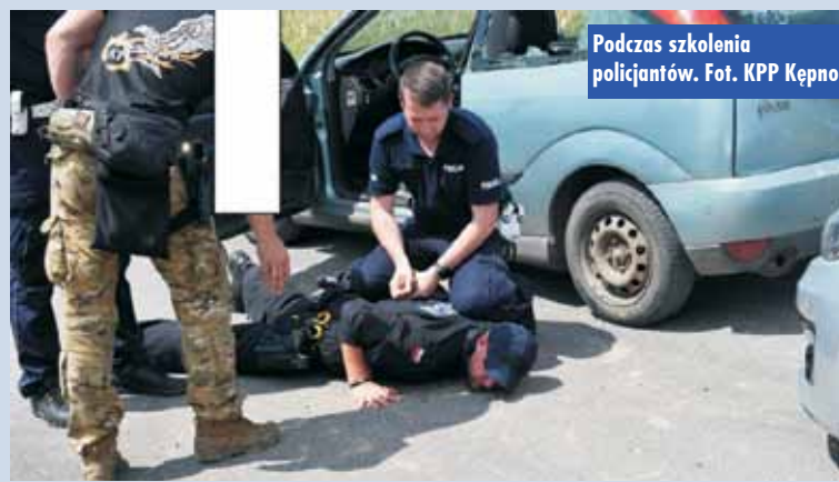
Podczas szkolenia policjantów.