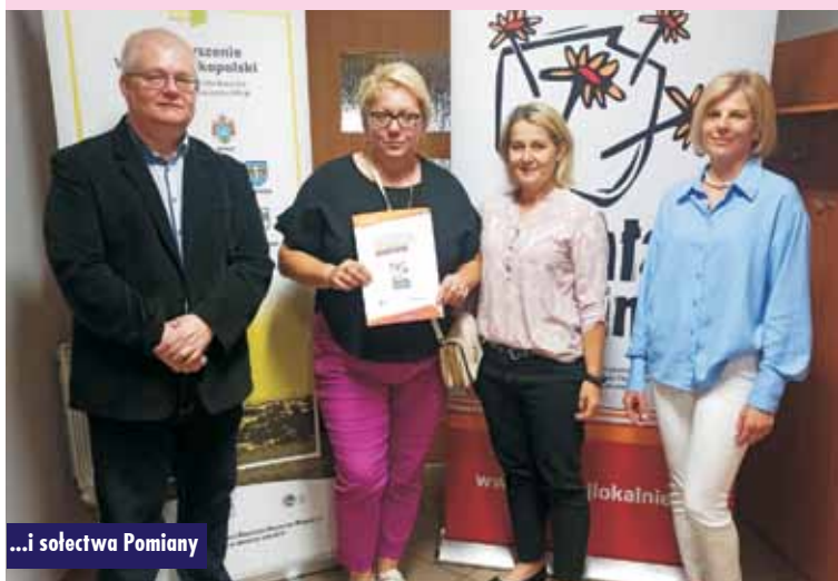
...i sołectwa Pomiany

Fundusze pochodzą ze środków Programu Działaj Lokalnie Polsko-Amerykańskiej Fundacji Wolności realizowanego przez Akademię Rozwoju Filantropii w Polsce. Oprac. m