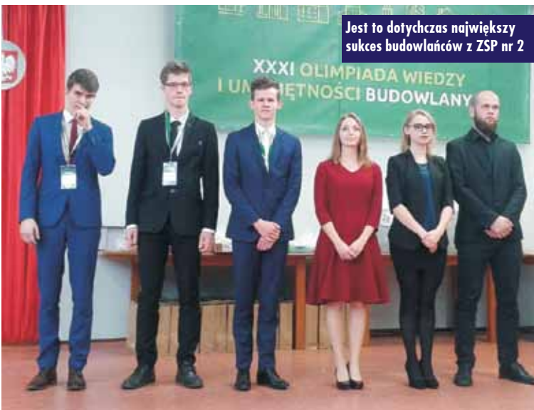
Jest to dotychczas największy sukces budowlańców z ZSP nr 2

12 – 14 kwietnia br. w Zielonej Górze. Głównym organizatorem konkursu był Wydział Inżynierii Lądowej Politechniki Warszawskiej.