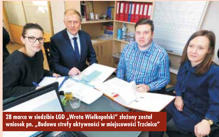
28 marca w siedzibie LGD „Wrota Wielkopolski” złożony został wniosek pn. „Budowa strefy aktywności w miejscowości Trzcínica”

kotłowni w Domu Ludowym w Wo- dzicznej” złożono w ramach operacji typu „Inwestycje w obiekty pełniące funkcję kulturalne”, Działania „Pod- stawowe usługi i odnowa wsi na ob- szarach wiejskich”, objętego Progra- mem Rozwoju Obszarów Wiejskich na lata 2014-2020.