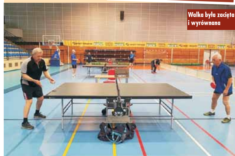
Walka była zacięta i wyrównana