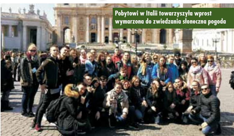
Pobyty w Italii towarzyszyła wprost wymarzona do zwiedzania słoneczna pogoda

20 marca 2018 r. uczniowie ZSP nr 1 w Kępnie wyruszyli na pełną niezapomnianych wrażeń wycieczkę do Rzymu, Florencji i Wenecji.