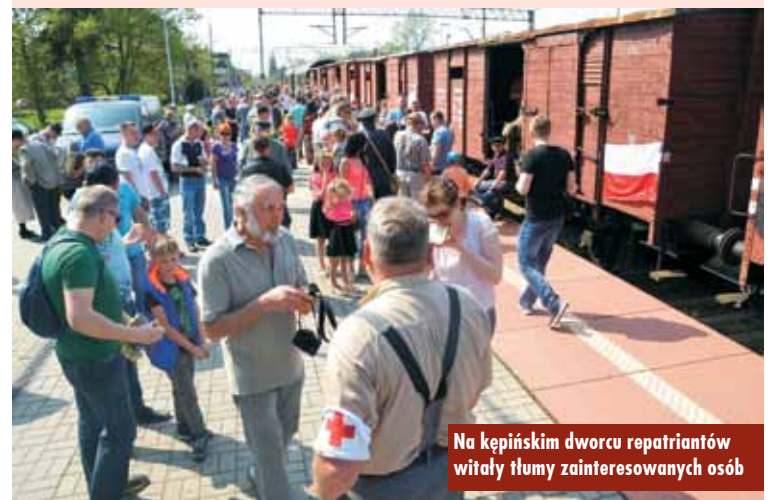
Na kępińskim dworcu repatriantów witały tłumy zainteresowanych osób

Uczestnicy przejazdu ubrani byli w stroje z epoki, a towarzyszyły im zwierzęta domowe oraz sprzęt wojсковy i przedmioty codziennego użytku. Każdy z uczestników wydarzenia otrzymał „kartę przesiedleńczą”, która pieczętowana była na