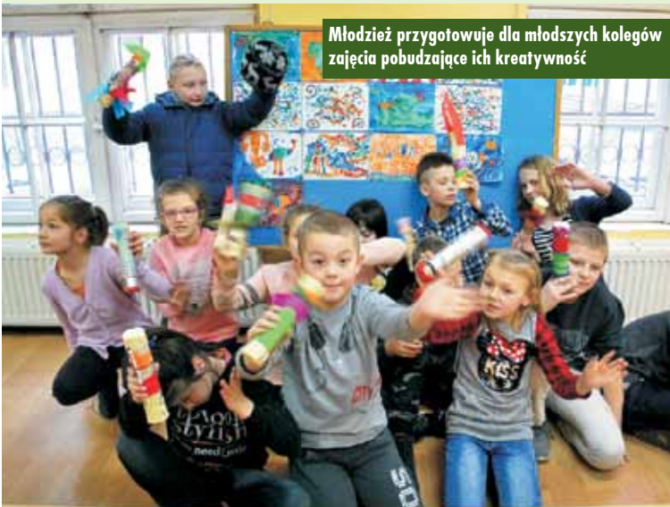
Młodzież przygotowuje dla młodszych kolegów zajęcia pobudzające ich kreatywność