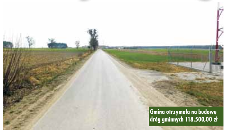
Gmina otrzymała na budowę dróg gminnych 118.500,00 zł

26 marca br. Sejmik Wojewódz- twa Wielkopolskiego podjął uchwałę w sprawie udzielenia pomocy finan- sowej jednostkom samorządu teryto- rialnego w 2018 roku.