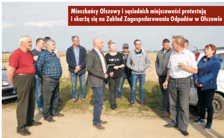
Mieszkańcy Olszowy i sąsiednich miejscowości protestują i skarżą się na Zakład Zagospodarowania Odpadów w Olszowie

tymi foliami. Później trzeba było to wszystko przerobić, to było gdzieś 80 ton, wszystko ręcznie przebrać, bo inaczej temu zwierzakowi się tego nie da, bo może paść – mówi z żalem jeden z rolników. Wy tłumaczył on także, że kiedy budowano zakład, zniszczona została drenarka. - Teraz nie chcą się do tego przyznać, mówią, że nie było głęboko kopane, ale wszystko wychodzi na jaw, bo na pole nie idzie wjechać. Wychodzi woda. Oni