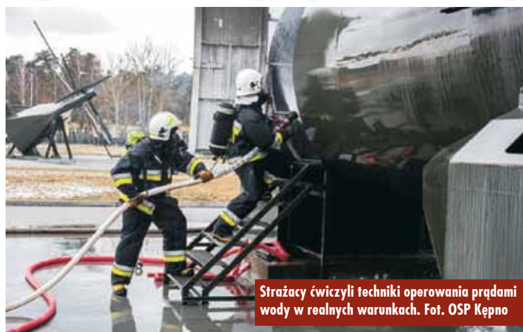
Strażacy ćwiczyli techniki operowania prądami wody w realnych warunkach.

14 druhów z Ochotniczej Straży Pożarnej w Kępnie udało się do Centrum Szkolenia Logistyki w Grupie koło Grudziądza, aby wziąć udział w ćwiczeniach na poligonie. Polygon jest jednym z trzech w Europie (pozostałe znajdują się w Wielkiej Brytanii oraz Holandii), jest on najnowocześniejszym obiektem tego typu. Na poligonie znajdują się makiety śmigłowca, samolotu Casa oraz F16, które imitują realne zagrożenie pożarowe występujące w tych maszynach (pożar hot break, silników czy wycieku paliwa), a także komora rozgorzeniowa oraz dymowa.