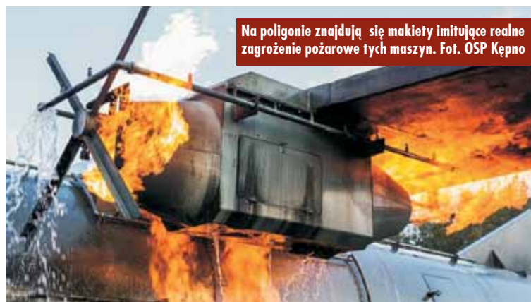
Na poligonie znajdują się makiety imitujące realne zagrożenie pożarowe tych maszyn.