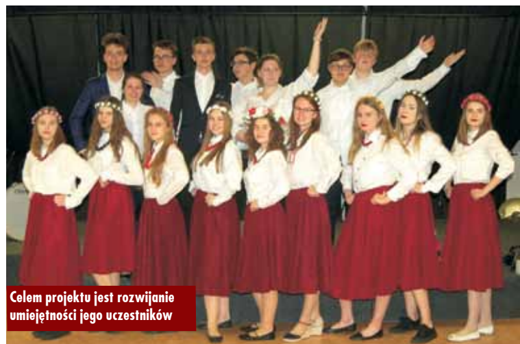
Celem projektu jest rozwijanie umiejętności jego uczestników

podróż do Przybramu. To właśnie w tym czeskim mieście spotkały się delegacje ze szkół Gymnazium Příbram z Czech, Liceo Calasanzio z Włoch, Vollen Ungdomsskole z Norwegii, XIII Liceum Ogólnokształcącego im. Aleksandra Fredry z Wrocławia oraz z naszego liceum. Celem projektu jest rozwijanie umiejętności jego uczestników, modernizacja systemów edukacji, szkoleń i wspierania młodzieży, a także zwalczanie przemocy, dyskryminacji. Projekt podkreśla