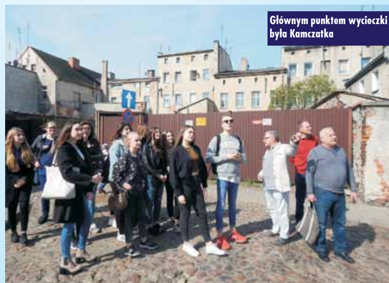
Głównym punktem wycieczki była Kamczatka

ogromny, a sposób jej przekazywania rewelacyjny. To niesamowite, że tak małe miasteczko może kryć w sobie tak bogatą żydowską historię. Poza obiektami poznaliśmy historię wielu osób, np. rabina Malbima , czy pochodzenie australijskiej aktorki Oli-vii Newton-John , gwiazdy „Grease”.