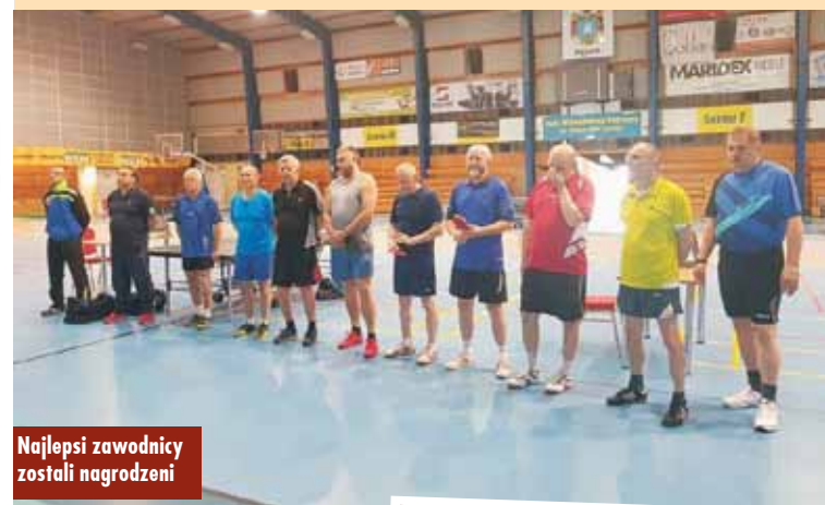
Najlepsi zawodnicy zostali nagrodzeni

14 kwietnia br. w Hali Widowiskowo-Sportowej im. Gwiazd Piłki Ręcznej w Kępnie odbył się III Turniej Tenisa Stołowego o Puchar Burmistrza Miasta i Gminy Kępno. Organizatorem zawodów była Spółka „Projekt Kępno”.