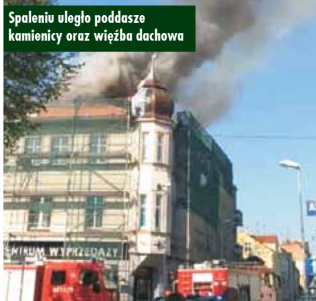
Spaleniu uległo poddasze kamienicy oraz więźba dachowa

pomieszczeniach objętych działaniami. Strażacy pracowali w aparatach ochrony układu oddechowego – relacjonuje kpt. J. Kucharzak. W działaniach udział brało łącznie 9 zastępów straży pożarnej: 5 z JRG Kępno oraz po