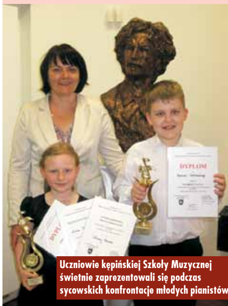
Uczniowie kępińskiej Szkoły Muzycznej świetnie zaprezentowali się podczas sycowskich konfrontacji młodych pianistów

11 kwietnia 2018 r. w Państwowej Szkole Muzycznej I st. im. J. I. Paderewskiego w Sycowie odbyły się Międzyszkolne Konfrontacje Młodych Pianistów.