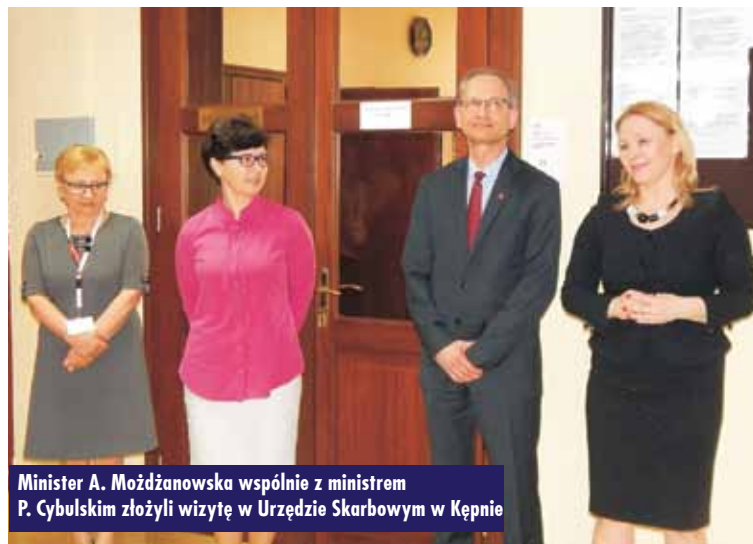
Minister A. Możdżanowska wspólnie z ministrem P. Cybulskim złożyli wizytę w Urzędzie Skarbowym w Kępnie

- Analityka to jest 90% naszego sukcesu. Mamy świadomość tego, że jeżeli kontrola pójdzie w teren, to nie