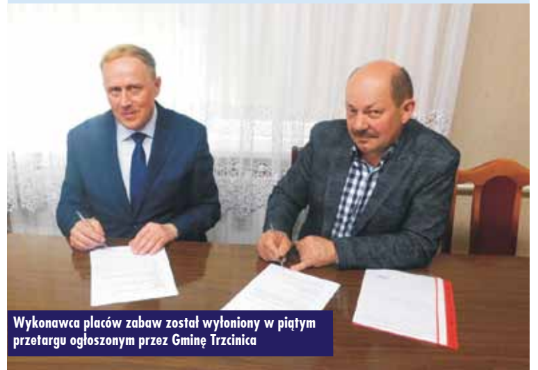
Wykonawca placów zabaw został wyłoniony w piątym przetargu ogłoszonym przez Gminę Trzcínica

Na zadanie „Rozwój bazy rekre- acyjnej w gminie Trzcínica” udało się pozyskać środki Europejskiego Funduszu Rolnego na rzecz Rozwo-