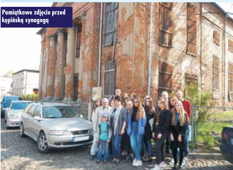
Pamiątkowe zdjęcie przed kępińską synagogą

Od samego początku nie kryliśmy zdziwienia, wywołanego urokiem tego niewielkiego miasta, znajdującego się w zasadzie pod naszym bokiem, bo zaledwie 40 km od Wielunia. Nasza podróż w żydowską przeszłość miasta rozpoczęła się na miejskim Rynku otoczonym w większości pięknymi pożydowskimi kamienicami. Historii dotyczących budynków i rodzin je zamieszkujących było co niemiara. Jedną z nich była historia Żyda, który za wszelką cenę chciał, by jego kamienica wyróżniała się spośród pozostałych dwukondygnacyjnych. I wiecie co zrobił? Na ostatnim piętrze domalował okna, dzięki czemu budynek zyskał wrażenie trzypiętrowego.