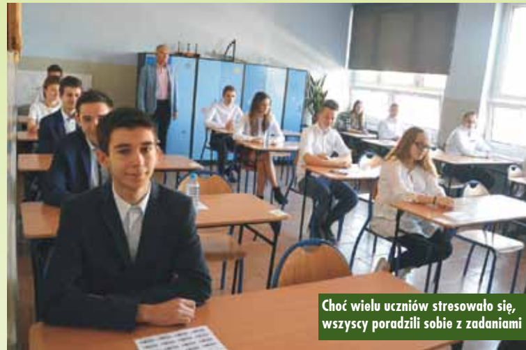
Choć wielu uczniów stresowało się, wszyscy poradzi sobie z zadaniami

- Opierając się na zdaniu dyrektorów szkół, w których funkcjonują