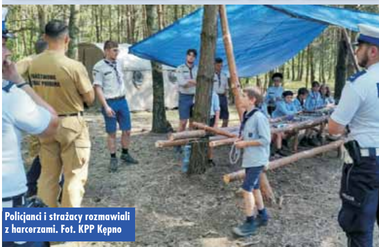
Policjanci i strażacy rozmawiali z harcerzami.

9 lipca br. funkcjonariusze Postępowania Policji w Bralinie wspólnie z policjantami Wydziału Ruchu Drogowego Komendy Powiatowej Policji w Kępnie oraz funkcjonariuszami Komendy Powiatowej Państwowej Straży Pożarnej w Kępnie spotkali się z grupą harcerzy za Stowarzyszenia Harcerstwa Katolickiego „Zawisza”, którzy przebywali na obozie harcerskim w miejscowości Weronikopol. Mundurowi rozmawiali z dziećmi i młodzieżą