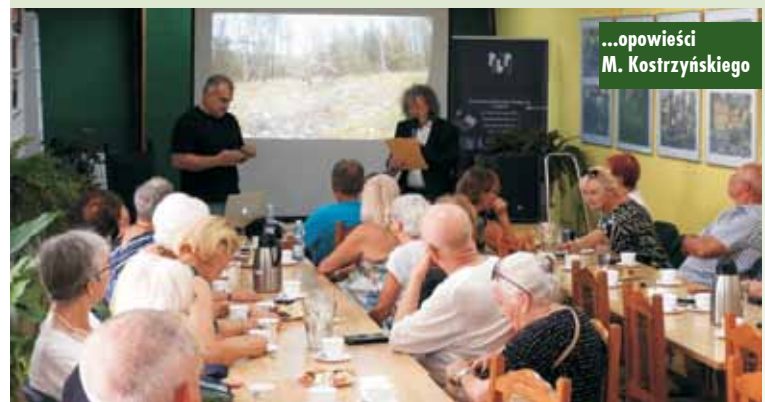
...opowieści M. Kostrzyńskiego

Podczas spotkania autor zaprezentował kilka swoich książek oraz najnowszych filmów, w których