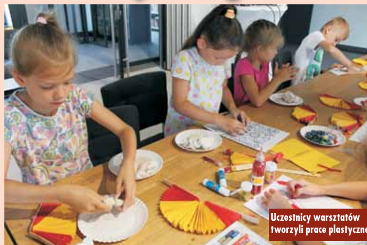
Uczestnicy warsztatów tworzyli prace plastyczne

I to właśnie flamenco okazało się inspiracją dla warsztatów plastycznych w drugiej części spotkania. Stosując się do wskazówek pro-