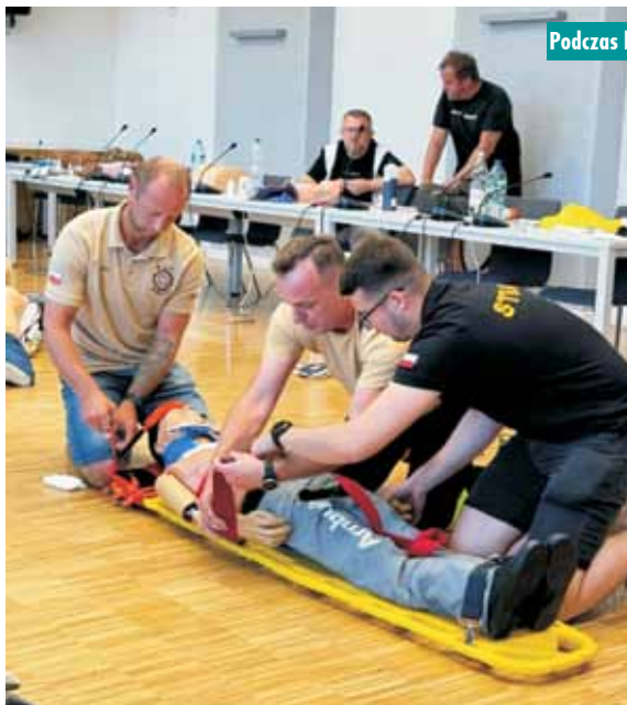
Podczas kursu KPP