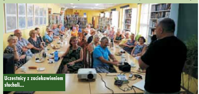
Uczestnicy z zacięciem słuchali...

z publicznością, odpowiadając na pytania dotyczące swojej pracy oraz losów zwierząt, które dokumentuje.