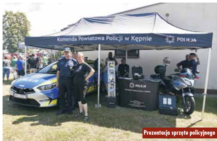
Prezentacja sprzętu policyjnego