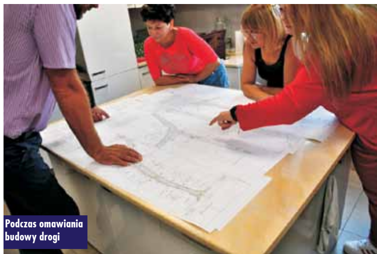
Podczas omawiania budowy drogi