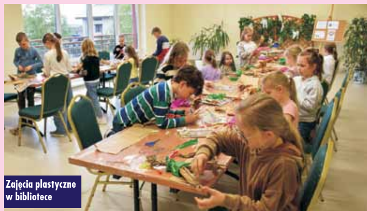
Zajęcia plastyczne w bibliotece

terapeutyczna dla dzieci autorstwa R. Gość, jako pomoc dydaktyczna do zajęć. Podczas spotkań będą organizowane różnorodne quizy dla dzieci, a zwycięzcy otrzymają nagrody rzeczowe. Na zakończenie zajęć uczestnicy zostaną poczęstowani słodyczami