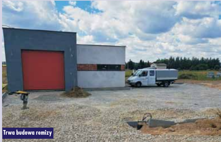
Trwa budowa remizy