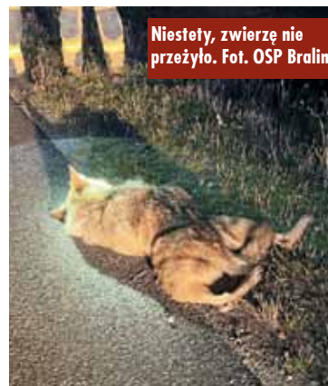
Niestety, zwierzę nie przeżyło.

Dofinansowania dla szkół w Bralinie i Nowej Wsi Książęcej na organizację wycieczek szkolnych