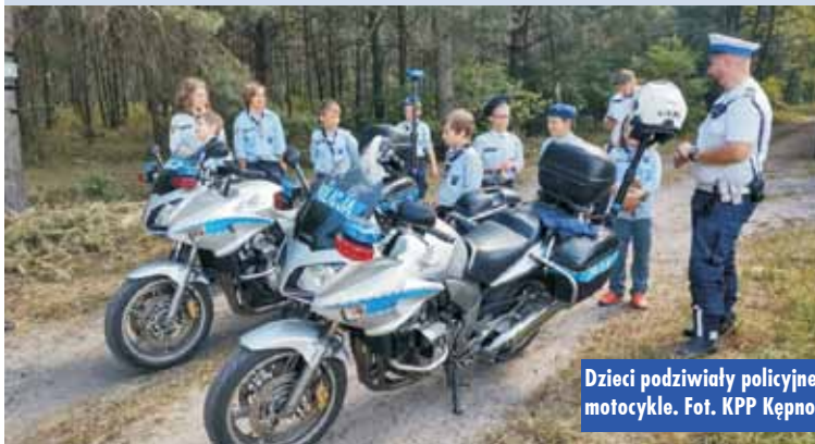
Dzieci podziwiali policyjne motocykle.

na temat ich bezpieczeństwa – czy to w domu, czy w miejscach zorganizowanych form wypoczynku. - Obóz harcerski to grupa zdyscyplinowanych uczestników, dlatego też funkcjonariusze w ramach przypomnienia poruszyli tematy dotyczące bezpieczeństwa podczas wakacji, a szczególnie zwrócili uwagę na właściwe korzystanie z terenów leśnych oraz kąpielisk wodnych – podkreśla mł. asp. Filip Ślęk z KPP Kępno. Oprac. KR