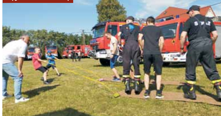
Przygotowano wiele atrakcji

terenu gminy, powiatu czy nawet województwa. Takie wydarzenia umożliwiają taką integrację, wymianę doświadczeń, a także zapoznanie się z pięknym sprzętem, który strażacy posiadają w swoich jednostkach – dodaje prezes. KR