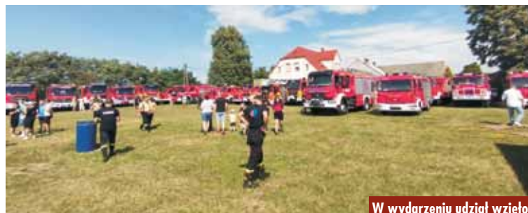
W wydarzeniu udział wzięło ponad 40 samochodów