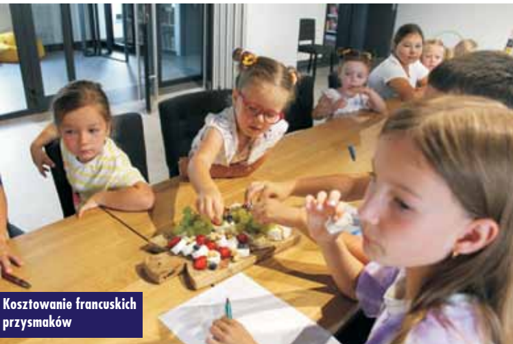
Kosztowanie francuskich przysmaków

Od późnego popołudnia królowały animacje, konkursy z nagrodami czy bańki mydlane. Dzieciaki kręciły się też w szalonym hula hop, polowały na popcorn czy gorące zapiekanki. Zgromadzeni na widowni zdumieni rodzice odkrywali tajemnice entuzjazmu swoich pociech. Na własne oczy przekonywali się, że nawet atrakcje stworzone najprostszymi środkami mogą dostarczyć ogrom radości i zabawy. Pociechy mają wówczas okazję cieszyć się wspólnymi doświadczeniami, bawić się z rówieśnikami i tworzyć miłe wspomnienia. I tak właśnie było tego dnia pod baranowską chmurką.