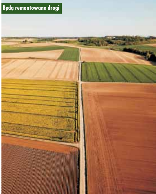
Będą remontowane drogi