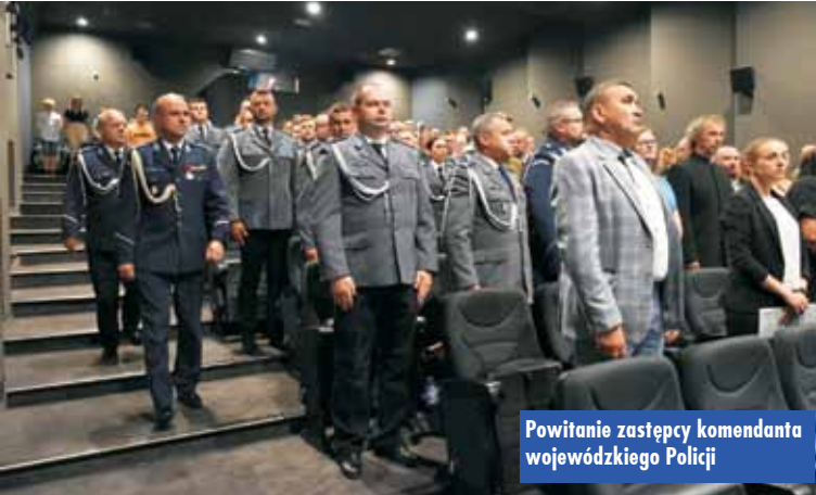
Powitanie zastępcy komendanta wojewódzkiego Policji

W tym roku w Komendzie Powiatowej Policji w Kępnie na wyższe stopnie służbowe zostało mianowanych 36 policjantów: 2 w korpusie oficerów starszych, 10 w korpusie aspirantów, 20 w korpusie podoficerów i 4 w korpusie szeregowych.