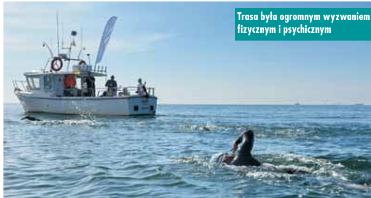
Trasa była ogromnym wyzwaniem fizycznym i psychicznym

Pływacy rozpoczęli swoją podróż 20 lipca br., wczesnym rankiem, o godzinie 6.00. Z helskiego portu dopłynęli łodzią do plaży w Babich Dołach. Po krótkim odpoczynku i ostatnich wytycznych, zaczęła się prawdziwa przygoda – przeprawa przez zatokę. Pierwsza połowa trasy przebie-