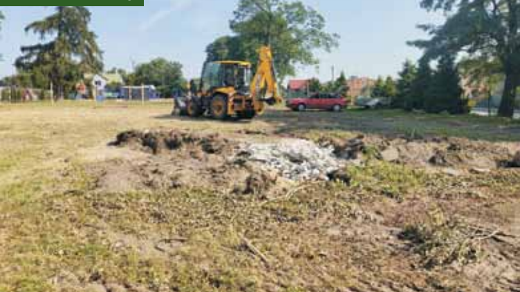
Prace remontowe trwają

Czteroosobowy team pracowników kępińskiej krytej pływalni „Qarium” podjął wyzwanie przepłynięcia wpław Zatokę Gdańską