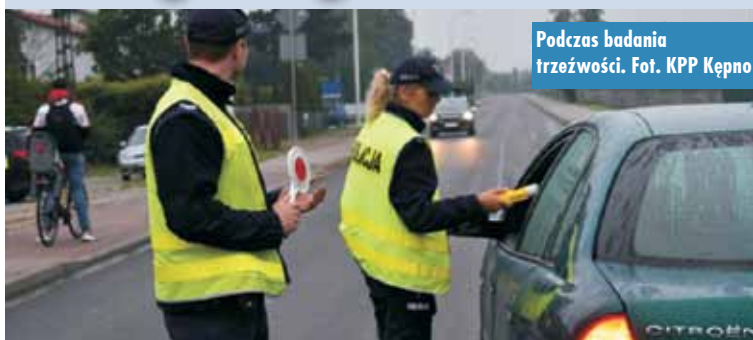
Podczas badania trzeźwości.

W akcję, oprócz policjantów Wydziału Ruchu Drogowego, zaangażowani byli również funkcjonariusze innych pionów Komendy Powiatowej Policji w Kępnie. Kontrole prowadzone były w różnych miejscach na terenie całego powiatu kępińskiego.