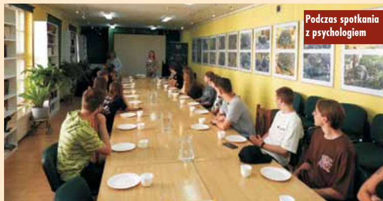
Podczas spotkania z psychologiem

„Zielone wakacje z profilaktyką” w gminie Kępno