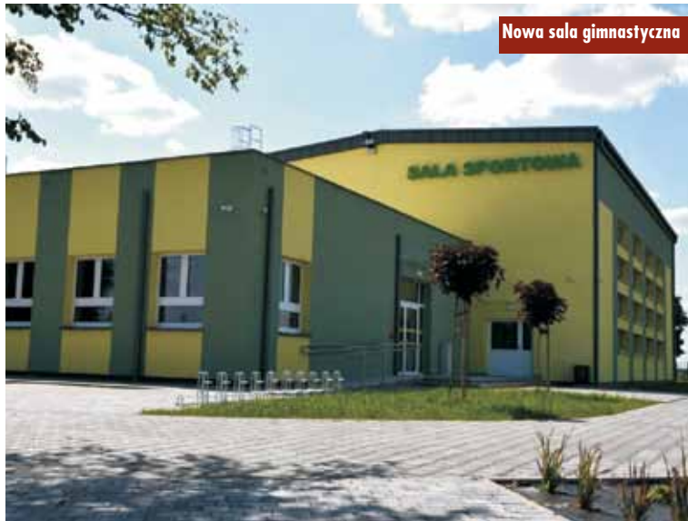
Nowa sala gimnastyczna

Podkreślić należy, że realizacja inwestycji nie byłaby możliwa bez pozyskanych dofinansowań: 5 000 000 zł – dofinansowanie z Rządowego Funduszu Polski Ład: Programu Inwestycji Strategicznych – Edycja 2, 1 948 200 zł – dofinansowanie ze środków Funduszu Rozwoju Kultury Fizycznej, których dysponentem jest minister sportu i