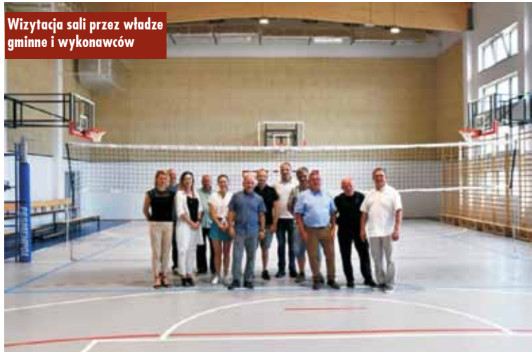
Wizytacja sali przez władze gminne i wykonawców

Zakończyły się roboty budowlane związane z realizacją zadania „Rozbudowa Szkoły Podstawowej w Siemianicach o salę gimnastyczną z zapleczem szatniowo-sanitarnym, blokiem dydaktycznym oraz zagospodarowaniem terenu”