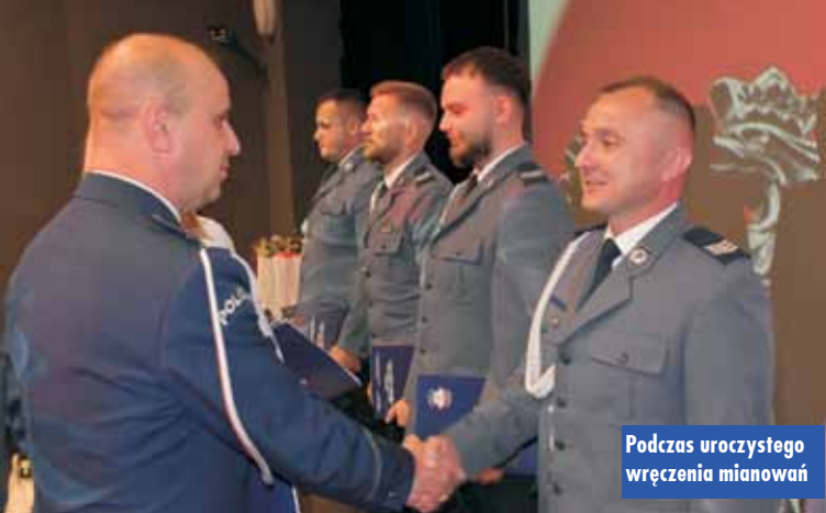
Podczas uroczystego wręczenia mianowań

Wzorem ubiegłego roku, mottem tegorocznych obchodów Święta Policji ponownie stało się hasło: „Zamiast kwiatka niosę pomoc!”, w ramach którego organizatorzy uroczystości poprosili, by goście zamiast kwiatów przynieśli przybory szkolne, drobny sprzęt sportowy i wszystko, co może przydać się uczniom. Rzeczy te zo-