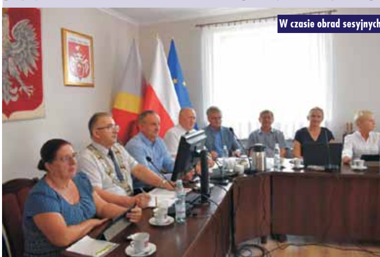
W czasie obrad sesyjnych

na prace konserwatorskie, restaura- torskie lub roboty budowlane przy zabytku wpisanym w gminnej ewi- dencji zabytków w ramach Rządowe- go Programu Odbudowy Zabytków oraz uchwała w sprawie ustalenia wysokości i zasad przyznawania soł- tysom gminy Trzcini- ca diet i zwrotu kosztów podróży służbowej. Nastę- p-