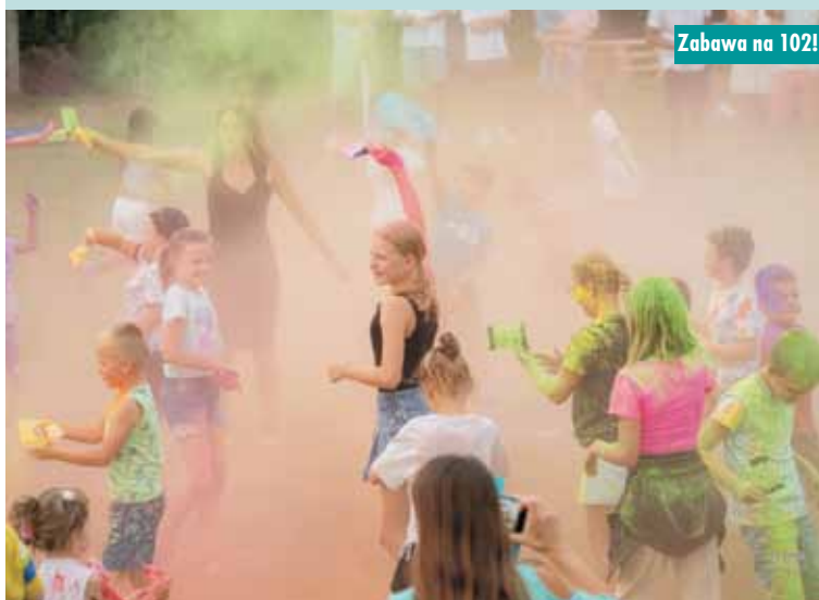
Zabawa na 102!

Tegoroczna biesiada odbyła się wyjątkowo w lipcu, a nie tradycyjnie w okolicach 15 sierpnia, z uwagi na planowane na 7 września w Trzcini- cy dożynki powiatowo-gminne. To była piękna sobota – pełna radości, wspólnego biesiadowania, uśmiechu, integracji, dobrej muzyki, dobrej zabawy, wielu niespodzianek i atrakcji. Wiele tego dnia się w Trzcini- cy działo – jako organizatorzy staraliśmy się tak ułożyć program, aby każdy znalazł coś dla siebie; przygotowaliśmy atrakcje dla każdego od najmłodszych po najstarszych mieszkań- ców. I tak: na początku odbył się II Trzciniński Bieg Strażaka, w którym 14 zawodników rywalizowało o zwycię- cięstwo; było też dużo darmowych