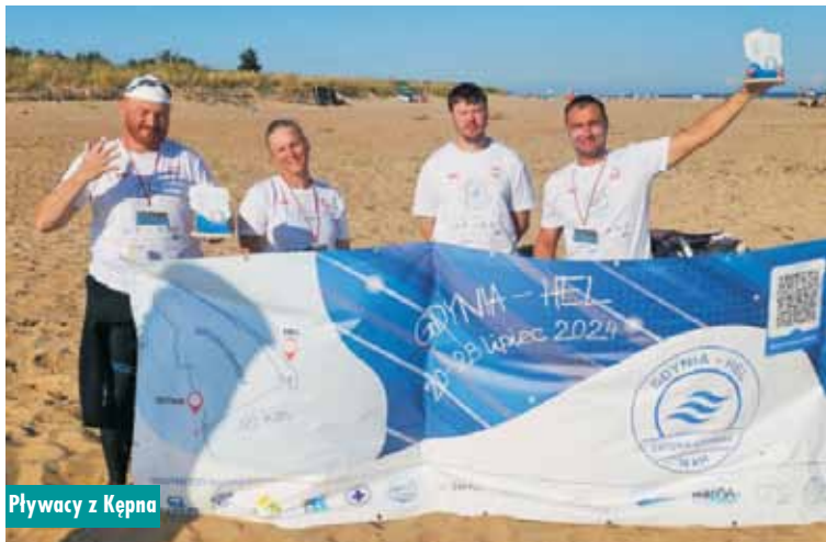
Pływacy z Kępna

cin Hoja – podjął wyzwanie przepłynięcia wpław Zatokę Gdańską. Cała trasa, licząca 18 km, była ogromnym wyzwaniem, zarówno fizycznym, jak i psychicznym. Wysiłek, jaki włożyli, zasługuje na ogromne uznanie.