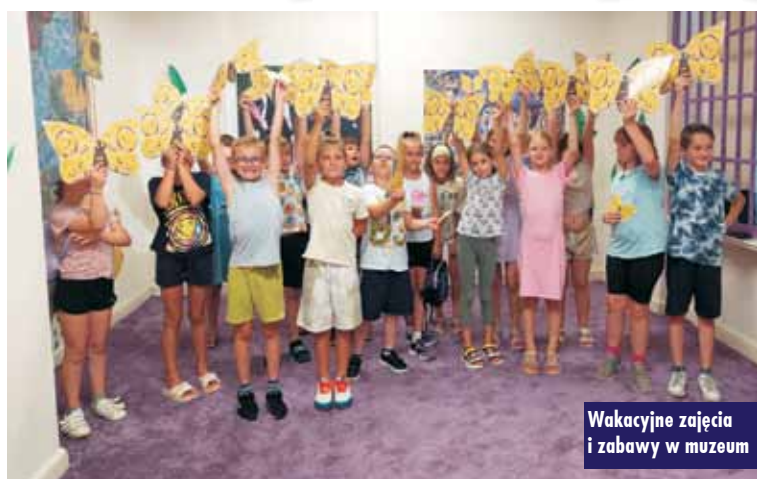
Wakacyjne zajęcia i zabawy w muzeum

60-osobowa grupa dzieci z gminy Kępno brała udział w bezpłatnych