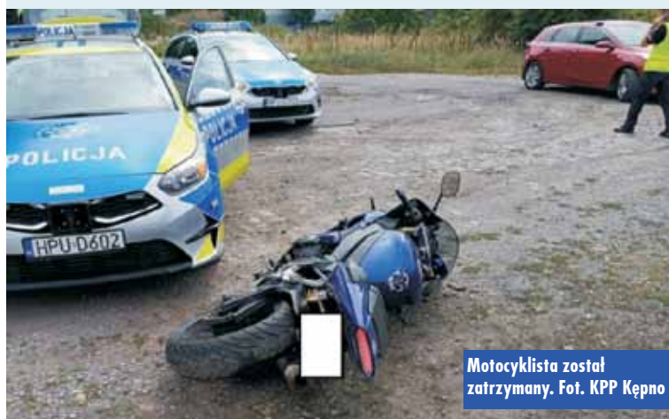
Motocyklista został zatrzymany.

przystąpili do kontroli drogowej motocyklisty. - Kierujący motocyklem na widok oznakowanego radiowozu najpierw zwolnił, a następnie gwałtownie przyspieszył i rozpoczął ucieczkę w kierunku Grębanina. Pomimo wydawanych przez policyjny radiowóz sygnałów świetlnych i dźwiękowych, motocyklista nie zatrzymał się i kontynuował ucieczkę. Dyżurny kępińskiej jednostki natychmiast wysłał wsparcie w postaci kilku innych radiowozów. Motocyklista swoją ucieczkę kontynuował