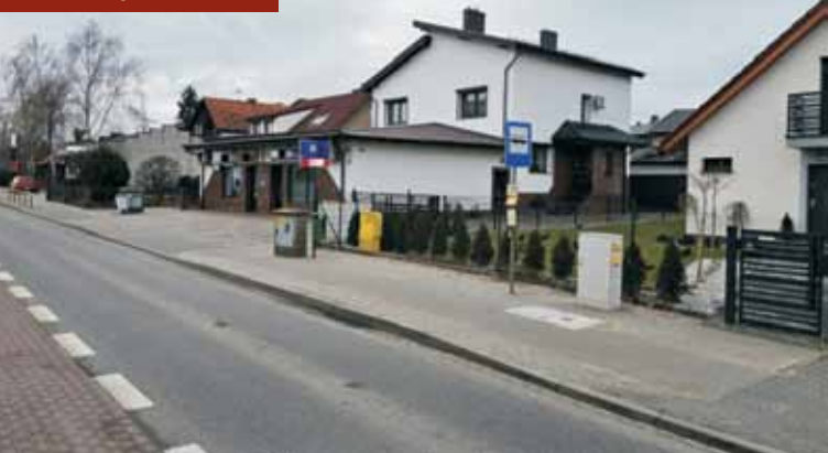
Przystanek przy ul. Kwiatowej.

Trwa budowa boiska sportowego w Olszowie