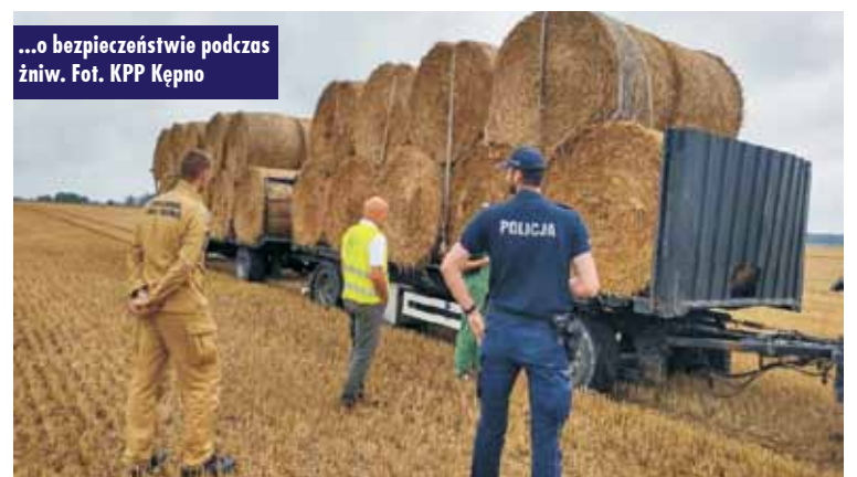
...o bezpieczeństwie podczas żniw.

Policjanci z Posterunku Policji w Rychtalu wraz z przedstawicielem Okręgowego Inspektoratu Pracy w Poznaniu – Oddział w Ostrowie Wielkopolskim oraz Komendy Powiatowej Państwowej Straży Pożarnej w Kępnie podjęli działania profilaktyczne pt. „Bezpieczeństwo na wsi”. Podczas współpracy przekazano rolnikom oraz gospodarzom najważniejsze zasady bezpieczeństwa. Funkcjonariusze przypominali, że aby uniknąć wypadków, które bardzo często bywają tragiczne w skutkach, należy pamiętać o odpowiednim za-