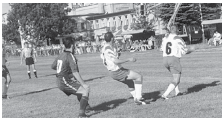
Historia meczów Piasta Błaszki z Polonią Kępno sięga początku lat 50. 29 lipca 1998 r. na Stadionie Miejskim w Kępnie rozegrano spotkanie, którego stawka była inna niż wszystkie. Biało-niebiescy, odpadając z dalszej rywalizacji, zaprzepaścili szansę na grę z drugoligowym Naprzodem Rydułtowy