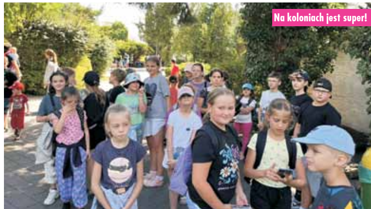
Na koloniach jest super!

innych zwierzątek. Po zwiedzaniu czekał na nas pyszny posiłek, a na deser, oczywiście, lody. Zmęczeni, ale szczęśliwi, wracamy do domu – wspominają uczestnicy kolonii. - To dopiero początek naszych przygód! Trzymajcie kciuki za kolejne dni pełne zabawy – prognozują. m