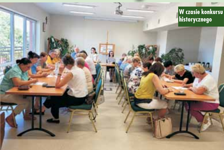
W czasie konkursu historycznego

30 lipca br. w Gminnej Bibliotece Publicznej w Trzcínicy odbył się Gminny Quiz Historyczny pt. „Bohatera Rodzina Ulmów”, który był jednym z wielu działań, będących częścią projektu „Brata ratować trzeba – o ludzkich wyborach w obliczu zagłady”, realizowanego przez bibliotekę w ramach programu „Patroni Roku” współfinansowanego ze środków darowizny otrzymanej od Fundacji LOTTO im. Haliny Konopackiej. Celem projektu jest przywracanie pamięci dziedzictwu kulturowemu poprzez poznanie historii Polaków ratujących Żydów na Podkarpaciu w czasie II wojny światowej.