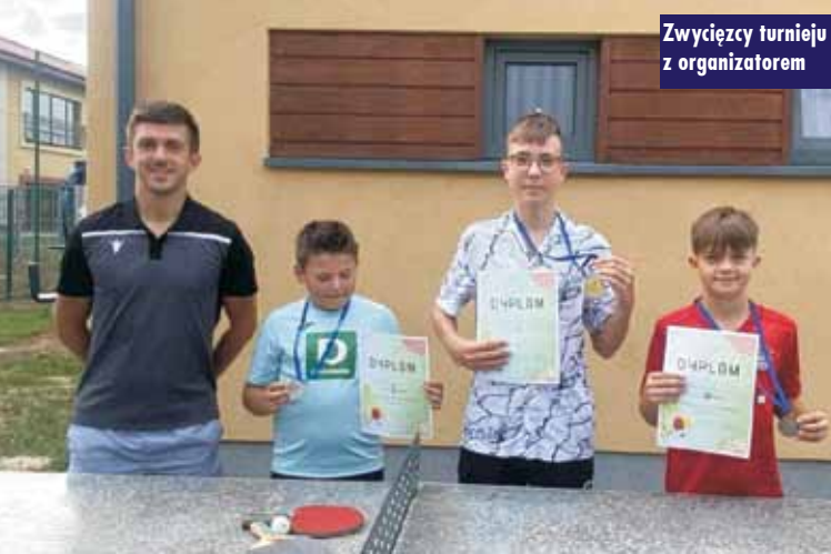
Zwycięzcy turnieju z organizatorem