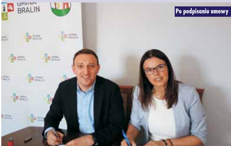
Po podpisaniu umowy