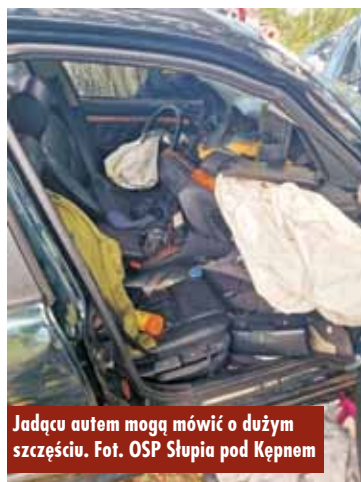
Jadąc autem mogą mówić o dużym szczęściu.

Kępińscy policjanci zatrzymali 33-latkę, który wybił szyby na terenie budowy domu jednorodzinnego w Baranowie. Mężczyzna usłyszał zarzut niszczenia mienia