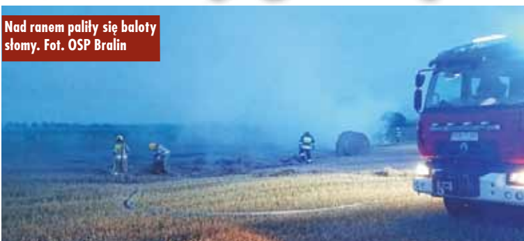
Nad ranem paliły się baloty słomy.

23 lipca br., przed godziną 4.00, do Stanowiska Kierowania Komendanta Powiatowej Państwowej