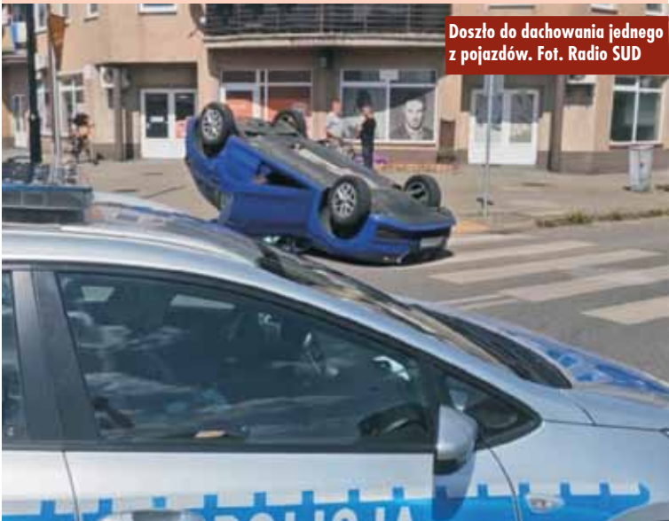
Doszło do dachowania jednego z pojazdów.