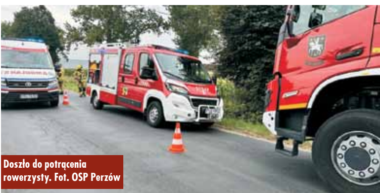
Doszło do potrącenia rowerzysty.