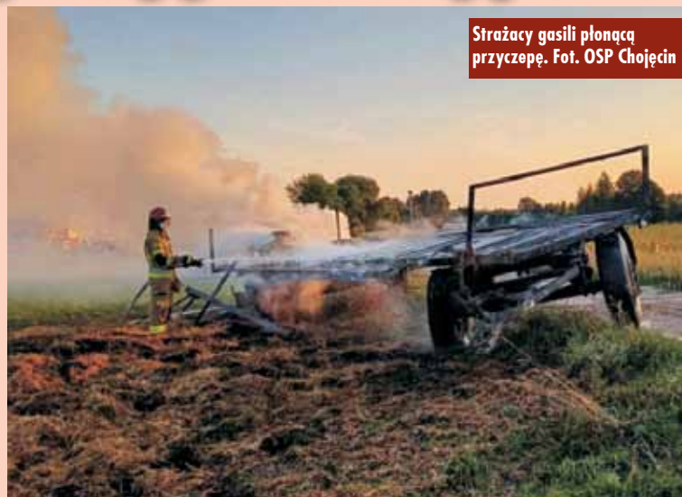
Strażacy gasili płonącą przyczepę.

- Działania strażaków polegały na podaniu 2 prądów wody w natarciu na pożar, co doprowadziło do jego ugaszenia. W celu potwierdzenia usunięcia zagrożenia pogorzelsko dokładnie przelano wodę – mówi oficer prasowy KP PSP Kępno, st. kpt. Paweł Michalski . Oprac. KR