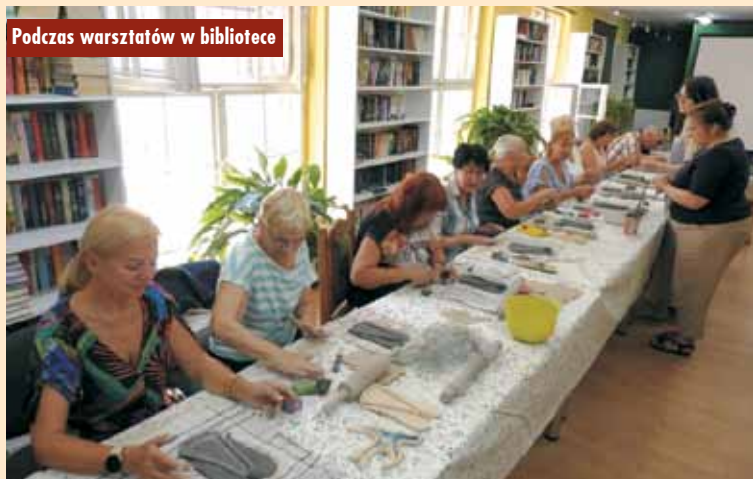
Podczas warsztatów w bibliotece