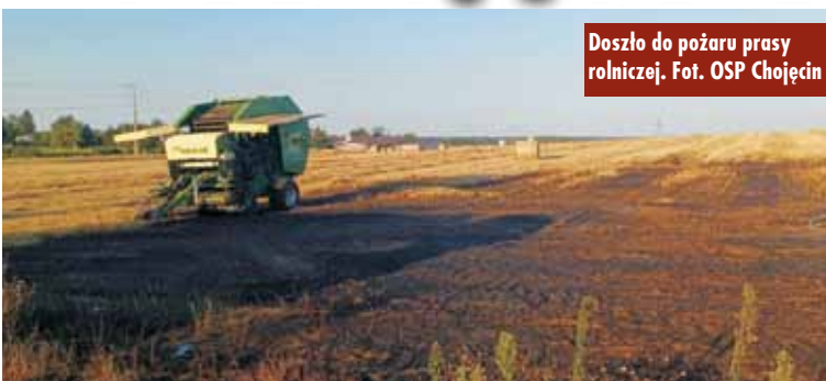
Doszło do pożaru prasy rolniczej.

19 lipca br., około godziny 19.00, do Stanowiska Kierowania Komen-