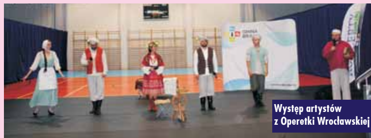
Występ artystów z Operetki Wrocławskiej

Pożar prasy rolniczej na ul. Południowej w Bralinie