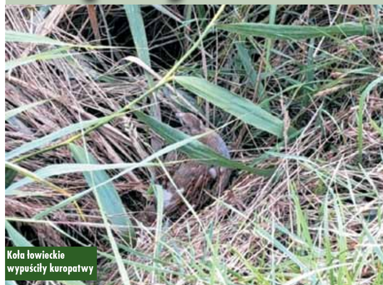
Koła łowieckie wypuściły kuropatwy

27 lipca br. odbyło się wypuszczenie przez koła łowieckie zakupionych przez Powiat Kępiński za kwotę 15.042 zł kuropatw szarych w ilości 327 sztuk dla kół, z którymi Powiat