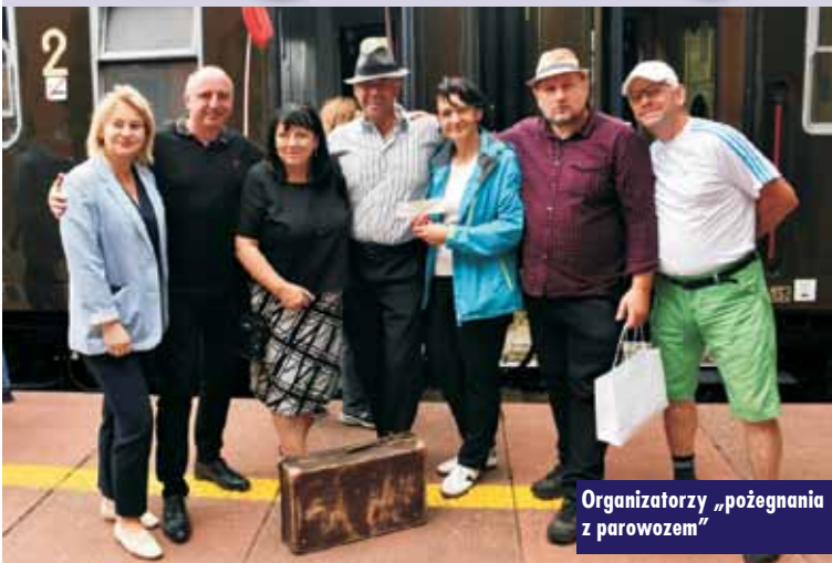
Organizatorzy „pożegnania z parowozem”

28 lipca br. blisko 350 osób, m.in. z Wrocławia, Oleśnicy, Sycowa i Kępna, wyruszyło w sentymentalną, kolejową podróż po zamykanym niebawem szlaku 181 Wrocław-Kępno.