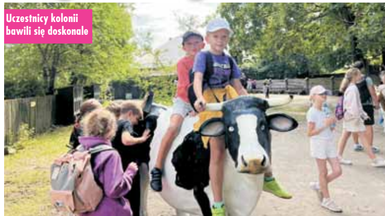
Uczestnicy kolonii bawili się doskonale