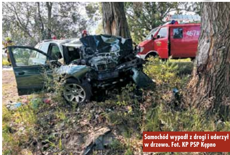
Samochód wypadł z drogi i uderzył w drzewo.

28 lipca br., około godziny 15.32, do Stanowiska Kierowania Komendanta Powiatowego Państwowej Straży Pożarnej w Kępnie wpłynęło zgłoszenie o zdarzeniu drogowym w miejscowości Jankowy. Na miejsce zdarzenia zadysponowano zastępy z Jednostki Ratowniczo-Gaśniczej w Kępnie, OSP Jankowy i OSP Słupia pod Kępnem.