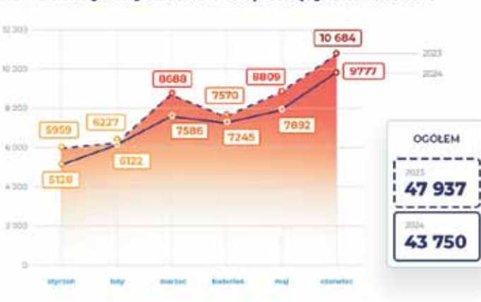
Liczba zatrzymanych kierowców pod wpływem alkoholu

Konfiskata nie dotyczy wszystkich zatrzymań za jazdę po alkoholu – jest obligatoryjna w przypadku, gdy kierowca miał we krwi 1,5 albo więcej promili alkoholu lub wtedy, gdy kierowca miał ponad 1 promil alkoholu, ale spowodował wypadek. Kierowca może stracić samochód również w przypadku, gdy spowodował wypadek, mając we krwi 0,5 promila