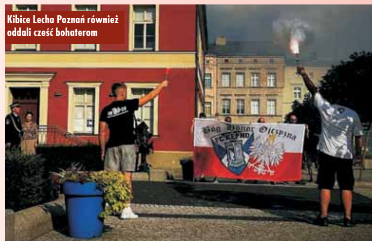
Kibice Lecha Poznań również oddali cześć bohaterom