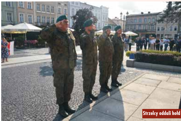
Strzelcy oddali hołd

Podpisanie umów na dofinansowanie wymiany „kopciuchów” na nowe źródło ciepła