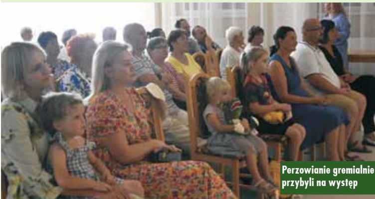
Perzowianie gremialnie przybyli na występ