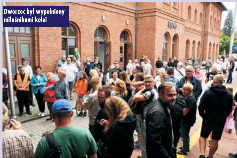
Dworzec był wypełniony miłośnikami kolei

1 października br. ruszy nabór wniosków do programu „Aktywny rodzic”