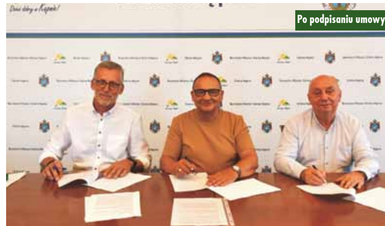
Po podpisaniu umowy