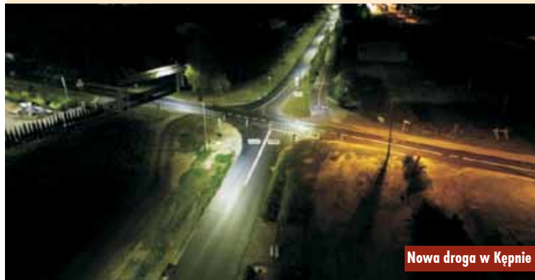
Nowa droga w Kępnie