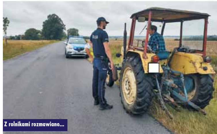
Z rolnikami rozmawiano...

planowaniu wykonywanych prac, uwzględnieniu przerwy na odpoczynek oraz rozsądnym i poważnym podejściu do zasad bezpieczeństwa. Policjanci apelowali o zachowanie zdrowego rozsądku i ostrożności. Czasami chwila nieuwagi wystarczy, aby doszło do wypadku. Zaznaczali też, aby nie zezwalać dzieciom na wykonywanie niebezpiecznych prac polowych, nie pozostawiać ich bez opieki dorosłych oraz nie pozostawiać niebezpiecznych narzędzi w miejscach, gdzie mogą stanowić zagrożenie dla dzieci.