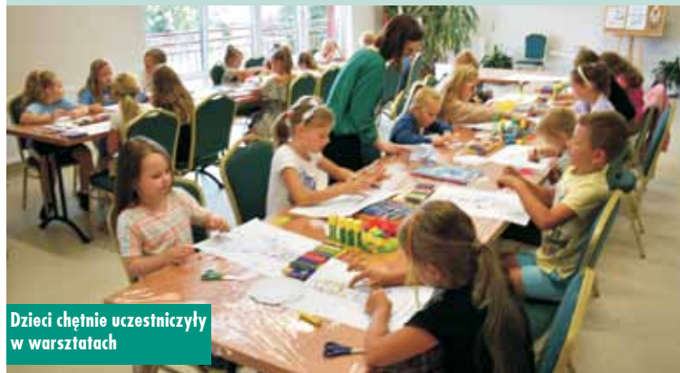
Dzieci chętnie uczestniczyły w warsztatach

5 w bibliotece filialnej). Zajęcia były połączone z głośnym czytaniem i omówieniem z dziećmi wybranego utworu literackiego, nawiązującego do uniwersalnych wartości, jakie prezentowała rodzina Ulmów, takich jak: