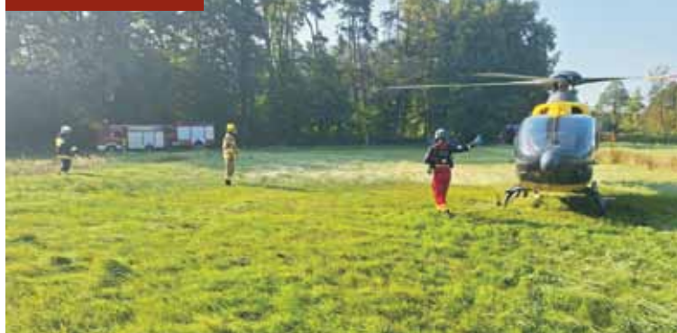
Podczas akcji ratowniczej.

Nieustąpienie pierwszeństwa przejazdu było powodem kolizji w Łęce Opatowskiej. Sprawczyni miała ponad 3 promile alkoholu w wydychanym powietrzu