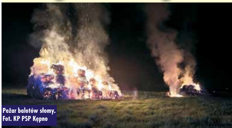
Pożar balotów słomy.

17 sierpnia br., o godzinie 1.55, do Stanowiska Kierowania Komendanta Powiatowej Państwowej Straży Pożarnej w Kępnie wpłynęło zgłoszenie o pożarze balotów słomy przy ul. Wrocławskiej w Kępnie. - Po dotarciu na miejsce zdarzenia pierwszych zastępów potwierdzono, że pożarem objęte są dwa stogi z balotami. Działania strażaków polegały na podaniu prądów gaśniczych w natarciu na pożar, co doprowadziło do jego lokalizacji, a następnie całkowitego ugaszenia – mówi oficer prasowy KP PSP Kępno, st. kpt. Paweł Michalski .