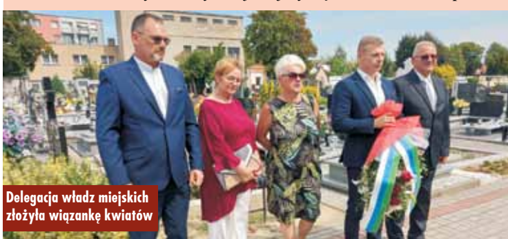
Delegacja władz miejskich złożyła wiązkę kwiatów