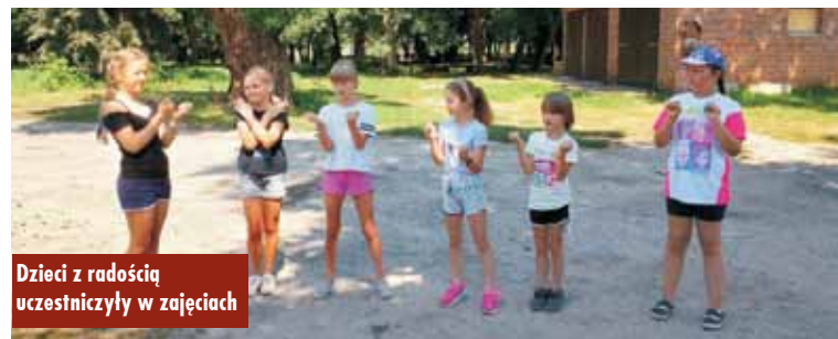
Dzieci z radością uczestniczyły w zajęciach

9 sierpnia 2024 r. na kompleksie boisk sportowych „Orlik” w Siemianicach odbyły się „Gry i zabawy na Orliku”