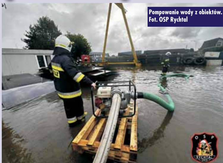
Pompowanie wody z obiektów.

Ogłoszono wyniki XII edycji konkursu „Nasza wieś, naszą wspólną sprawą”. Zarząd Województwa Wielkopolskiego zatwierdził listę przedsięwzięć, które otrzymają wsparcie finansowe. Dofinansowanie otrzyma 67 projektów, których łączna kwota wsparcia z budżetu Województwa Wielkopolskiego to niespełna 700 tys. zł