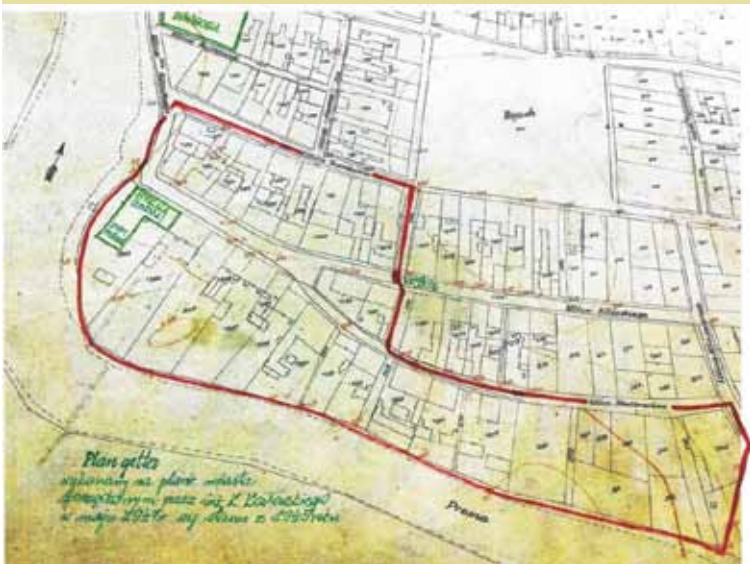
Teren wieruszowskiego getta funkcjonującego od 13.10.1941 r. do około 20.08.1942 r.