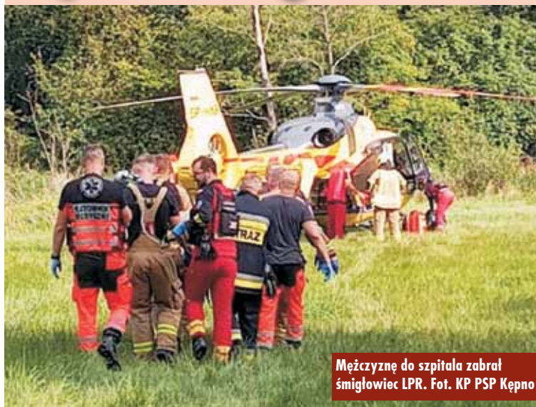
Mężczyznę do szpitala zabrał śmigłowiec LPR.

16 sierpnia br., tuż przed godziną 8.00, do Stanowiska Kierowania Komendanta Powiatowego Państwowej Straży Pożarnej w Kępnie wpłynęło zgłoszenie o wypadku podczas wykonywania prac leśnych w Mariance Siemieńskiej. Na miejsce zdarzenia zadysponowano zastępy z Jednostki Ratowniczo-Gaśniczej w Kępnie, OSP Siemianice, OSP Opatów i OSP Łęka Opatowska.