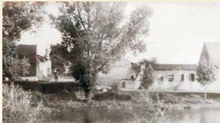
Ruiny mykwy (rytualnej łaźni) nad Prosną, miejsce mordu około 100 osób w połowie sierpnia 1942 r.

Każdego dnia żandarmi wybierali grupę ludzi i prowadzili ją do opuszczonego getta. Zabierali jedzenie, które tam znaleźli, dzielili je, a następnie gotowali na klasztornej dziedzińcu w dużym kotle. Gotowa-