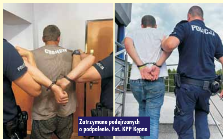
Zatrzymano podejrzanych o podpalenie.

Wycieczka do zagrody „Alpakowy zawrót głowy” w ramach zajęć wakacyjnych organizowanych przez gminę Bralin