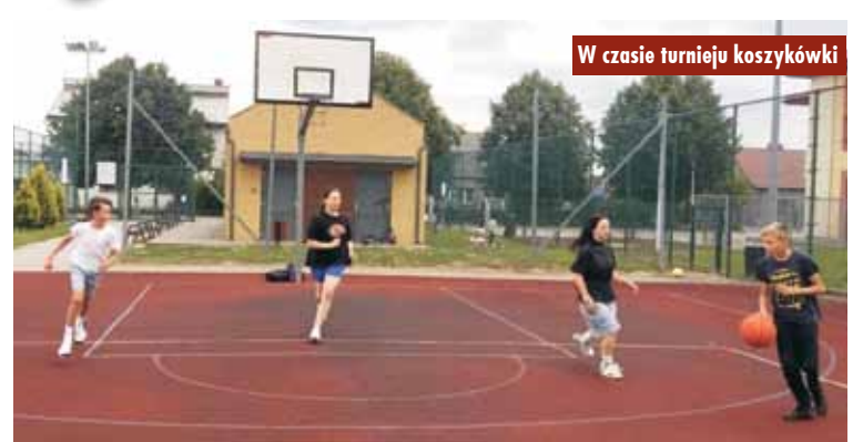
W czasie turnieju koszykówki

Organizatorzy gratulują uczestnikom i zapraszają do udziału w kolejnych rozgrywkach. Oprac. m