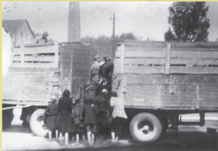
Transporty Żydów do Kulmhof. Fotografia została wykonana prawdopodobnie podczas likwidacji getta w Zdunskiej Woli, ale w Wieruszowie wyglądało to podobnie.

W sobotę 15 sierpnia żandarmi weszli do kościoła i nakazali wszystkim wyjść. Ci, którzy nie mogli chodzić, zostali na miejscu zastrzeleni. Było to 5 osób. Wkrótce po tym wzięto mnie i jeszcze 19 osób. Przyprowadziliśmy wózek Chewry Kadisy (bractwa pogrzebowego). Włożyliśmy zastrzelonych