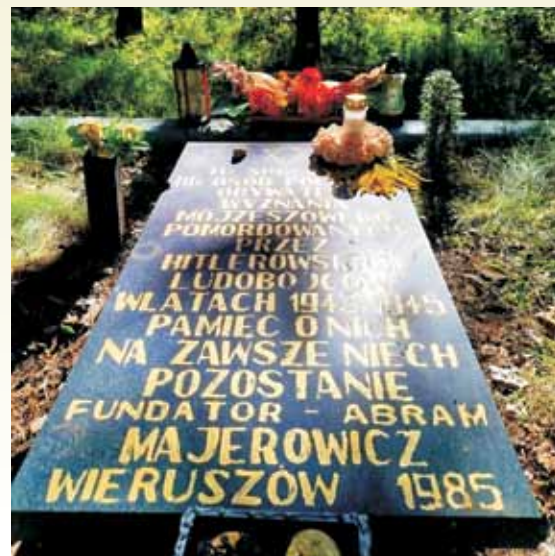
Tablica pamiątkowa na zbiorowej mogile wieruszowskich Żydów zamordowanych w mykwie w czasie likwidacji getta