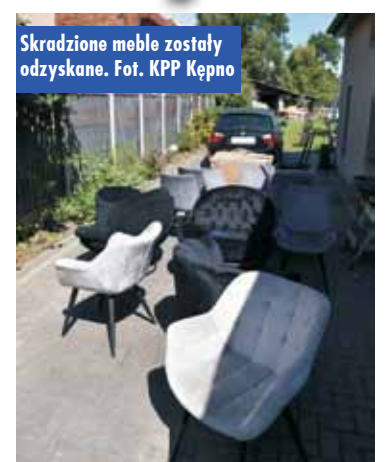
Skradzione meble zostały odzyskane.