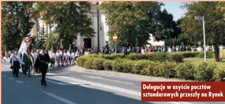
Delegacje w asyście pocztów sztandarowych przeszły na Rynek

poczęto je mszą świętą w intencji ojczyzny, odprawioną w kościele pw. św. Marcina w Kępnie. Następnie delegacje władz samorządowych, służb mundurowych, szkół, instytucji i organizacji w asyście pocztów sztandarowych przemaszewowały na kępiński Rynek, gdzie pod Pomnikiem Bohaterów Walk o Wolność i Demokrację złożono kwiaty, odśpiewano hymn, a podczas dźwięku syreny oddano cześć walczącym za