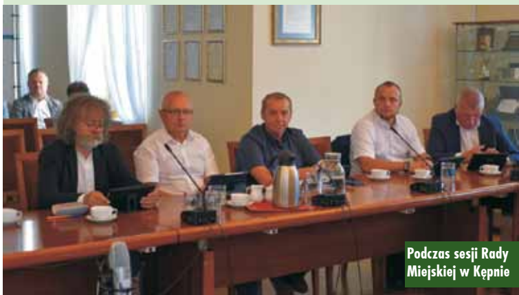
Podczas sesji Rady Miejskiej w Kępnie