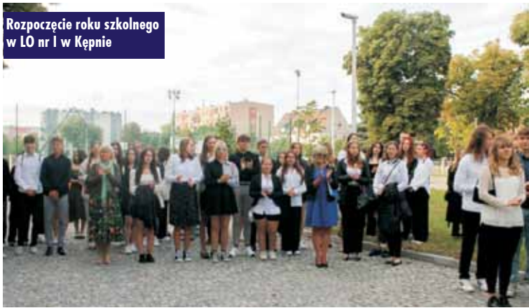
Rozpoczęcie roku szkolnego w LO nr I w Kępnie

Urzędzie Miasta i Gminy w Kępnie. - W porównaniu do poprzedniego roku szkolnego, liczba uczniów rozpoczynających klasę I jest zbliżona. Na podstawie danych demograficznych w kolejnych latach spodziewamy się mniejszej liczby pierwszoklasistów. Od 2 września wśród 320 pierwszoklasistów naukę rozpocznie 49 obcokrajowców, z czego aż 45 w szkołach na terenie Kępna (w tym 38 ze statusem uchodźcy), co jest wartością znacznie większą od roku poprzedniego (21 obcokrajowców ze statusem uchodźcy) – podsumowuje naczelnik.