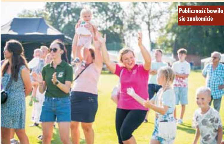
Publiczność bawiła się znakomicie