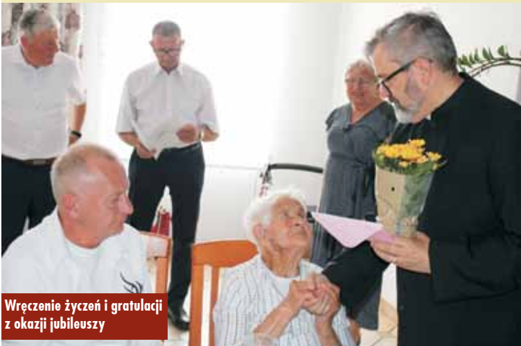
Wręczenie życzeń i gratulacji z okazji jubileuszy

Zdarzenie na drodze krajowej nr 39 w Mroczeniu