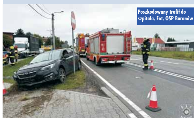
Poszkodowany trafił do szpitala.

paliw. Pojazdem podróżował jedynie kierowca. - Działania strażaków polegały na zabezpieczeniu miejsca zdarzenia oraz udzieleniu kwalifikowanej pierwszej pomocy poszkodowanemu mężczyźnie. Przybyły na miejsce zdarzenia Zespół Ratownictwa Medycznego, po przebadaniu osoby poszkodowanej, podjął decyzję o przewożeniu jej do szpitala – relacjonuje oficer prasowy KP PSP Kępno, st. kpt. Paweł Michalski. Oprac. KR