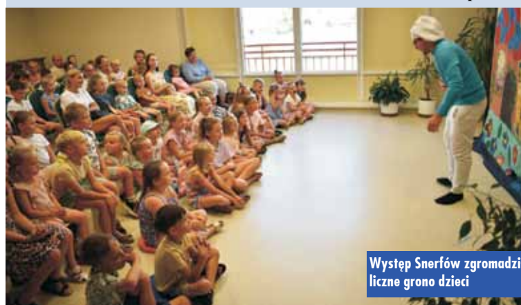
Występ Smerfów zgromadził liczne grono dzieci