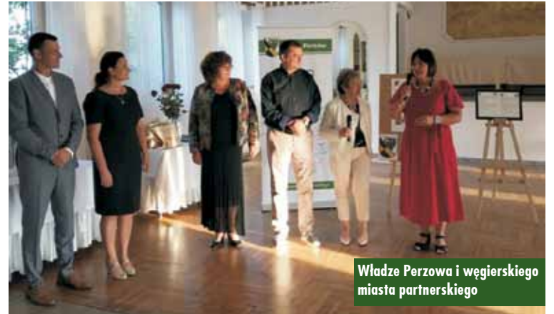
Władze Perzowa i węgierskiego miasta partnerskiego

W kolejnych dniach delegacja udała się z wizytą do Torunia, by