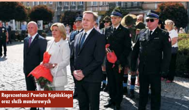
Reprezentanci Powiatu Kępińskiego oraz służb mundurowych

by ból i trwoga zaczęły blaknąć. (...) Wojna nie wybrała sobie neutralnego, zarezerwowanego do walki gruntu. Nie przechodziła obok ludzi. Nie była starciem na określonym polu czy rozgrywką według przyjętych zasad. Wojna totalna, ludobójstwo, eliminacja całych nacji, nienawiść, bestialstwo. (...) II wojna światowa po dziś dzień skrywa swoje tajemnice, Bóg jeden wie, czy nie straszniejsze niż dostępne teraz fakty. (...) Niech ten krwawy rozdział jest przestrogą dla każdego, kto decyduje się wejść na drogę zadawania śmierci lub tego, kto chce hodować w sobie nienawiść. Cywilizowany świat wstawał z kolan po rozlicznych tragediach, lecz nie ma gwarancji, że będzie tak za każdym razem. W dążeniu do pokoju każdy ma swoją rolę. Nigdy więcej wojny! – podkreślał.