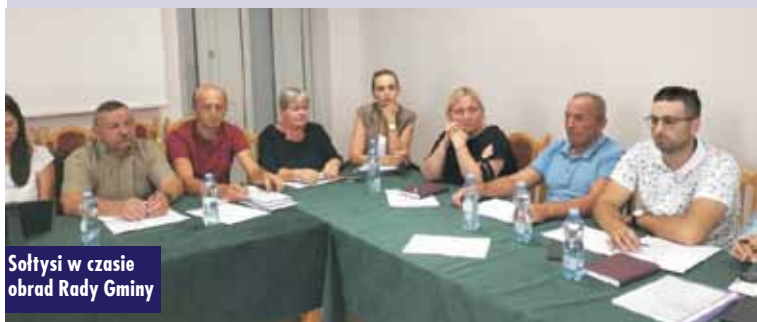
Sołtysi w czasie obrad Rady Gminy

Wprowadzono również zmiany w budżecie gminy ustalając łączną kwotę dochodów budżetowych na 2024 rok w wysokości 52.272.186,10 zł i wydatków budżetu na 2024 rok w wysokości 58.264.668,22 zł., a wieloletnią prognozę finansową Gminy Perzów dostosowano do zmian w budżecie. Oprac. m