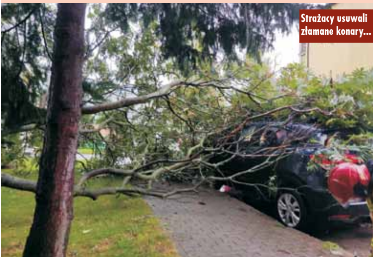
Strażacy usuwali złamane konary...