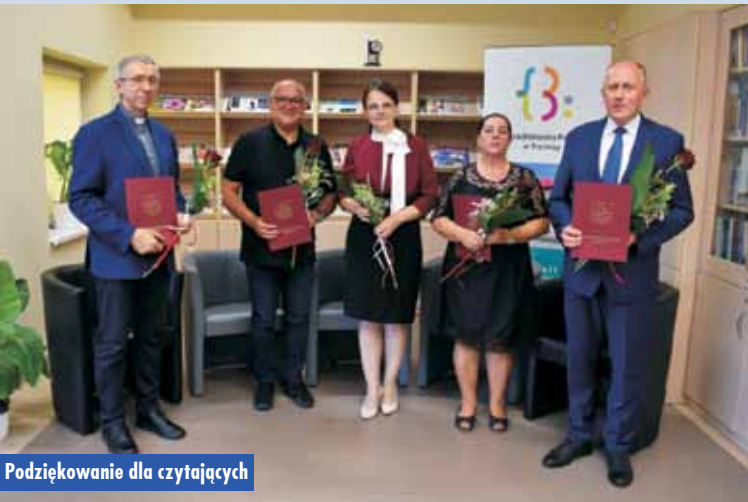
Podziękowanie dla czytających