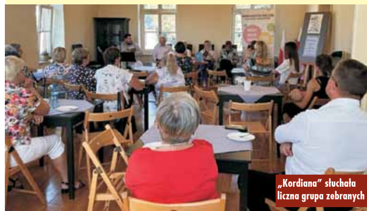
„Kordiana” słuchała liczna grupa zebranych