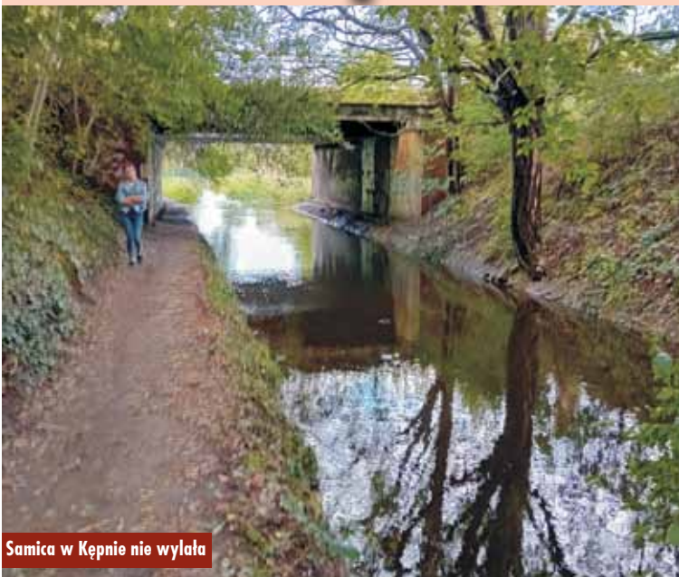
Samica w Kępnie nie wylała

W miniony weekend strażacy na terenie powiatu kępińskiego, w związku z usuwaniem skutków silnego wiatru, interweniowali łącznie 13-krotnie. - Działania strażaków polegały głównie na usuwaniu zagrożeń w postaci nadłamanych konarów drzew. Ponadto w miejscowości Czermin doszło do powalenia drzewa, które oparło się o budynek