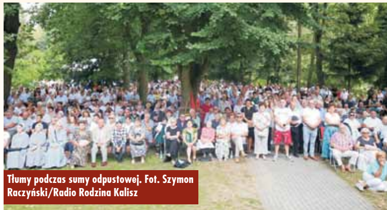
Tłumy podczas sumy odpustowej.