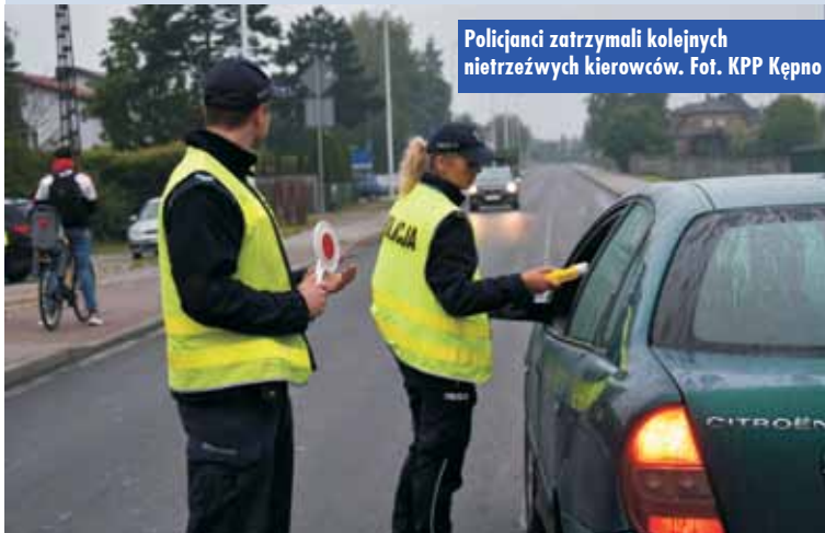
Policjanci zatrzymali kolejnych nietrzeźwych kierowców.

14 września br., o godzinie 8.45, policjanci Wydziału Ruchu Drogowego KPP Kępno dokonali zatrzymania w Mroczeniu 49-letniego obywatela Uzbekistanu, który kierował samochodem marki Deawoo, znajdując się pod wpływem alkoholu – badanie alkomatem wskazało prawie 3 promile alkoholu w wydychanym powietrzu.