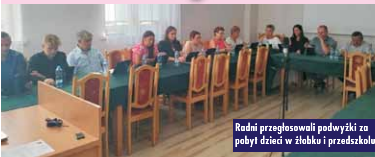
Radni przegłosowali podwyżki za pobyt dzieci w żłobku i przedszkolu

W trakcie sesji przyjęto dwie uchwały. W związku z ogólnym wzrostem kosztów świadczenia usług opiekuńczo-wychowawczych dla dzieci w wieku do 3 lat, w tym w szczególności związanym ze wzrostem cen energii elektrycznej i gazu, a także wzrostem minimalnego wynagrodzenia w styczniu 2024 r. i lipcu 2024 r., koniecznym stało się zaktualizowanie wysokości stałej miesięcznej opłaty za pobyt dziecka w żłobku utworzonym przez Gminę Perzów w wymiarze do 10 godzin, jak również opłaty dodatkowej za wydłużony wymiar opieki, tj. powyżej 10 godzin, na wniosek rodzica. Od 1 października br. miesięczna opłata stała za pobyt dziecka w żłobku gminnym w Perzowie w wymiarze do 10 godzin dziennie wynosić będzie 1 500 zł. Za pobyt stały dziecka w żłobku powyżej 10 godzin dziennie dodatkowa opłata wyniesie 20,00 zł za każdą rozpoczętą godzinę opieki w danym dniu. Wzrost cen obejmuje także ceny żywności, zatem