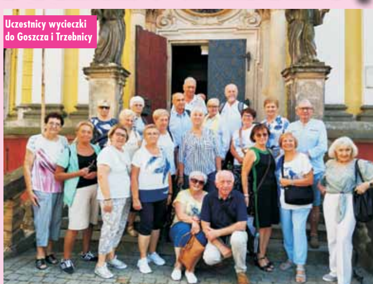
Uczestnicy wycieczki do Goszcza i Trzebnicy