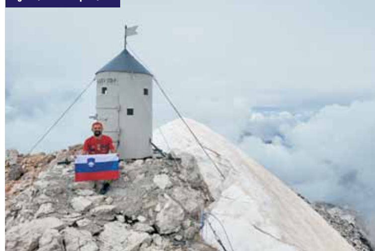
Najwyższy szczyt Słowenii, Triglav (1864 m n.p.m.)

ka dzików, zające, sarny, jelenie czy wiewiórki. - Co do szlaku, z pewnością był on najtrudniejszy w moim życiu. Mogę określić dwa najtrudniejsze etapy: pierwszy to Alpy Ju-