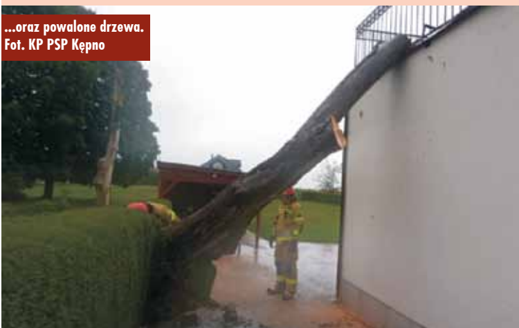
...oraz powalone drzewa.

Samorząd Województwa Wielkopolskiego przekazał 2,5 mln zł dla Spółek Wodnych funkcjonujących na terenie naszego województwa. Środki trafią do 132 Spółek na bieżące utrzymanie wód i urządzeń wodnych, zapewniając ich właściwy stan i działanie