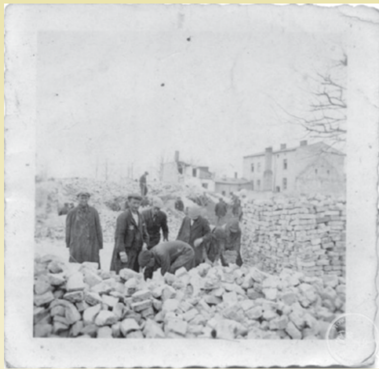
Żydzi pracujący przy porządkowaniu gruzów (o pracę Żydów w Wieruszowie do początków 1940 r. - mówi o tym Pankowski)

Łaźnia z mykwą też pozostała taka, jaka była. Mykwa, w której ludzie mieli zwyczaj się zanurzać, była zatkana, i były tam książki, księgi święte, nie zwoje Tory, ale były księgi