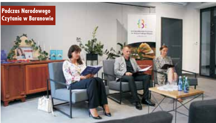
Podczas Narodowego Czytania w Baranowie