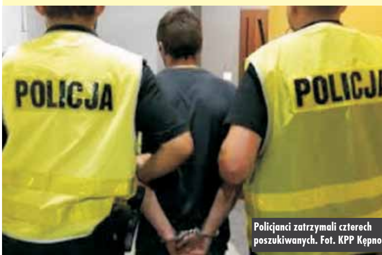
Policjanci zatrzymali czterech poszukiwanych.