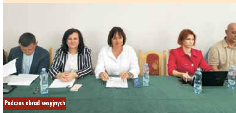
Podczas obrad sesyjnych

Wprowadzono również zmiany w budżecie gminy, ustalając łączną kwotę dochodów budżetowych na 2024 r. w wysokości 52 696 413,54 zł i wydatków budżetu na 2024 r. w wysokości 58 688 895,66 zł, a Wieloletnią Prognozę Finansową Gminy Perzów dostosowano do zmian w budżecie. Oprac. m