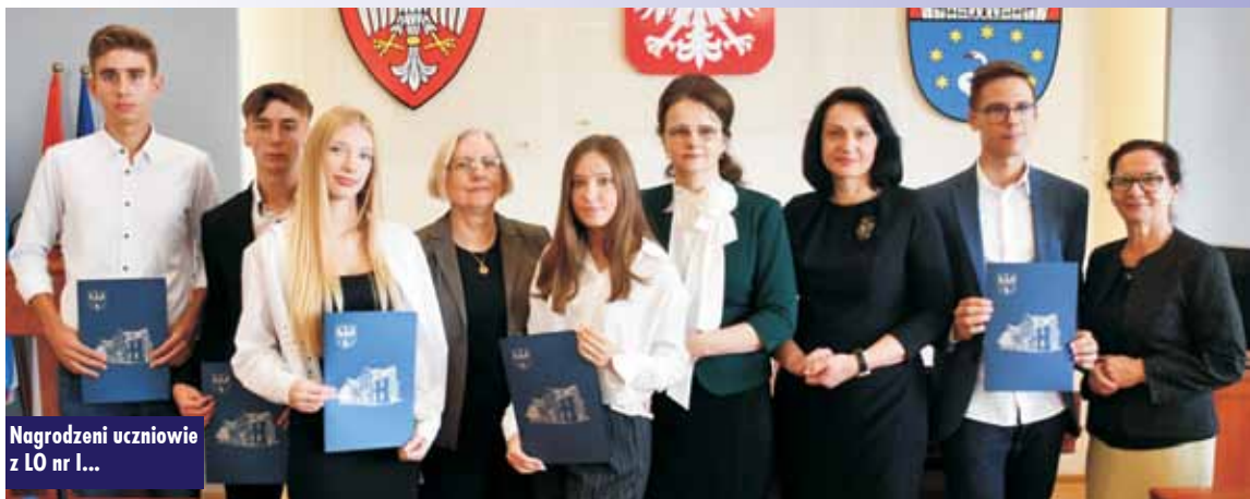
Nagrodzeni uczniowie z LO nr 1...