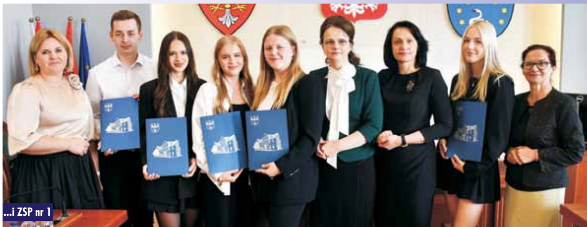
...i ZSP nr 1