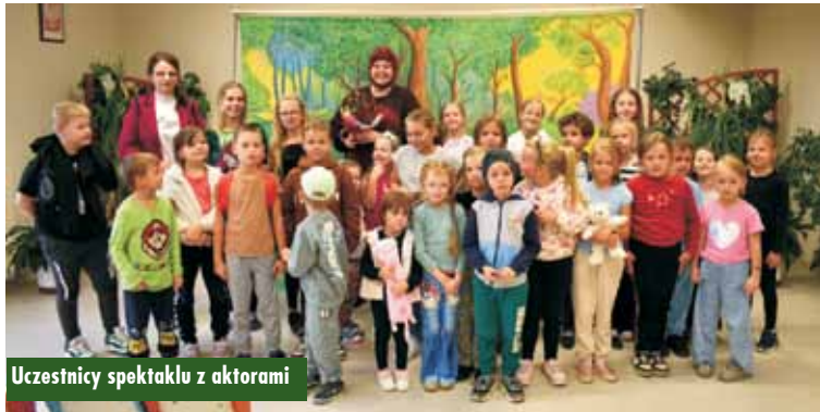
Uczestnicy spektaklu z aktorami