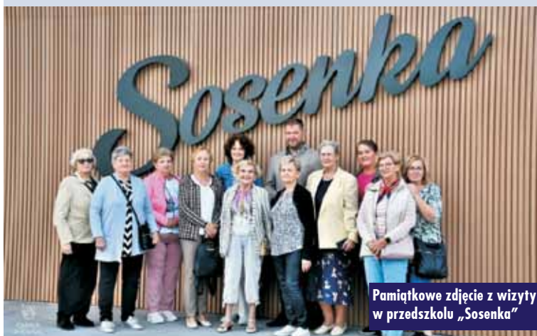
Pamiątkowe zdjęcie z wizyty w przedszkolu „Sosenka”

Na zakończenie spotkania seniorki podziękowały za serdeczne przyjęcie i wyraziły swoją radość z obserwacji, jak gmina Rychtal rozwija się i inwestuje w edukację młodych mieszkańców. Oprac. KR