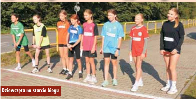
Dziewczęta na starcie biegu

24 września br. na terenie kompleksu sportowego w Krążkowach odbyły się Mistrzostwa Powiatu w Sztafetowych Biegach Przełajowych Szkół Podstawowych.