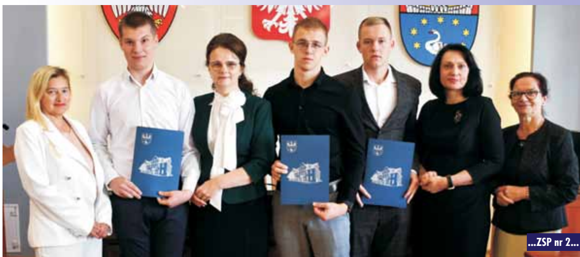
...ZSP nr 2...