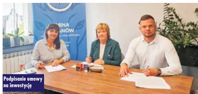
Podpisanie umowy na inwestycję

ścieżek rowerowych. Odwodnienie powierzchniowe jest zapewnione poprzez obustronne rowy przydrożne. Po wschodniej stronie znajduje się oświetlenie uliczne. Inwestycja obejmuje rozbudowę tego skrzyżowania z drogą krajową nr 39 oraz dojazdem do obiektów firmy MIRJAN24. W jej ramach przewidziano budowę skrzyżowania skanalizowanego o czterech wlotach oraz dodatkowe pasy lewoskrętów z drogi krajowej.