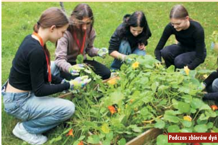
Podczas zbiorów dyni