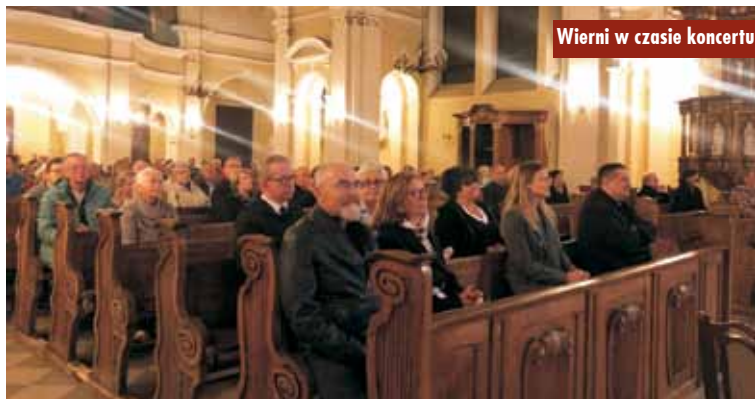
Wierni w czasie koncertu

Podczas wydarzenia muzycznego uzbierano kwotę 6350 zł oraz otrzymano deklarację pomocy rzeczowej. Dziękujemy! MR