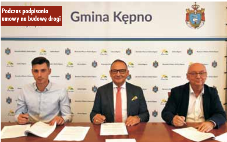
Podczas podpisania umowy na budowę drogi

Po raz kolejny policjanci zorganizowali zbiórkę rzeczy, które przekazano dzieciom z Zespołu Szkół Specjalnych w Słupi pod Kępem