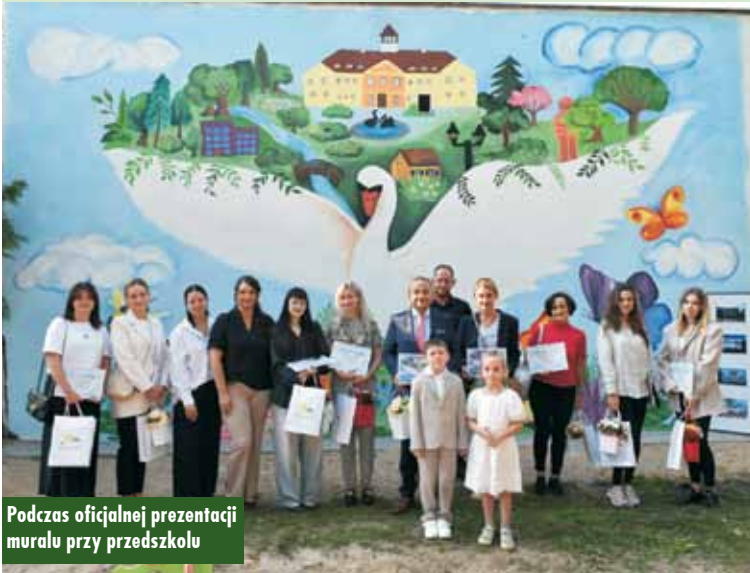
Podczas oficjalnej prezentacji muralu przy przedszkolu

Podpisanie umowy na budowę drogi gminnej w Mikorzynie