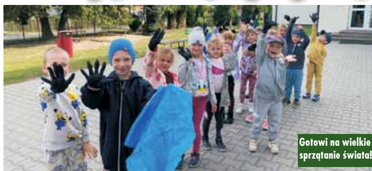
Gotowi na wielkie sprzątanie świata!