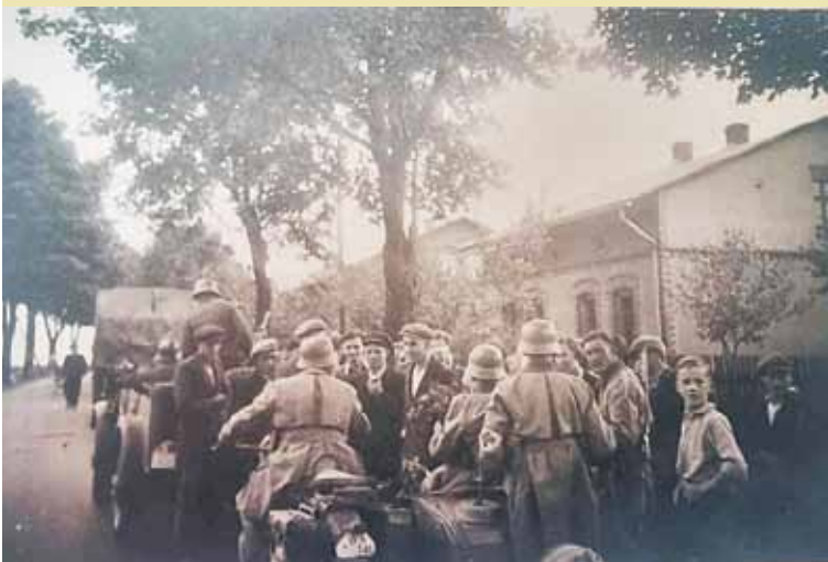
Mniejszość niemiecka w powiecie kępińskim wita żołnierzy Wehrmachtu.

łu mieszkańców. Niemcy mieszkali głównie na pograniczu, w miejscowościach przyłączonych do Polski w 1920 r. z powiatów namysłowskiego i sycowskiego [3] .