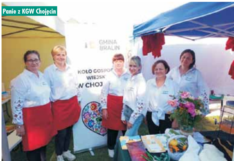
Panie z KGW Chojeńcin