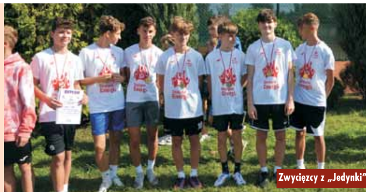
Zwycięzcy z „Jedynki”

Do zawodów przystąpiło ponad dwieście zawodniczek i zawodników z powiatu kępińskiego. W kategorii dziewcząt z rocznika 2012 i młodsze zwyciężyła reprezentacja Szkoły Podstawowej nr 3 im. Przemysła II w Kępnie. W kategorii chłopców dominowała Szkoła Pod-