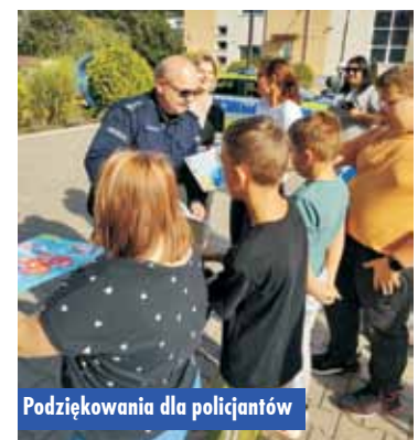
Podziękowania dla policjantów

Publikujemy cykl fotografii, na których w minionych latach uwiecznieni zostali mieszkańcy naszego regionu. Liczymy na to, że rozpoznają się oni na archiwalnych zdjęciach i napiszą do nas (e-mail: tygodnik@kepno.net ), za co otrzymają nagrody książkowe.