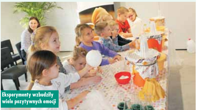
Eksperymenty wzbudziły wiele pozytywnych emocji

okazję wykonywać eksperymenty oraz tworzyć zabawki sensoryczne.