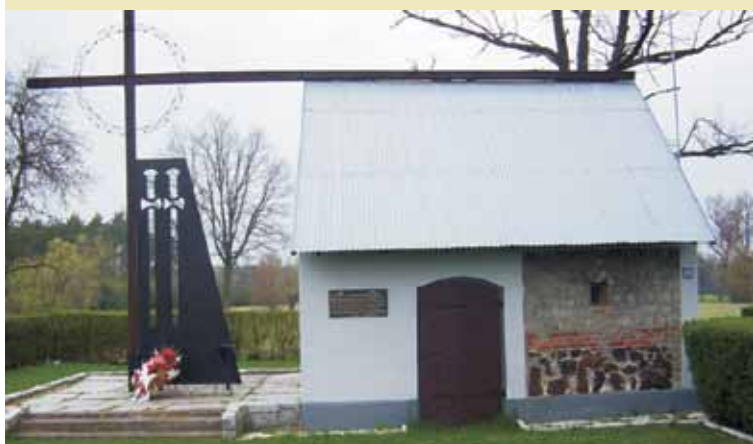
Pomnik w Torzeńcu

wrześniu 1939 r. ruch partyzancki, w który zaangażowana byłaby ludność cywilna, jeszcze nie powstał [11] . Wprawdzie jednostki partyzanckie odegrały w okresie niemieckiej okupacji Polski znaczącą rolę, niemniej jednak uformowały się one dopiero zimą na przełomie 1939 i 1940 r. [12] . Wojska niemieckie, które wkroczyły do Wyszynowa i sąsiedniego Torzeńca, również nie natrafiły na żadne grupy partyzanckie, ani na zwarte jednostki polskiego wojska. Jedynie od czasu do czasu przez wieś przechodzili żołnierze z rozproszonych oddziałów polskich [13] Jacek Zadka