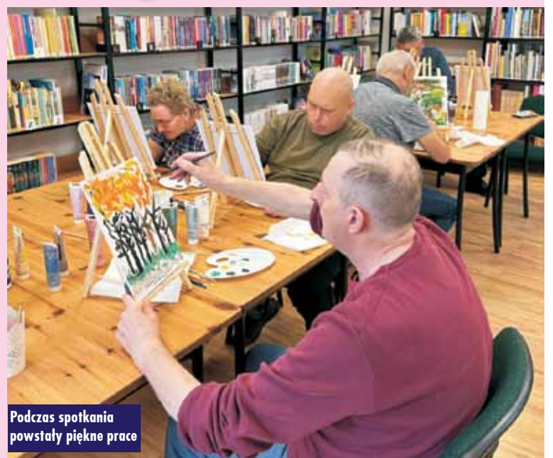
Podczas spotkania powstały piękne prace