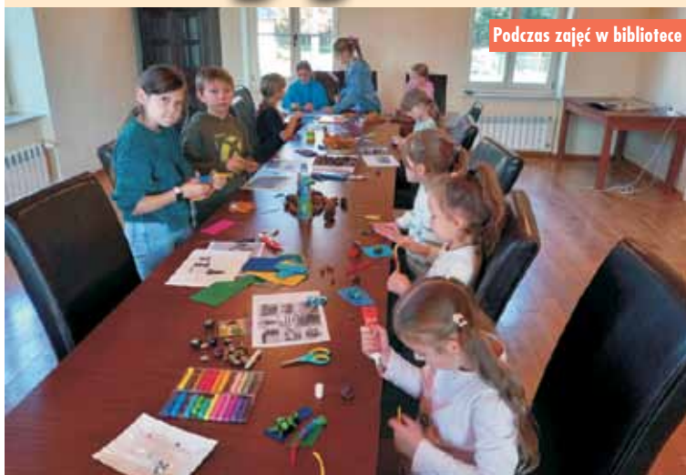
Podczas zajęć w bibliotece

Spotkanie rozpoczęło się od wysłuchania opowiadania pt.: „Jak wygląda Pani Jesień?” Aliny Gieruń, przeczytanego przez uczestniczki zajęć. Podczas warsztatów dzieci rozwiązywały zagadki i krzyżówki o tematyce jesiennej. W tym dniu nie zabrakło również zajęć plastycznych. Uczestnicy z entuzjazmem wykonali prace, wykorzystując do swoich dzieł prawdziwe dary jesieni: kolorowe