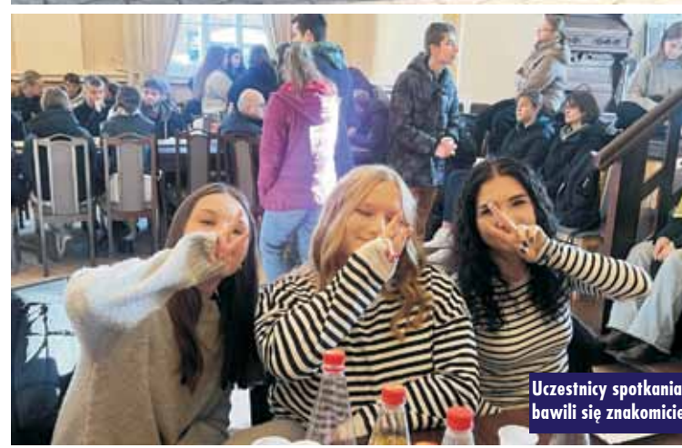
Uczestnicy spotkania bawili się znakomicie