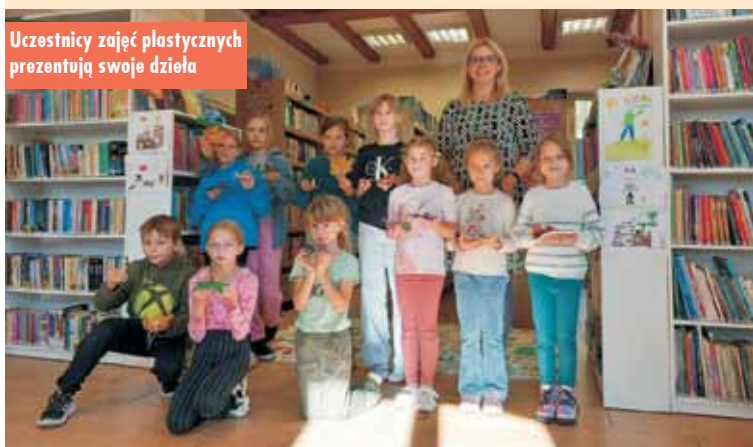
Uczestnicy zajęć plastycznych prezentują swoje dzieła