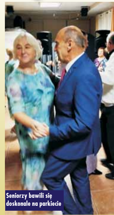
Seniorzy bawili się doskonale na parkiecie

Gmina Kępno w gronie liderów programu „Czyste powietrze”