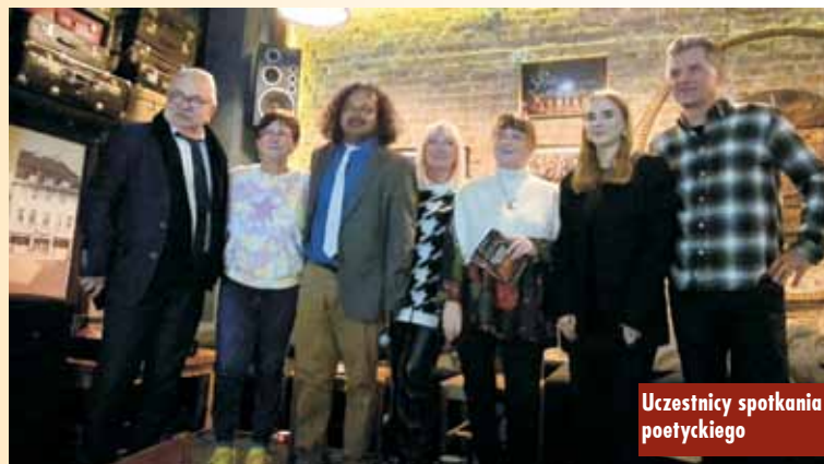
Uczestnicy spotkania poetyckiego

Rozchodząc się w poetyckim, ekstatyczno-emocjonalnym nastroju, wypełnionym poezją bengalskiego gościa, weszliśmy w jesienny, kępiński, chłodny wieczór. m