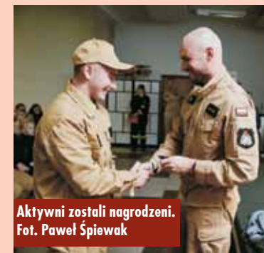
Aktywni zostali nagrodzeni.

przyszłości – dodaje mł. kpt. W. Wielgosz . - Cieszę się, że mogę uczestniczyć w takim wydarzeniu. Moim zdaniem takie spotkania z młodzieżą będą owocować na przyszłe lata. Cieszę się też, że mogłem przedstawić moją karierę zawodową i swoją