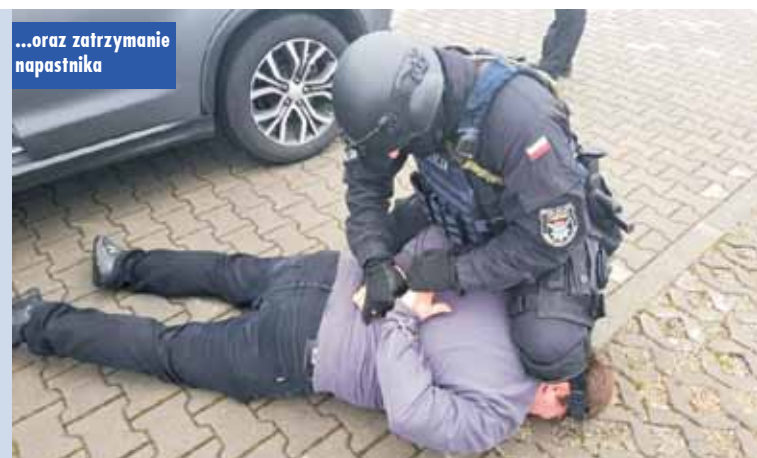
...oraz zatrzymanie napastnika

jedna osoba, a kilka zostało rannych. Policja zatrzymała napastnika, a pirotechnicy przejęli inny ładunek wybuchowy. Celem była przede wszystkim edukacja dotycząca zachowań w sytuacji zagrożenia terrorystycznego. Był to również pokaz działań służb ratowniczych: policjantów, strażaków oraz ratowników medycznych. Odbyło się też szkolenie antyterrorystyczne, prowadzone przez jednego z najwybitniejszych w Polsce ekspertów z zakresu działań antyterrorystycznych oraz otwarta konferencja naukowa z udziałem naukowców i studentów Uniwersytetu Kaliskiego im. Prezydenta S. Wojciechowskiego i Akademii Mazowieckiej w Płocku. Przy okazji zaprezentowano też sprzęt ratowniczy. KR