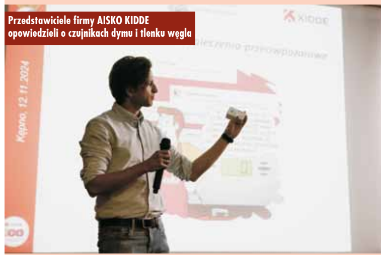
Przedstawiciele firmy AISKO KIDDE opowiedzieli o czujnikach dymu i tlenu węgla

Spotkanie było także okazją do edukacji na temat bezpieczeństwa pożarowego. Przedstawiciele firmy AISKO KIDDE opowiedzieli o zasadach stosowania czujników tlenu węgla oraz czujek dymu, a także zachęcali młodzież do uczestnictwa w kampanii „Czujka pod każdą strzechą”. Dzięki tej inicjatywie młodzi strażacy zdobyli wiedzę, która może być przydatna zarówno w ich domach, jak i podczas przyszłych działań ratowniczych. KR