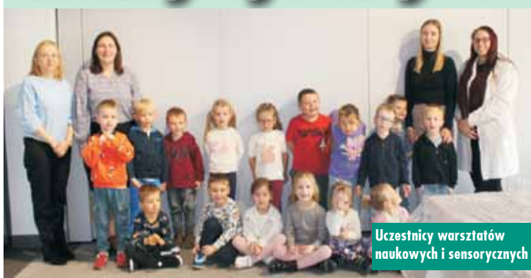
Uczestnicy warsztatów naukowych i sensorycznych

Od 5 listopada br. w Gminnej Bibliotece Publicznej w Baranowie odbywały się trzydniowe warsztaty naukowe i sensoryczne pn. „Cztery żywioły”.