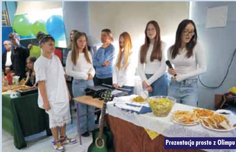
Prezentacja prosto z Olimpu

Jako motto klasie VIII posłużyły słowa piosenki Krzysztofa Krawczyka : „Opowiedz nam, czym żyjesz dziś”. Najstarsza klasa zaprezentowała uczestnikom wydarzenia grecki, ludowy taniec – Zorbę. Ten starożytny kraj z górą Olimp urzekł uczniów postaciami z mitologii, a także wyśmienitym jedzeniem, takim jak: pita,