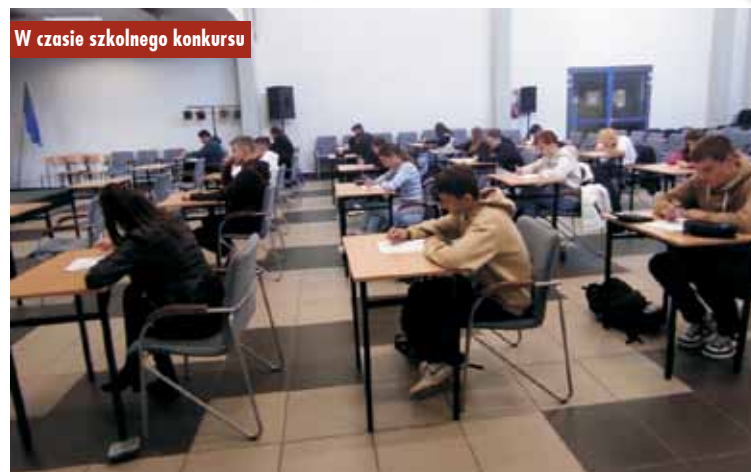
W czasie szkolnego konkursu

W październiku w Zespole Szkół Ponadpodstawowych nr 2 w Kępnie odbyły się eliminacje szkolne XLVIII edycji Olimpiady Wiedzy i Umiejętności Rolniczych w czterech blokach przedmiotowych: agrobiznes, mechanizacja rolnictwa, produkcja roślinna i produkcja zwierzęca. W eliminacjach udział wzięło trzydziestu uczniów,