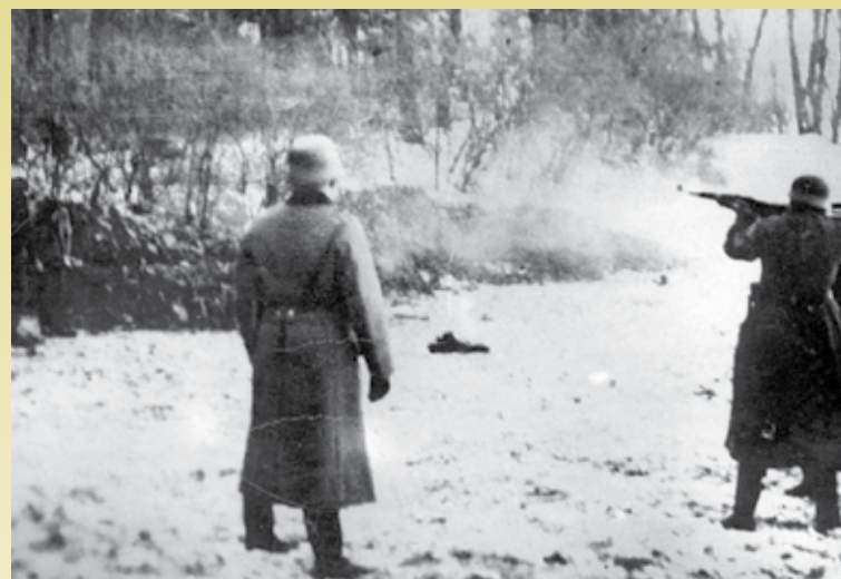
Egzekucja Polaków przez policję niemiecką

Niemieccy żołnierze, dokonując pacyfikacji wsi Torzeniec i Wyszynów, ulegli obsesji na punkcie party-