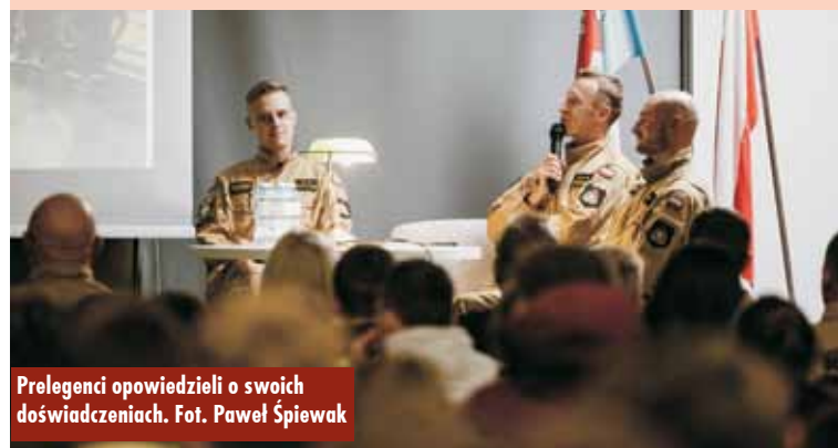
Prelegenci opowiedzieli o swoich doświadczeniach.

my, by te spotkania rozpalili chęć wstępowania młodzieży do Młodzieżowych Drużyn Pożarniczych, aktywizowania się w tych organizacjach, aby teraz zasiane ziarno za kilka lat wydało owoce – zaznacza.