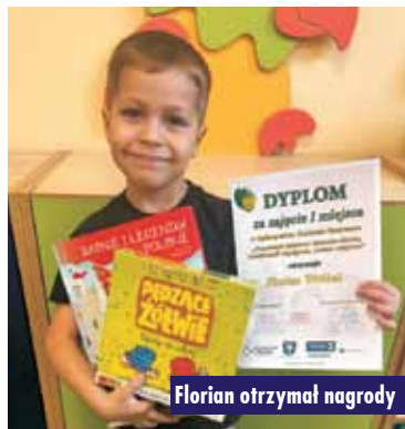
Florian otrzymał nagrody