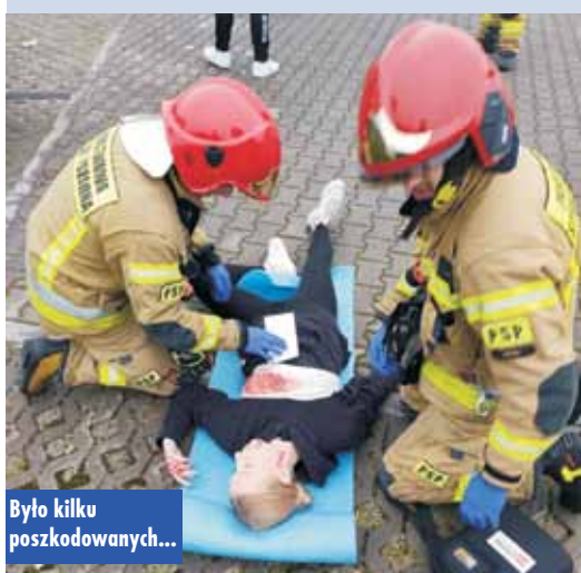
Było kilku poszkodowanych...

spektakularne wydarzenie edukacyjno-szkoleniowe – pokaz antyterrorystycznych działań służb ratowniczych.