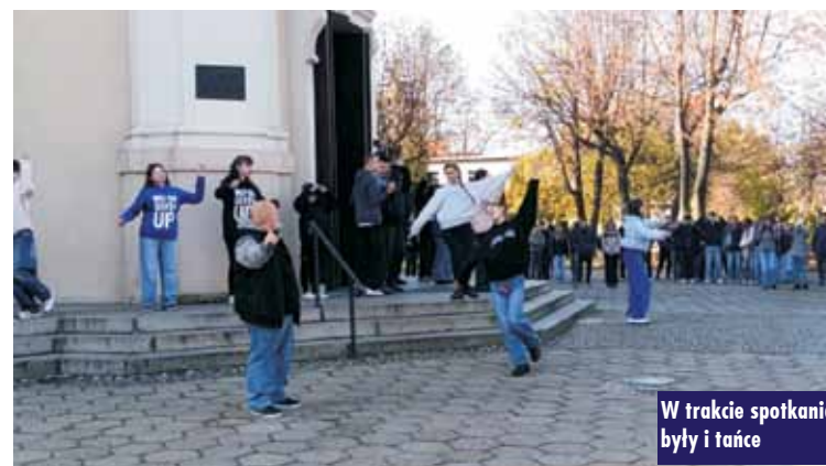
W trakcie spotkania były i tańce