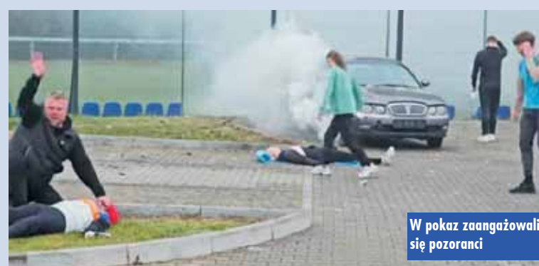
W pokaz zaangażowali się pozoranci