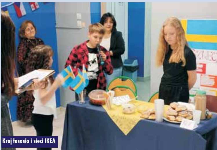
Kraj łosia i sieci IKEA