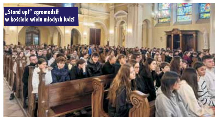
„Stand up!” zgromadził w kościele wielu młodych ludzi

Spotkania „Stand up!” to inicjatywa duszpasterska, zapoczątkowana we wrześniu 2016 r. jako odpowiedź na słowa papieża Franciszka, który podczas Światowych Dni Młodzieży w Krakowie zachęcał ludzi młodych do wstania z kanapy. Inicjatywa ta ma formę comiesięcznych spotkań modlitewnych, odbywających się w różnych parafiach diecezji kaliskiej.