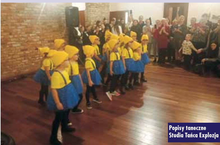
Popisy taneczne Studia Tańca Explozja