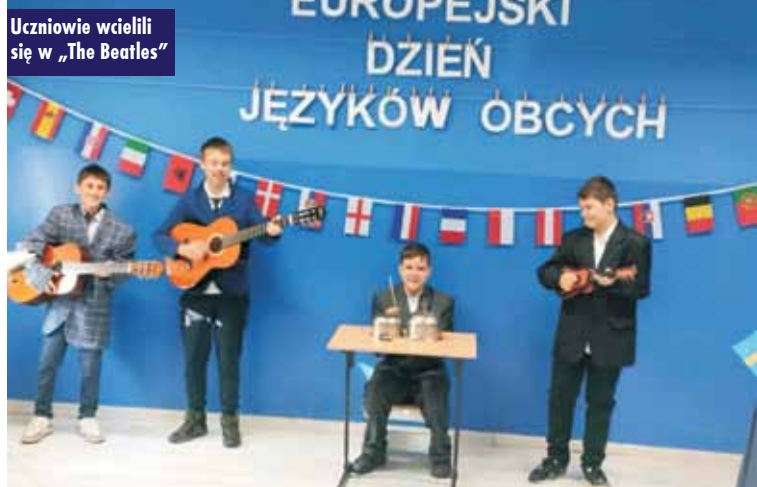
Uczniowie wcieli się w „The Beatles”

Kraj łosia i sieci IKEA pojawił się na scenie z wykonaniem „Mamma mia” zespołu ABBA. Kreatywność V klasy sprawiła, że wszyscy poczuli skandynawskie klimaty i smaki prostych, aczkolwiek przepysznych potraw: klopsików w sosie, aromatycznych cynamonów czy śledzików. W