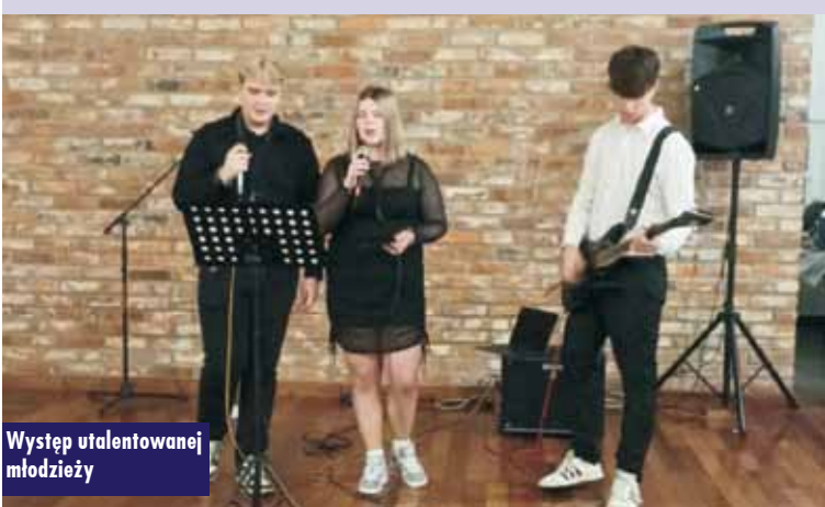
Występ utalentowanej młodzieży