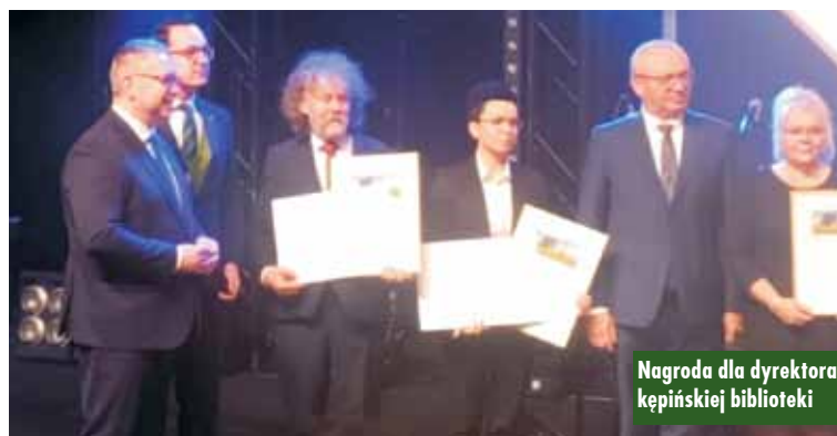
Nagroda dla dyrektora kępińskiej biblioteki

20 listopada br. w Pub Gramophone odbyła się prezentacja tomu poezji literata ze Sri Lanki