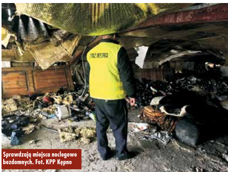
Sprawdzają miejsca noclegowe bezdomnych.

MECHANIKA - BLACHARSTWO SAMOCHODOWE EXPORT - IMPORT WIESŁAW WALOSZCZYK