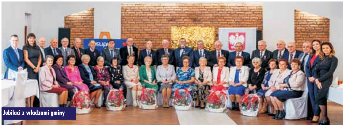
Jubilaci z władzami gminy