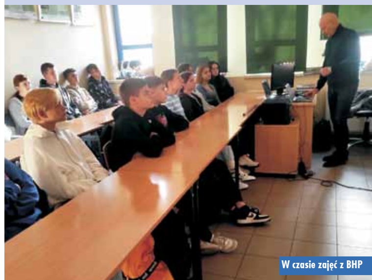
W czasie zajęć z BHP