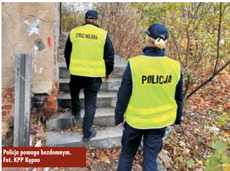
Policja pomaga bezdomnym.

- Jeżeli znasz miejsce przebywania osób bezdomnych, które w okresie chłódów nie będzie dla nich wystarczającym schronieniem, by zapobiec tragedii, poinformuj dzielnicowego lub Ośrodek Pomocy Spo-