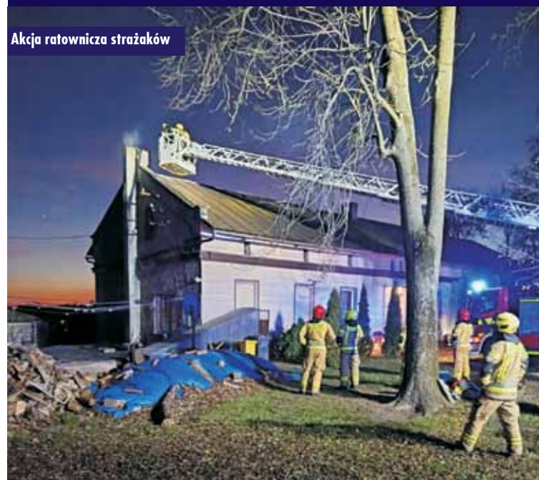
Akcja ratownicza strażaków

25 listopada br., około godziny 16:11, do Powiatowej Państwowej Straży Pożarnej w Kępnie wpłynęło zgłoszenie o pożarze budynku mieszkalnego przy ul. Parkowej w Opatowie. Na miejsce zdarzenia zadysponowano zastępy z OSP Opatów, OSP Baranów oraz Jednostki Ratowniczo-Gaśniczej z Kępna.