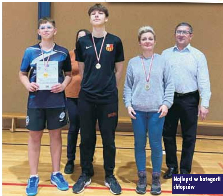
Najlepsi w kategorii chłopców

Policjanci komendy Powiatowej Policji w Kępnie zatrzymali cztery osoby poszukiwane. Jeden z mężczyzn był poszukiwany listem gończym