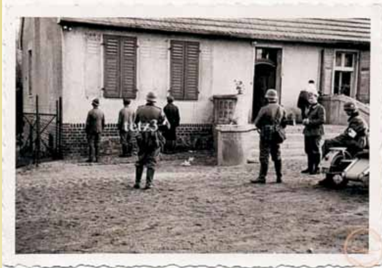
Niemcy w Donaborowie

Hitlerowcy zaraz po zagarnięciu ziem polskich przystąpili do realizacji operacji Tannenberg ( Unternehmen Tannenberg ) mającej na celu likwidację elementu przywódczego polskiego społeczeństwa. Polityczne oczyszczanie gruntu ( Politische Flurbereinigung ) przeprowadzono w oparciu o wykazy ludności polskiej najbardziej zasłużonej dla Rzeczypospolitej ( Fahndungsbuch ). Listy proskrypcyjne były przygotowane jeszcze przed napaścią, zawierały nazwiska osób wrogo nastawionych do Rzeszy, członków polskich organizacji, przedstawicieli administracji państwowej, uczestników powstania wielkopolskiego i duchowieństwa. Na listach proskrypcyjnych znalazły się następujące nazwiska osób z powiatu kępińskiego 1 :