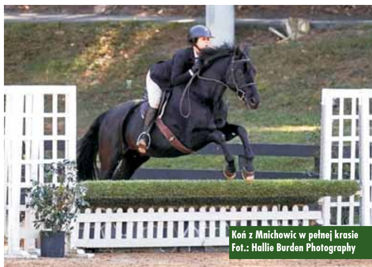
Koń z Mnichowic w pełnej krasie

Pierwotnie zarejestrowany jako Bosman (Aron sp. - Balada wlkp/ Boss wlkp) w Polskim Związku Hodowców Koni, ten niezwykle wałach jest dowodem na renomowaną