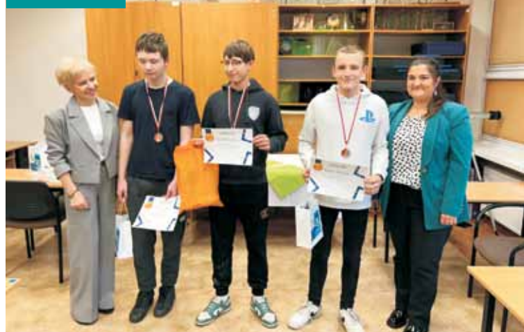
Zwycięzcy turnieju w warcabach

Odbyły się Drużynowe Mistrzostwa Powiatu w Tenisie Stołowym Dziewcząt i Chłopców