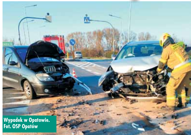
Wypadek w Opatowie.

16 listopada br., około godziny 14.30, do Stanowiska Kierowania Komendanta Powiatowej Państwowej Straży Pożarnej w Kępnie wpłynęło zgłoszenie o zdarzeniu drogowym na ul. Słonecznej w Opatowie. Na miejscu zdarzenia zadysponowano zastępy z Jednostki Ratowniczo-Gaśniczej w Kępnie i OSP Opatów.