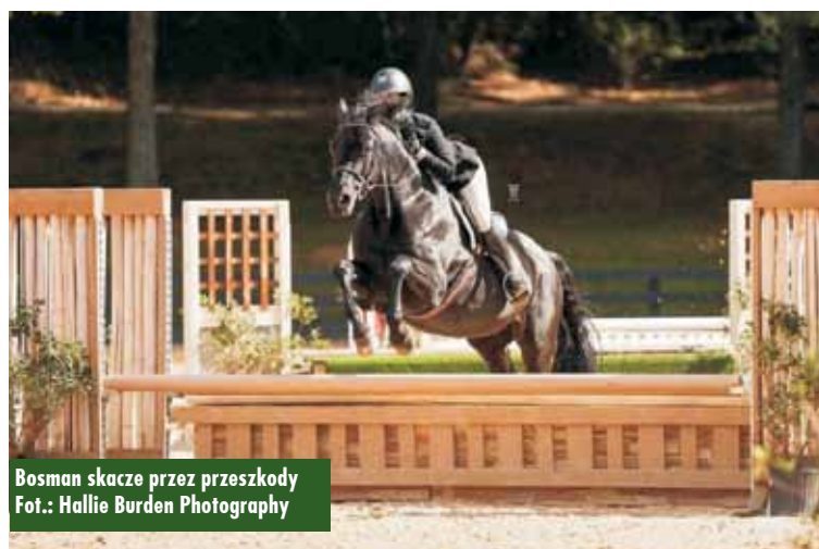
Bosman skacze przez przeszkody