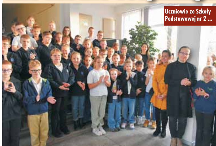
Uczniowie ze Szkoły Podstawowej nr 2 ...

Przedszkole Samorządowe nr 4 w Kępnie zostało Mistrzem Recyklingu. Drugie miejsce zajęła SP nr 2, a trzecie Przedszkole nr 2