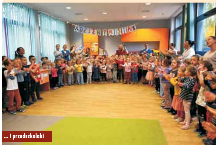
... i przedszkolaki