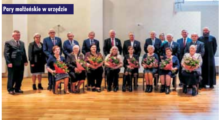
Pary małżeńskie w urzędzie

chowiak – proboszcz parafii Opatów. W trakcie eucharystii małżonkowie odnowili swoje ślubne przyrzeczenia.