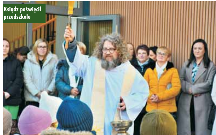
Ksiądz poświęcił przedszkole