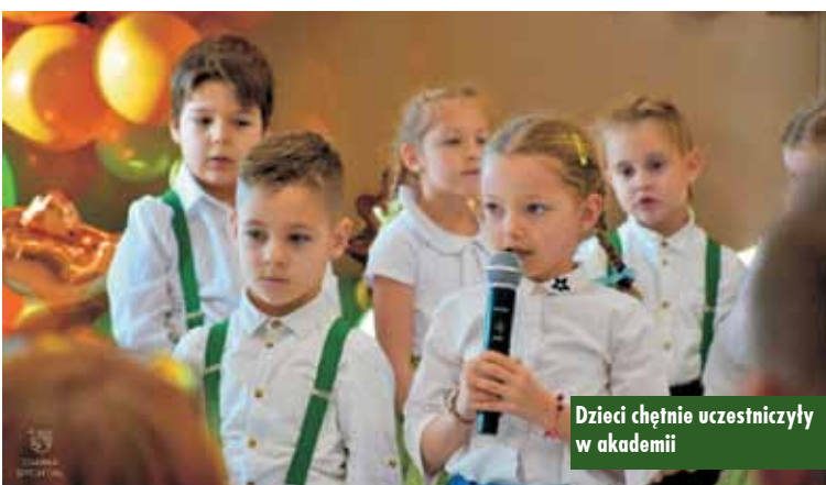
Dzieci chętnie uczestniczyli w akademii

Uroczystości zakończyły się wspólnym posiłkiem w serdecznej atmosferze, podkreślając znaczenie