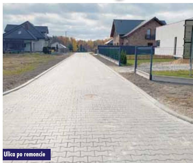
Ulica po remoncie

W miejsce dotychczasowej drogi gruntowej wykonano drogę o nawierzchni z kostki betonowej o szerokości 4m i długości 155m, w tym między innymi: wykonanie koryta, kanalizacji deszczowej, podbudowy i warstwy podłoża z gruntu stabilizowanego cementem, wykonanie jezdni obustronnie ograniczonej krawężnikami betonowymi najazdowymi oraz nawierzchni z betonowej kostki brukowej typu Holland.