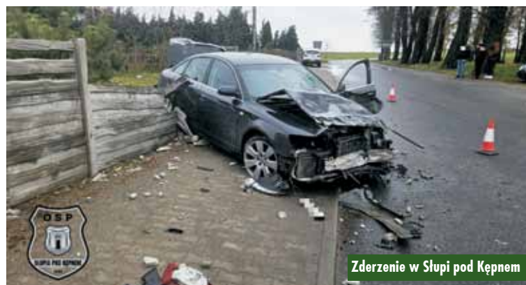
Zderzenie w Słupi pod Kępem