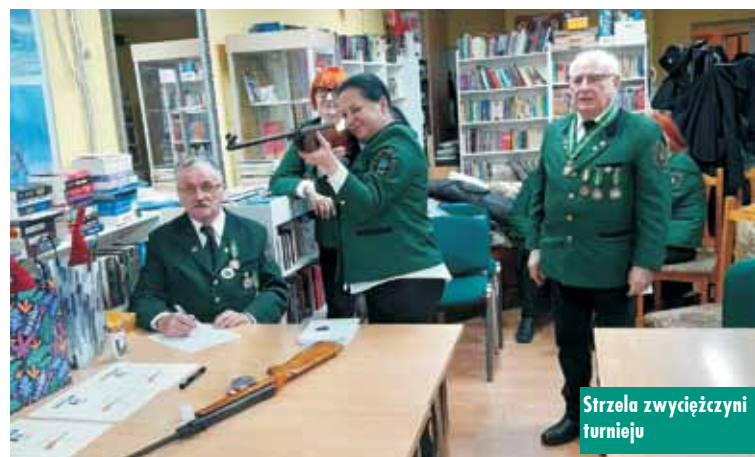
Strzela zwyciężczyni turnieju