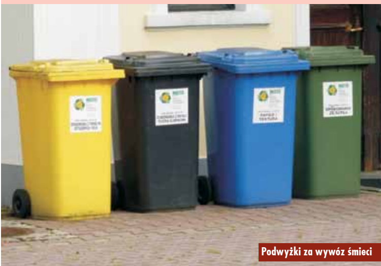
Podwyżki za wywóz śmieci