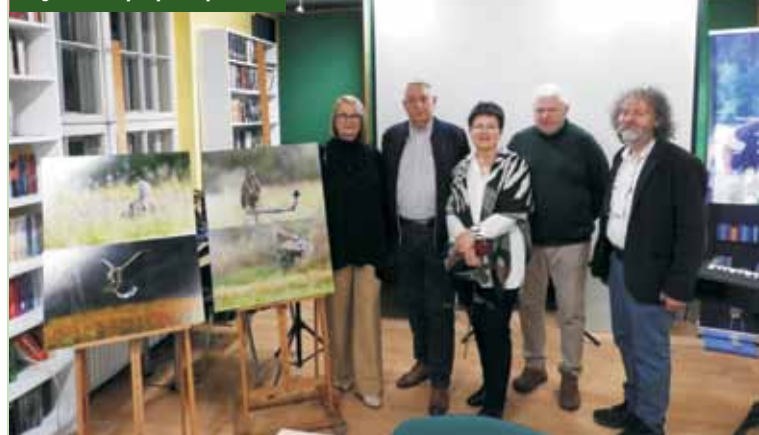
Autor zdjęć i organizatorzy wystawy