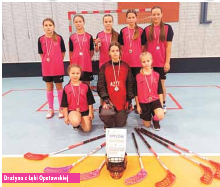
Drużyna z Łęki Opatowskiej

Sukces sportowy uczennic ze Szkoły Podstawowej w Łęce Opatowskiej w Półfinale Wojewódzkim w Unihokeju!