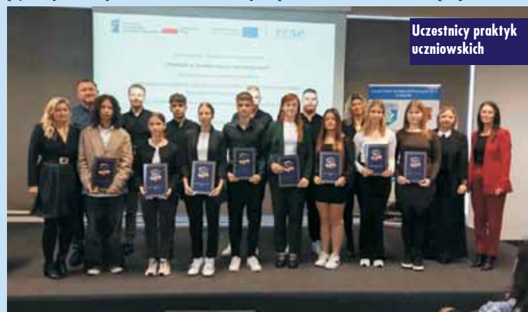
Uczestnicy praktyk uczniowskich