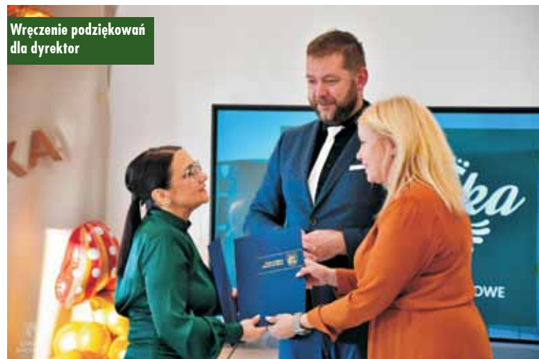
Wręczenie podziękowań dla dyrektora

współpracy oraz integracji lokalnej społeczności. Nadanie imienia „Sosenka” to nie tylko symboliczne wy-