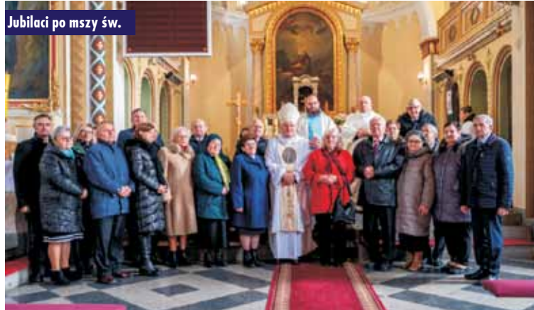
Jubilaci po mszy św.

Spotkanie było pełne wspomnień i wzruszeń oraz refleksji nad spędzonymi wspólnie latami, było podkreśleniem wagi wartości rodzinnych oraz znaczenia trwałości małżeństwa, a jednocześnie było symbolem wszystkiego co w życiu najcenniejsze i jednocześnie najtrudniejsze: