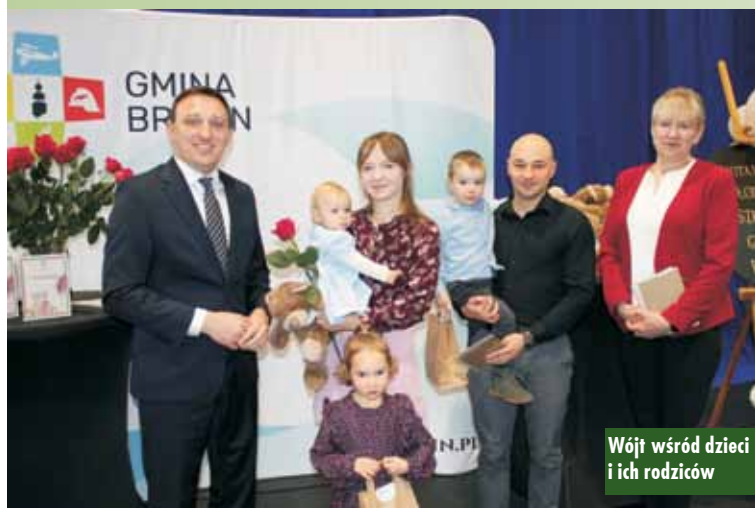
Wójt wśród dzieci i ich rodziców