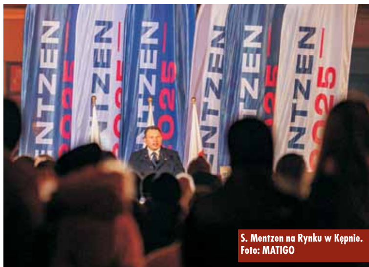
S. Mentzen na Rynku w Kępnie.