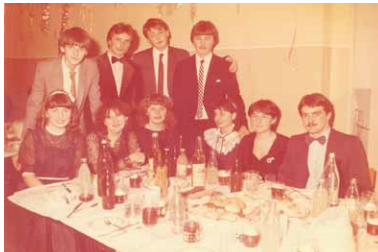
Maturzyści 1983 r.