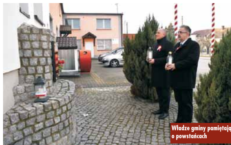
Władze gminy pamiętają o powstańcach

Zakończyła się realizacja zadań w ramach inwestycji „Wysportowani i wolni od uzależnień”