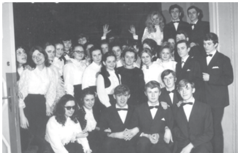
Maturzyści 1971 r.