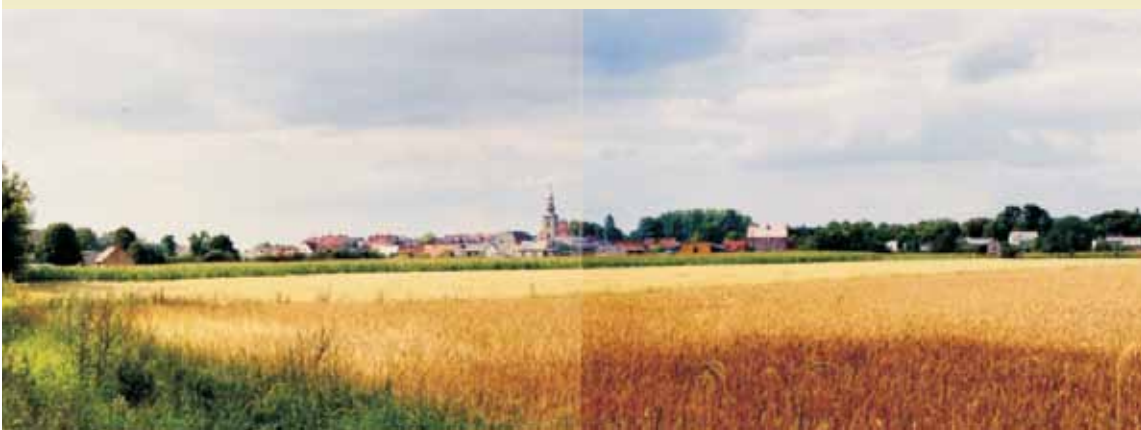
Sylweta miasta od południowo-wschodu.