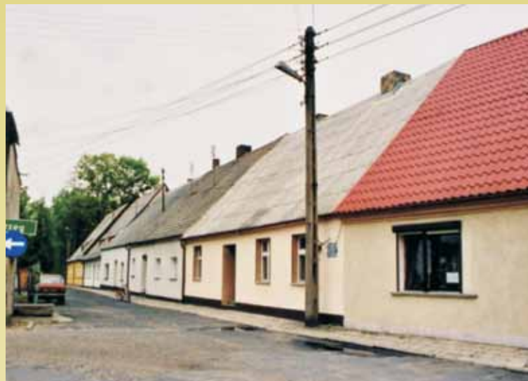
Ulica Kościelna, widok od południa.

Krajobraz kulturowy Rychtala zachował do dziś – mimo licznych przekształceń – cechy małego, polskiego miasteczka. Wymieszały się tu cechy wielkopolskiego założenia urbanistycznego z wpływami śląskimi. W efekcie dało to interesujące rozwiązanie przestrzenne. Stagnacja