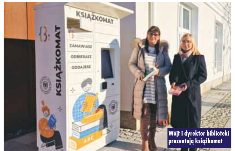
Wójt i dyrektor biblioteki prezentują książkomat

Książkomat, dzięki szybkiej i wygodnej obsłudze, daje możliwość komfortowego skorzystania z oferty bibliotecznego. Zakup urządzenia wraz z oprogramowaniem sfinansowano ze środków gminnych. el