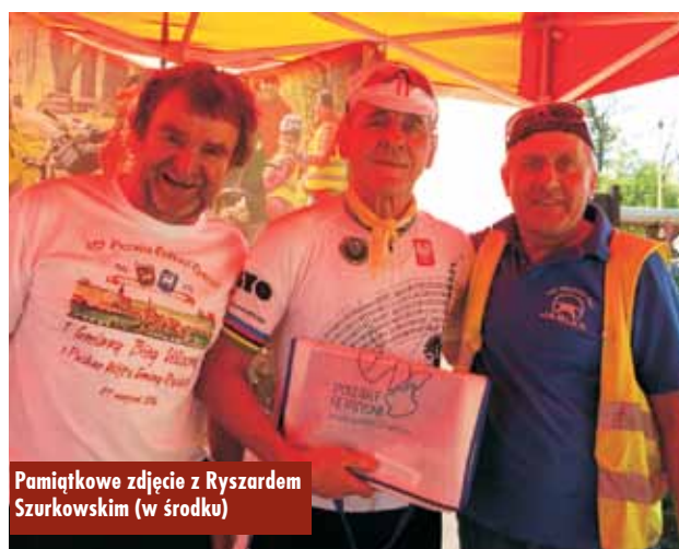
Pamiątkowe zdjęcie z Ryszardem Szurkowskim (w środku)