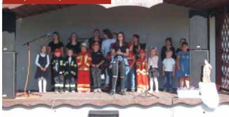
Część artystyczną przygotowali dzieci ze Szkoły Podstawowej w Wielkim Buczku

świętowaniu udział brały jednostki OSP z terenu gminy Rychtal oraz jednostki OSP Piotrkówka i OSP Aniołka Pierwsza.