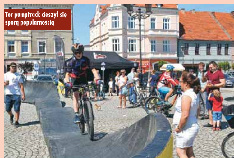
Tor pumptrack cieszył się sporą popularnością