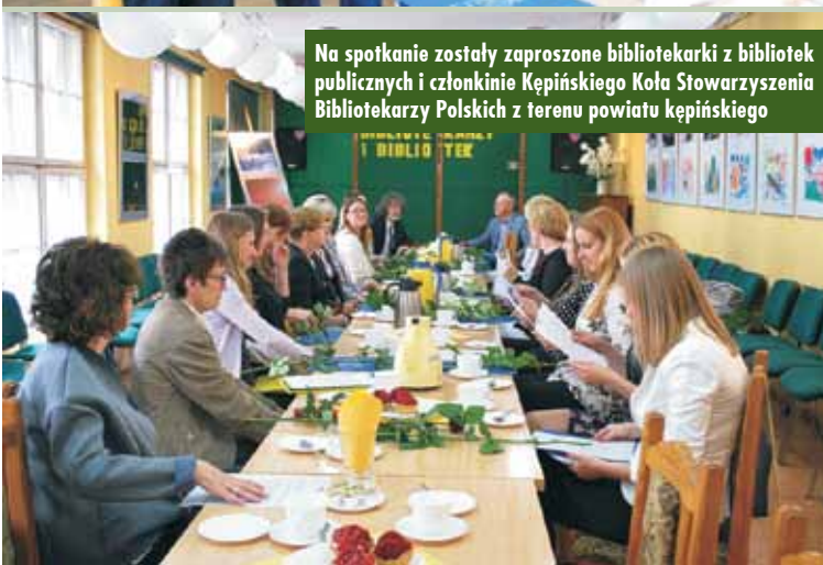
Na spotkanie zostały zaproszone bibliotekarki z bibliotek publicznych i członkinie Kępińskiego Koła Stowarzyszenia Bibliotekarzy Polskich z terenu powiatu kępińskiego

Uroczystość miała miejsce po zakończeniu działań dla dzieci i młodzieży związanych z obchodami XV Tygodnia Bibliotek. Na spotkanie zostały zaproszone bibliotekarki z bibliotek publicznych i członkinie Kępińskiego Koła Stowarzyszenia Bibliotekarzy Polskich z terenu powiatu kępińskiego.