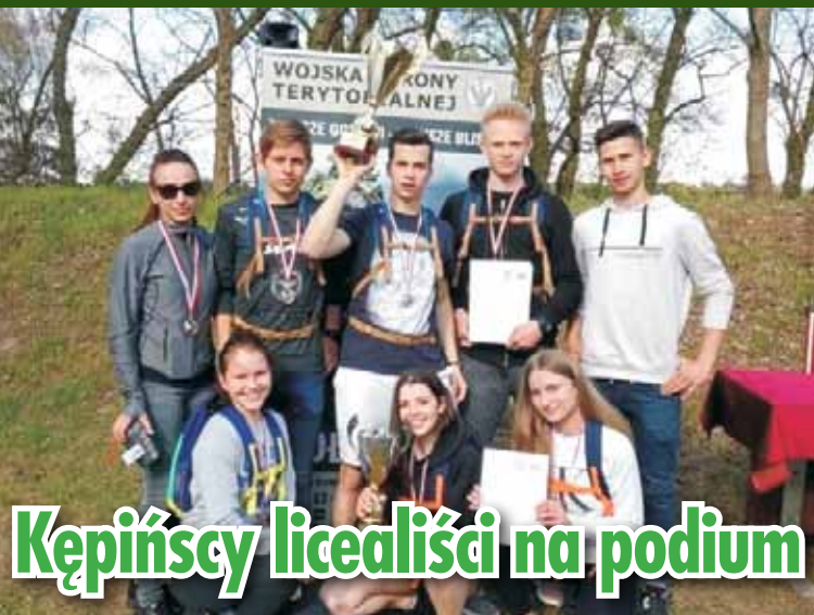
Kępińscy licealiści na podium

Reprezentujące Liceum Ogólnokształcące nr 1 im. mjr H. Sucharskiego w Kępnie drużyny: dziewcząt