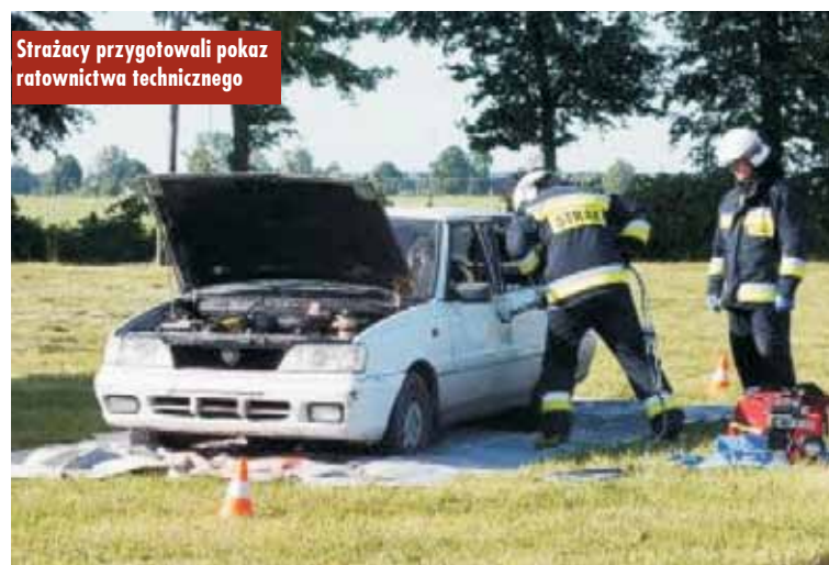
Strażacy przygotowali pokaz ratownictwa technicznego