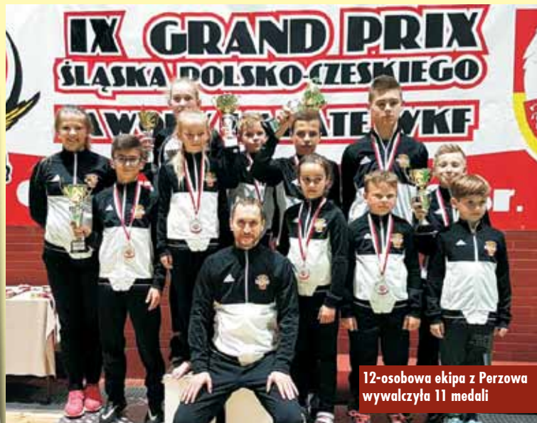
12-osobowa ekipa z Perzowa wywalczyła 11 medali