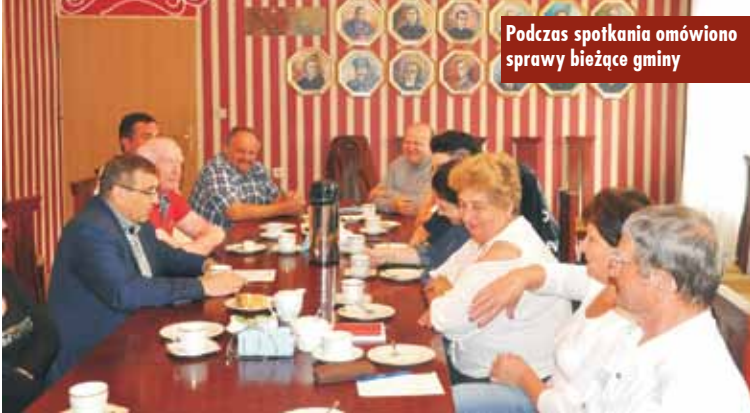
Podczas spotkania omówiono sprawy bieżące gminy

szacowaniu szkód, związane z podpisaną w marcu bieżącego roku ustawą o prawie łowieckim. Po nowelizacji ustawy za szacowanie szkód łowieckich będzie odpowiadał trzysobowy zespół składający się z: przedstawiciela organu wykonawczego sołectwa, właściwego ze względu na