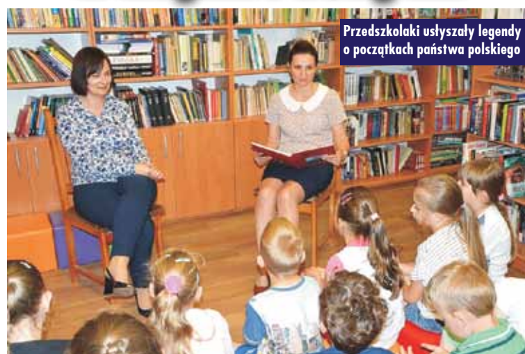
Przedszkolaki usłyszały legendy o początkach państwa polskiego

Obchody rocznicy odzyskania przez nasz kraj niepodległości stały się doskonałym pretekstem do rozmawiania z dziećmi o historii Polski.