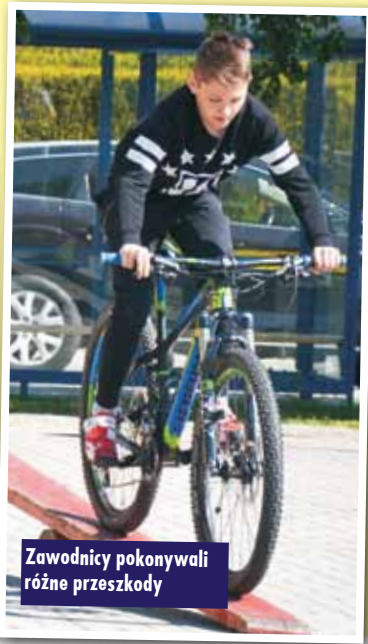
Zawodnicy pokonywali różne przeszkody