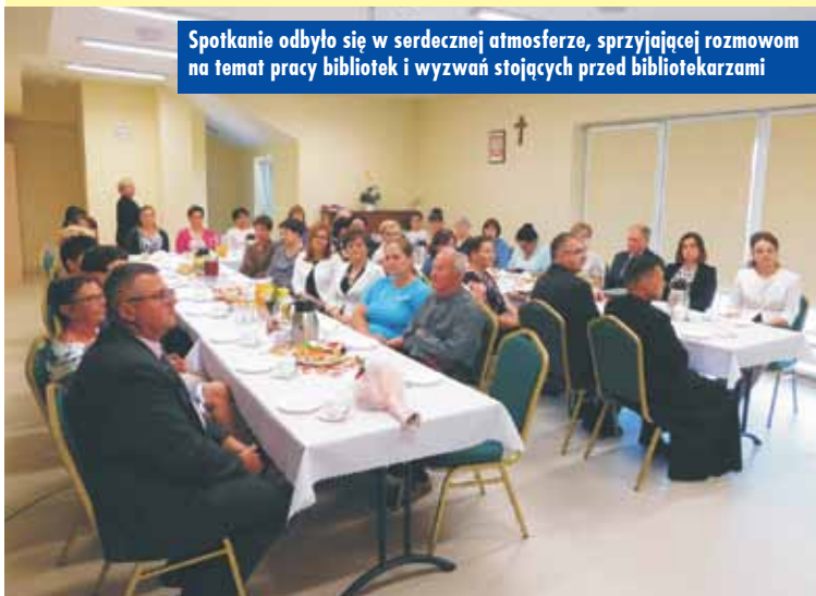
Spotkanie odbyło się w serdecznej atmosferze, sprzyjającej rozmowom na temat pracy bibliotek i wyzwań stojących przed bibliotekarzami