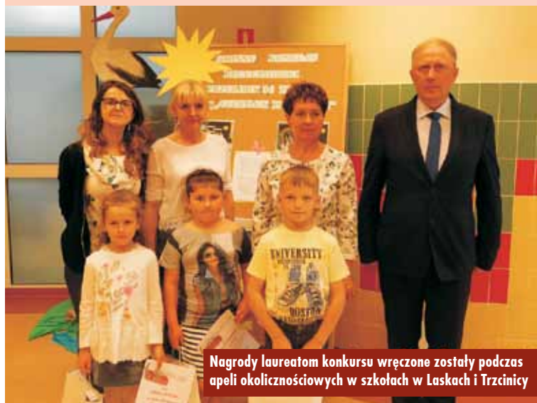
Nagrody laureatom konkursu wręczone zostały podczas apeli okolicznościowych w szkołach w Laskach i Trzcinicy