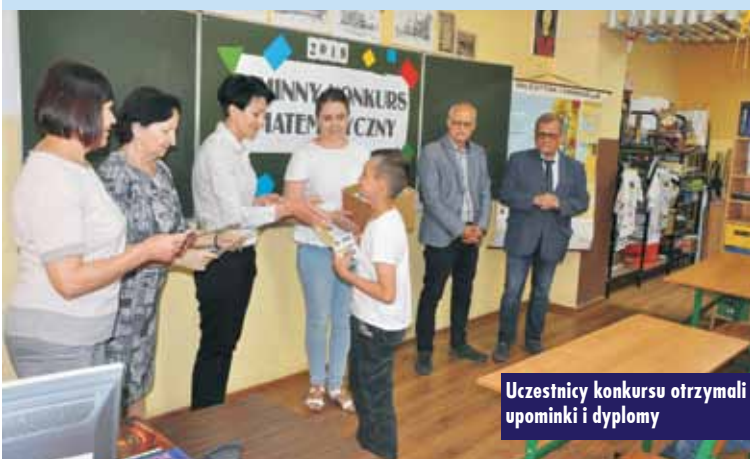
Uczestnicy konkursu otrzymali upominki i dyplomy

Uczniowie klasy Ic Szkoły Podstawowej w Bralinie wraz z wychowawczynią byli gośćmi Biblioteki Publicznej w Bralinie