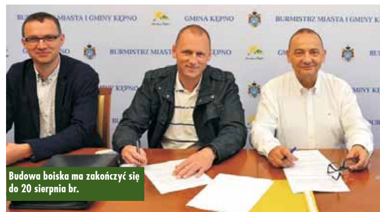
Budowa boiska ma zakończyć się do 20 sierpnia br.

Rodzinny piknik rowerowy „Kępno kocha rower” na Rynku w Kępnie