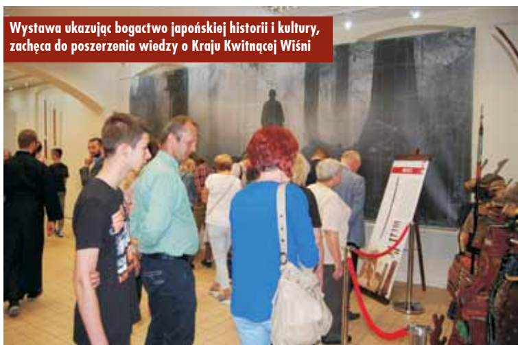
Wystawa ukazując bogactwo japońskiej historii i kultury, zachęca do poszerzenia wiedzy o Kraju Kwitnącej Wiśni