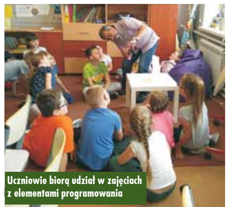
Uczniowie biorą udział w zajęciach z elementami programowania

Podczas zajęć uczniowie nie tylko uczą się, doskonaląc umiejętność współpracy w zespole, ale też świetnie się bawią. Obecnie programowanie stało się bardzo ważnym elementem życia. Związane jest to z