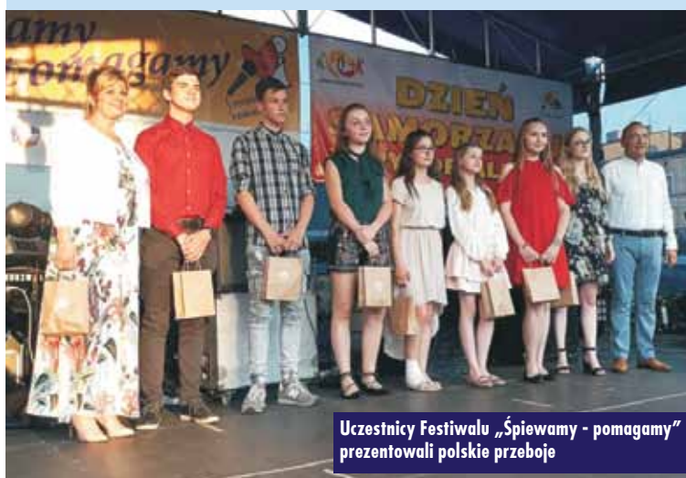
Uczestnicy Festiwalu „Śpiewamy - pomagamy” prezentowali polskie przeboje

lów rockowych przełomu lat 60. i 70. XX w. Grupę latem 1965 r. w Krakowie założyli bracia Andrzej i Jacek Zielińscy, bracia Zygmunt i Janusz Kaczmarscy oraz Feliks Naglicki i Jerzy Tarsiński. „Skaldowie” nagrali ponad 500 utworów muzycznych w kilku językach i sprzedali ponad milion płyt. Znani są z ponadczasowych utworów, takich jak: „Wszystko mi mówi, że mnie ktoś pokochał”,