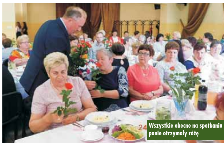
Wszystkie obecne na spotkaniu panie otrzymały symboliczną różę