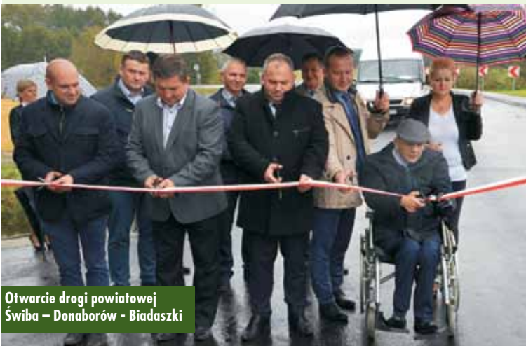
Otwarcie drogi powiatowej Świba – Donaborów – Białaszkę

Tak szeroki zasób inwestycji skutkuje koniecznością racjonalnego konstruowania budżetu i przemysła-