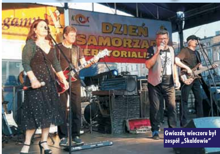
Gwiazdą wieczoru był zespół „Skaldowie”

27 maja obchodzony jest Dzień Samorządu Terytorialnego – święto uchwalone przez Sejm w 2000 r. Jest to święto samorządowców i całej społeczności lokalnej. 27 maja br. na kępińskim Rynku upłynął pod znakiem występów i koncertów zorganizowanych właśnie z okazji tego dnia.