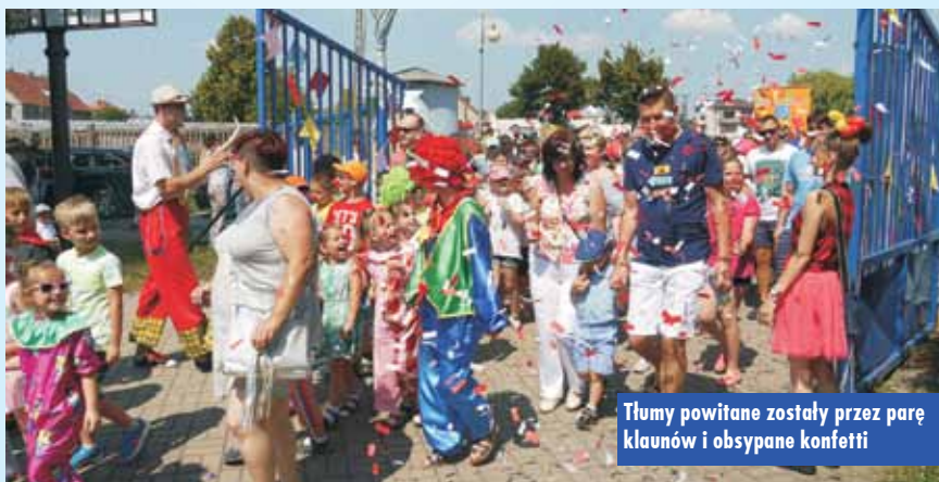
Tłumy powitane zostały przez parę klaunów i obsypane konfetti