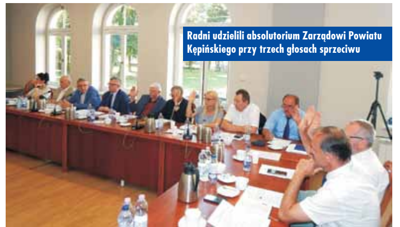
Radni udzielili absolutorium Zarządowi Powiatu Kępińskiego przy trzech głosach sprzeciwu