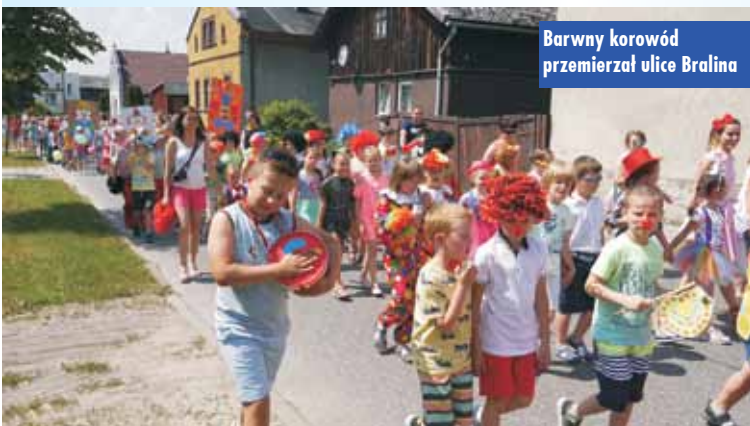
Barwny korowód przemierzał ulice Bralina

Nieopodal płyty boiska na wszystkich czekało wiele atrakcji. Co lepsze: dmuchańce czy strzelanie z łuku i karabinka do paintballa, a może mega-piłkarzyki, łódki w basenie albo eurobangi? Odpowiedzieć niełatwo. Amatorzy podróży mogli odbyć przejażdżkę bryczką, syrenką lub limuzyną. W odwodzie czekała jeszcze warszawa i mercedes W 126 sec. Było też coś dla wesółków – fotobudka.