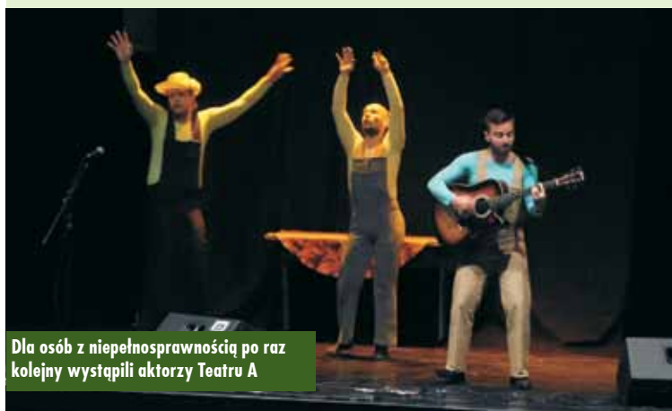
Dla osób z niepełnosprawnością po raz kolejny wystąpili aktorzy Teatru A