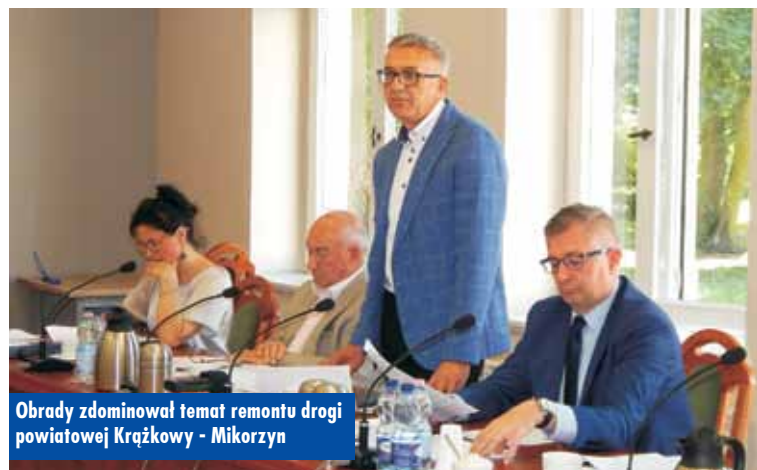
Obrady zdominował temat remontu drogi powiatowej Krążkowy - Mikorzyn

Minister mówiła też o otwarciu pierwszego i o stanie zaawansowania drugiego etapu budowy obwodnicy Kępna, a także o środkach finanso-