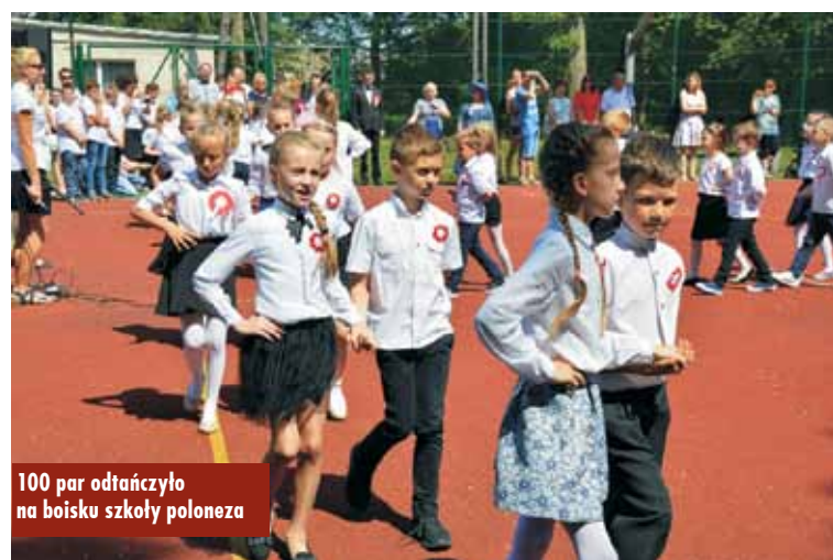
100 par odtanńczyło na boisku szkoły poloneza

100 tanecznych par, a wśród nich dzieci, młodzież, dorośli i seniorzy, świętowało 100-lecie odzyskania niepodległości w rytmie poloneza. W niebo wypuszczono 100 biało-czerwonych balonów, a gołębie poniosły