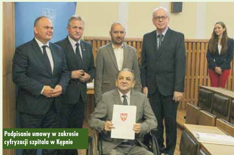
Podpisanie umowy w zakresie cyfryzacji szpitala w Kępnie

Zgodnie z planem we wrześniu br. droga będzie całkowicie zrealizowana. Obecnie staje się obiektem krytyki, że wąska, że źle zaprojektowana, że nie spełni właściwie swo-