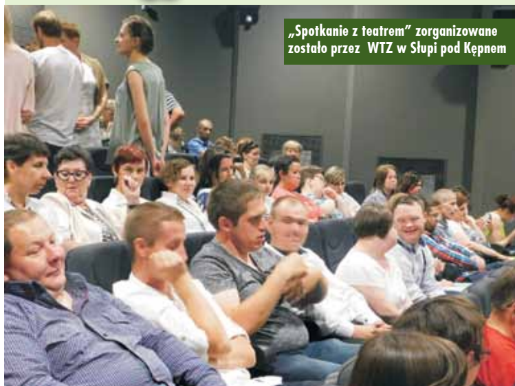
„Spotkanie z teatrem” zorganizowane zostało przez WTZ w Słupi pod Kępem

Kolejny raz dla osób z niepełnosprawnością wystąpili aktorzy Teatru A z Gliwic, prezentując spektakl pt. „Przypowieści raz jeszcze”. Do udziału w imprezie zostały zaproszone osoby ze Środowiskowego Domu Samopomocy w Kępnie, Domu Pomocy Społecznej w Rzetni, Warsztatu Terapii Zajęciowej w Dobroszycach, a także WTZ w Sycowie. Na zaproszenie odpowiedzieli również przedstawiciele Całodziennego Klubu Seniora „Pod Żurawiem” w Kępnie.