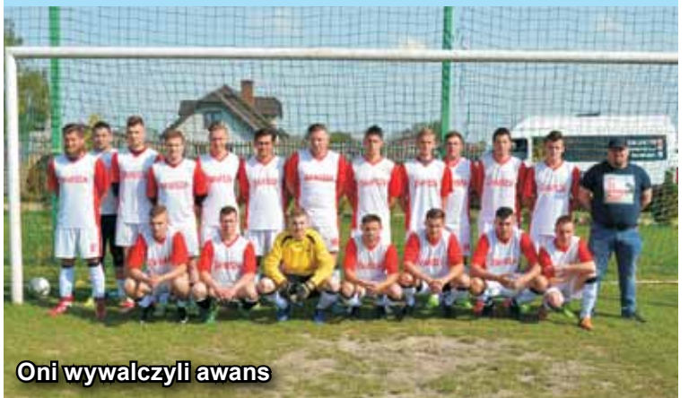
Oni wywalczyli awans