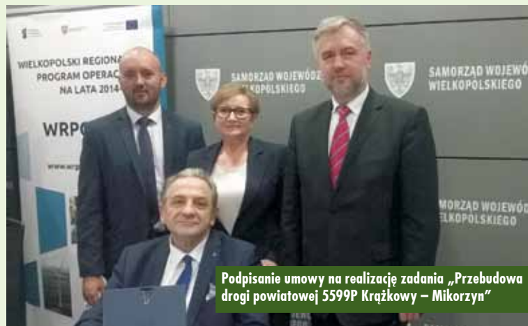
Podpisanie umowy na realizację zadania „Przebudowa drogi powiatowej 5599P Krązkowy – Mikorzyn”

obiektu na dachu szpitala jest o wiele droższa, że negatywnie wpłynie na budynek, że jest zadaniem dalekosiężnym jak na potrzeby szpitala powiatowego. Codzienna praktyka i liczba realizowanych lotów ratunkowych, a tych do tej pory było już 15. Potwierdza, jak bardzo był to ko-