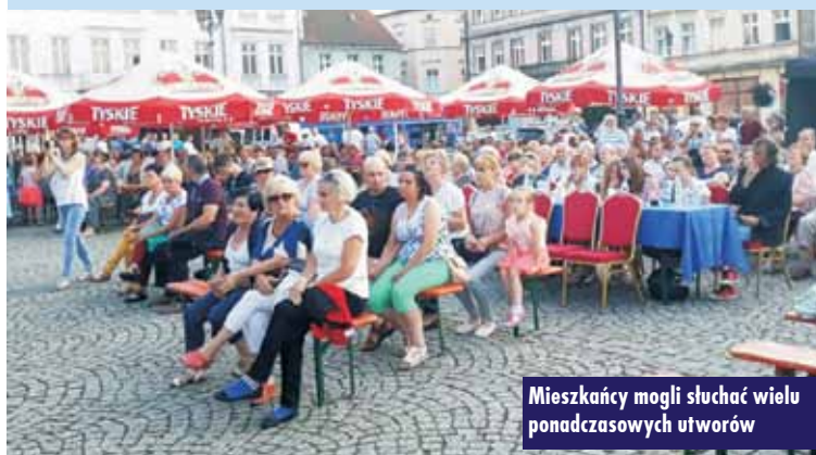
Mieszkańcy mogli słuchać wielu ponadczasowych utworów