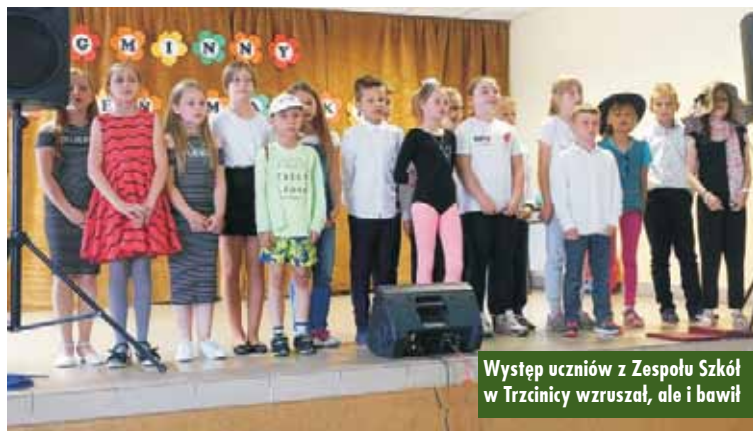
Występ uczniów z Zespołu Szkół w Trzcinicy wzruszał, ale i bawił