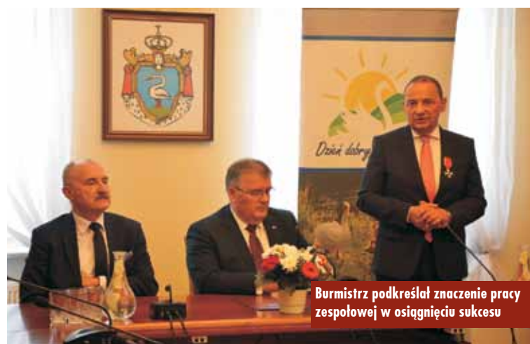
Burmistrz podkreślał znaczenie pracy zespołowej w osiągnięciu sukcesu