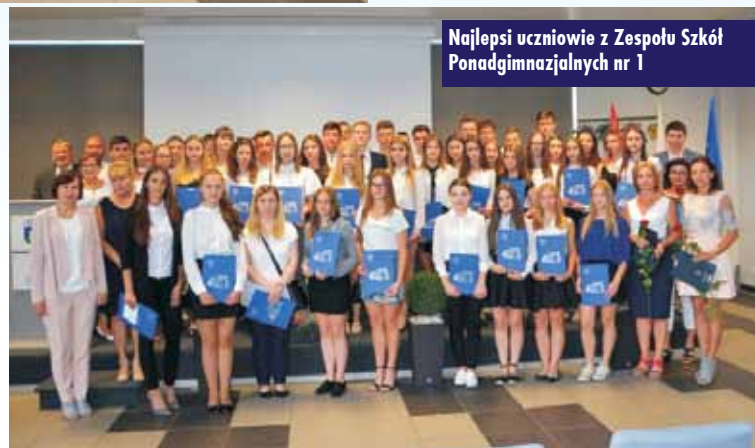
Najlepsi uczniowie z Zespołu Szkół Ponadgimnazjalnych nr 1

Laureaci osiągnęli wysokie wyniki w nauce (średnia ocen minimum 5,0) lub reprezentując szkołę, zajęli co najmniej 3. miejsce w konkursach przedmiotowych oraz zawodach sportowych na szczeblu województwa lub kraju. W tym roku aż 78 uczniów uzyskało średnią co najmniej 5,0.