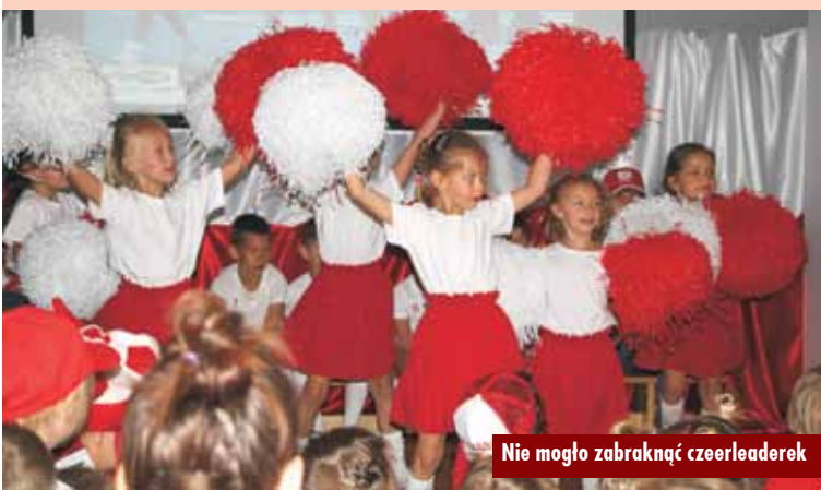
Nie mogło zabraknąć czeerleaderek

W tym dniu wszystkie przedszkolaki dopingowały naszą kadrę narodową. Pojawił się komentator sportowy, który wyzwolił we wszystkich jeszcze większą ekscytację i emocje, zapraszając przedszkolaków na trening oraz wywiad z Robertem Lewandowskim . Nie zabrakło też czeerleaderek, które porwały do tańca wszystkie dzieci. Oprac. bem