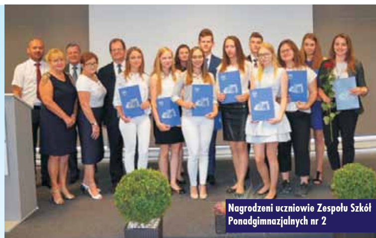
Nagrodzeni uczniowie Zespołu Szkół Ponadgimnazjalnych nr 2

Autorów zapraszamy do redakcji „Tygodnika Kępińskiego” po odbiór nagród!!!