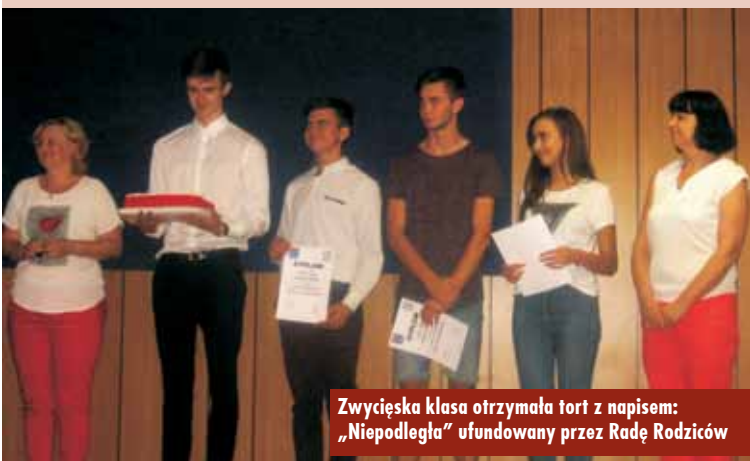
Zwycięska klasa otrzymała tort z napisem: „Niepodległa” ufundowany przez Radę Rodziców