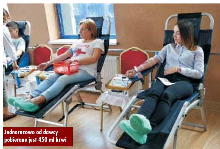
Jednorazowo od dawcy pobierane jest 450 ml krwi

Oddana krew zakwalifikowanej osoby jest później badana, aby stwierdzić, czy nie jest ona zakażona kiłą, HIV czy wirusem żółtaczki zakaźnej B lub C. Jeśli test wypadnie dodatnio, krew nie jest przetoczona, a dawca zostaje poinformowany o wynikach przez lekarza. Dawca musi też wypełnić kwestionariusz, w którym zadawane są pytania pozwalające określić, czy oddana krew będzie bezpieczna dla pacjenta. Pytania są bardzo szcze-