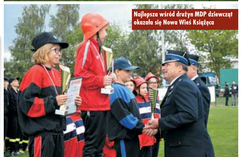
Najlepsza wśród drużyn MDP dziewcząt okazała się Nowa Wieś Książęca