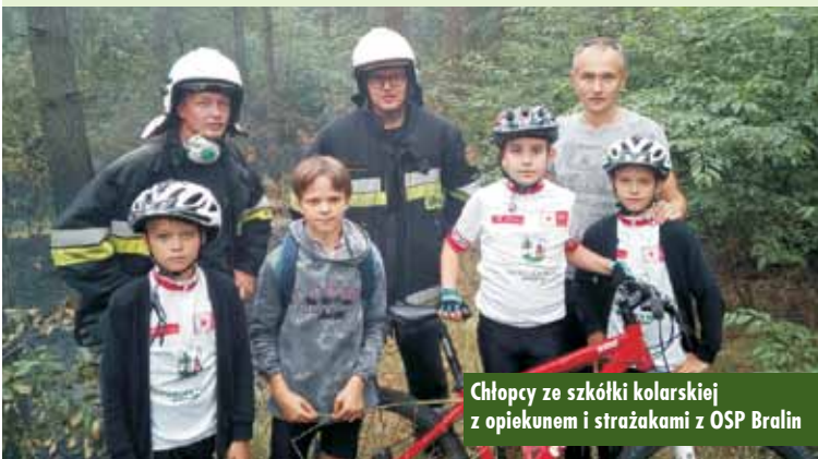
Chłopcy ze szkółki kolarskiej z opiekunem i strażakami z OSP Bralin

sprawą pechowej trzynastki w dacie? Nie. Winę zapewne ponosi człowiek – nie liczba.