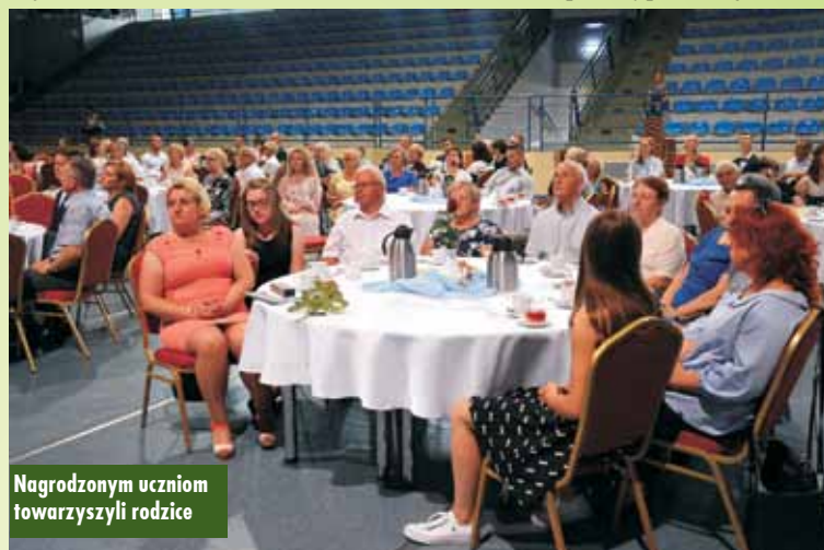
Nagrodzonym uczniom towarzyszyli rodzice