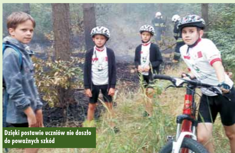
Dzięki postawie uczniów nie doszło do poważnych szkód

Tego popołudnia siał deszcz, zanościło się nawet na burzę. Z tego powodu kilku zawodników, zwłaszcza z tych mieszkających poza gminą Bralin, nie stawiało się o omówionym czasie pod świetlicą „Tęcza”. Niedużą grupą wyruszyliśmy ul. Strażacką, Kaczą i Kościuszki za tory kolejowe, by później polnymi drogami dojechać do lasu. Tam, po przejechaniu zaledwie kilkuset metrów, poczuliśmy swąd, a po chwili zauważyliśmy tłocząc się poszycie, w jednym miejscu pojawił się nawet ogień.