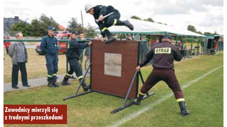
Zawodnicy mierzyli się z trudnymi przeszkodami