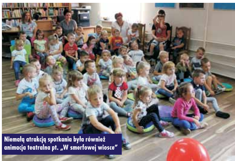
Niemalą atrakcją spotkania była również animacja teatralna pt. „W smerfowej wiosce”

Festiwal Tańca Opole 2018 w Tańcu Towarzyskim