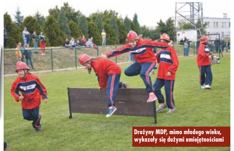
Drużyny MDP, mimo młodego wieku, wykazały się dużymi umiejętnościami

wystawiały zarówno Młodzieżowe Drużyny Pożarnicze dziewcząt i chłopców, jak też seniorów i seniorki. W grupie Młodzieżowych Drużyn Pożarniczych dziewcząt rywalizowały trzy jednostki: Bralin, Chojęcin i Nowa Wieś Książęca. Z kolei w grupie MDP chłopców rywalizowało siedem jednostek: Bralin, Chojęcin, Weronikopol, Czermin, Mnichowice, Nowa Wieś Książęca i Tabor Wielki. Do zawodów przystąpiły też cztery drużyny senierek – wbrew poważnie brzmiącej nazwie, do tej grupy kwalifikują się dziewczęta i panie od