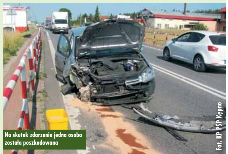
Na skutek zdarzenia jedna osoba została poszkodowana

nostki Ratowniczo-Gaśniczej w Kępnie, Zespół Ratownictwa Medycznego i funkcjonariusze Komendy Powiatowej Policji w Kępnie. Oprac. KR