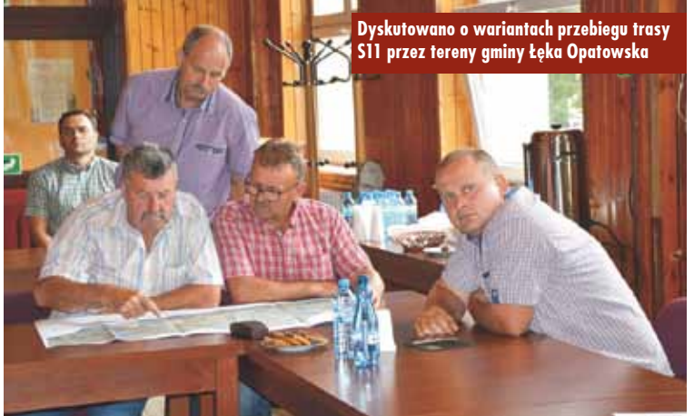
Dyskutowano o wariantach przebiegu trasy S11 przez tereny gminy Łęka Opatowska

GDDKiA Oddział w Opolu utworzyła stronę internetową, na której będą zamieszczane bieżące informacje na temat tej inwestycji: trakt.eu/s11-kepno-a1