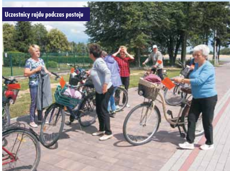
Uczestnicy rajdu podczas postoju