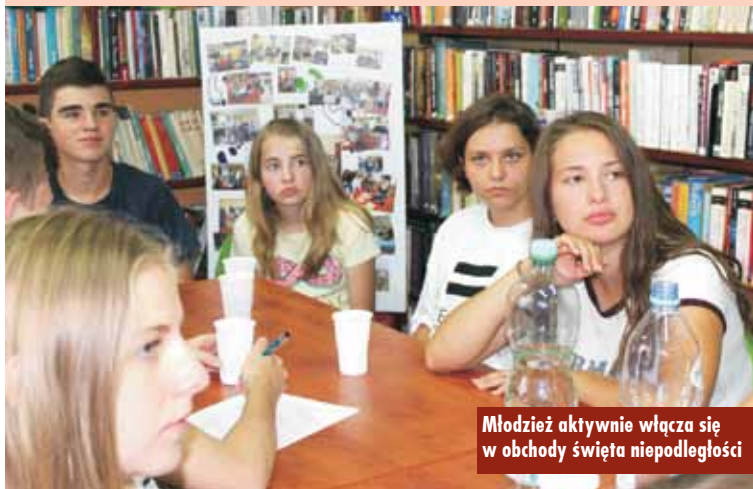
Młodzież aktywnie włącza się w obchody święta niepodległości

Celem projektu będzie przedstawienie działań lokalnej społeczności o tematyce sportowej – pokazanie ojczyzny wokół nas, pasji młodych ludzi, ich zaangażowania oraz tego, co dla nich ważne – dumy z historycznych osiągnięć polskiego społeczeństwa. Dlatego młodzież zaprezentuje sylwetki sportowców – ludzi, którzy budowali nasze otoczenie lub będą je budować. Etapem końcowym projektu będzie stworzenie „Latającej Galerii SZATNI”, która wspólnie z młodzieżą odwiedzi różne zakątki gminy Bralin. Bohaterami galerii będą wybrani przez młodzież zasłużeni sportowcy oraz lokalni działacze, którzy mieli wpływ na polską drogę do wolności. M. Gudra