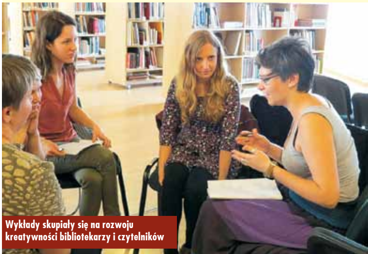
Wykłady skupiały się na rozwoju kreatywności bibliotekarzy i czytelników

Wszystkie wykłady skupiały się na rozwoju kreatywności, ale nie tylko wśród bibliotekarzy, lecz przede wszystkim samych czytelników. Podczas jednego z warsztatów uczestnicy konferencji wyszli na ulice Rygi, by przeprowadzić ankietę z mieszkańcami i zapytać, w jaki sposób ci chcieliby rozwijać swoje pasje w bibliotece. Podczas konferencji duży