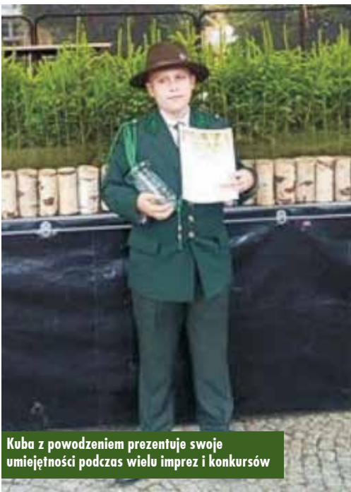
Kuba z powodzeniem prezentuje swoje umiejętności podczas wielu imprez i konkursów

Festyn zorganizowany przez sołtysa, Koło Gospodyń Wiejskich i OSP w Piotrówie