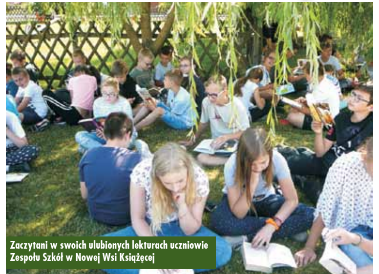
Zaczynają w swoich ulubionych lekturach uczniowie Zespołu Szkół w Nowej Wsi Książęcej

Cała społeczność Zespołu Szkół im. Ks. Michała Przywary i Rodziny Salomonów w Nowej Wsi Książęcej po raz kolejny włączyła się w ogólnopolską akcję masowego czytania pn. „Jak nie czytam, jak czytam”, której patronuje miesięcznik „Biblioteka w szkole”. W tym dniu uczniowie