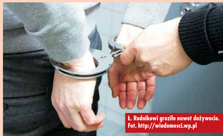
Ł. Rudnikowi groziło nawet dożywocie.

27-latek spędził w areszcie kilka tygodni. 28 czerwca br. wyszedł na wolność. - Zwolniony zostałem ze względu na brak dowodów do akt