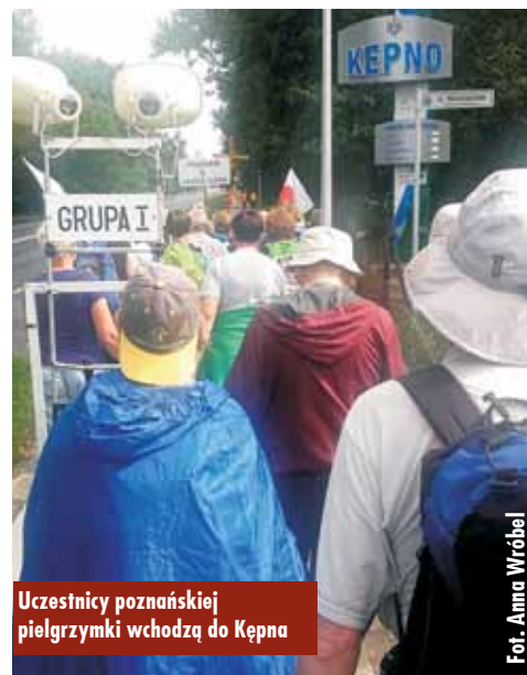
Uczestnicy poznańskiej pielgrzymki wchodzą do Kępna