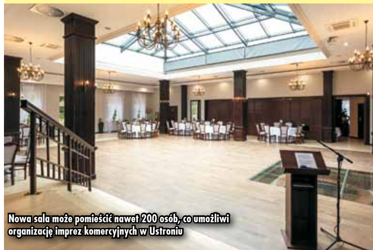
Nowa sala może pomieścić nawet 200 osób, co umożliwi organizację imprez komercyjnych w Ustroniu

W latach 1952-2009 w Dworze Myśliwskim funkcjonował Dom Pracy Twórczej - miejsce stworzone przez Ministerstwo Szkolnictwa Wyższego, które miało służyć jako wczasowisko dla ludzi nauki z całego kraju. Z powodów finansowych, Ministerstwo zlikwidowało Dom Pracy Twórczej i zwróciło obiekt Uniwer-