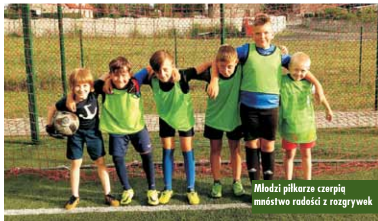
Młodzi piłkarze czerpią mnóstwo radości z rozgrywek

wania więzi społecznych. Jest grą zespołową, w związku z czym pozwala nam na utożsamianie się z grupą sympatyków tej samej dziedziny. Gra uczy dyscypliny, szacunku do przeciwnika oraz odpowiedzialności nie tylko za siebie, ale także za kolegów z drużyny. Tutaj po raz pierwszy