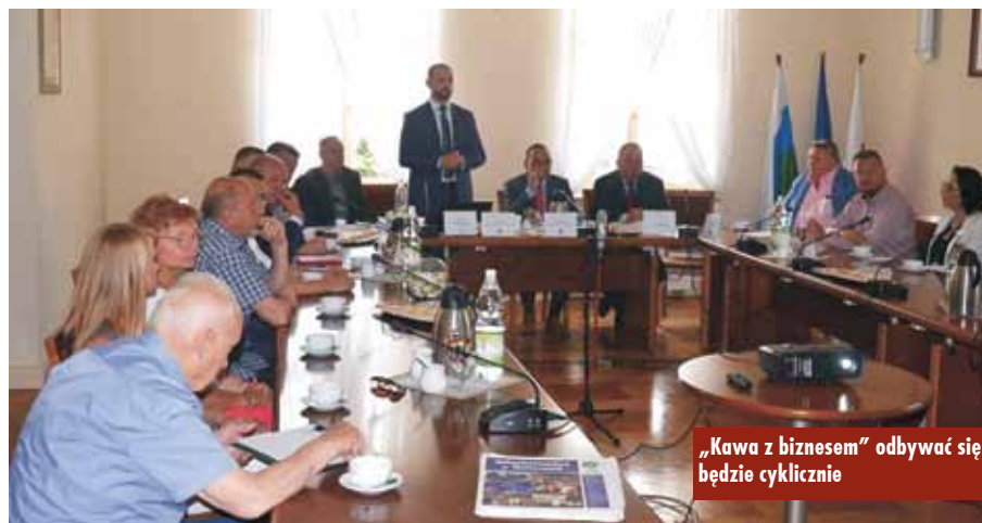
„Kawa z biznesem” odbywać się będzie cyklicznie

Dwudniowe warsztaty integracyjne, podczas których młodzi ludzie, uczestnicy projektu Strefa Młodych poznali siebie, swoje możliwości, potrzeby i oczekiwania odbyły się 2 i 3 lipca 2018 r. w Powiatowej Bibliotece Publicznej w Kępnie