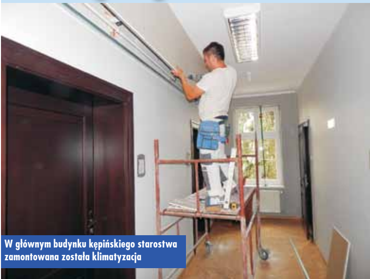
W głównym budynku kępińskiego starostwa zamontowana została klimatyzacja

Prace przebiegły zgodnie z założonym terminarzem określonym w umowie z wykonawcą zadania, tj. do 6 lipca br. Obecnie wykonywane są prace malarskie w obrębie korytarzy i głównej klatki schodowej budynku. Wartość całości prac zgodnie z ofertą wyłonioną w drodze przetargu nieograniczonego wyniosła 368.385,00 złotych. Ich wykonawcą jest firma