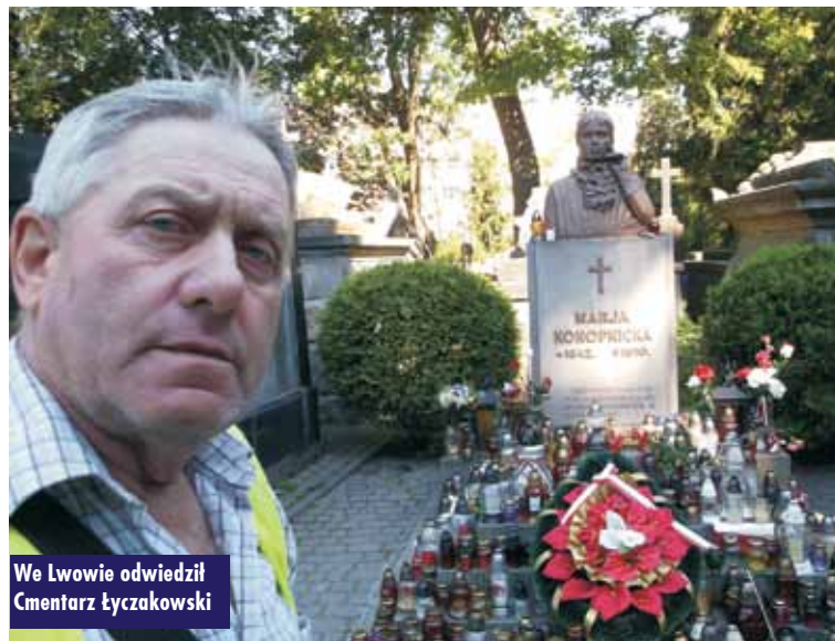
We Lwowie odwiedził Cmentarz Łyczakowski

W Truskawcu spróbował m.in. słynnej wody mineralnej „Naftusia”.