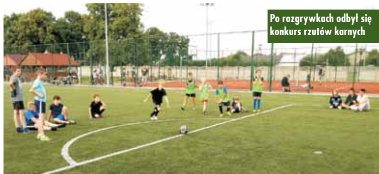
Po rozgrywkach odbył się konkurs rzutów karnych