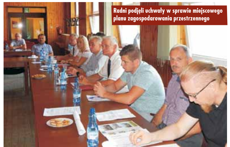
Radni podjęli uchwały w sprawie miejscowego planu zagospodarowania przestrzennego

Przegłosowano też uchwałę w sprawie określenia zasad związanych z zapewnieniem bezpłatnego transportu i opieki w czasie przejazdu do szkoły i przedszkola uczniom zamieszkałym na terenie gminy Łęka Opatowska. Na jej podstawie w ramach dowozów organizowanych przez gminę będzie można dowozić dzieci młodzież, które nie spełniają kryterium odległości ustalonego w ustawie, do szkół i przedszkoli na terenie gminy Łęka Opatowska. Podejmując tę uchwałę, wzięto pod uwagę względy bezpieczeństwa, jak również troskę o zapewnienie bezpiecznej drogi dziecka do szkoły i z powrotem. - Sprawa dotyczy transportu dzieci w zapisie nieuprawnionych, czyli tych, które nie mieszczą się w kwestiach kilometrowych, wyszczególnionych w projekcie uchwały i dlatego, żeby te wszystkie niejasności wyprostować, taki projekt uchwały, mówiący o tym, że Gmina tak jak dotychczas (...) będzie to pokrywać, a te dzieci będą miały dodatkowe bilety, które