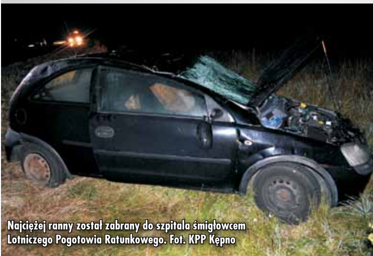
Najciężej ranny został zabrany do szpitala śmigłowcem Lotniczego Pogotowia Ratunkowego.

Kierujący byli trzeźwi. Policjanci ustalają okoliczności wypadku. KR