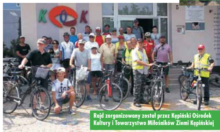
Rajd zorganizowany został przez Kępiński Ośrodek Kultury i Towarzystwo Miłośników Ziemi Kępińskiej