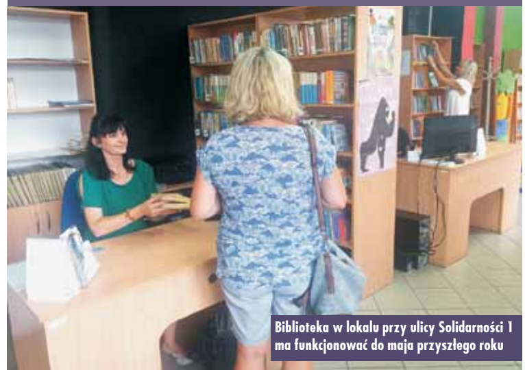
Biblioteka w lokalu przy ulicy Solidarności 1 ma funkcjonować do maja przyszłego roku

Przeprowadzka do nowego lokalu związana jest z remontem budynku przy ul. Kościuszki 7, który potrwać ma do maja przyszłego roku.