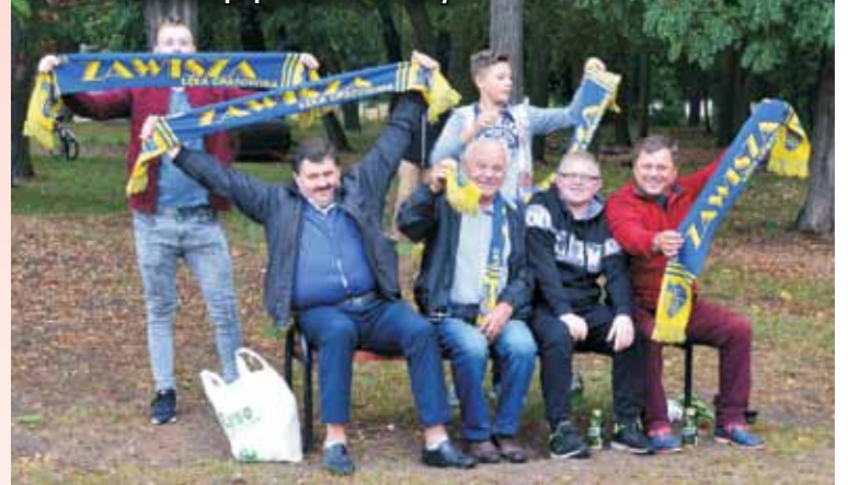
Kibice z Łęki Opatowskiej świętowali w niedzielę premierowe zwycięstwo swoich ulubieńców po powrocie do A-klasy