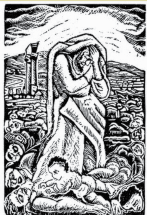
Grafika z wieruszowskiej „Księgi Pamięci” („Wieruszów. Sefer yizkor”), wydanej w Tel Avivie w 1970 roku po hebrajsku i w jidysz

Likwidacja gett w całym powiecie wieluńskim rozpoczyna się na polecenie Artura Greisera , namiestnika Kraju Warty, nazywanego katem Wielkopolski. Stosownie do zarządzenia Himmlera, wydaje on w sierpniu 1942 roku specjalny rozkaz „oczyszczenia” Kraju Warty z Żydów.