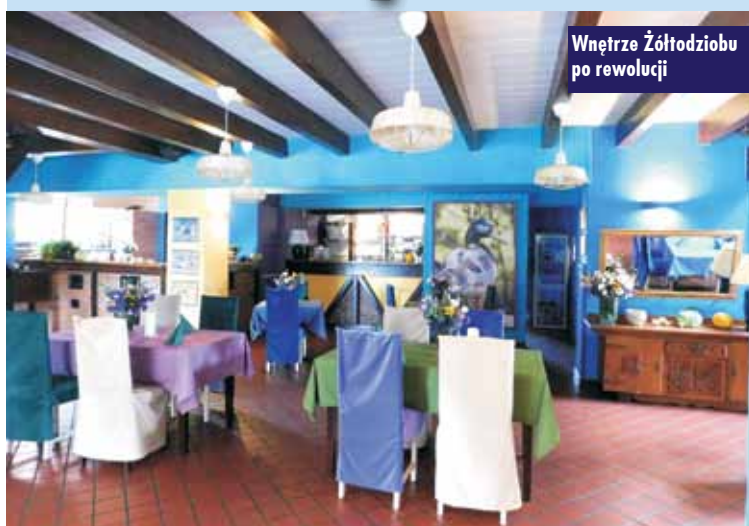
Wnętrze Żółtodzioby po rewolucji

W minionym tygodniu jedną z restauracji w gminie Perzów wizytowała znana restauratorka Magdalena Gessler . Kuchenne rewolucje przeprowadzone zostały w przydrożnej restauracji w Słupi pod Bralinem. M. Gessler zaprosili właściciele Hacjendy. Czterodniowa rewolucja zakończyła się bardzo efektownymi zmianami, ale na ich ostateczną akceptację właściciele będą musieli poczekać przypuszczalnie jeszcze miesiąc, kiedy to zgodnie z warunkami programu autorka „Kuchennych