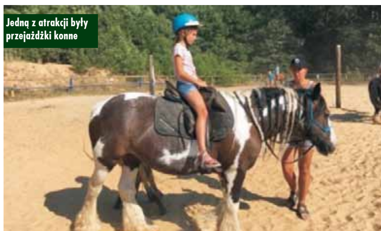
Jedną z atrakcji były przejażdżki konne

wzięły udział w zajęciach przyrodniczo-edukacyjnych, dzięki którym miały możliwość zobaczyć z bliska, jak wygląda środowisko życia koni. Na wychowanków Świetlicy czekał szereg atrakcji, m.in. poszukiwanie skarbu, turniej łuczniczy, przejażdżka konna, zabawy terenowe, duże bańki oraz zabawy na placu zabaw. Kulminacyjnym punktem wycieczki było ognisko.