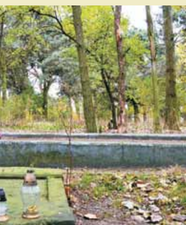
Na wieruszowskim kirkucie, mniej więcej w miejscu dwóch dołów, w których zakopano ok. 100 Żydów zamordowanych w mykwie w czasie likwidacji getta, znajduje się symboliczna mogiła (14 m x 2,5 m) oraz tablica poświęcona ich pamięci, ufundowana w 1985 roku przez Abrahama Majerowicza, jednego z nielicznych wieruszowskich Żydów, którym udało się przeżyć wojnę

76 lat temu w jedną noc poniosło śmierć około 100 mieszkańców Wieruszowa wyznania mojżeszowego, a około 900, z kilkudniowym przystankiem w Wieluniu, zostało wywiezionych do Kulmhof – Chelмна nad Nerem, gdzie zostało zagazowanych spalinami w specjalnie do tego celu przeznaczonych samochodach.