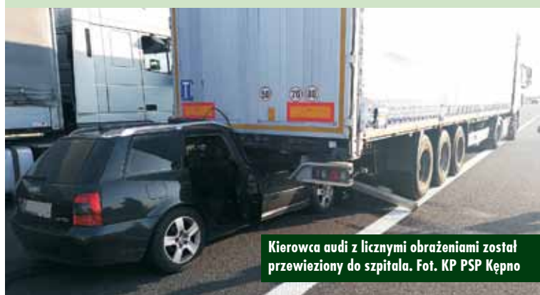
Kierowca audi z licznymi obrażeniami został przewieziony do szpitala.

czasie jechała drogą S8 i od razu udzieliła mu pomocy medycznej. Po dojeździe na miejsce Zespołu Ratownictwa Medycznego z Kępna poszkodowany został im przekazany i z licznymi obrażeniami przewieziony do kępińskiego szpitala. Kierowca samochodu ciężarowego nie odniósł obrażeń – relacjonuje rzecz-