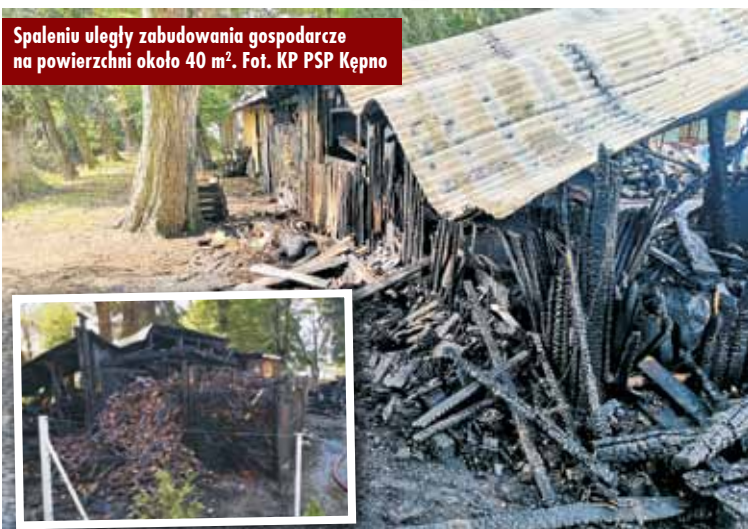
Spaleniu uległy zabudowania gospodarcze na powierzchni około 40 m².

24 sierpnia br., o godzinie 12.38, dyżurny Stanowiska Kierowania Komendanta Powiatowego Państwowej Straży Pożarnej w Kępnie otrzymał zgłoszenie o pożarze zabudowań gospodarczych w Perzowie. Na miejsce skierowano łącznie 6 zastępów straży pożarnej: 3 z Jednostki Ratowniczo-Gaśniczej w Kępnie oraz po jednym z OSP Perzów, OSP Trębaczów i OSP Turkowy.