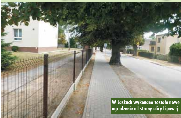
W Laskach wykonane zostało nowe ogrodzenie od strony ulicy Lipowej

Jak każdego roku, również podczas tegorocznej przerwy wakacyjnej przeprowadzono prace modernizacyjne w zespołach szkół gminy Trzcinica