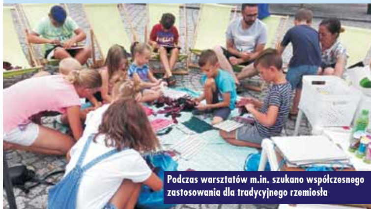
Podczas warsztatów m.in. szukano współczesnego zastosowania dla tradycyjnego rzemiosła

W niedzielę miała miejsce kolejna odsłona teatru kamishibai. Dzieci, po wysłuchaniu aborygeńskiej „Bajki o gąsienicy, która zmieniała się w mo-