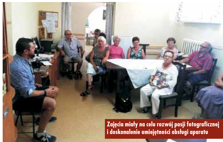
Zajęcia miały na celu rozwój pasji fotograficznej i doskonalenie umiejętności obsługi aparatu