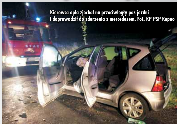
Kierowca opla zjechał na przeciwny pas jezdni i doprowadził do zderzenia z mercedesem.

Jak wstępnie ustalili funkcjonariusze Wydziału Ruchu Drogowego Komendy Powiatowej Policji w Kępnie, 18-letni mieszkaniec gminy Rychtal, kierujący oplem corsą, na łuku drogi stracił panowanie nad pojazdem, zjechał na przeciwny pas jezdni i doprowadził do czołowego zderzenia z prawidłowo jadącym samochodem marki Mercedes, którym kierowała 71-letnia mieszkanka miejscowości Brzezinka, po czym doszło do dachowania opla. Poszkodowanych zostało 7 osób – zostali oni niezwłocznie przewiezieni do szpitali. - Przybyli na miejsce strażacy zastali dwa samochody osobowe: jeden znajdował się na jezdni, drugi, po dachowaniu – w rowie. Poszkodowani opuścili pojazdy o własnych siłach przed przybyciem straży pożarnej.