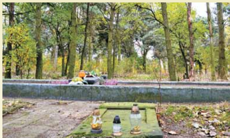
Na wieruszowskim kirkucie, mniej więcej w miejscu dwóch dołów, w których zakopano ok. 100 Żydów zamordowanych w mykwie w czasie likwidacji getta, znajduje się symboliczna mogiła (14 m x 2,5 m) oraz tablica poświęcona ich pamięci, ufundowana w 1985 roku przez Abrahama Majerowicza, jednego z nielicznych wieruszowskich Żydów, którym udało się przeżyć wojnę

Tam w dwóch głębokich dołach, wykopanych przez około 10-osobową grupę młodych Żydów – prawdopodobnie z Judenpolizei, składano zwłoki i posypywano je wapnem. Ci, którzy tę mogiłę wykopali i pracowali przy pochówku pomordowanych,