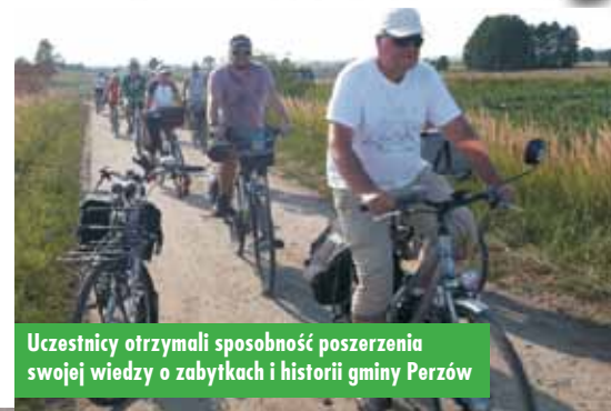
Uczestnicy otrzymali sposobność poszerzenia swojej wiedzy o zabytkach i historii gminy Perzów