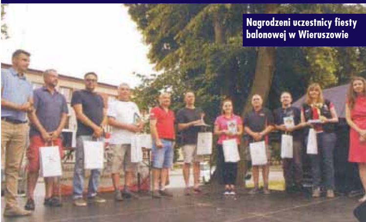
Nagrodzeni uczestnicy fiesty balonowej w Wieruszowie