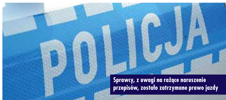
Sprawcy, z uwagi na rażące naruszenie przepisów, zostało zatrzymane prawo jazdy

Kierującemu może grozić kara pozbawienia wolności do lat 3