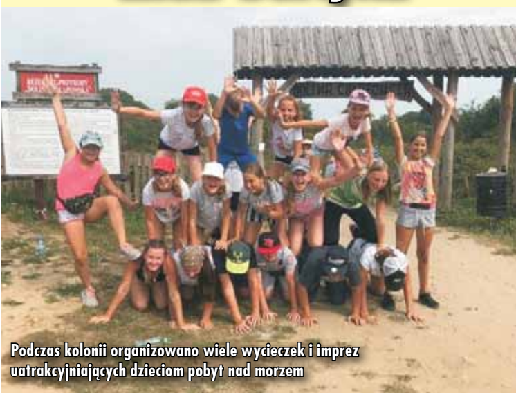
Podczas kolonii organizowano wiele wycieczek i imprez uatrakcyjniających dzieciom pobyt nad morzem

W trakcie wypoczynku dzieci uczestniczyły w grach i zabawach z instruktorem sportowym oraz profilaktykiem. Wychowawcy organizowali wiele gier zespołowych i integracyjnych, a w trakcie spacerów wypoczywający poznawali Władysławowo oraz Chłapowo. Oczywiście nie obyło się bez kąpiei wodnych i słonecznych na nadmorskich plażach.