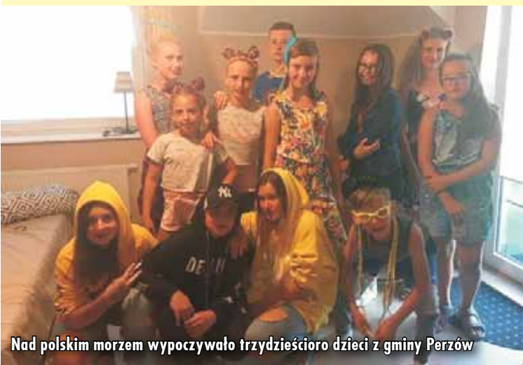
Nad polskim morzem wypoczywało trzydzieścioro dzieci z gminy Perzów