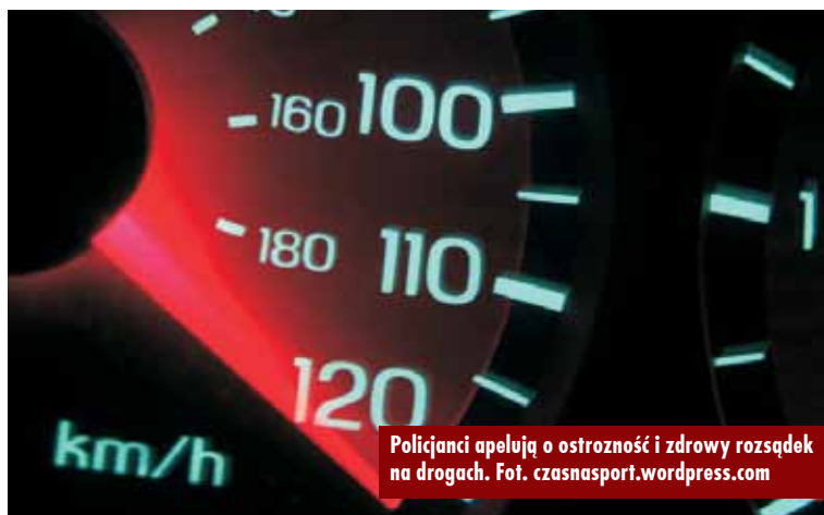
Policjanci apelują o ostrożność i zdrowy rozsądek na drogach.

Ważnym elementem są również prowadzone przez policję działania profilaktyczno-edukacyjne, które mają na celu kształtowanie świadomości oraz zachęcenie odbiorców do przestrzegania przepisów ruchu drogowego, szczególnie w zakresie obowiązujących limitów prędkości jazdy oraz dostosowania tej prędkości do warunków ruchu czy warun-