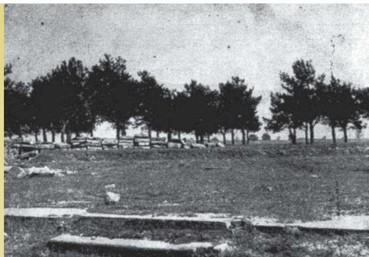
Zdjęcie zdewastowanego przez Niemców wieruszowskiego kirkutu – cmentarza żydowskiego, wykonane w 1946 roku i zamieszczone w wieruszowskiej „Księdze Pamięci”

Akcja usuwania śladów zbrodni odbywa się w trakcie trwania godziny