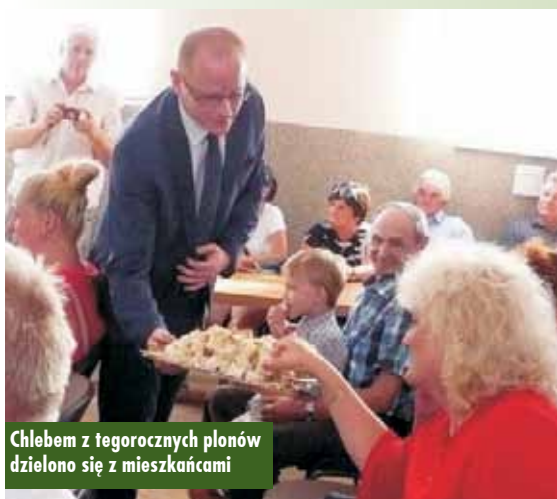
Chlebem z tegorocznych plonów dzielono się z mieszkańcami

19 sierpnia br. w sali OSP w Kierznie odbyły się dożynki parafialno-wiejskie. Przez wieś przejechał barwny korowód, a na mieszkańców czekało wiele atrakcji.