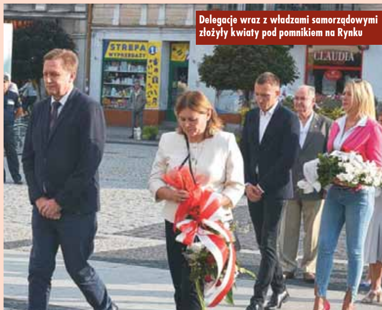
Delegacje wraz z władzami samorządowymi złożyły kwiaty pod pomnikiem na Rynku