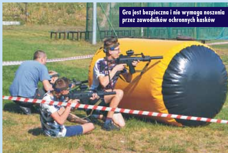
Gra jest bezpieczna i nie wymaga noszenia przez zawodników ochronnych kasków

Laser Tag jest zespołowym lub indywidualnym sportem, w którym gracze zdobywają punkty poprzez „znakowanie celów” przy użyciu ręcznego emitera podczerwieni. Podczas gry każdy z graczy wyposażony