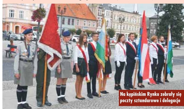
Na kępińskim Rynku zebrały się poczty sztandarowe i delegacje

mi zabierając ich całe młode życia i nie dając nic w zamian. Wielu Polaków, w tym wielu młodych, złożyło na ołtarzu ojczyzny to, co mieli najcenniejszego. Wielu bohaterów pozostało bezimiennych, inni zostaną na zawsze w naszej pamięci – mówił. - Traumatyczne doświadczenia wojny na zawsze pozostaną w pamięci wielu pokoleń Polaków i innych narodów świata. W Kępnie o 1 września 1939 r. pamiętamy szczególnie. Nasze szkoły mają patronów z okresu II wojny światowej. (...) Niestety, świat nie