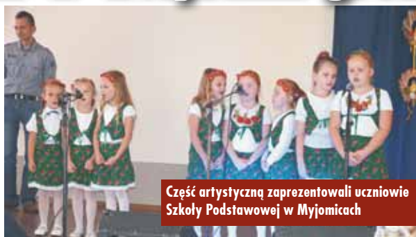
Część artystyczną zaprezentowali uczniowie Szkoły Podstawowej w Myjomicach