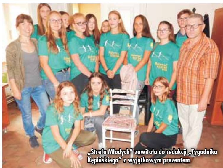
„Strefa Młodych” zawiązała do redakcji „Tygodnika Kępińskiego” z wyjątkowym prezentem

Projekt „Strefa Młodych” realizowany jest dzięki uzyskaniu przez bibliotekarzy dofinansowania z Programu Polsko-Amerykańskiej Fundacji Wolności „Równać szanse 2018 - Ogólnopolski Konkurs Grantowy”, którego operatorem jest Polska Fundacja Dzieci i Młodzieży. ben