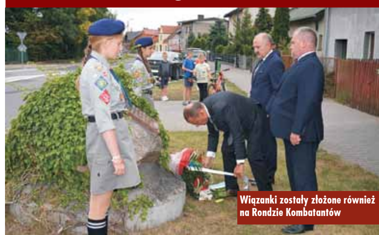
Wiązanki zostały złożone również na Rondzie Kombatantów

1 września br. w kościele pw. św. Marcina w Kępnie odprawiona została msza święta w intencji ojczyzny, rozpoczynając obchody 79. rocznicy wybuchu II wojny światowej. W południe rozległ się dźwięk syren oraz hymnu państwowego, aby przypomnieć wszystkim o tej ważnej dacie w dziejach Polski.