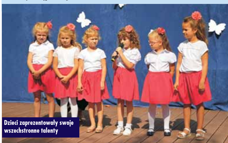
Dzieci zaprezentowały swoje wszechstronne talenty

tyczną, bibliotekę i pomieszczenia sanitarne. Przeprowadzono również termomodernizację dotychczasowego budynku. Na terenie szkoły wykonano plac zabaw oraz wielofunkcyjne boisko sportowe ze sztuczną trawą. Boisko o wymiarach 44 x 24 m wyposażone zostało w bramki, kosze do gry w koszykówkę oraz piłkochwyty. Teren został ogrodzony płotem panelowym. Na sfinansowanie budowy boiska pozyskano dotację z Ministerstwa Sportu i Turystyki w wysokości 33% wartości zadania.