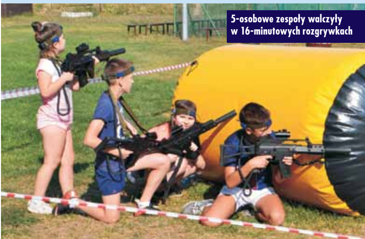
5-osobowe zespoły walczyły w 16-minutowych rozgrywkach

Gminny Ośrodek Kultury w Perzowie wraz z Biblioteką Publiczną.