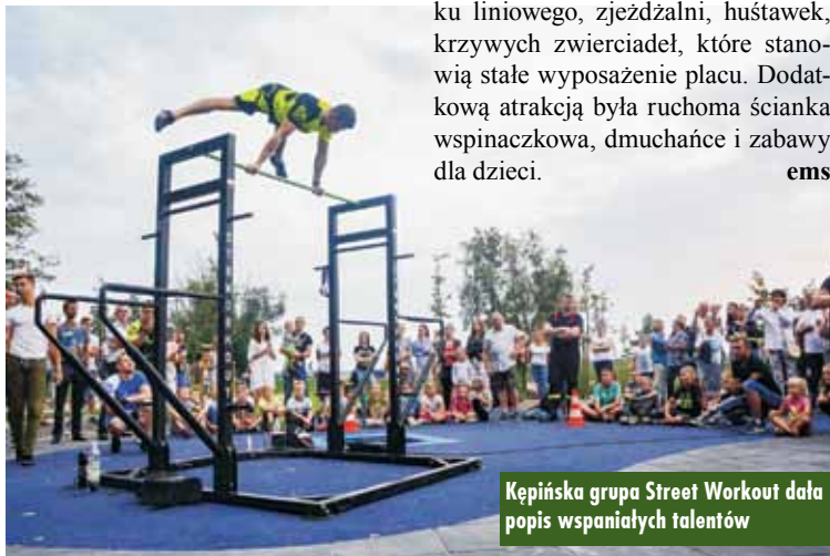
Kępińska grupa Street Workout dała popis wspaniałych talentów