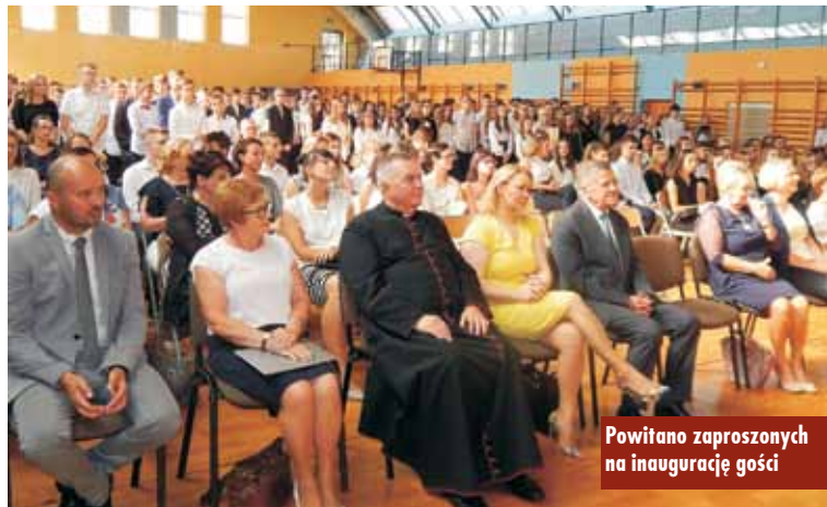
Powitano zaproszonych na inaugurację gości

do nich: pierwszy - setna rocznica odzyskania niepodległości, wychowanie w wartościach i kształtowanie patriotycznych postaw uczniów. Drugi to wdrażanie nowej podstawy