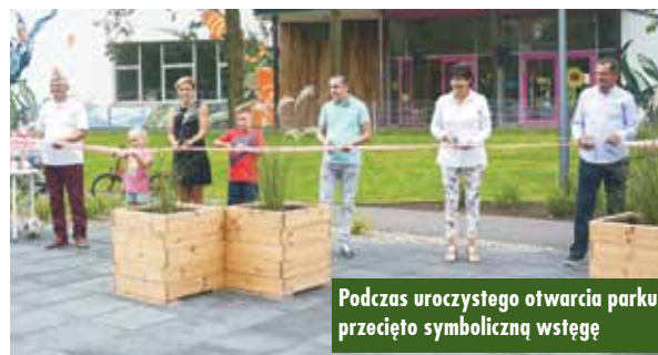
Podczas uroczystego otwarcia parku przecięto symboliczną wstęgę

masztami i łączkami (Mroczeń), budowę Street Workout w miejscowości Grębanin oraz zagospodarowanie te-