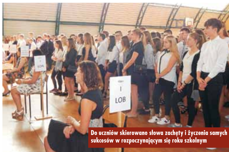
Do uczniów skierowano słowa zachęty i życzenia samych sukcesów w rozpoczynającym się roku szkolnym

cenie zawodowe oparte na ścisłej współpracy z pracodawcami oraz rozwój doradztwa zawodowego, rozwijanie kompetencji cyfrowych uczniów i nauczycieli oraz bezpieczne i odpowiedzialne korzystanie z zasobów dostępnych w sieci.