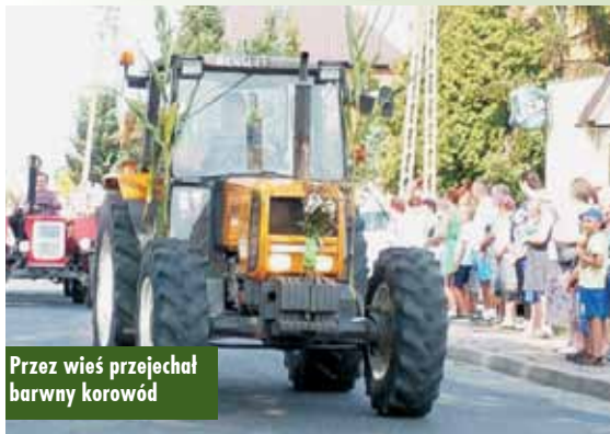
Przez wieś przejechał barwny korowód