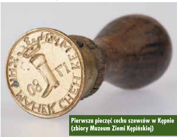
Pierwsza pieczęć cechu szewców w Kępnie (zbiory Muzeum Ziemi Kępińskiej)