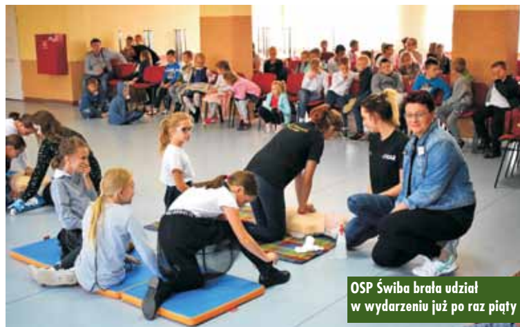
OSP Świba brała udział w wydarzeniu już po raz piąty