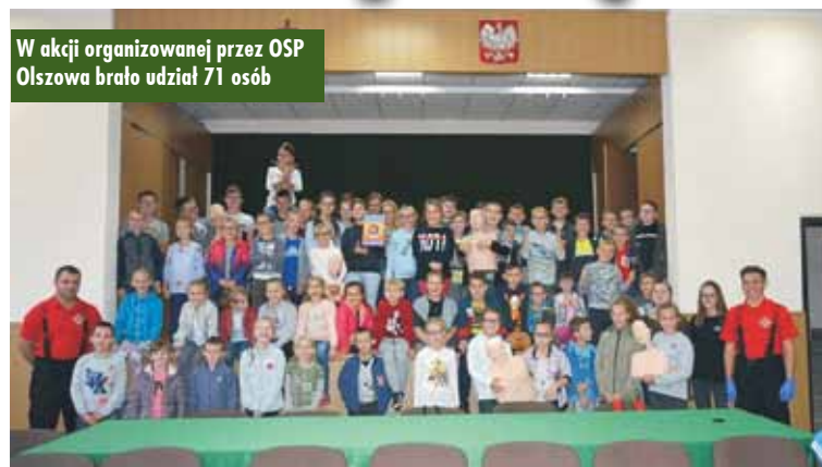
W akcji organizowanej przez OSP Olszowa brało udział 71 osób

Już po raz piąty w bicie rekordu w prowadzeniu resuscytacji krążeniowo-oddechowej udział wzięła jednostka Ochotniczej Straży Pożarnej w Świbie. W inicjatywie uczestniczyły 43 osoby. Po raz pierwszy zadania podjęła się także jednostka Ochotniczej Straży Pożarnej w Olszowie