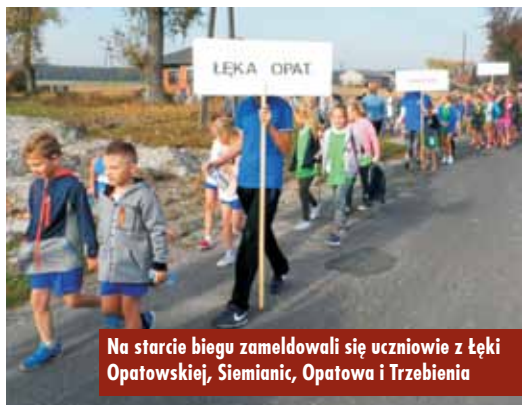
Na starcie biegu zameldowali się uczniowie z Łęki Opatowskiej, Siemianic, Opatowa i Trzebieńca

Nowo wybrani radni Rady Gminy Łęka Opatowska oraz wójt gminy odebrali zaświadczenia o wyborze