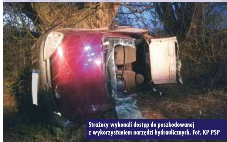
Strażacy wykonali dostęp do poszkodowanej z wykorzystaniem narzędzi hydraulicznych.

16 października br., o godzinie 6.17, do Stanowiska Kierowania Komendanta Powiatowego Państwowej Straży Pożarnej w Kępnie wpłynęło zgłoszenie o wypadku samochodu osobowego na drodze Słupia pod Kępem – Młynarka. - Kiedy strażacy dotarli na miejsce wypadku, zastali samochód osobowy marki Opel, który znajdował się w rowie, przewrócony na bok. Wewnątrz pojazdu była nieprzytomna osoba poszkodowana. Natychmiast przystąpiono do działań mających na celu jak najszybszą ewakuację po-