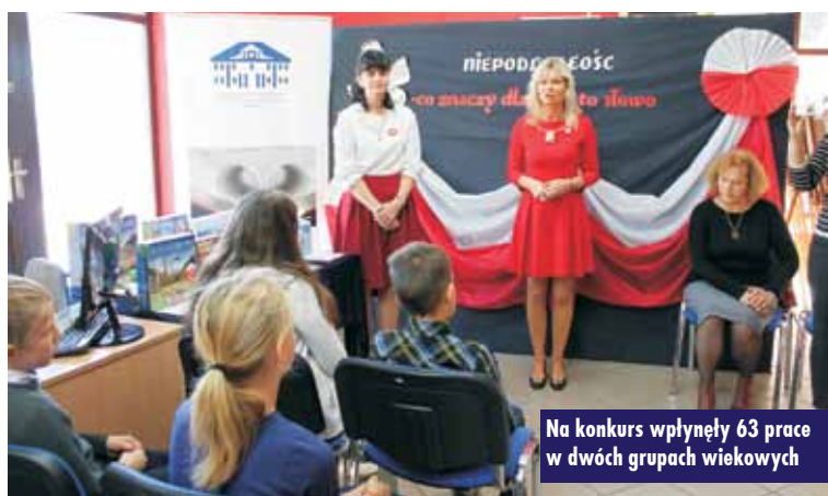
Na konkurs wpłynęły 63 prace w dwóch grupach wiekowych