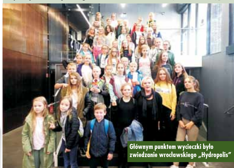
Głównym punktem wycieczki było zwiedzanie wrocławskiego „Hydropolis”