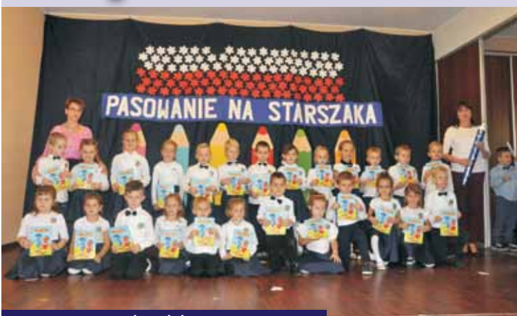
Pasowanie na „starszaków” było ogromnym przeżyciem dla dzieci z grup „Różyczki”, „Maczki” i „Konwale”