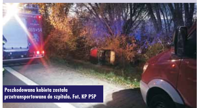
Poszkodowana kobieta została przetransportowana do szpitala.