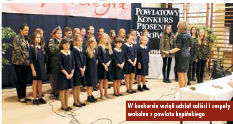
W konkursie wzięli udział soliści i zespoły wokalne z powiatu kępińskiego