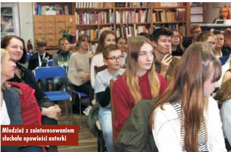
Młodzież z zainteresowaniem słuchała opowieści autorki

W spotkaniu autorskim wzięła udział młodzież wraz z nauczycielami ze Szkoły Podstawowej w Mroczeniu.