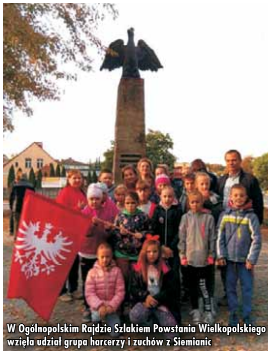
W Ogólnopolskim Rajdzie Szlakiem Powstania Wielkopolskiego wzięła udział grupa harcerzy i zuchów z Siemianic

VIII Bieg Jana Pawła II w czterdziestą rocznicę wyboru Karola Wojtyły na papieża i w 100-lecie odzyskania niepodległości przez Polskę zorganizowany został w Trzebieńcu