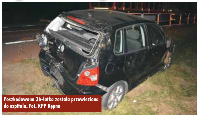
Poszkodowana 36-latką została przewieziona do szpitala.

Niezachowanie bezpiecznej odległości między pojazdami było przyczyną zdarzenia drogowego, do którego doszło 16 października br., około godziny 18.00, na „starej ósemce” w miejscowości Chojęcin-Szum.