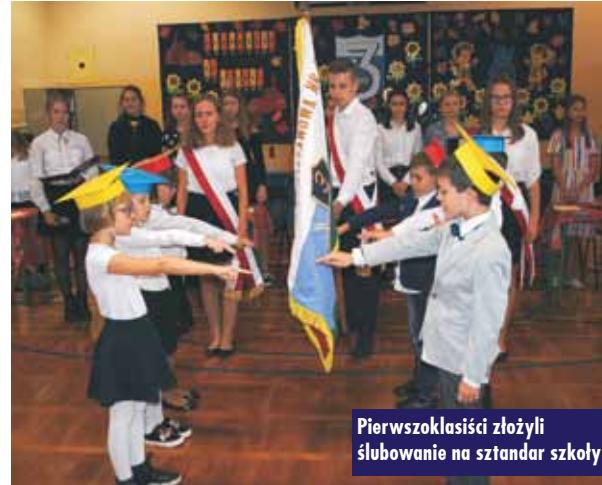
Pierwszoklasiści złożyli ślubowanie na sztandar szkoły