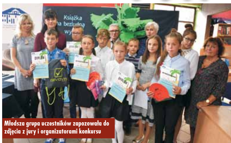
Młodsza grupa uczestników zapozowała do zdjęcia z jury i organizatorami konkursu

17 października br. w tymczasowej siedzibie Samorządowej Biblioteki Publicznej w Kępnie przy ul. Solidarności odbyło się rozstrzygnięcie XIV edycji konkursu literackiego „Książka na bezludną wyspę”. Konkurs adresowany był do uczniów szkół podstawowych i gimnazjów. Zadaniem uczestników było napisanie listu do przyjaciela, opisując wybraną przez siebie książkę, którą