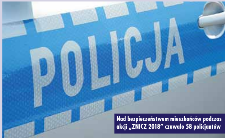
Nad bezpieczeństwem mieszkańców podczas akcji „ZNICZ 2018” czuwało 58 policjantów

Nie obyło się jednak bez uczestników ruchu, którzy lekceważeniem przepisów i zasad bezpieczeństwa mogli doprowadzić do tragedii na drodze. W ciągu pięciu dni wzmożonych działań odnotowano jednak tylko cztery kolizje drogowe – do wszystkich doszło 31 paździer-