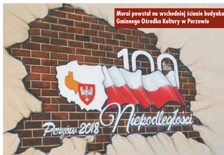
Mural powstał na wschodniej ścianie budynku Gminnego Ośrodka Kultury w Perzowie

wiednią przestrzeń systematycznie odwiedzaną przez mieszkańców, chociażby ze względu na usytuowanie GOK, biblioteki, USC. W sąsiedztwie znajdują się tereny rekreacyjno-sportowe, na których odbywają się