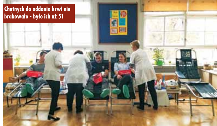
Chętnych do oddania krwi nie brakowało - było ich aż 51

21 października br. po raz kolejny z inicjatywy Ochotniczej Straży Pożarnej w Baranowie w Zespole Szkół im. Powstańców Wielkopolskich w Baranowie zorganizowana została zbiórka krwi. Zarejestrowało się 51, a krew oddało 40 honorowych krwiodawców. W czasie akcji udało zebrać