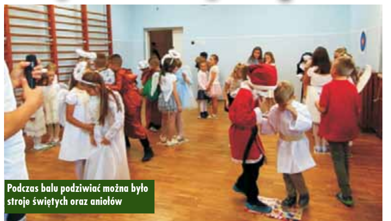
Podczas balu podziwiać można było stroje świętych oraz aniołów