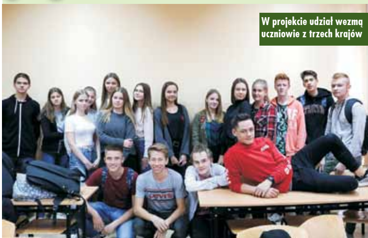
W projekcie udział wezmą uczniowie z trzech krajów