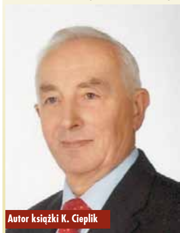
Autor książki K. Cieplik

Przedmiotem książki Rychtalscy organmistrzowie , skierowanej do szerokiego grona czytelników, jest historia zakładu organmistrzowskiego,