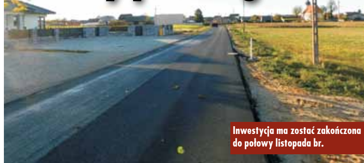
Inwestycja ma zostać zakończona do połowy listopada br.

Wartość całkowita pierwszego etapu to 5.042.823,03 zł. Gmina Trzcinica pozyskała na to zadanie dofinansowania w wysokości 3.080.215,00 zł w ramach Wielkopolskiego Regionalnego Programu Operacyjnego na lata 2014-2020 Działanie 4.3 Gospodarka