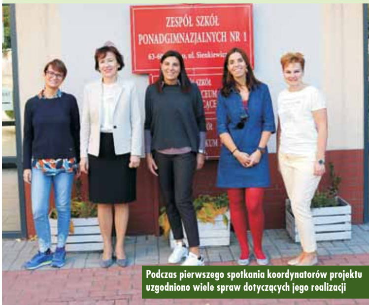
Podczas pierwszego spotkania koordynatorów projektu uzgodniono wiele spraw dotyczących jego realizacji