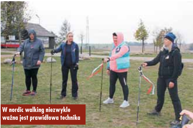
W nordic walking niezwykle ważna jest prawidłowa technika

Uroczystość pasowania na „starszaków” dzieci z Przedszkola Samorządowego „Kwiaty Polskie” w Bralinie w Świetlicy Profilaktyczno-Środowiskowej „Tęcza” w Bralinie