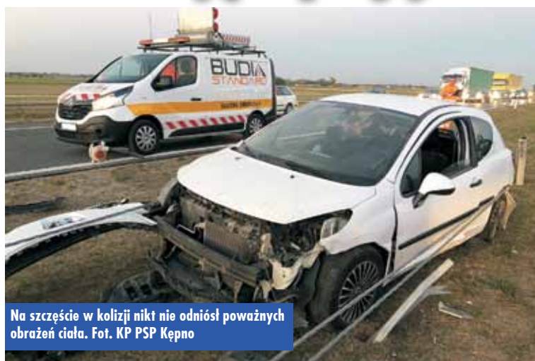
Na szczęście w kolizji nikt nie odniósł poważnych obrażeń ciała.

14 października br., o godzinie 18.00, do Stanowiska Kierowania Komendanta Powiatowego Państwowej Straży Pożarnej w Kępnie wpłynęło zgłoszenie o wypadku z udziałem samochodu osobowego na drodze S8 (103 km), na wysokości Ostrówca. Na miejsce skierowano dwa zastępy z Jednostki Ratowniczo-Gaśniczej w Kępnie. - Kiedy strażacy dotarli na miejsce, zastali samochód osobowy,