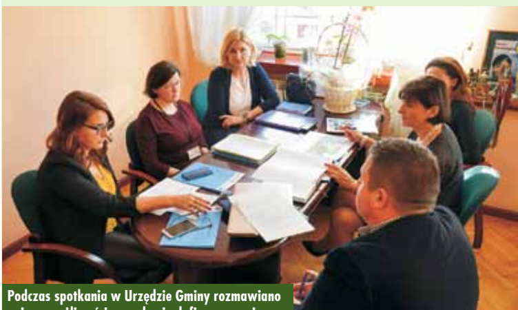
Podczas spotkania w Urzędzie Gminy rozmawiano m.in. o możliwości pozyskania dofinansowania

alnych możliwości dofinansowania. Gmina Baranów ma możliwość pozyskania środków unijnych, jednak dotyczą one tylko niewielkiej części infrastruktury. Planuje się pozyskać środki zewnętrzne na zajęcia dodatkowe dla uczniów, dokształcanie nauczycieli oraz wyposażenie sali przedszkolnej w meble, sprzęt TIK (sprzęt informatyczny i telekomunikacyjny, w tym: komputer wraz z oprogramowaniem, monitor, drukarka, kserokopiarka) czy audiowizualny. Forma wsparcia, jaką oferuje program, skupia się jedynie na pomocy dla przedszkolaków trzy- i czteroletnich oraz bieżącym funkcjonowaniu planowanego do rozbudowy przedszkola przez okres 12 miesięcy. es