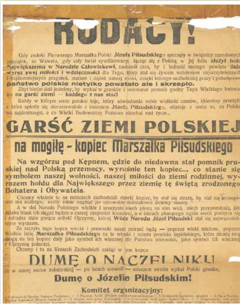
Plakat z 1935 roku anonsujący powstanie Kopca im. Józefa Piłsudskiego w Kępnie