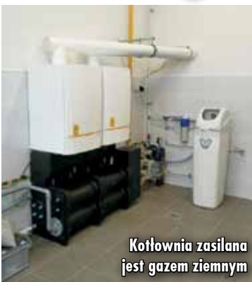
Kotłownia zasilana jest gazem ziemnym

Od początku tegorocznego sezonu grzewczego sala gimnastyczna ZSP nr 1 przy ulicy Dąbrowskiego 4 w Kępnie ogrzewana jest za pośrednictwem kotłowni zasilanej gazem ziemnym. To kolejny obiekt pod zarządem Powiatu Kępińskiego, w którym zastosowano ogrzewanie sprzyjające ochronie środowiska. Koszt modernizacji kotłowni to 95.435,73 złotych.