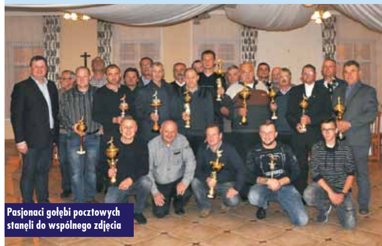
Pasjonaci gołębi pocztowych stanęli do wspólnego zdjęcia