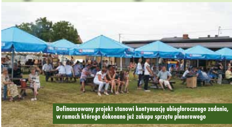
Dofinansowany projekt stanowi kontynuację ubiegłorocznego zadania, w ramach którego dokonano już zakupu sprzętu plenerowego

Gmina Trzcinica uchwałą Sejmiku Województwa Wielkopolskiego otrzymała pomoc finansową w ramach VI edycji konkursu „Odnowa wsi szansą dla aktywnych sołectw”. Projekt pn. „Zakup wyposażenia służącego promocji i integracji miejscowości Trzcinica – etap II” obejmuje zakup 10 kompletów ławostołów biesiadnych i 10 sztuk parasoli z nadrukiem.