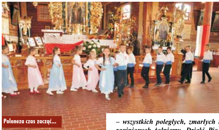
Poloneza czas zacząć...