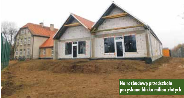
Na rozbudowę przedszkola pozyskano blisko milion złotych

Drugim projektem, na który Gmina pozyskała środki jest „Akademia wesołego przedszkolaka w