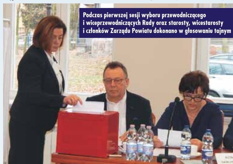
Podczas pierwszej sesji wyboru przewodniczącego i wiceprzewodniczących Rady oraz starosty, wicestarosty i członków Zarządu Powiatu dokonano w głosowaniu tajnym

Nowa przewodnicząca jest radną powiatową od 2006 r., w ostatniej kadencji będąc przewodniczącą Komisji Budżetu i Finansów. W latach 2008–2010 piastowała stanowisko zastępcy burmistrza miasta i gminy Kępno.