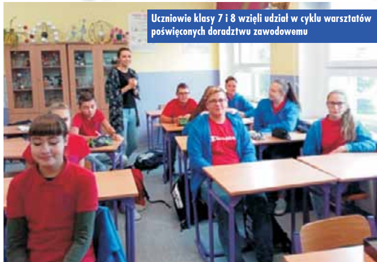
Uczniowie klasy 7 i 8 wzięli udział w cyklu warsztatów poświęconych doradztwu zawodowemu

Tegoroczne obchody Ogólnopolskiego Tygodnia Kariery pod hasłem „Bądź architektem swojego szczęścia!” w Szkole Podstawowej w Opatowie cieszyły się ogromnym zainteresowaniem. Uczniowie klasy 7 i 8 wzięli udział w cyklu warsztatów poświęconych doradztwu zawodowemu. Dowiedzieli się więcej na temat swoich predyspozycji zawodowych oraz kompetencji.