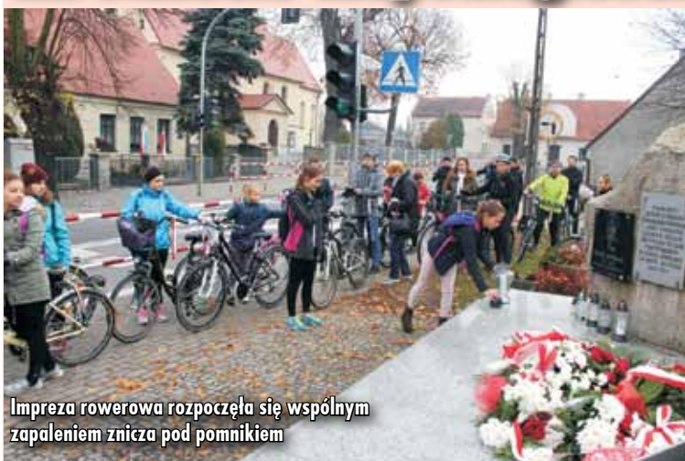
Impreza rowerowa rozpoczęła się wspólnym zapaleniem znicza pod pomnikiem

Uczestnicy oraz sympatycy projektu „Latająca Galeria SZATNIA” w poniedziałek, 12 listopada br., po raz drugi uczcili Niepodległość. Wszyscy wspólnie wzięli udział w sportowej imprezie rowerowej „100 km na stulecie niepodległości”.