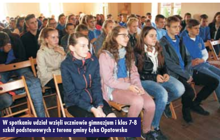
W spotkaniu udział wzięli uczniowie gimnazjum i klas 7-8 szkół podstawowych z terenu gminy Łęka Opatowska

Pisarz, dziennikarz telewizyjny i internetowy, terapeuta, modelarz, pasjonat fantastyki w czasie spotkania próbował przekonywać młodych ludzi, że granie to rozrywka i nie można wielogodzinne siedzenia przy komputerze usprawiedliwiać inaczej, tłumaczyć się przed sobą i innymi, że granie daje nam coś więcej i np. uczy. Natomiast same gry należy dostosowywać do wieku użytkownika i dozwalać z umiarem. Komputer, tablet czy telefon potrafią „pożreć” wiele godzin naszego życia, sprawić, że zaniedbamy nie tylko obowiązki, ale też stracimy czas potrzebny na realizację pasji. Autor przypominał, że urzędnicy te nie mogą nam zastępować drugiego człowieka, wypaczać naszych relacji z innymi, uniemożliwiać nam tworzenia więzi z bliskimi, stawiać się całym naszym światem.