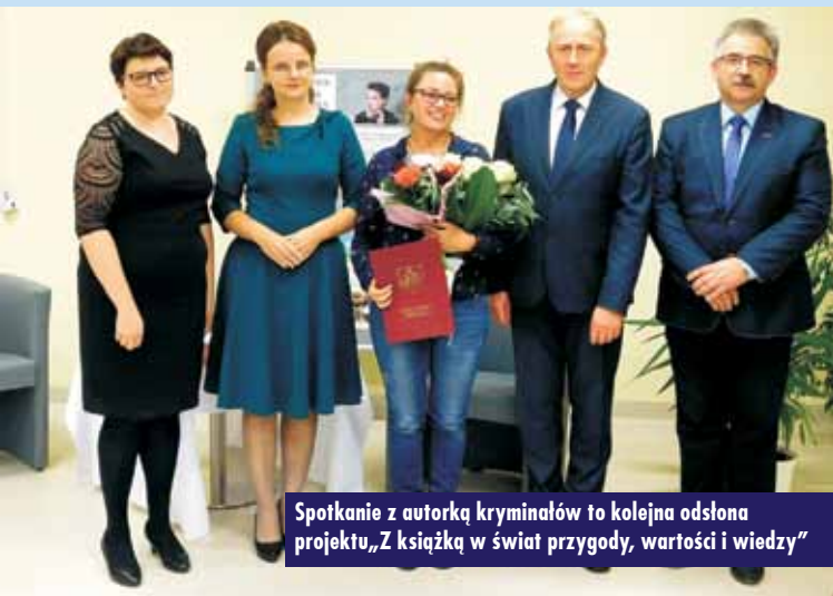
Spotkanie z autorką kryminałów to kolejna odsłona projektu „Z książką w świat przygody, wartości i wiedzy”

Olga Rudnicka zadebiutowała jako autorka jeszcze podczas studiów, mając niespełna dwadzieścia lat. W 2008 roku ukazała się jej pierwsza książka pod tytułem „Martwe jezioro”. Jak sama przyznaje, rozpoczęła swoją przygodę z pisaniem, aby ulżyć swojej wyobraźni, przez lata nagromadziło się w jej głowie wielu bohaterów i postanowiła znaleźć im nowe miejsce – na kartkach swoich