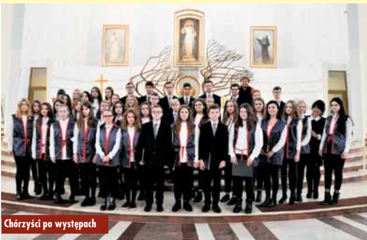
Chórzyści po występach