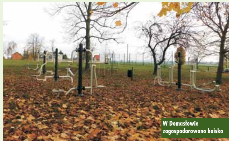
W Domasławie zagospodarowano boisko

W Miechowie uporządkowany i zagospodarowany został porośnięty dotąd krzakami teren przy przedszkolu. Nasadzono drzewa, zakupiono ławeczki, kosze, stojaki na rowery oraz urządzenia zabawowe. Pojawiły się: altana plenerowa, lampa solarna i grill. Na terenie działki objętej projektem utworzone zosta-