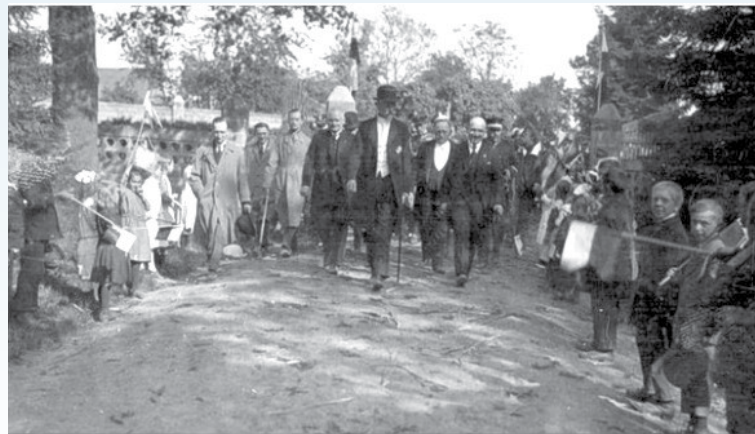
Archiwalne zdjęcie z wizyty Prezydenta II RP Stanisława Wojciechowskiego w Drożkach 21 maja 1925 r.

Obchody 100. rocznicy odzyskania przez Polskę niepodległości zorganizowano w Wielkim Buczku