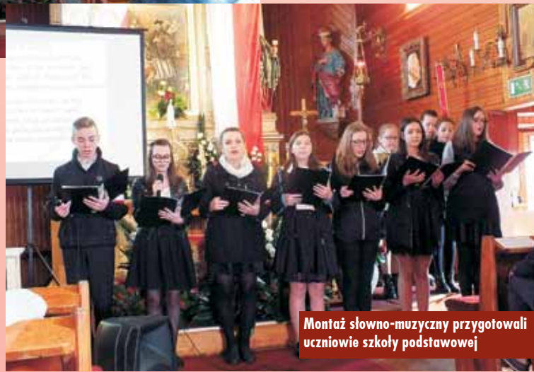
Montaż słowno-muzyczny przygotowali uczniowie szkoły podstawowej