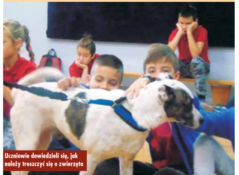
Uczniowie dowiedzieli się, jak należy troszczyć się o zwierzęta