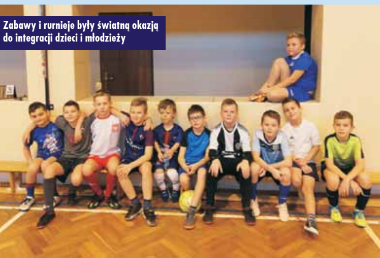
Zabawy i turnieje były świetną okazją do integracji dzieci i młodzieży

120. rocznica urodzin ks. Melchiora Grosska