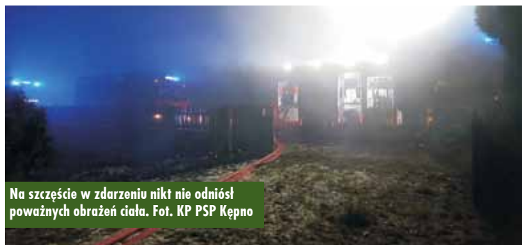
Na szczęście w zdarzeniu nikt nie odniósł poważnych obrażeń ciała.

Uroczystość z okazji Dnia Babci i Dziadka w Przedszkolu Samorządowym w Mikorzynie