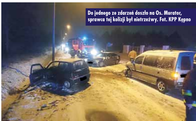
Do jednego ze zdarzeń doszło na Os. Murator, sprawca tej kolizji był nietrzeźwy.

samochodem marki renault, w wyniku niedostosowania prędkości do warunków panujących na drodze, straciła panowanie nad pojazdem i uderzyła w znak drogowy – relacjonuje oficer prasowa Komendy Powiatowej Policji w Kępnie sierż. Justyna Niczke.