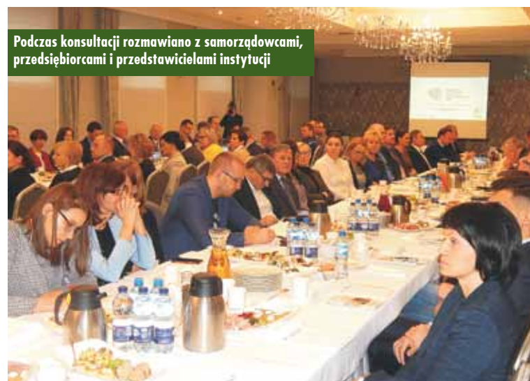
Podczas konsultacji rozmawiano z samorządowcami, przedsiębiorcami i przedstawicielami instytucji

Strategia Rozwoju Regionalnego 2030 będzie mieć wpływ na ukierunkowanie środków finansowych pochodzących z budżetu państwa, jaki i funduszy strukturalnych i inwestycyjnych w nadchodzących latach. Jest ona podstawowym dokumentem strategicznym polityki regionalnej państwa w perspektywie do 2030 r. Stanowi swego rodzaju zbiór wspólnych wartości i zasad współpracy