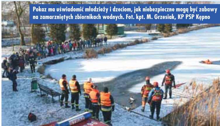
Pokaz ma uświadomić młodzieży i dzieciom, jak niebezpieczne mogą być zabawy na zamrzniętych zbiornikach wodnych.

mogą okazać się zabawy na zamrzniętym, niestrzeżonym zbiorniku wodnym.