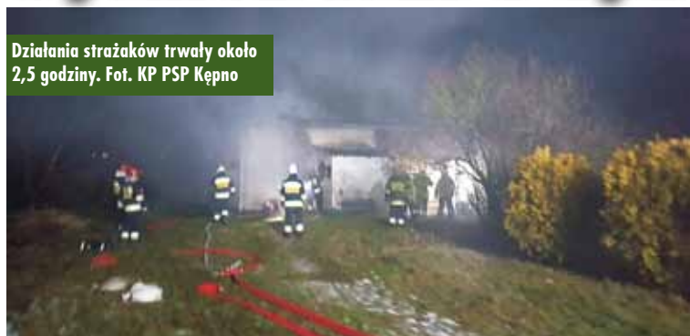
Działania strażaków trwały około 2,5 godziny.

9 stycznia br., o godzinie 22.05, do Stanowiska Kierowania Komendanta Powiatowej Państwowej Straży Pożarnej w Kępnie wpłynęło zgłoszenie o pożarze domu jednorodzinnego w Lipiu.