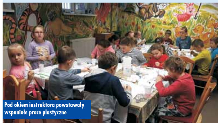
Pod okiem instruktora powstawały wspaniałe prace plastyczne

O tym, że czas spędzony w domu może być atrakcyjny przekonali się najmłodszy mieszkańcy gminy Perzów podczas pierwszego tygodnia ferii zimowych.