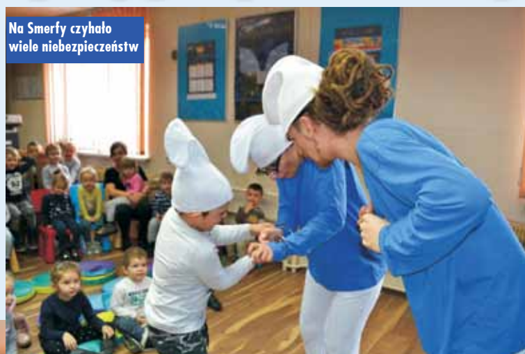
Dzieci z radością włączyły się w przedstawienie

Na Smerfy czyhało wiele niebezpieczeństw