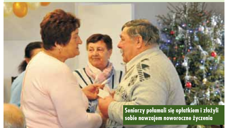
Seniorzy połamali się opłatkiem i złożyli sobie nawzajem noworoczne życzenia

Przy okazji spotkania wójt zabrał głos, składając wszystkim seniorom życzenia zdrowia oraz wszelkiej pomyślności, zapewniając przy okazji, że wraz z pracownikami Urzędu Gminy Bralin jest zawsze do dyspozycji mieszkańców gminy, starając się ich wspierać i pomagać. Z okazji zbliżającego się Dnia Babci i Dziadka na ręce seniorów życzenia złożył również S. Mirowski, wspominając o