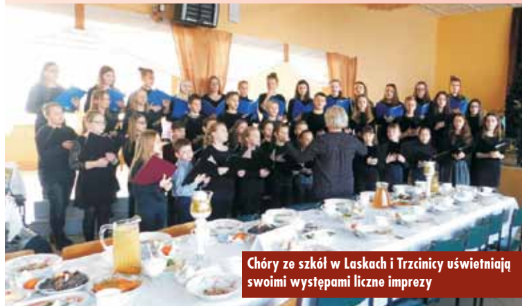
Chóry ze szkół w Laskach i Trzcinicy uświetniają swoimi występami liczne imprezy

W gminie Trzcinnica działania w ramach projektu Akademii Chóralnej „Śpiewająca Polska” trwają już od 2007 roku i początkowo dotyczyła jednego, a od kilku lat już obu chórów, które odnoszą znaczące sukcesy w skali województwa. Oprac. bem