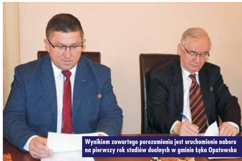
Wynikiem zawartego porozumienia jest uruchomienie naboru na pierwszy rok studiów dualnych w gminie Łęka Opatowska

pińskiego, podjęła się zorganizowania warunków wysokospecjalistycznego kształcenia kadr dla lokalnego przemysłu meblarskiego oraz szeroko rozumianej edukacji związanej z przygotowaniem się do korzystania z najnowocześniejszych technologii w przemyśle i produkcji.