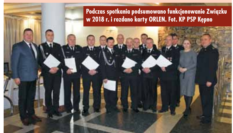
Podczas spotkania podsumowano funkcjonowanie Związku w 2018 r. i rozdano karty ORLEN.

Spotkanie było także doskonałą okazją do przekazania strażakom -ochotnikom kart rabatowych ORLEN, które w ramach ogólnopolskiego programu „Karta rabatowa dla straży pożarnej” przeznaczone są do indywidualnego i niezwiązanego z prowadzoną działalnością gospodarczą korzystania przez pracowników lub członków OSP zrzeszonych w