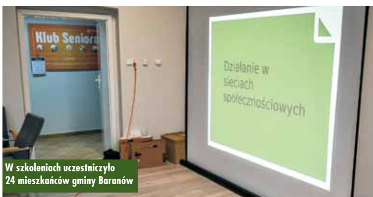
W szkoleniach uczestniczyło 24 mieszkańców gminy Baranów

Widowisko teatralne pt. „Przygody Ważniaka i spółki” w Bibliotece Publicznej w Mroczeniu