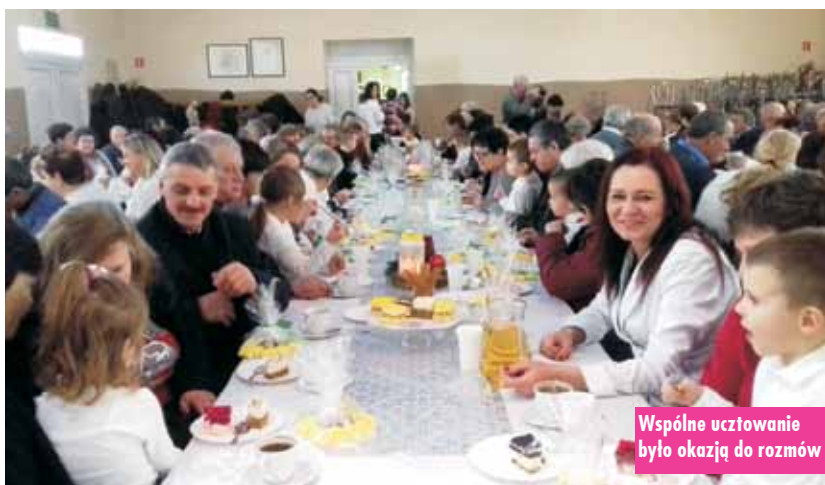
Wspólne ucztowanie było okazją do rozmów

Dzień Babci i Dziadka w Przedszkolu Samorządowym nr 2 w Kępnie