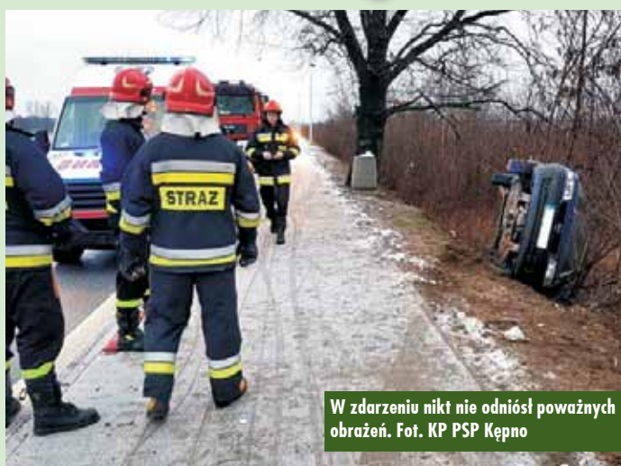
W zdarzeniu nikt nie odniósł poważnych obrażeń.

9 stycznia br., o godzinie 7.44, dyżurny Stanowiska Kierowania Komendanta Powiatowego Państwowej Straży Pożarnej w Kępnie otrzymał zgłoszenie o dachowaniu samochodu osobowego na drodze Grębanin – Kępno, na Trakcie Napoleońskim. W zdarzeniu ucierpiały dwie osoby, nie odnieśli jednak obrażeń wymagających hospitalizacji. - Kiedy strażacy dotarli na miejsce, Zespół Ratownictwa Medycznego udzielał już pomocy poszkodowanym – nie wymagali oni hospitalizacji. Działania strażaków polegały na zabezpieczeniu terenu działań oraz uszkodzonego pojazdu. Po czynnościach policji uszkodzony samochód zabrala pomoc drogowa – poinformował rzecznik prasowy KP PSP Kępno kpt. Jarosław Kucharzak. Oprac. KR