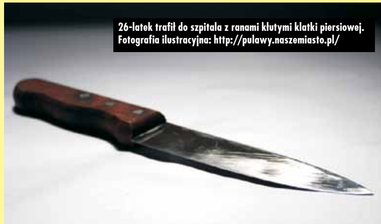
26-latek trafił do szpitala z ranami kłutymi klatki piersiowej.