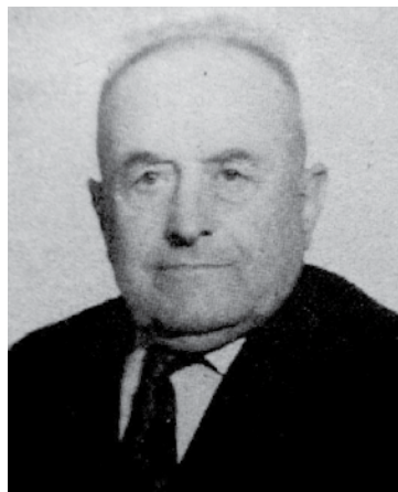
E. Pawlak, fotografia z książki „Przeżyliśmy Gross-Rosen”

dzonych, których poddawano najpierw chwilowemu działaniu środków bojowych, a następnie próbowano ratować, bez powodzenia. Wykończono tak m. in. 2 tys. Węgrów pochodzenia żydowskiego i miejsce zyskało miano „obozu śmierci”, a ci którzy tam trafiali zwykle mieli wpisane w aktach: RU - „Ruckkehrerwusch” (powrót niepożądany). By usunąć niewygodnych świadków swych zbrodni, Niemcy planowali zlikwidować pozostałych przy życiu przed końcem wojny, przedtem jednak zamierzali ich maksymalnie wykorzystać. Z powodu zbliżania się Rosjan 23/24 stycznia 1945 r. zarządzono ewakuację obu podobozów, którą