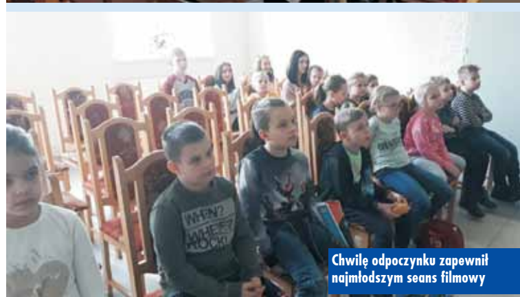
Chwilę odpoczynku zapewnił najmłodszym seans filmowy