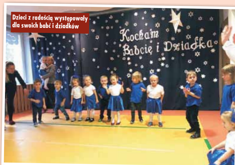
Dzieci z radością występowały dla swoich babć i dziadków

„Kiedy babcia z dziadkiem do przedszkola spieszą, to już wnuki ze spotkania najbardziej się cieszą”. I w Przedszkolu Samorządowym nr 2 w Kępnie gwaro i wesoło, kiedy dzieci oczekują niecodziennych gości. Cały tydzień, od 7 do 11 stycznia br., trwało tam bowiem świętowanie Dnia Babci i Dziadka. Każdego dnia maluchy z kolejnych grup przedszkolnych i żłobkowych oczekiwały na swoich ukochanych dziadków i babcie. Były wiersze, piosenki i tańce, cała moc oklasków, całusów, pyszny poczęstunek oraz wiele ukradkiem ocieranych łez. Magia tych chwil pozostała w niejednej fotografii... i serduszkach. Oprac. KR