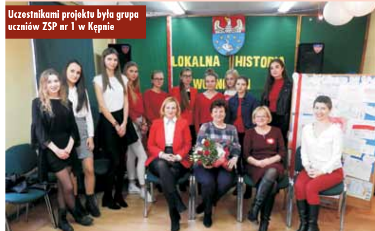
Uczestnikami projektu była grupa uczniów ZSP nr 1 w Kępnie

Projekt „Niepodległe kobiety. Lokalna historia wolności” był realizowany od września 2018 r. do stycznia 2019 r. w ramach ogólnopolskiego programu Młodzi w Akcji. Jego celem jest inspirowanie opiekunów i opiekunek młodzieży oraz ich podopiecznych do podejmowania nieszbłonowych działań na rzecz swojej okolicy i jej mieszkańców. Program jest realizowany przez Centrum Edukacji Obywatelskiej w partnerstwie z Polsko-Amerykańską Fundacją Wolności w ramach programu Szkoła Ucząca się. Oprac. bem