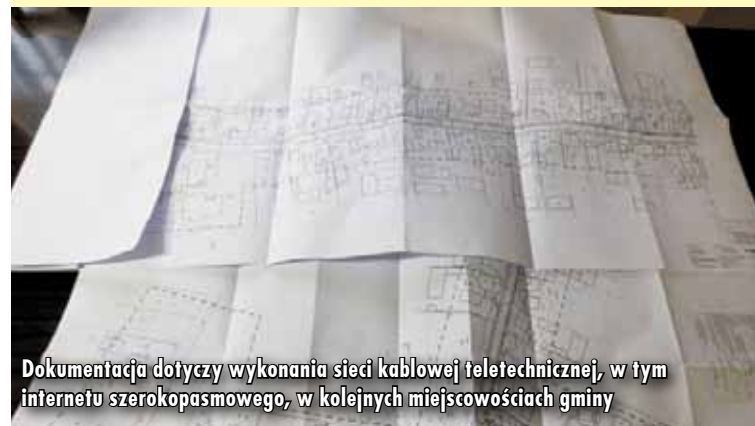
Dokumentacja dotyczy wykonania sieci kablowej teletechnicznej, w tym internetu szerokopasmowego, w kolejnych miejscowościach gminy

Firma „Inea S.A.” w Poznaniu przekazała do Urzędu Gminy w Trzcinicy kolejną dokumentację projektową w celu jej uzgodnienia. Dotyczy ona kolejnych miejscowości, w których planowane jest wykonanie sieci kablowej teletechnicznej, w tym internetu szerokopasmowego.