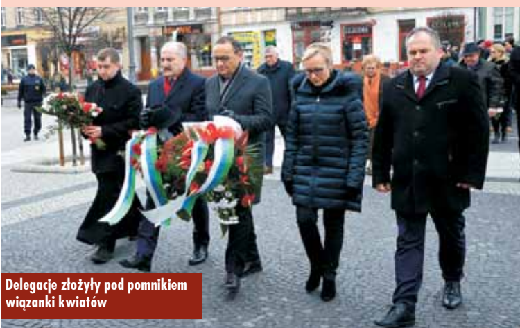
Delegacje złożyły pod pomnikiem wiązanki kwiatów

Przy okazji wydarzenia minutą ciszy uczczono pamięć prezydenta Gdańska Pawła Adamowicza. KR