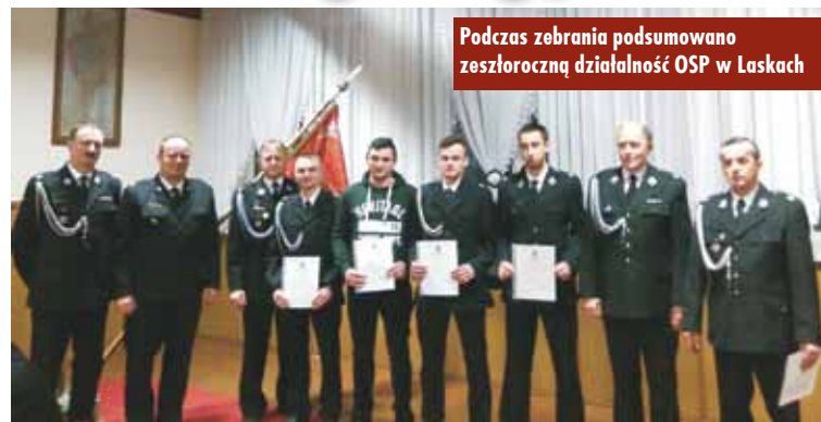
Podczas zebrania podsumowano zeszłoroczną działalność OSP w Laskach

W trakcie zebrania przedstawiono prezentację multimedialną, ukazującą działalność jednostki w 2018 r.