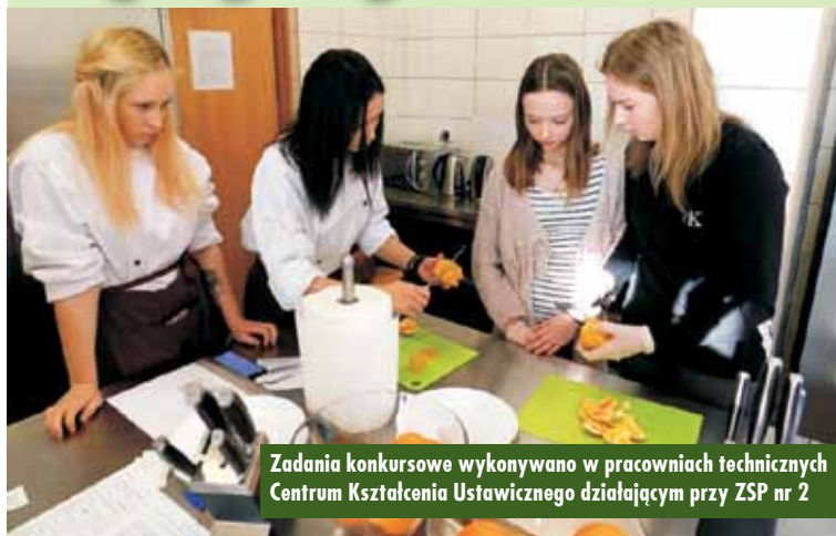
Zadania konkursowe wykonywano w pracowniach technicznych Centrum Kształcenia Ustawicznego działającym przy ZSP nr 2

Od 2013 r. inicjatorem oraz organizatorem konkursu jest ZSP nr 2 w Kępnie, zaś patronem i głównym fundatorem nagród - Starostwo Powiatowe w Kępnie.