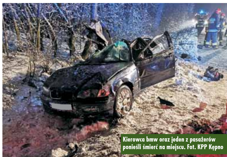
Kierowca bmw oraz jeden z pasażerów ponieśli śmierć na miejscu.

Samochodem poruszały się 4 osoby. Na miejscu zginął kierowca oraz jeden z pasażerów, 29-letni obywatel