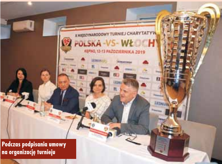
Podczas podpisania umowy na organizację turnieju

Stowarzyszenie PKPS „Siatkarz” od 10 lat organizuje turnie-