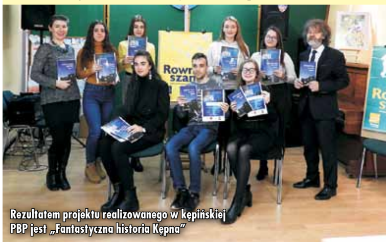
Rezultatem projektu realizowanego w kępińskiej PBP jest „Fantastyczna historia Kępna”

kańskiej Fundacji Wolności: Konkurs Specjalny „100-lecie odzyskania niepodległości”, którego operatorem jest Polska Fundacja Dzieci i Młodzieży.