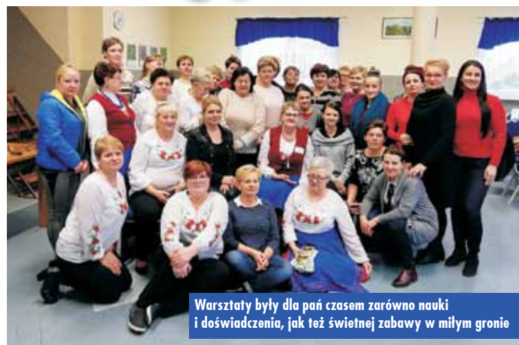
Warsztaty były dla pań czasem zarówno nauki i doświadczenia, jak też świetnej zabawy w miłym gronie

Towarzystwo Społecznie „Tilia” zakończyło realizację projektu grantowego „Kobieta przedsiębiorcza bez względu na wiek!” współfinansowanego ze środków Unii Europejskiej w ramach programu PROW 2014-2020 – wsparcie na wdrażanie operacji w ramach strategii rozwoju lokalnego kierowanego przez społeczność.