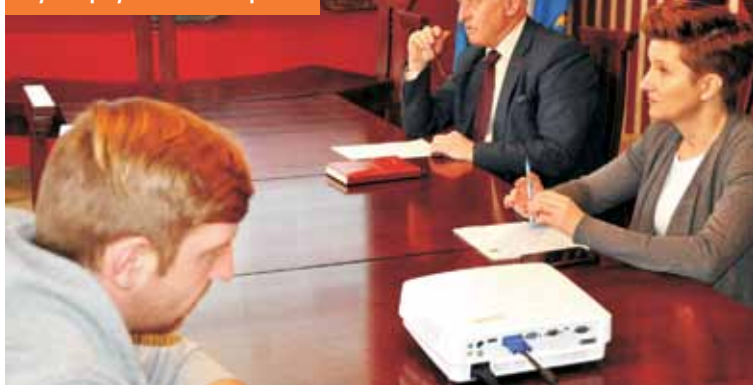
Podczas spotkania omówiono zasady i kryteria przyznawania dotacji