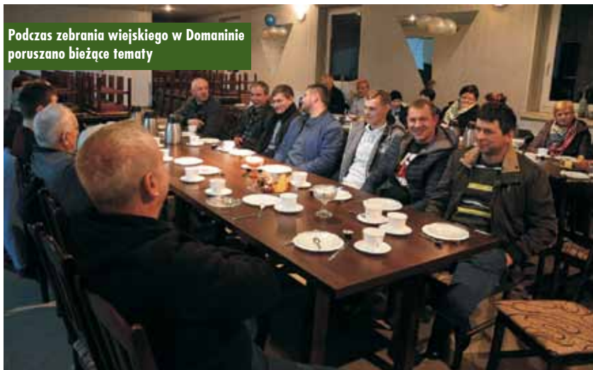
Podczas zebrania wiejskiego w Domaninie poruszano bieżące tematy