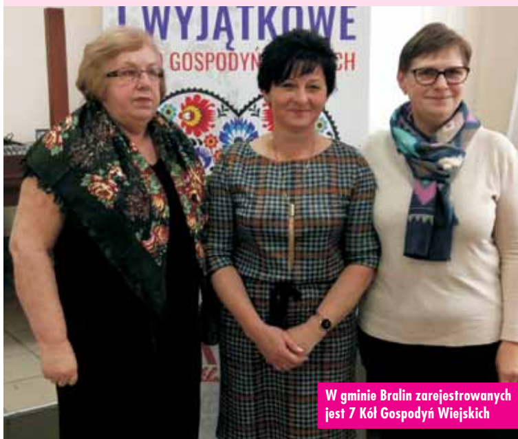
W gminie Bralin zarejestrowanych jest 7 Kół Gospodyń Wiejskich

oraz pełnomocnik do spraw Małych i Średnich Przedsiębiorstw poseł Andżelika Możdżanowska .