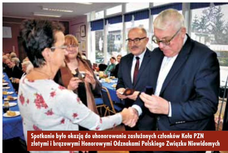
Spotkanie było okazją do uhonorowania zasłużonych członków Koła PZN złotymi i brązowymi Honorowymi Odznakami Polskiego Związku Niewidomych

Spotkanie było także okazją do uhonorowania zasłużonych członków Koła PZN złotymi i brązowymi