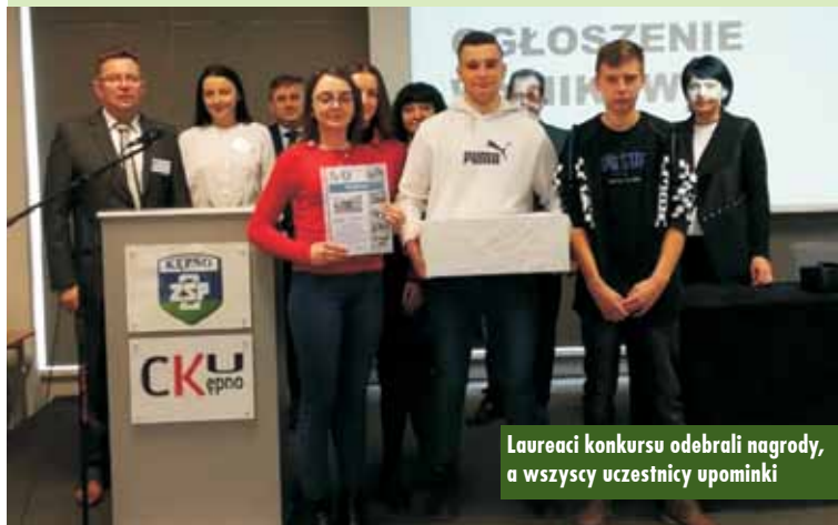
Laureaci konkursu odebrali nagrody, a wszyscy uczestnicy upominki

W VI edycji konkursu „Sprawni w przyszłym zawodzie” triumfowało Gimnazjum w Rychtalu. Za nim uplasowało się Gimnazjum w Laskach, a