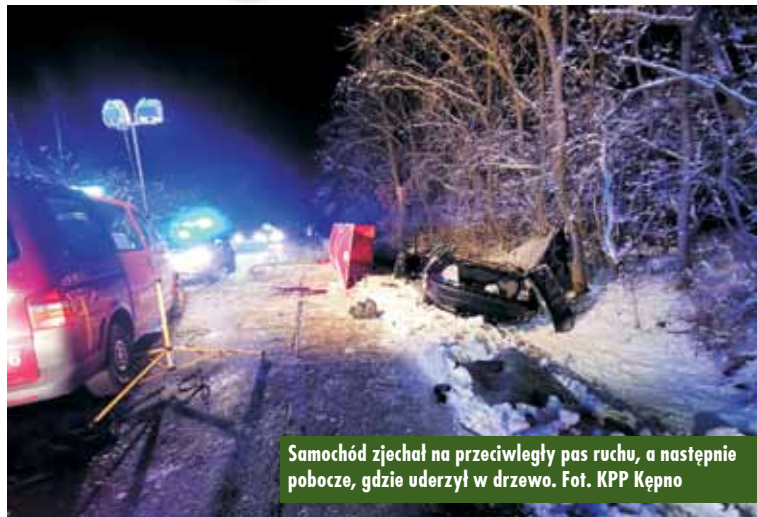
Samochód zjechał na przeciwny pas ruchu, a następnie pobocze, gdzie uderzył w drzewo.

5 lutego br., około godziny 20.50, oficer dyżurny Komendy Powiatowej Policji w Kępnie został powiadomiony o zdarzeniu drogowym na drodze powiatowej P5682 między Drożkami a Nową Wsią Książącą. - Kierujący samochodem marki BMW, 28-letni mieszkaniec gminy Rychtal, jadąc z Drożek w kierunku Nowej Wsi Książącej, stracił panowanie nad pojazdem, zjechał na przeciwny pas ruchu, a następnie pobocze, gdzie uderzył dachem w przydrożne drzewo – relacjonuje oficer prasowa KPP Kępno sierż. Justyna Niczke.