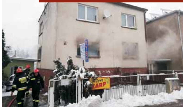
Pałiło się pomieszczenie na pierwszej kondygnacji budynku. Po ugaszeniu ognia cały budynek przewietrzono i sprawdzono.

Jedna osoba przebywała wewnątrz budynku. Pozostali mieszkańcy opuścili obiekt przed przybyciem straży pożarnej. Działania straży polegały na jak najszybszej ewakuacji osoby z budynku przy wykorzystaniu drabiny przystawnej – mówi rzecznik prasowy KP PSP Kępno kpt. Jarosław Kucharzak. Ewakuowanej osobie udzielono kwalifikowanej pierwszej pomocy do czasu przybycia Zespo-