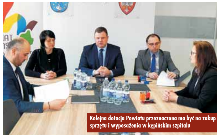
Kolejna dotacja Powiatu przeznaczona ma być na zakup sprzętu i wyposażenia w kępińskim szpitalu

Starosta podkreślił, że obowiązkiem samorządu powiatowego jest zabezpieczenie bezpieczeństwa pacjentów poprzez dbanie o sytuację w szpitalu i jego kondycję finansową. - Dla nas to jest priorytet i musimy zrobić wszystko, aby ten poziom bezpieczeństwa nie uległ zmianie.