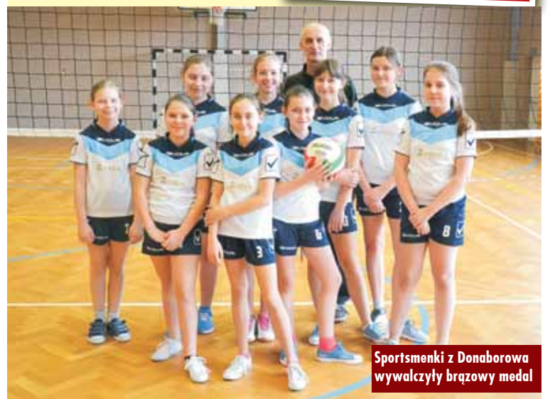
Sportsmenki z Donaborowa wywalczyły brązowy medal