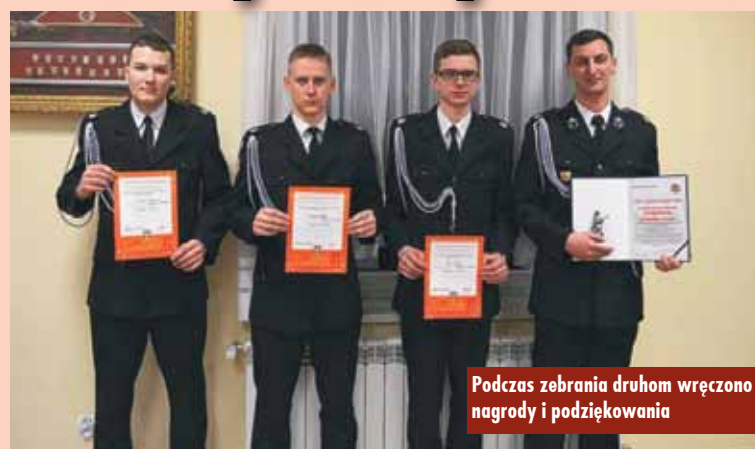
Podczas zebrania druhom wręczono nagrody i podziękowania