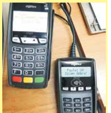
Dzięki programowi „Polska Bezgotówkowa” w instytucjach i przedsiębiorstwach wdrażane są terminale płatnicze