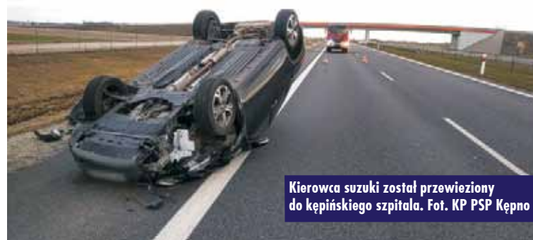
Kierowca suzuki został przewieziony do kępińskiego szpitala.

nienu ruchu po zakończeniu czynności prowadzonych przez policję – mówił mł. kpt. Paweł Michalski z Komendy Powiatowej Państwowej Straży Pożarnej w Kępnie.