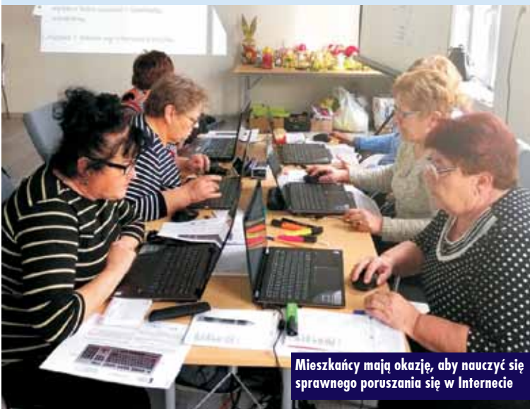
Mieszkańcy mają okazję, aby nauczyć się sprawnego poruszania się w Internecie

partnerstwo w składzie: Fundacja Aktywizacja (partner wiodący), Fundacja Rozwoju Społeczeństwa Informacyjnego, Polski Związek Głuchych