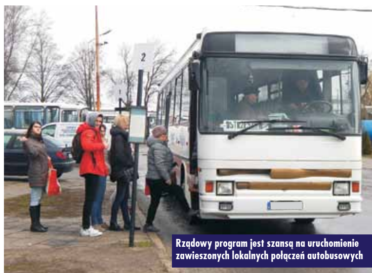
Rządowy program jest szansą na uruchomienie zawieszonych lokalnych połączeń autobusowych

znamy projekt ustawy, przywracając lokalne połączenia autobusowe. W mojej ocenie należy poczekać na przyjęte rozwiązania w tym zakresie, co być może pozwoli na uratowanie połączeń do miejsc, które są pozbawione innych środków komunikacji