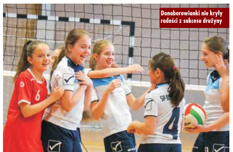
Donaborowianki nie kryły radości z sukcesu drużyny