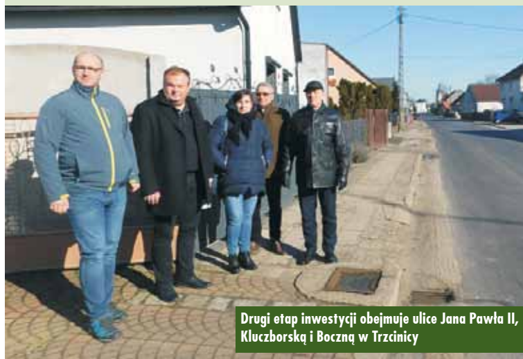
Drugi etap inwestycji obejmuje ulice Jana Pawła II, Kluczborską i Boczna w Trzcini