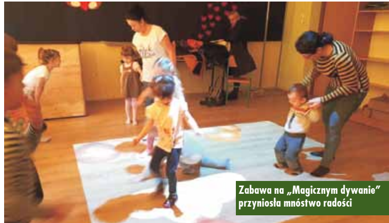
Zabawa na „Magicznym dywanie” przyniosła mnóstwo radości

Dzień ten dostarczył dzieciom mnóstwo radości i pokazał, że oddział przedszkolny w Drożkach jest bardzo dobrze wyposażony w pomoce dydaktyczne, sprzęt multimedialny, nowe meble i zabawki. Jest to miejsce, gdzie można wspaniale spędzić czas, bawić się, uczyć i rozwijać. Oprac. KR