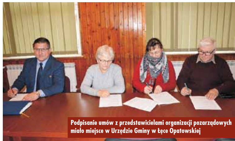
Podpisanie umów z przedstawicielami organizacji pozarządowych miało miejsce w Urzędzie Gminy w Łęce Opatowskiej