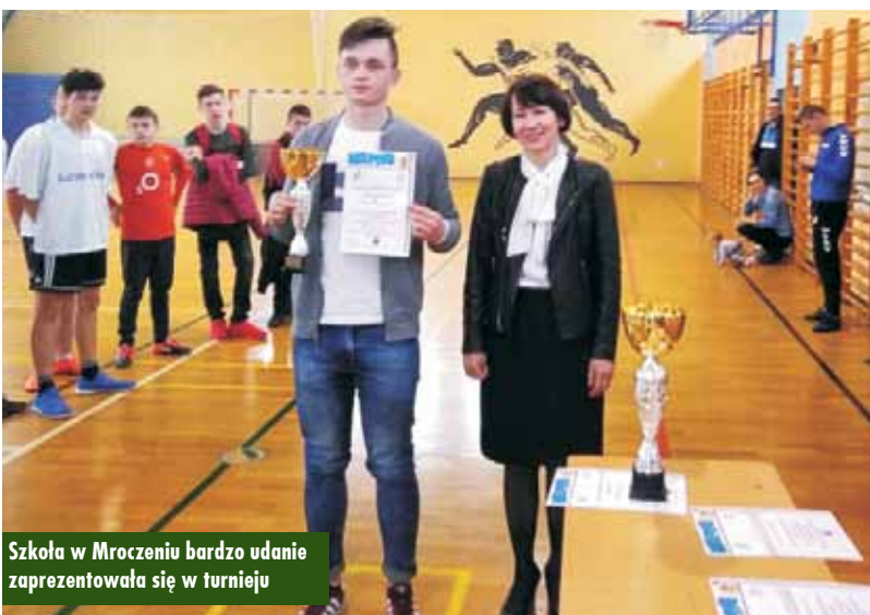
Szkoła w Mroczeniu bardzo udanie zaprezentowała się w turnieju