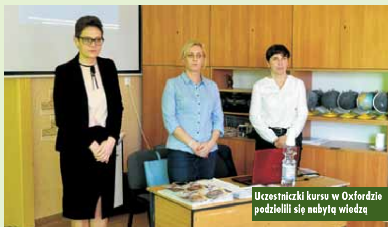
Uczestniczki kursu w Oxfordzie podzieliły się nabytą wiedzą

wskazówki do pracy z każdym z nich. Przedstawiono strukturę szkolnictwa i funkcjonowanie ucznia ze specjalnymi potrzebami edukacyjnymi w Wielkiej Brytanii oraz warunki i organizację pracy nauczycieli. Udostępniono i omówiono narzędzia służące do nauki i modelowania właściwych zachowań