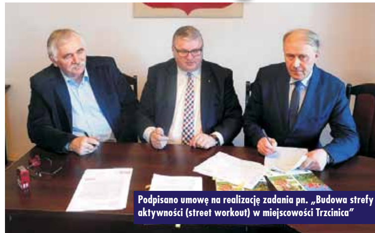
Podpisano umowę na realizację zadania pn. „Budowa strefy aktywności (street workout) w miejscowości Trzcinią”

18 lutego 2019 r. w Urzędzie Gminy Trzcinią odbyło się spotkanie wójta gminy Trzcinią Grzegorza Hadzika z wicemarszałkiem województwa wielkopolskiego Krzysztofem Grabowskim , podczas którego podpisana została umowa o przyznaniu pomocy na budowę elementów street workout w Trzcini.