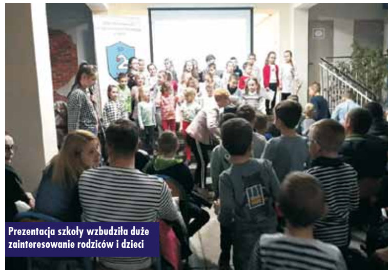
Prezentacja szkoły wzbudziła duże zainteresowanie rodziców i dzieci

7 marca br. Szkoła Podstawowa nr 2 im. Krzysztofa Kamila Baczyńskiego w Kępnie gościła w swoich murach przyszłych uczniów klas pierwszych wraz z rodzicami.