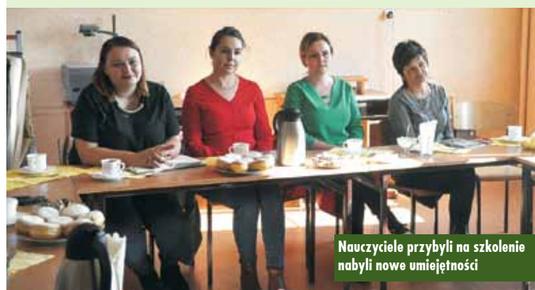
Nauczyciele przybyli na szkolenie nabyli nowe umiejętności

uczniów oraz zapoznano z programem „Moja skrzynka z narzędziami” i możliwościami wykorzystania go w szkole. Wszyscy uczestnicy szkolenia otrzymali broszurę zawierającą strategię wspierania uczniów ze specjalnymi potrzebami edukacyjnymi oraz materiały pomocne do wdrożenia programów modelujących właściwe zachowania. Przekazano również informacje ogólne o szkoleniu i pobycie w Oxfordzie. Szkolenie przebiegało w miłej i przyjaznej atmosferze.