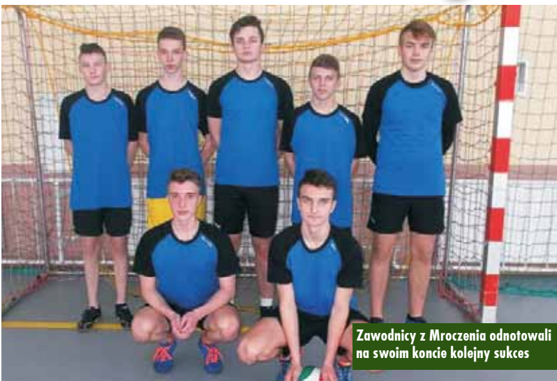
Zawodnicy z Mroczenia odnotowali na swoim koncie kolejny sukces