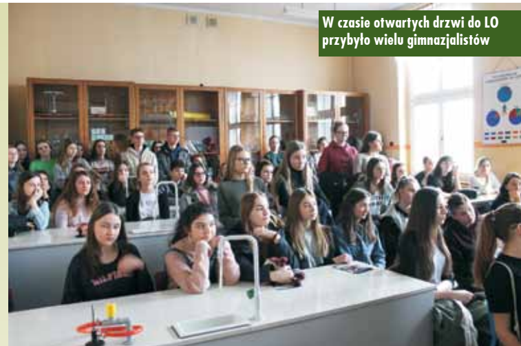
W czasie otwartych drzwi do LO przybyło wielu gimnazjalistów