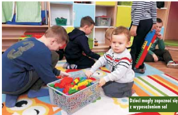
Dzieci mogły zapoznać się z wyposażeniem sal