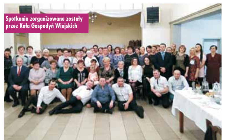
Spotkania zorganizowane zostały przez Kola Gospodyń Wiejskich

Gmina Trzcinica przystąpiła do programu „Polska Bezgotówkowa”