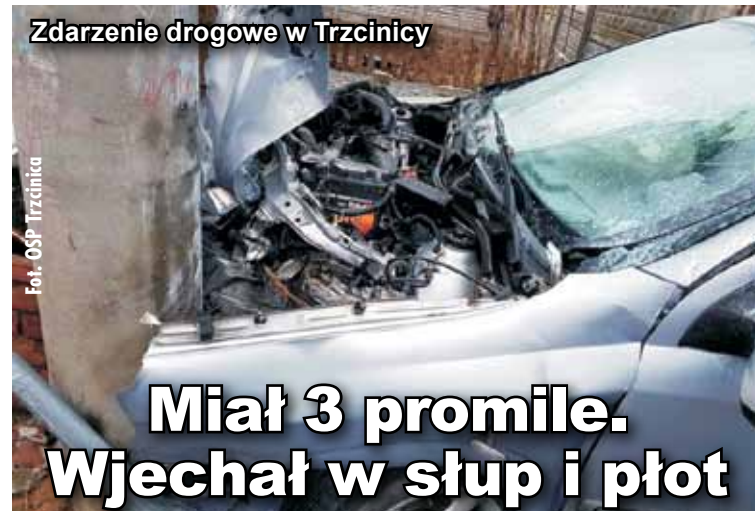
Zdarzenie drogowe w Trzcinicy