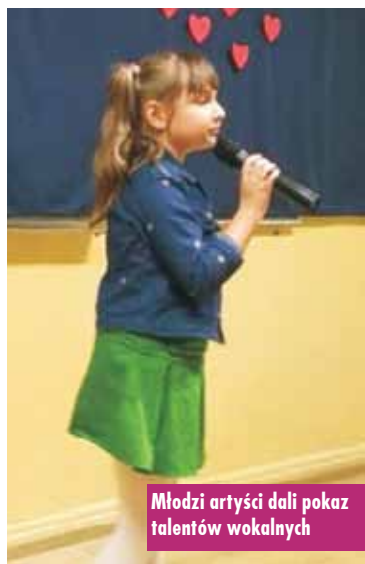
Młodzi artyści dali pokaz talentów wokalnych

miłości. Utwory o tej tematyce są bardzo popularne. Miłość to w końcu piękne uczucie. Może dawać radość i szczęście, ale czasem przynosi także rozczarowania. Właśnie dlatego, niezaprzeczalnie, jest niewyczerpanym źródłem inspiracji artystycznych i powstaje o niej tak wiele piosenek. Uczniowie zaprezentowali największe przeboje z dawnych lat oraz najnowsze hity. Wśród piosenek, które znalazły się w repertuarze,