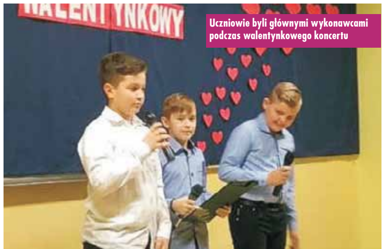
Uczniowie byli głównymi wykonawcami podczas waleńtkowego koncertu

były utwory, takie jak: „Tyle słonca w całym mieście”, „Tamta dziewczyna”, „Czas nie będzie czekał”, a nawet „Dumka na dwa serca”. W trakcie spotkania goście mogli napić się kawy i poczęstować ciastkami. Wszystko to w nastrojowej atmosferze, przy blasku świec i miłych dla ucha dźwiękach.