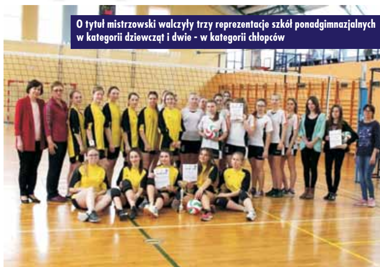
O tytuł mistrzowski walczyły trzy reprezentacje szkół ponadgimnazjalnych w kategorii dziewcząt i dwie - w kategorii chłopców

20 i 21 lutego 2019 r. w sali gimnastycznej Zespołu Szkół Ponadgimnazjalnych nr 1 w Kępnie odbyły się Mistrzostwa Powiatu w Siatkówce Dziewcząt i Chłopców, zorganizowane w ramach XX Licealiady 2018/2019.