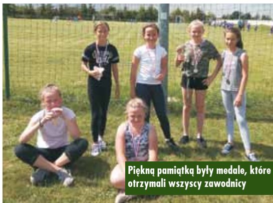
Piękną pamiątką były medale, które otrzymali wszyscy zawodnicy

Do zawodów w grupie żaków zgłosiły się: 2 drużyny z Trębaczowa, 2 drużyny z Trzcinicy oraz drużyna z Wołczyna.