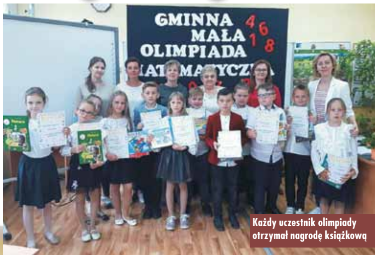
Każdy uczestnik olimpiady otrzymał nagrodę książkową

W konkursie wystartowało dwanaścioro uczniów klas II ze szkół w Trzcinicy i Laskach