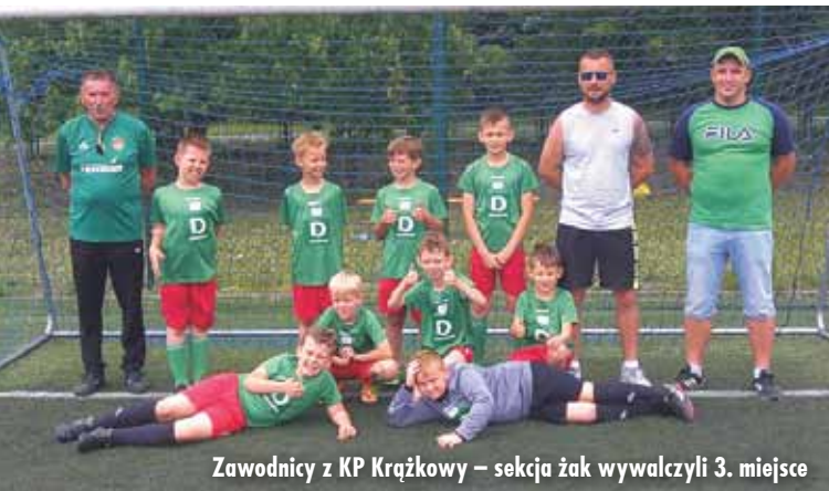
Zawodnicy z KP Krązkowy – sekcja żak wywalczyli 3. miejsce