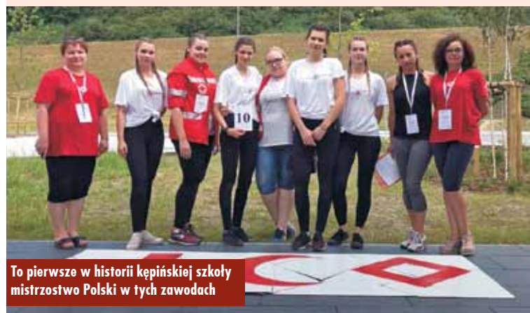
To pierwsze w historii kępińskiej szkoły mistrzostwo Polski w tych zawodach