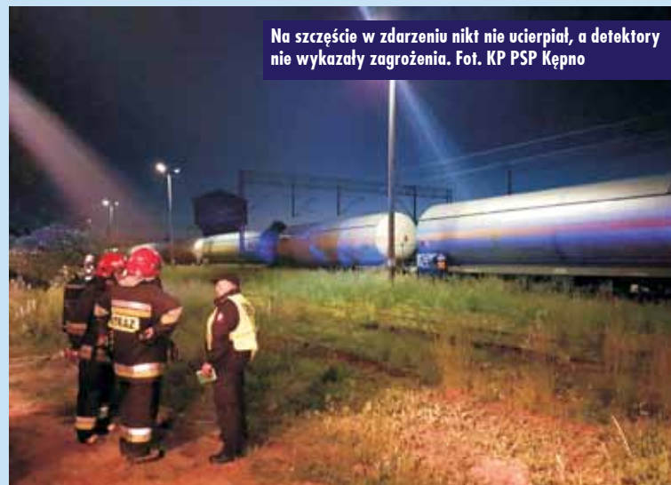
Na szczęście w zdarzeniu nikt nie ucierpiał, a detektory nie wykazały zagrożenia.

wtórnie przeprowadzono pomiary strefy wokół cysterny. Pomiary specjalistów również nie stwierdziły zagrożenia – dodaje.