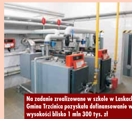
Na zadanie zrealizowane w szkole w Laskach Gmina Trzcinica pozyskała dofinansowanie w wysokości blisko 1 mln 300 tys. zł