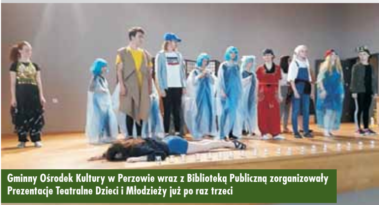
Gminny Ośrodek Kultury w Perzowie wraz z Biblioteką Publiczną zorganizowały Prezentacje Teatralne Dzieci i Młodzieży już po raz trzeci