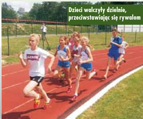
Dzieci walczyły dzielnie, przeciwstawiając się rywalom