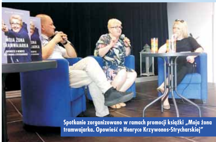
Spotkanie zorganizowano w ramach promocji książki „Moja żona tramwajarka. Opowieść o Henryce Krzywonos-Strycharskiej”

Autor skończył pisać książkę dokładnie w 31. rocznicę zawarcia małżeństwa, a jej premiera przypada