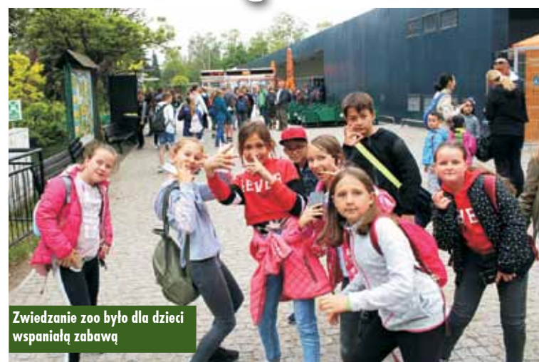
Zwiedzanie zoo było dla dzieci wspaniałą zabawą

Na koniec maja br. uczniowie klas I-VIII Szkoły Podstawowej w Świbie odwiedzili Ogród Zoologiczny we Wrocławiu. Wyprawę z okazji Dnia Dziecka sfinansowała Rada Rodziców.