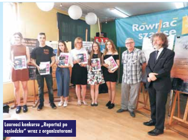
Laureaci konkursu „Reportaż po sąsiedzku” wraz z organizatorami