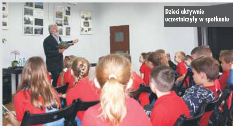
Dzieci aktywnie uczestniczyły w spotkaniu

traktować, odpowiadając na liczne zagadki, dzięki czemu spotkanie miało bardzo dynamiczny i żywiołowy charakter.