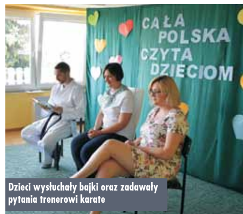
Dzieci wysłuchały bajki oraz zadawały pytania trenerowi karate