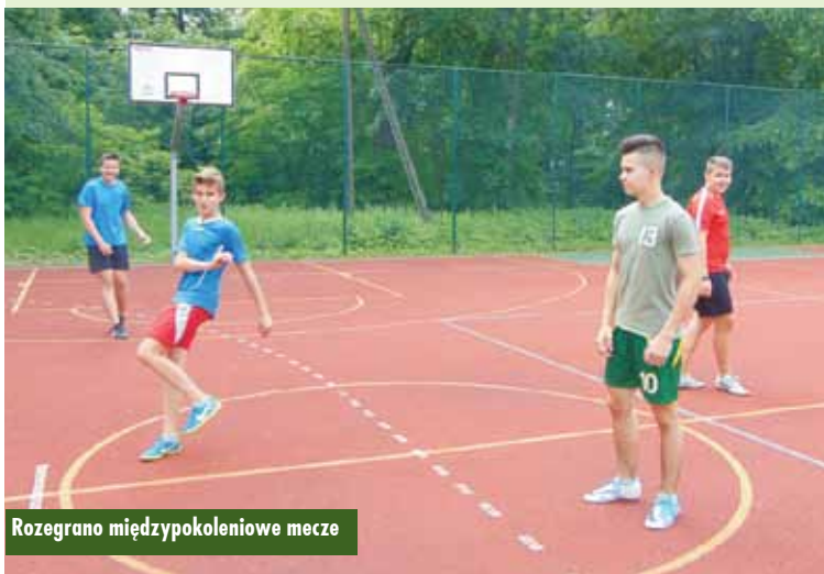
Rozegrano międzypokoleniowe mecze

Szkoły Podstawowe w Łęce Opatowskiej oraz Trzebieniu zostały zakwalifikowane do objęcia wsparciem finansowym w ramach programu „Aktywna tablica”