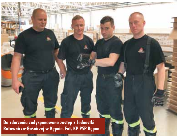
Do zdarzenia zadysponowano zastęp z Jednostki Ratowniczo-Gaśniczej w Kępnie.

W niedzielę, 2 czerwca br., około godziny 8.03, do Stanowiska Kierowania Komendanta Powiatowego Państwowej Straży Pożarnej w Kępnie wpłynęło zgłoszenie, że na terenie zakładu produkcyjnego w Donaborowie w studzience deszczowej zaklinował się mały kot. Do zdarzenia zadysponowano zastęp z Jednost-