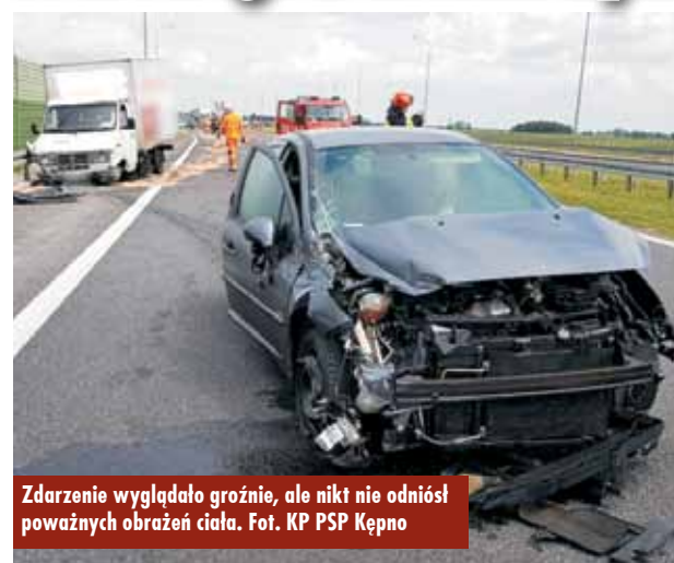
Zdarzenie wyglądało groźnie, ale nikt nie odniósł poważnych obrażeń ciała.