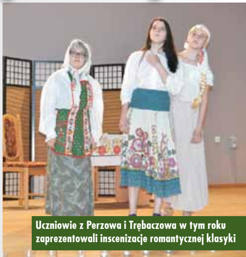
Uczniowie z Perzowa i Trębaczowa w tym roku zaprezentowali inscenizację romantycznej klasyki

Obie grupy teatralne zostały nagrodzone pamiątkowymi statuetkami oraz słodyczami.