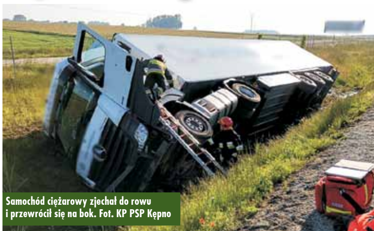
Samochód ciężarowy zjechał do rowu i przewrócił się na bok.

31 maja br., około godziny 6.34, do Stanowiska Kierowania Komendanta Powiatowej Straży Pożarnej w Kępnie wpłynęło zgłoszenie o zdarzeniu z udziałem samochodu ciężarowego marki Mercedes na 102 km trasy S8 w kierunku Wrocławia. Do zdarzenia zadysponowano zastępy z Jednostki Ratowniczo-Gaśniczej w Kępnie. - Stwierdzono, że samochód ciężarowy zjechał do rowu i przewrócił