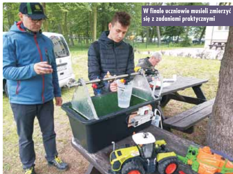
W finale uczniowie musieli zmierzyć się z zadaniami praktycznymi

Państwowa Straż Pożarna oraz m.in. Delegatura Państwowej Inspekcji Roślin i Nasiennictwa w Kaliszu. Wystartowali w nim uczniowie kierunków rolniczych szkół południowej Wielkopolski.