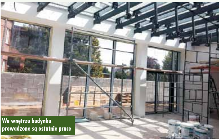
We wnętrzu budynku prowadzone są ostatnie prace

Budynek dostosowany będzie do użytkowania przez osoby o ograniczonej zdolności poruszania się z możliwością korzystania ze sprzętów rehabilitacyjnych oraz integracji osób w nim przebywających. Oprac. KR