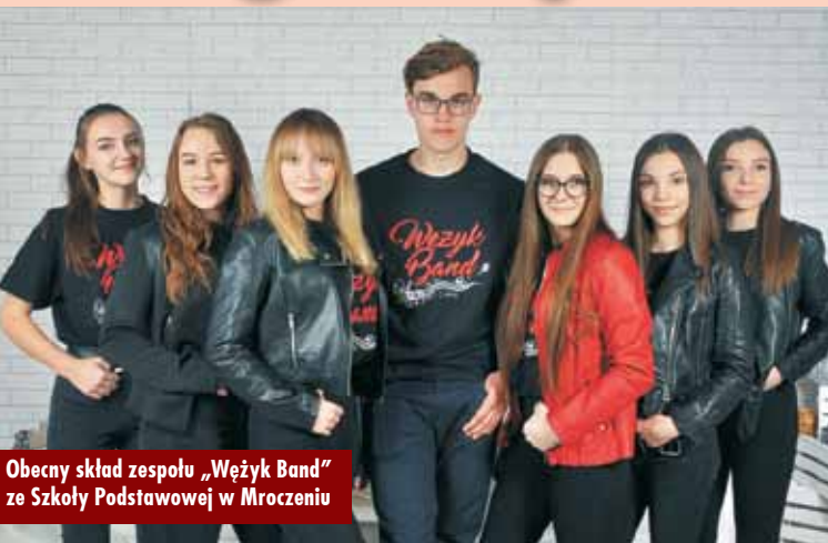
Obecny skład zespołu „Wężyk Band” ze Szkoły Podstawowej w Mroczeniu

„Kocham Wolność” – taki tytuł nosi już drugi krążek zespołu muzycznego „Wężyk Band” ze Szkoły Podstawowej w Mroczeniu. Po raz kolejny zespół zaprasza słuchaczy do odbycia wspólnej podróży przez polską muzykę pop. 11 coverów, wyselekcjonowanych w oparciu o utwory związane z 100 rocznicą Odzyskania Niepodległości, to powrót do czasów, kiedy w domach rządziły przeboje z repertuaru m.in. Chłopców z Placu Broni, Stanisława Soyki czy Obywatela G.C. Pierwszy, debiutancki krążek „Wężyk Band”, wydany został wiosną 2018 r. Zaledwie kilka miesięcy później, bo już we wrześniu 2018 r., kiedy to stary skład zespołu