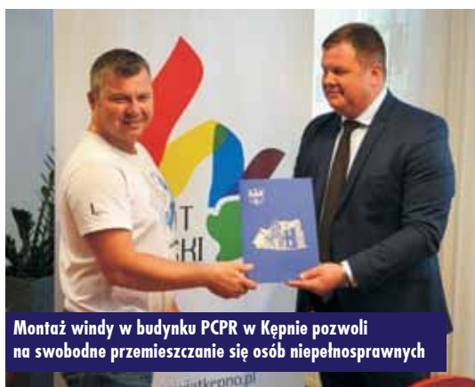
Montaż windy w budynku PCPR w Kępnie pozwoli na swobodne przemieszczanie się osób niepełnosprawnych

Realizacja najnowszej inwestycji w znacznym stopniu poprawi warun-