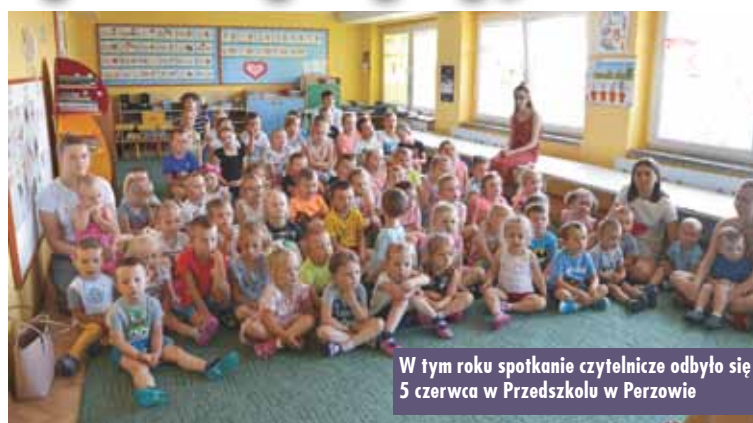
W tym roku spotkanie czytelników odbyło się 5 czerwca w Przedszkolu w Perzowie

Od 1 do 9 czerwca br. trwał XVII Ogólnopolski Tydzień Czytania Dzieciom pod hasłem „Sportowcy czytają dzieciom”. Jak co roku, Biblioteka Publiczna w Perzowie przyłączyła się do akcji, organizując spotkanie czytelników.