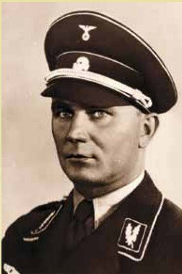
Artur Greiser namiestnik Rzeszy w Kraju Warty

wrocławską. Powiat kępiński znalazł się w rejencji łódzkiej ze stolicą w Łodzi, która przyjęła nową niemiecką nazwę Litzmannstadt. Zmianę nazw miejscowości, ulic i sztyldów bezwzględnie egzekwowano. Język niemiecki zamierzano wprowadzić do wszystkich dziedzin życia. Aby germanizacja sprawnie przebiegała powoływano na stanowiska sprawdzonych i zaufanych ludzi. Jednym z nich był Arthur Greiser , mianowany dekretem Adolfa Hitlera namiestnikiem Kraju Warty (Reichsstatthalter) czyli został jednocześnie szefem administracji państwowej i samorządowej oraz przywódcą okręgu partyjnego (Gauleiter).