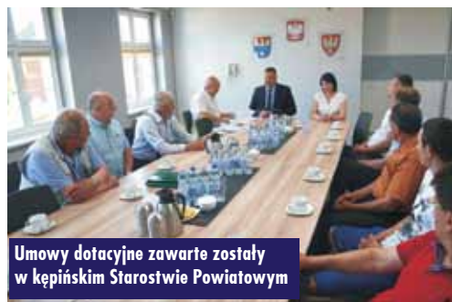
Umowy dotacyjne zawarte zostały w kępińskim Starostwie Powiatowym

zł), Trzcinicy (4.200,00 zł), a także Spółce Wodnej Doliny Rzeki Niesob (10.500,00 zł) i Spółce Drenarskiej w Baranowie (1.590,00 zł). Oprac. bem