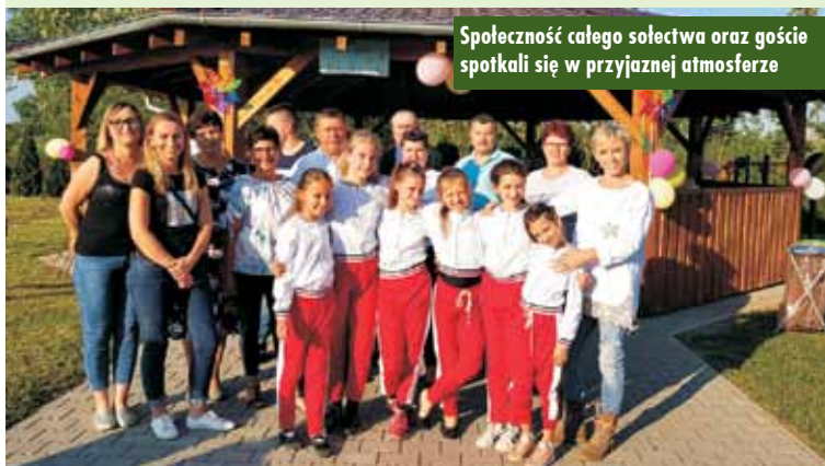
Społeczność całego sołectwa oraz goście spotkali się w przyjaznej atmosferze

Dodatkowo festyn uatrakcyjnił pokaz w wykonaniu strażaków, a policjanci znakowali rowery. - Bardzo serdecznie dziękujemy wszystkim osobom, które pomogły w organizacji festynu, a także gościom, na których zawsze możemy liczyć – podsumowali organizatorzy. Oprac. KR