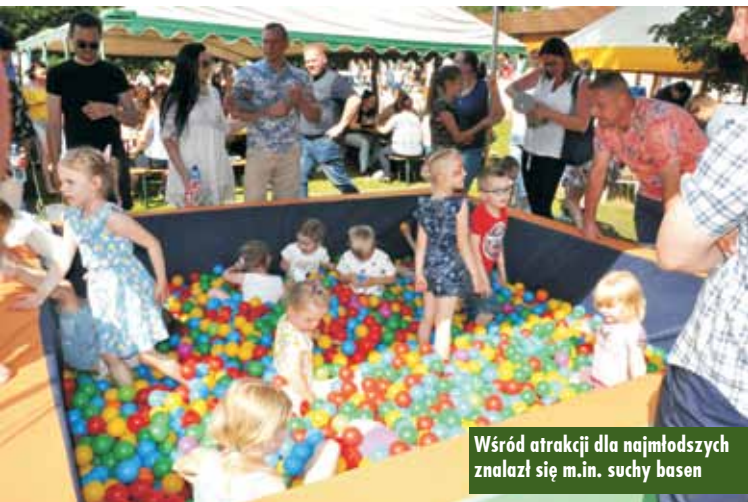
Wśród atrakcji dla najmłodszych znalazł się m.in. suchy basen