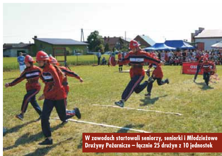
W zawodach startowali seniorzy, seniorki i Młodzieżowe Drużyny Pożarnicze – łącznie 25 drużyn z 10 jednostek

W czasie, kiedy druhowie walczyli o jak najlepszy czas i jak najmniejszą ilość punktów karnych, licznie zebrana publiczność dopinguowała jednostki ze swoich miejscowości, podziwiając sprawność strażaków, a organizatorzy zachęcali do zakosztowania swoich smakulików.