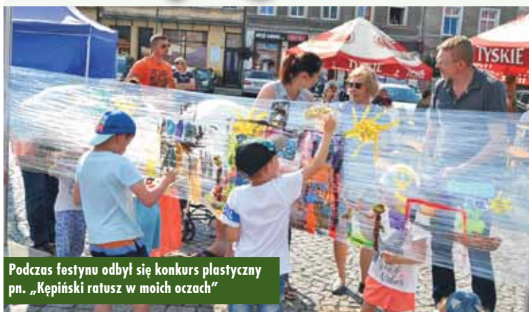
Podczas festynu odbył się konkurs plastyczny pn. „Kępiński ratusz w moich oczach”

2 czerwca br. na kępińskim Rynku odbywał się Festyn Familijny, na który całe rodziny zaprosili: burmistrz miasta i gminy Kępno oraz Kępiński Ośrodek Kultury. Oprócz życzeń z okazji Dnia Dziecka, na milusińskich i rodziców czekała masa atrakcji zaplanowanych aż do godzin wieczornych. A że pogoda dopisała, chętnych do korzystania z tych atrakcji było bardzo wielu.