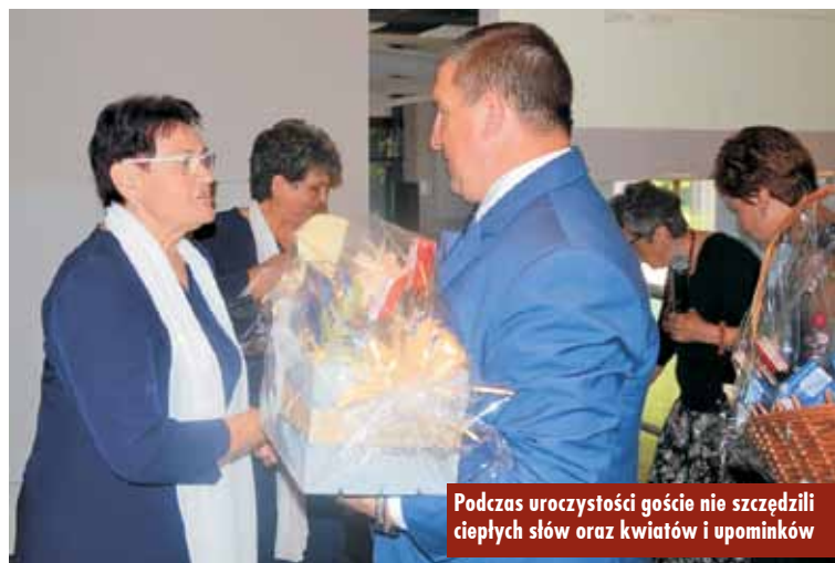
Podczas uroczystości goście nie szczędzili ciepłych słów oraz kwiatów i upominków