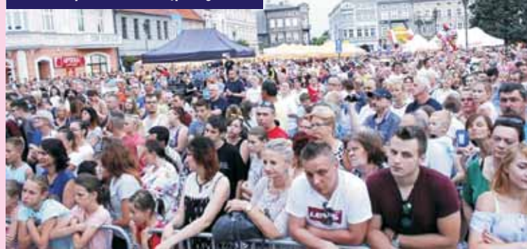
Występy na kępińskim Rynku zgromadziły rzesze tłumy mieszkańców Kępna i gości