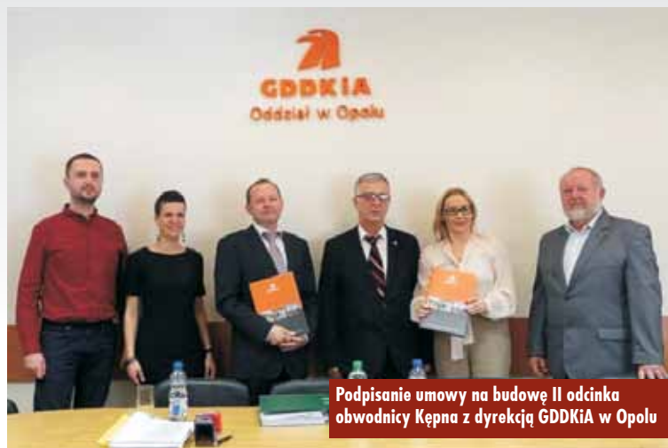
Podpisanie umowy na budowę II odcinka obwodnicy Kępna z dyrektorem GDDKiA w Opolu

ni się do rozwoju tranzytowego na poziomie krajowym, wyprowadzenia go poza obszar miasta Kępna, a także do dostosowania polskiej sieci