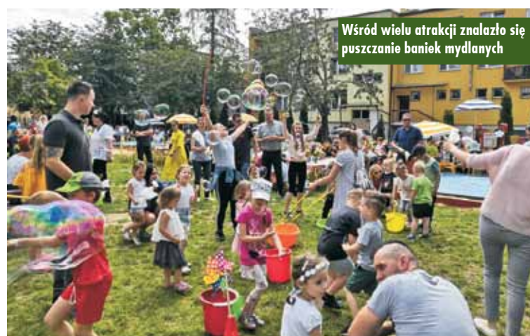
Wśród wielu atrakcji znalazło się puszczanie baniek mydlanych

Czas mile spędzony w gronie rodziny i przyjaciół z pewnością na długo pozostanie w pamięciach zarówno przedszkolaków, jak i wszystkich gości. KR