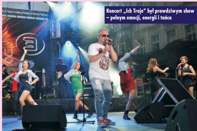
Koncert „Ich Troje” był prawdziwym show – pełnym emocji, energii i tańca