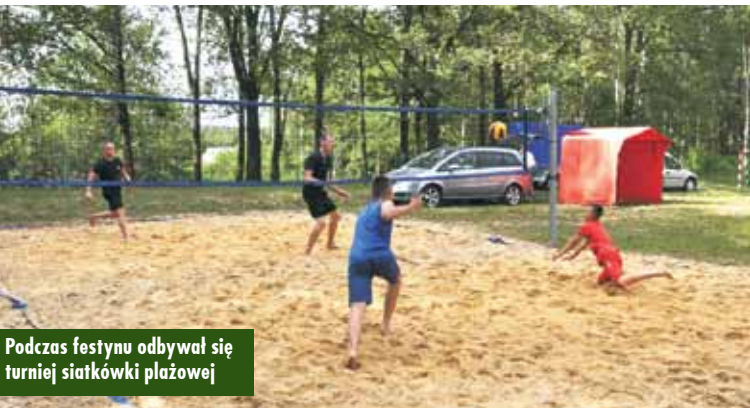
Podczas festynu odbywał się turniej siatkówki plażowej

8 czerwca br. w miejscowości Czermin odbył się II Festyn Rodzinny. Impreza spotkała się z wielkim zainteresowaniem mieszkańców sołectwa, którzy mogli korzystać z wielu atrakcji sportowych, kulinarnych i kulturalnych, wspólnie przygotowanych przez organizatorów.