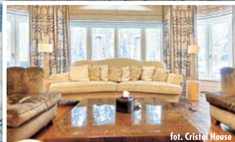
fol. Cristal House