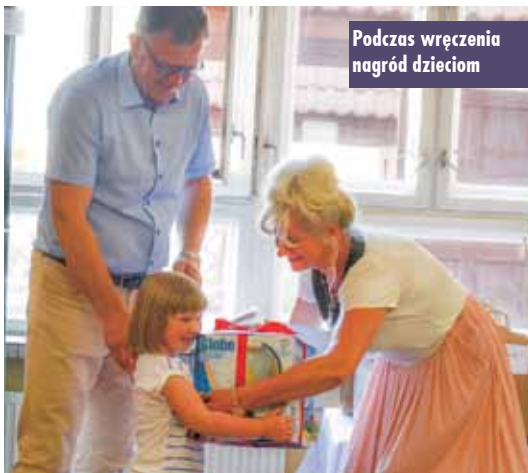
Podczas wręczenia nagród dzieciom