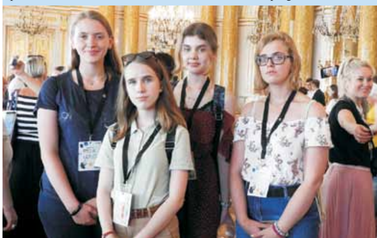
W tegorocznej, jubileuszowej imprezie uczestniczyła młodzież, biorąca udział w projekcie „Reportaż po sąsiedzku” realizowanym w Powiatowej Bibliotece Publicznej w Kępnie

W tegorocznej, jubileuszowej imprezie uczestniczyła także kępińska młodzież, biorąca udział w projekcie „Reportaż po sąsiedzku”. Projekt realizowany był w ramach programu „Młodzi w akcji – kreatywne wyzwania” w Powiatowej Bibliotece Publicznej w Kępnie od kwietnia do czerwca 2019 roku.