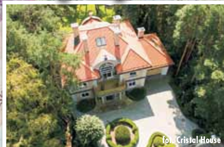
fol. Cristal House