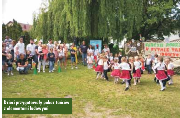
Dzieci przygotowały pokaz tańców z elementami ludowymi

Dopełnieniem imprezy były przygotowane atrakcje i zabawy – dmuchany zamek, bańki mydlane, malowanie pisakami na macie zmy-