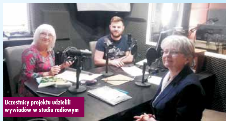
Uczestnicy projektu udzielili wywiadów w studiu radiowym

Projekt pt. „Karta żywej historii” otrzymał finansowe wsparcie w ramach otwartego konkursu ofert na realizację zadań publicznych Powiatu Kępińskiego w 2019 r. bem