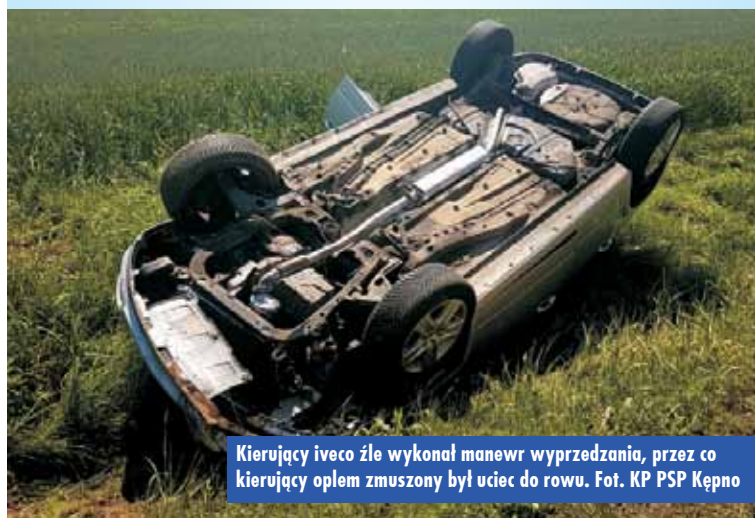
Kierujący iveco źle wykonał manewr wyprzedzania, przez co kierujący opelam zmuszony był uciec do rowu.

Funkcjonariusze Komendy Powiatowej Policji w Kępnie, którzy udali się na miejsce zdarzenia, ustalili, że kierujący iveco, 21-letni mieszkaniec gminy Rychtal, podejmując manewr wyprzedzania, nie upewnił