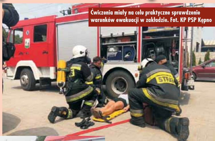
Ćwiczenia miały na celu praktyczne sprawdzenie warunków ewakuacji w zakładzie.

13 czerwca br. na terenie jednego z zakładów produkcyjnych w Bralinie odbyły się ćwiczenia jednostek ochrony przeciwpożarowej z terenu powiatu kępińskiego. - Sce-nariusz ćwiczeń zakładał, że w pomieszczeniach socjalnych zakładu (stolówce) doszło do pożaru. Po przeprowadzeniu ewakuacji osoba odpowiedzialna stwierdziła, że dwóch pracowników nie stawiało się w wyznaczonym miejscu zbiórki. Informacja ta została przekazana do kierującego działaniami ratowniczymi. Strażacy przeszukali zadymione pomieszczenia i ewakuowali w miejsce