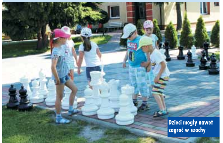
Dzieci mogły nawet zagrać w szachy

konno, pływały łódką, a nawet udały się na przejażdżkę po okolicy wozem taborowym. W przerwach między kolejnymi atrakcjami korzystały ze wspaniale urządzonego placu zabaw.