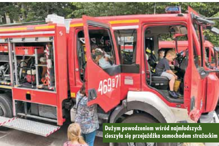
Dużym powodzeniem wśród najmłodszych cieszyła się przejażdżka samochodem strażackim