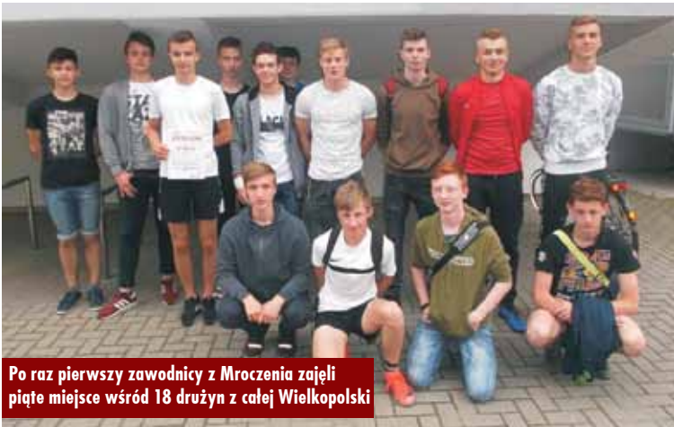
Po raz pierwszy zawodnicy z Mroczenia zajęli piąte miejsce wśród 18 drużyn z całej Wielkopolski

XX Jubileuszowe Mistrzostwa Polski Radnych i Pracowników Samorządowych