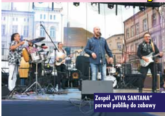
Zespół „VIVA SANTANA” porwał publikę do zabawy