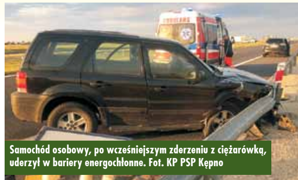
Samochód osobowy, po wcześniejszym zderzeniu z ciężarówką, uderzył w bariery energochłonne.

Warszawy. - Działania strażaków polegały na zabezpieczeniu miejsca zdarzenia, udzieleniu kwalifikowanej pierwszej pomocy osobom poszkodowanym, sorpcji rozlanych płynów eksploatacyjnych oraz odłączeniu zasilania w samochodzie osobowym. Z uszkodzonego zbiornika paliwa samochodu ciężarowego przepompowano olej napędowy do pojemników zastępczych. Po zakończeniu czynności prowadzonych przez policję udrożniono ruch na trasie