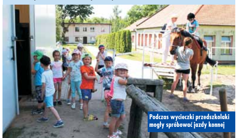
Podczas wycieczki przedszkolaki mogły spróbować jazdy konnej