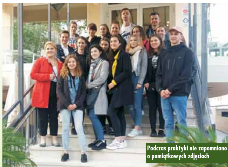
Podczas praktyki nie zapomniano o pamiątkowych zdjęciach

Podczas pobytu we Włoszech uczniowie nie tylko doskonalili swoje umiejętności językowe i zawodowe, ale także rozwijali europejską świadomość kulturową, budowali relacje i nabywali nowe kompetencje interpersonalne. Rozwijali ponadto umiejętność adaptowania się do warunków życia i pracy w różnych krajach europejskich.